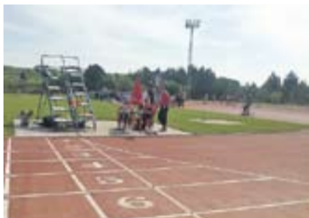
Preparats... Autor: Jordi Niñerola