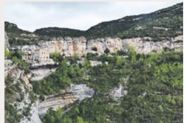
VISTES DE SANT MIQUEL DEL FAI Òscar Moreno