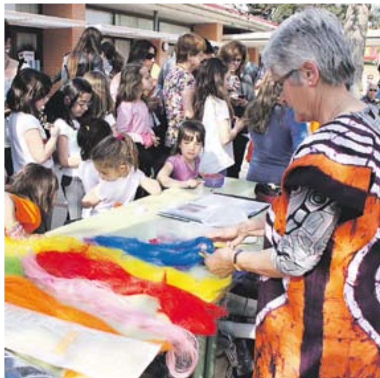
Taller de trenes africanes a la cloenda de la Setmana Cultural del Mestre Pla

A banda del tast d'artesanía, els pares i mares van participar a un dels tallers que ja havien fet els seus fills i filles durant la setmana, el de percussió i dansa. El grup Inuwali Ki Fany va ser l'encarregat de fer moure els adults,