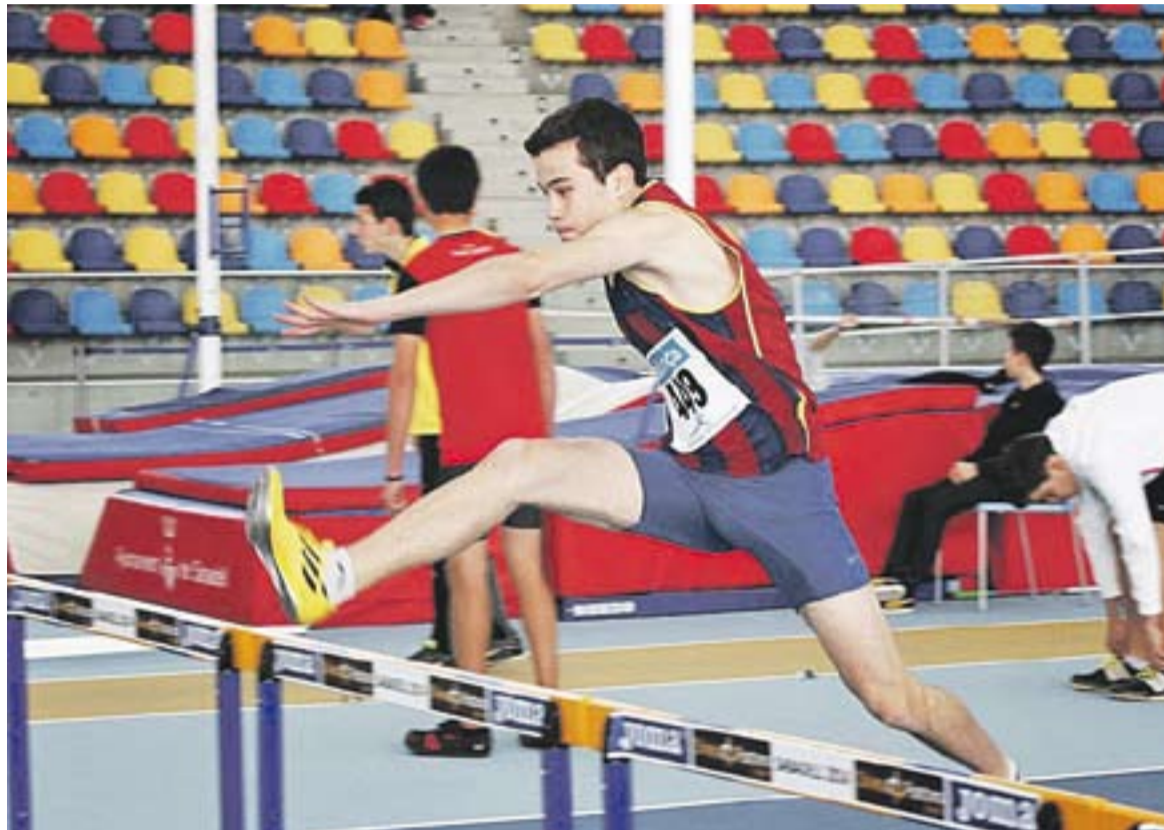
© Guillem Garcia, durant una de les competicions disputades aquest hivern a la pista coberta de Sabadell.

Sempre m'han agradat més les curses curtes o, fins i tot, els