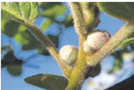
Els kiwis van creixent Autora: Carme Padrisa

Envia'ns fotos fetes amb el mòbil: lactual@castellarvalles.cat