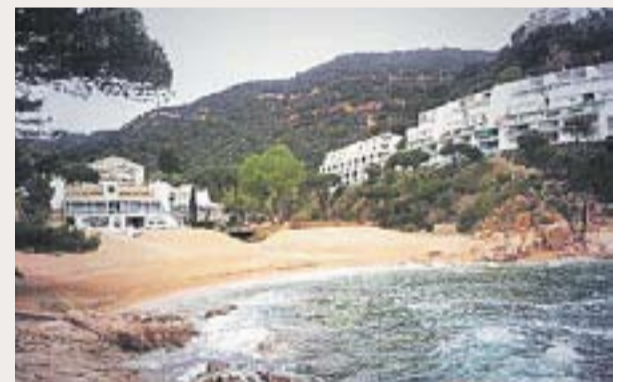
LA PLATJA DE SANT FELIU DE GUÍXOLS