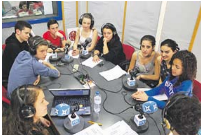
Una emissió del magazín 'Dotze' amb alumnes de l'institut.

Occidental VIII de Castellar i permetrà gaudir el 30 d'abril d'un programa radiofònic en directe de més de dues hores de durada amb continguts creats i produïts pels estudiants. Els cursos passats, amb la col·laboració de Ràdio Castellar, el Centre de Recursos Pedagògics va fer un primer seminari adreçat a mestres i professors que fan servir la ràdio com a eina pedagògica als seus centres. Aquest curs, s'ha fet una segona edició d'aquest seminari que va posar a treballar en equip l'institut Castellar i les escoles El Sol i la Lluna i Josep Gras per materialitzar els ensenyaments que reben nois i noies en un producte que gaudirà dels mitjans professionals de Ràdio Castellar per a la seva realització. ➔