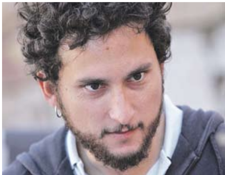
© Hammudi Al-Rahmoun, director de la pel·lícula 'Otel-lo'. || CEDIDA

Va néixer a Barcelona al 1979. De pare sirian i mare catalana, va viure la infantesa entre Barcelona i Aràbia Saudita. És professor de l'ES-CAC. Després d'una formació fonamentada en el petit format (curtmetratges) ara ha debutat amb el llargmetratge 'Otel-lo', una pel·lícula que es pot veure aquest divendres a les 21 hores a la Sala d'Actes d'El Mirador de Castellar.