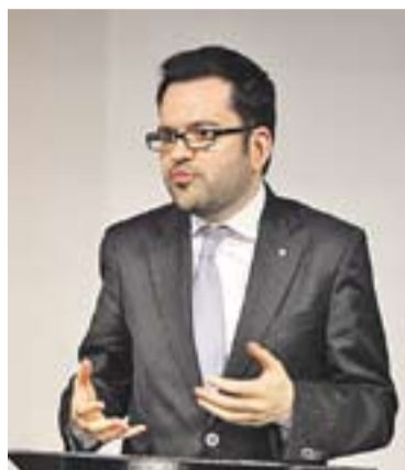
© R. Albiniana, el passat 15 d'abril. || R.G.

El procés sobiranista passat pel sedàs europeu va centrar bona part de la xerrada d'Albiniana. El diplomàtic va reconèixer que la ciutadania catalana viu immersa en la desafecció a la política, però que ha posat en marxa un procés per canviar les relacions amb Espanya “que passa per decidir sense coaccions”. Albiniana va apuntar que les eleccions al Parlament Europeu són “una oportuni-