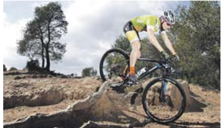
© Carlos Hidalgo, durant un dels seus entrenaments prop de Castellar. || CEDIDA