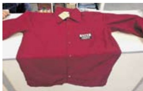
© A l'esquerra, la camiseta color bordeus. A la dreta, els Capgirats en una actuació a Caldes de Montbui al mes de novembre de 2013. || FOTOS: CEDIDES

Els Capgirats compten, actualment, amb 120 membres, "tot i que cada dia se'ns apunta gent nova i que volem créixer fins a les 140-150 persones" , apunta Casajuana. Ja han rebut diverses ofertes per fer actuacions a fora. ➔