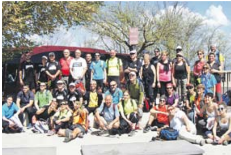
Alguns dels excursionistes després de pujar a Montserrat.

I realment tots els participants van rebre aquesta benedicció perquè tots van arribar a bon port a l'esplanada de Montserrat després de completar els 33 quilòmetres que hi ha entre Castellar i la muntanya. La bonança climatològica també va contribuir al bon desenvolupament d'aquesta ruta per camins de muntanya. "Tothom va arribar a temps i l'autocar que