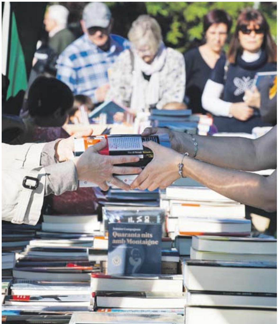
La plaça d'El Mirador es va omplir de centenars de castellarencs durant tota la jornada de dimecres, sobretot a la tarda.