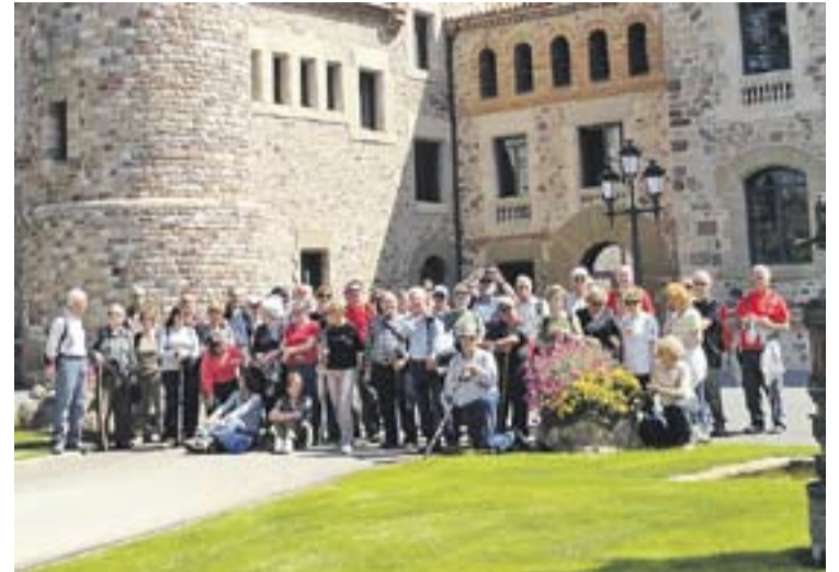
© Els participants a la sortida al pati de la Torre Marimon. || J. PUJALS