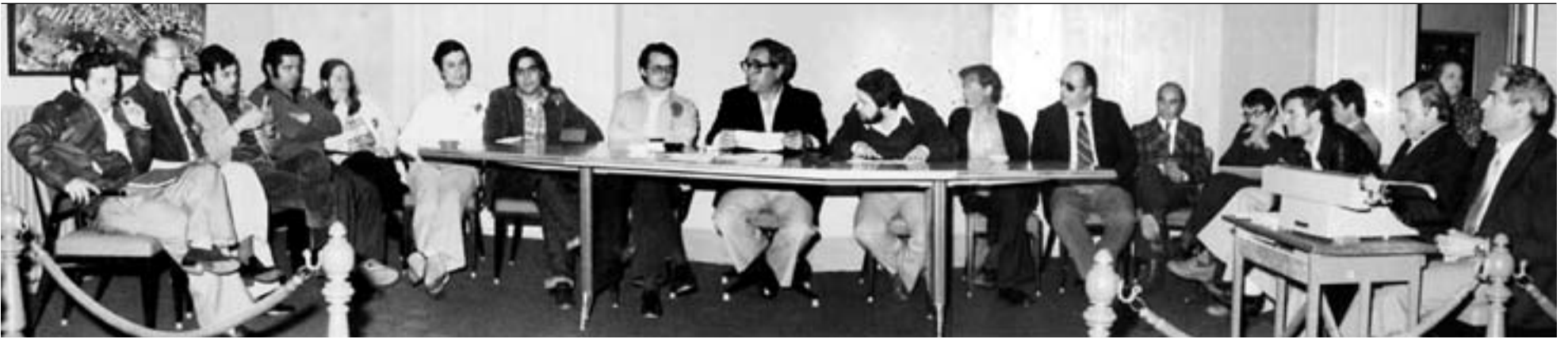
Constitució del primer consistori democràtic, celebrada el 19 d'abril de 1979 a la sala de plens de l'antic Ajuntament.