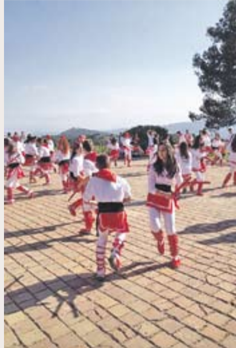
CARAMELLES A SÚRIA @lluifab