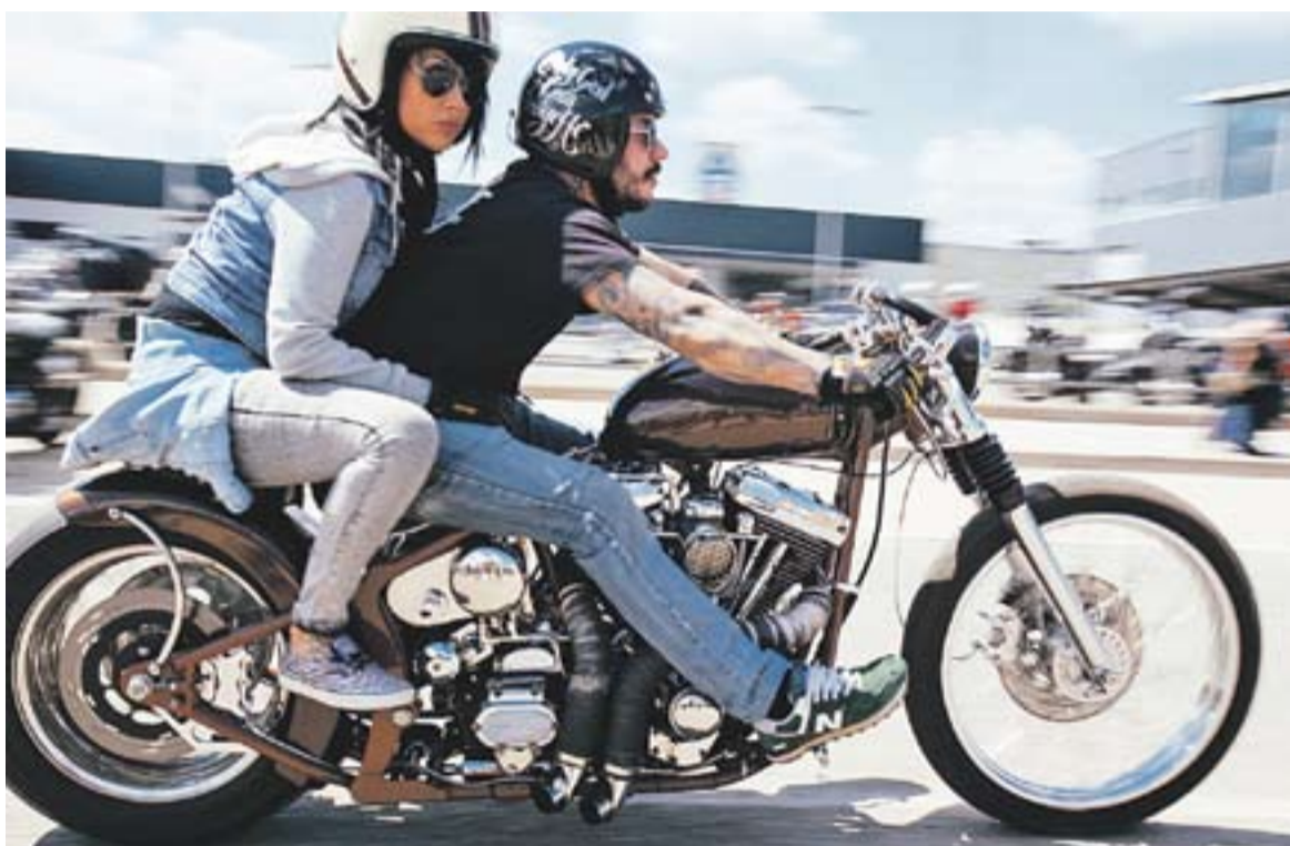
Dues instantànies del darrer Speedfest: a dalt una parella en un cotxe custom i, a baix, dos participants en motocicleta.