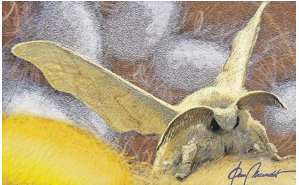
© Metamorfosi A. || JOAN MUNDET

Amb una mica de sort podrem observar l'increïble espectacle d'una papallona o una arna arrossegant-se des de la seva crisàlida