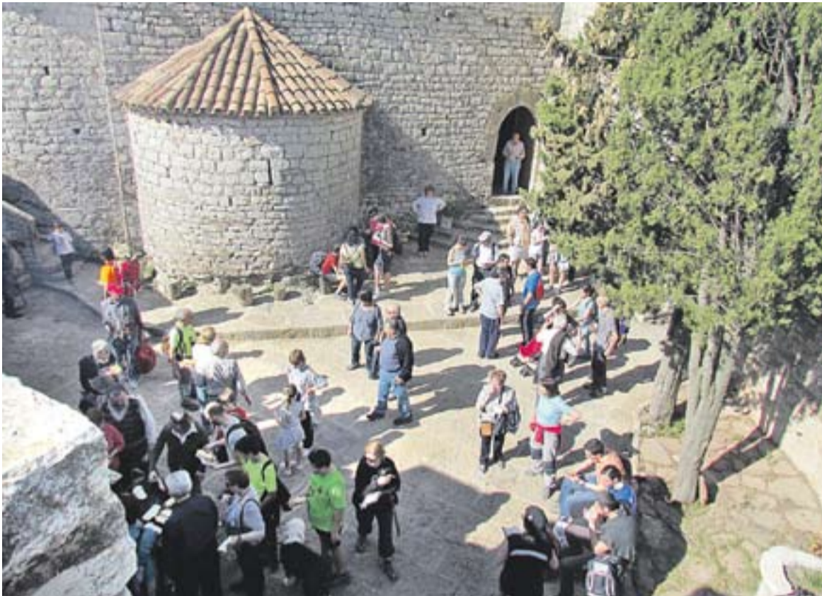
Pati interior de l'ermita del Puig de la Creu, divendres passat.