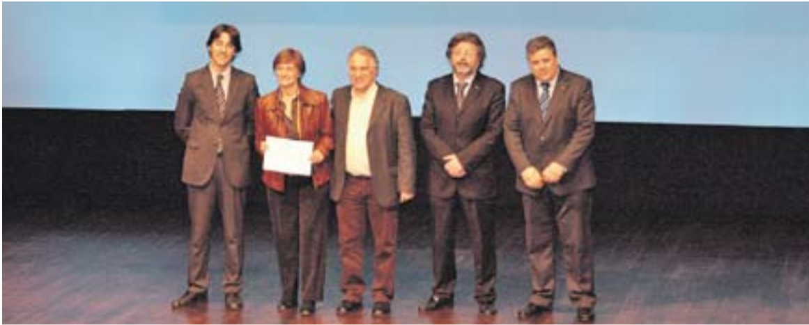
Els professors de l'INS Castellar, dissabte passat, recollint el premi