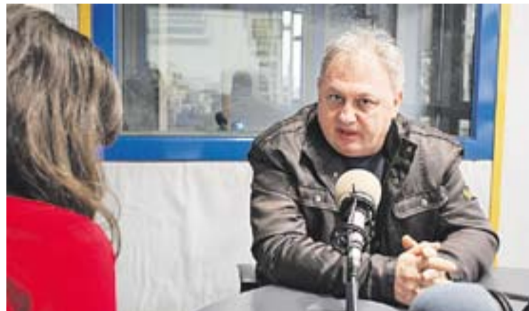
© Salvador Rodríguez als estudis de Ràdio Castellar || Y. CALVO