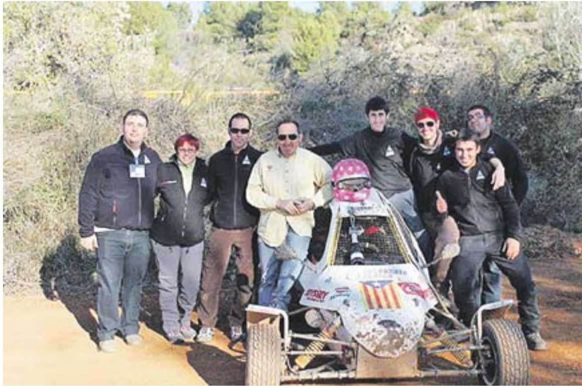
© Els membres actuals de l'Escuderia T3. || CEDIDA

“Els circuits eren de caire provisional, sent el primer prop de l'actual camp de futbol, el Pepín Valls i un altre al polígon, un altre a les actuals pistes d'atletisme. Circuits que es feien i es