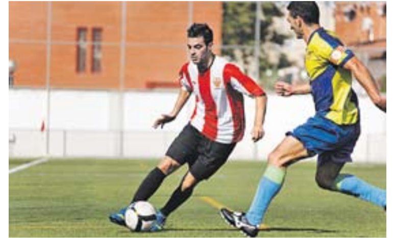
© Cristian Garcia, en una acció contra el Sabadell Nord. || Q. PASCUAL