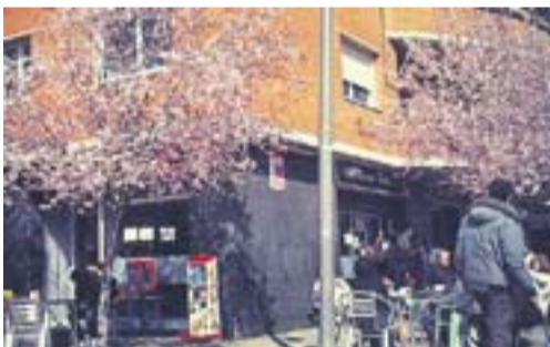
Primavera Autora: Carme Vidal

Envia'ns fotos fetes amb el mòbil: lactual@castellarvalles.cat