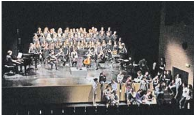
Moment del concert 'Són al teu camí' d'El Cor de la Nit.