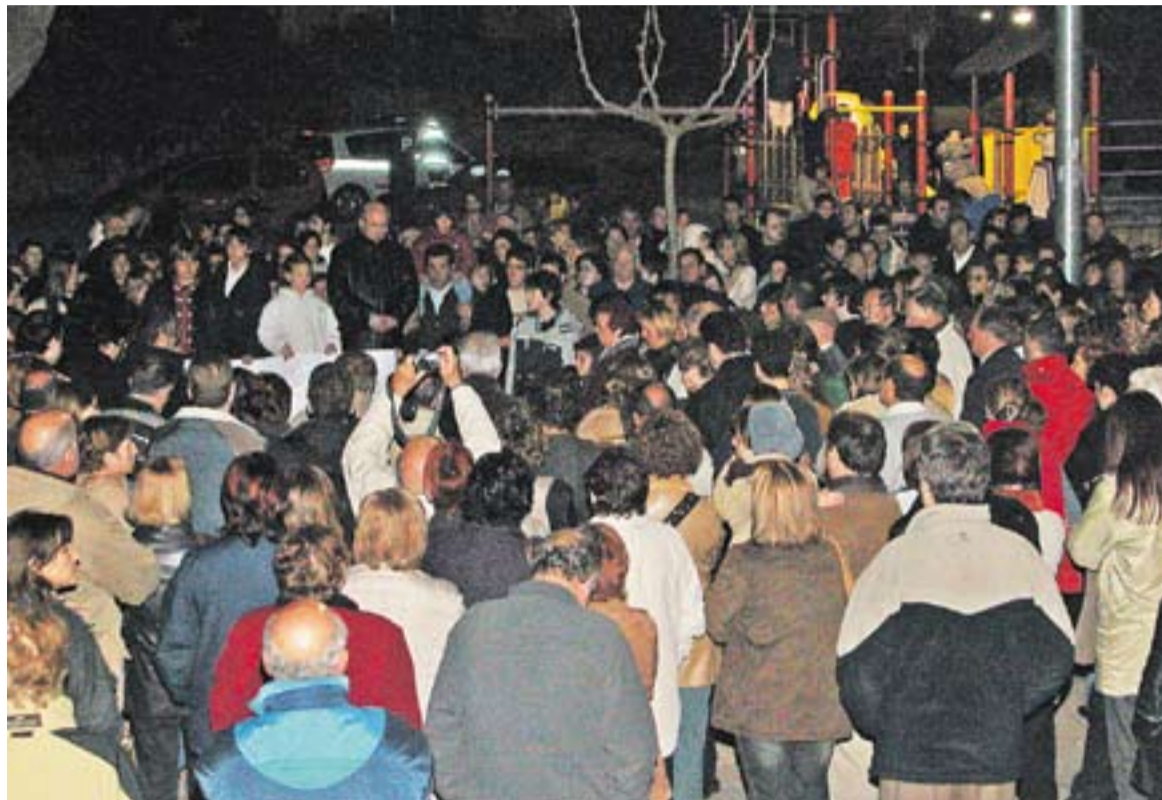
Divendres 12 de març de 2004, unes 500 persones es van concentrar espontàniament a la plaça Major.