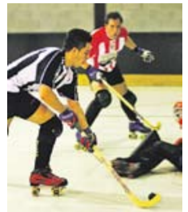
© Victor Bonilla. || Q. PASCUAL