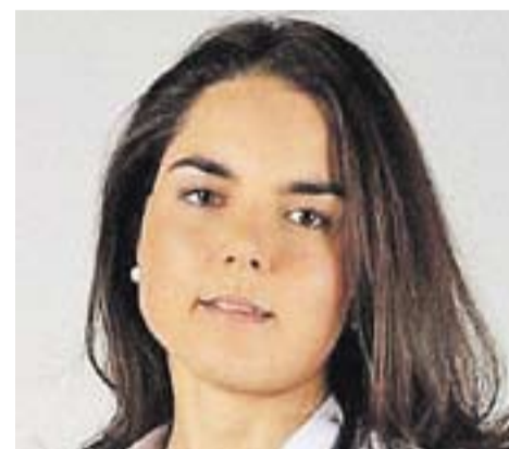
© Paula Fontseca, coautores del llibre. || CEDIDA