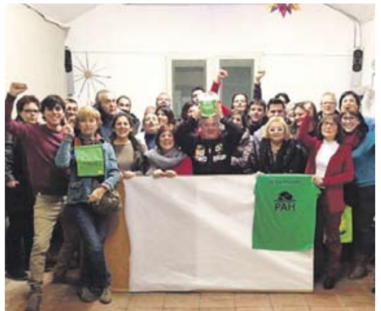
La PAH Castellar, en una imatge d'arxiu, al seu punt de reunió: Cal Gorina.

Malauradament, molts bancs de l'estat continuen duent a terme desnonaments, i comprant els pisos d'aquests desnonaments en subhastes, per un 50% del preu de l'última taxació, emparats en una llei hipotecària de principis del segle passat. "Som l'únic país d'Europa que no fa dació en pagament. Fins i tot EUA ho practica, amb el sistema de la segona oportunitat. Molts ciutadans es queden sense casa, però continuen pagant un deute personal que no prescriu mai. El deute passa als teus hereus. És un sistema pervers" , reconeix Pérez. +