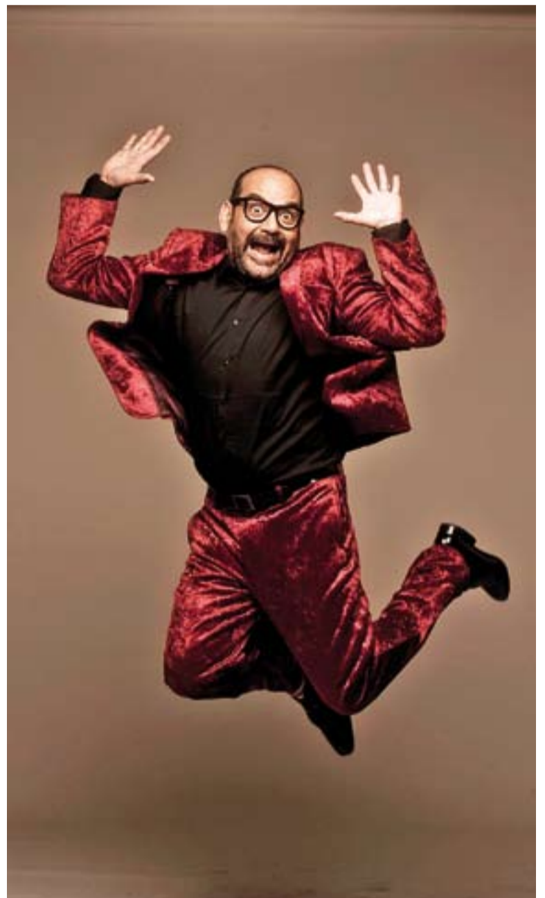
'Corbacho 5G' es presenta dimecres, dia de Sant Josep, a les 19 h.

Ho compagino, sí. Com que l'obra la faig, sobretot, durant els caps de setmana, entre setmana continuo fent coses a la televisió. Ara estem preparant un nou programa a Tele5 on tornaré a fer de jurat. Aquest cop, amb Mira quien salta . M'han dit que un dels que saltarà és Sandro Rey! També estic preparant un espectacle amb el grup Estopa. Sóc 'pluriempleat', vaja, he, he, he! +