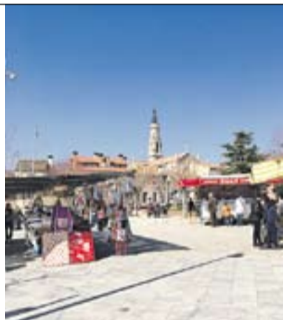
Església i mercaders Autor: Àngel Pastor