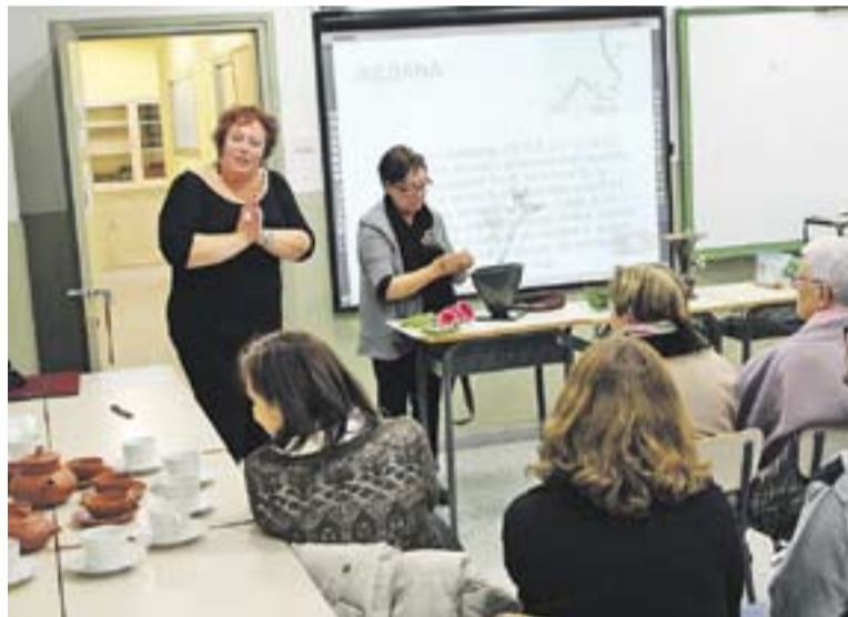
La sessió literària amb lectures de Haikus i Ikebana a l'Escola d'Adults.