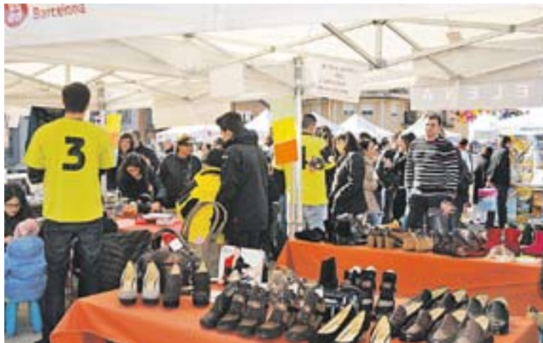
© Una imatge de la passada edició de la Fira.