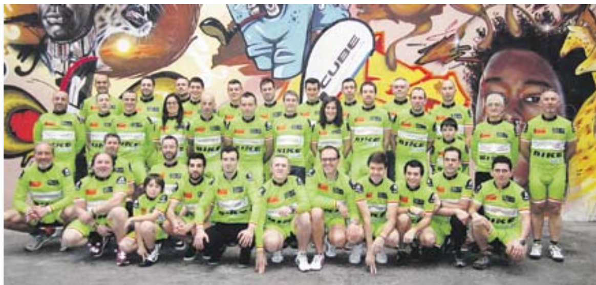
Imatge de diversos dels ciclistes del Bike Tolrà, vestits amb l'equipament per a la temporada que tot just comença.

La Titan Desert o l'Andalucía Bike Race, entre els reptes dels seus corredors