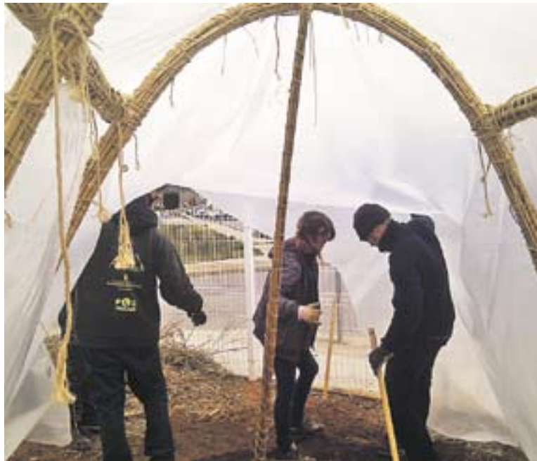
Tasques de construcció de l'hivernacle.

El procés es va dur a terme des del principi: van recollir les canyes (arundo donax, espècie invasora) i es van transportar fins al centre, es van netejar i va començar la construcció de l'estructura amb els replantejos, els fonaments, les bigues, els arcs, la instal·lació, fins al final amb la col·locació del plàstic. Segons expliquen els alumnes, ha estat un treball costós i enriquidor, basat en la feina en equip i el treball cooperatiu, i molt enriquidor conèixer aquest tipus de tècniques de construcció basades en criteris de sostenibilitat. El professorat també valora molt positivament obrir el camp de la bioconstrucció a aquest perfil d'alumnes ja que el fet de treballar amb material molt barat (gra-