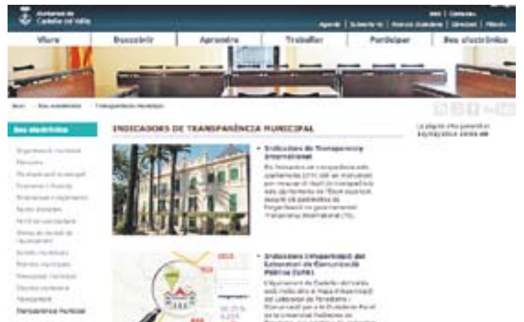
© Pantalla que dona accés als indicadors de transparència de www.castellarvalles.cat