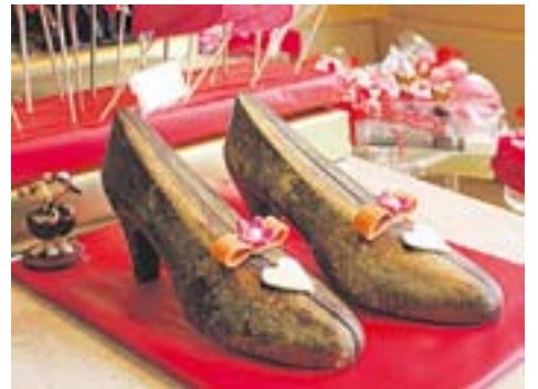
Piruletes i sabates de xocolata del Muntada.