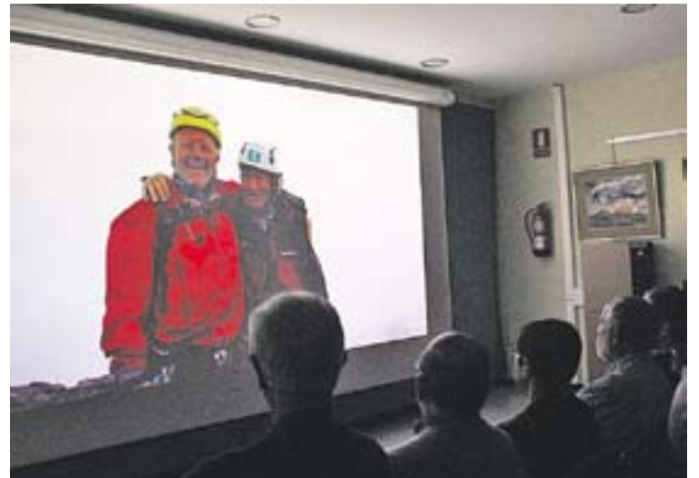
Joan Clofent, a l'esquerra, amb un xerpa local.

Clofent va dir que "jo he superat les pors amb els 7 cims, però cadascú ha de buscar els seus 7 cims, no cal que siguin alpinistes". El llibre, va afegir, potser podrà ajudar altres malalts de càncer. ✦