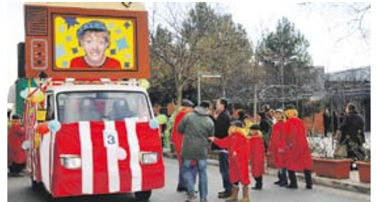
Moment de la Rua de Carnaval de 2013.