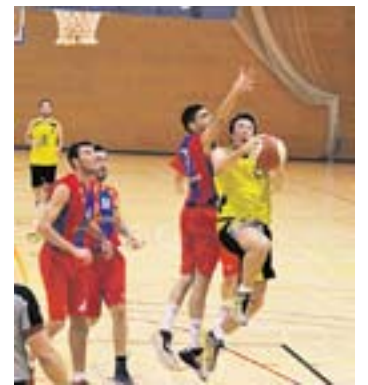
© Norbert Caldera, entrant. || M. CORNET