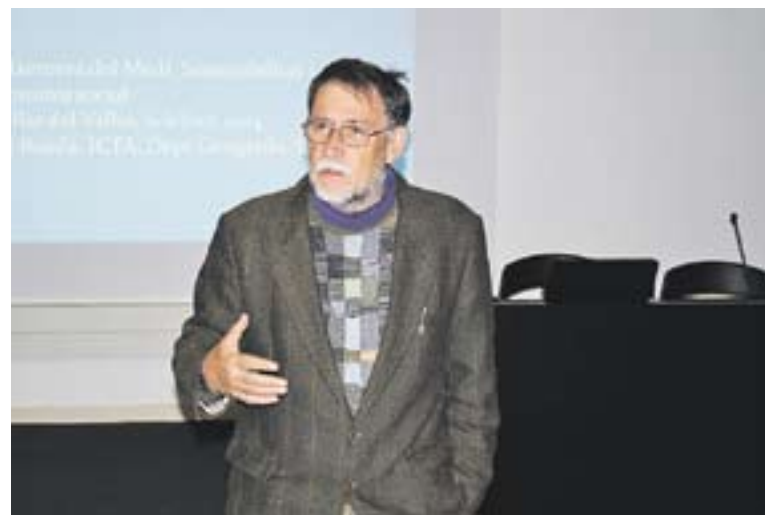
Martí Boada en un moment de la xerrada que va fer dijous passat.

Pel que fa a la descoberta de la natura, el geògraf va asse-