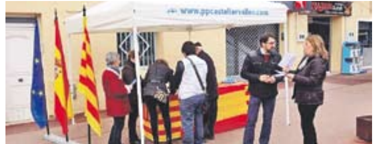
© Carpa informativa instal·lada dissabte passat davant del Mercat. || CEDIDA