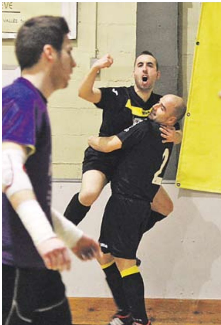
© Els jugadors de l'Athletic 04 celebren un dels cinc gols de dissabte.