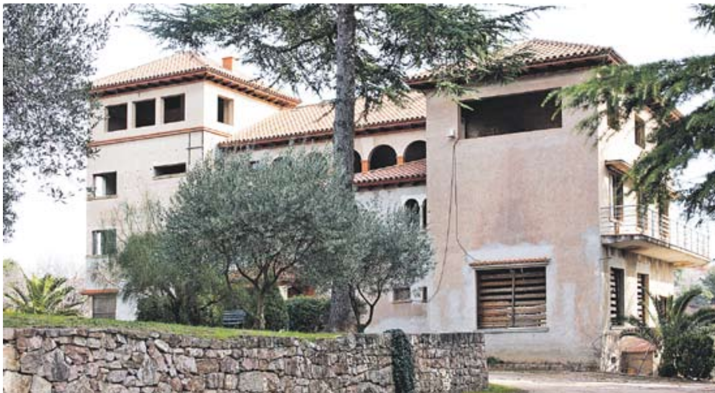
① L'edifici del Ranxo a l'actualitat amb algunes de les reformes que ha fet la propietària

Al sostre és on es va començar a actuar primer ja que es va fer tot de nou i després es va reformar la piscina, escurçant-ne la fondària. "Vam anar fent poc a poc, veníem a passar-nos-ho bé i a gaudir del que aconseguíem" , apunta la propietària del Ranxo. Es