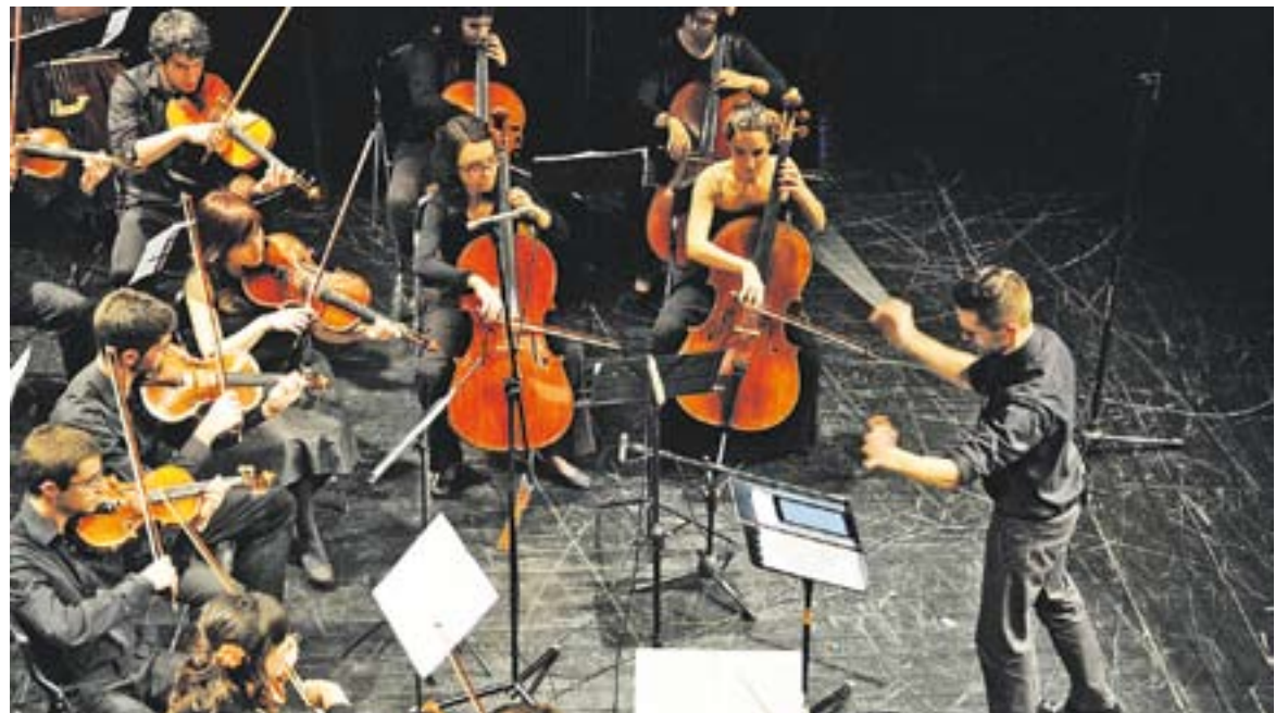
© Moment del concert de bandes sonores que Orquest:art va oferir el 2013 al BRAM!. || ARXIU

Orquest:art ha buscat un repertori variat per poder arribar a tot tipus de públic, "entenent que un concert dins un festival com el BRAM! ha d'intentar arribar a on arriba el cinema". +