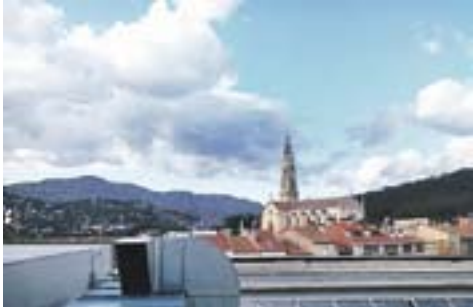
Castellar des d'El Mirador Autor: Óscar Moreno

Envia'ns fotos fetes amb el mòbil: lactual@castellarvalles.cat