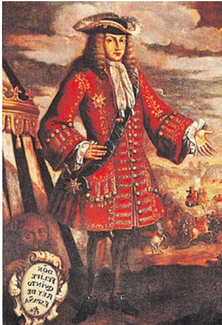
Conegut retrat de Felip V del museu municipal de l'Almodí de Xàtiva