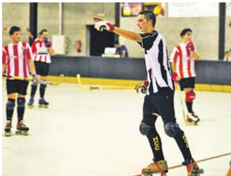
© Xavi Blanco, tot celebrant un gol de l'Hoquei Club Castellar. || Q. PASCUAL

Amb aquest resultat, el Castellar és vuitè amb 30 punts, dos menys que el setè, el Cardedeu, i dos més que el novè, el Taradell. Tot i això, la notícia més positiva és que els homes de David Pirri ja sumen set partits consecutius sense perdre: quatre victòries i tres empats. El pròxim partit del conjunt castellarenc, al Pepín Valls, serà contra l'OAR Vic, que com el rival del passat cap de setmana està incrustat en la zona perillosa. En el partit de la primera volta, els osonencs van aconseguir sorprendre els blanc-i-vermells (3-2). +