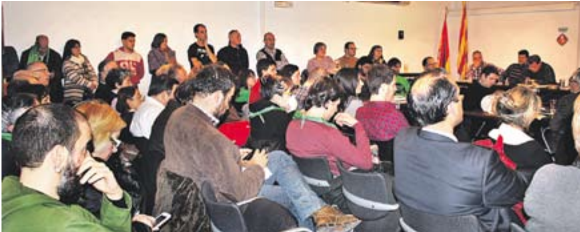
© Imatge del darrer ple de gener amb les butaques de Ca l'Alberola plenes. || C.DOMENE

Finalitza un procés de quatre mesos per definir la participació ciutadana que s'ha traduït en una ordenança que es portarà al ple del mes de febrer