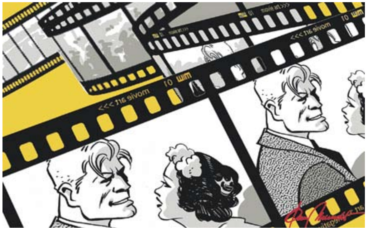
© BRAM! Pictures. || JOAN MUNDET

El 2014 tenim 21 actes repartits en nou dies. És per això que ens sentim especialment orgullosos amb aquesta edició