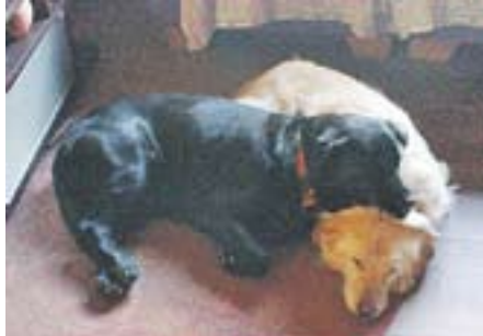
Quina migdiada, oi? Autor: Abraham Egea