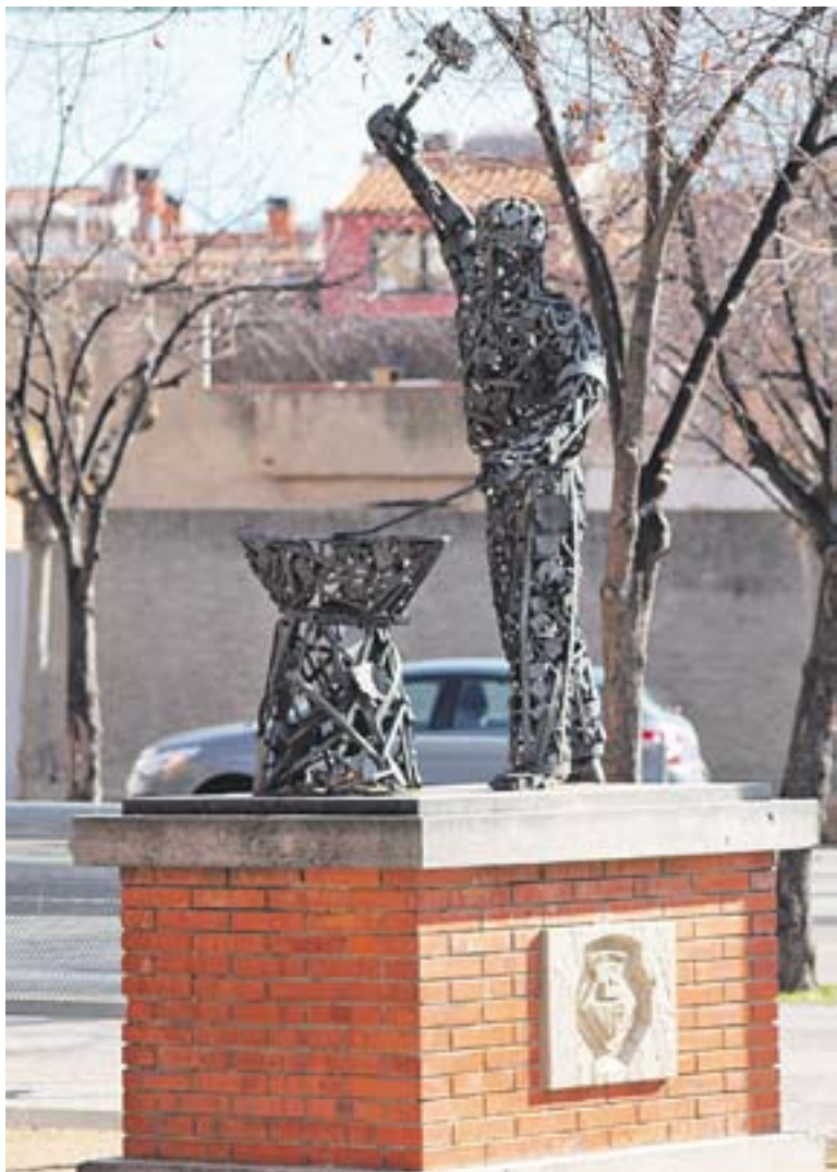
Detall i imatge sencera de l'escultura del Forjador.

Aquesta escultura s'inspira en un forjador que pica el ferro sobre l'enclusa, feta a base de diferents elements de ferro soldats, fins a construir una figura corpòria. És una creació de la ja desapareguda Escola Industrial que la Fàbrica Tolrà va tenir en funcionament durant una temporada als baixos de les Germanes Dominiques. Va ser construïda pels alumnes de l'antiga escola de formació professional durant el curs 1976-1977, però no per homenatjar ningú. L'empresa Tolrà la va patrocinar. Anys més tard, es va emplaçar l'escultura a la plaça que va ser batejada com a plaça del Forjador, a la carretera de Sabadell a Castellar, cantonada amb el carrer del Doctor Vergés. Actualment, segueix allí.