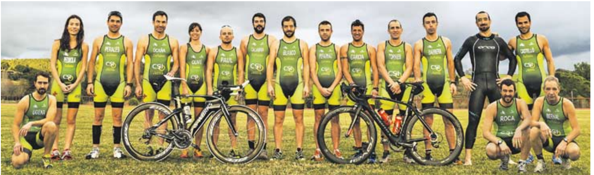
Els atletes del Triatlètic, junts, amb la primera equipació oficial de la secció, amb el qual debutaran aquest cap de setmana a la Duatló per equips del Prat en la distància esprint.