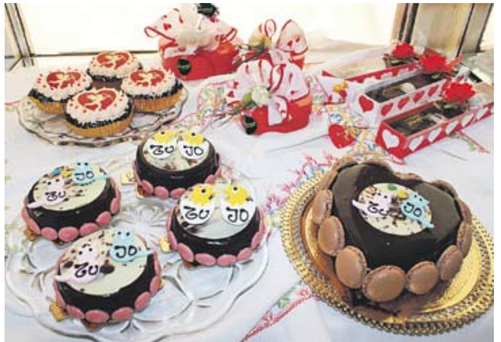
Pastissos de Sant Valentí de la pastisseria Andreví.

Des de la pastisseria Muntada asseguren que els altres anys les vendes han funcionat molt bé, la gent s'hi anima, "a veure com va aquest any". Per la seva experiència opinen que és una festa que ha anat a més amb els anys. "Normalment aquest detalllet es fa més per Sant Jordi, però com ara hi ha gent de tot arreu, doncs n'hi ha que ho fan per Sant Valentí". La Pastisseria Muntada també ofereix pastissos en forma de cor en tres gustos, de nata i xocolata, de full amb maduixa i de nata i rovell d'ou. A més, es poden comprar piruletes de xocolata de maduixa amb forma de cor, "les compren la gent més jove", i la novetat d'enguany, "un cor fet de xocolata que dins porta uns quants bombons. És com si fos una caixa, però comestible". Com a detall, també funcionen molt bé les