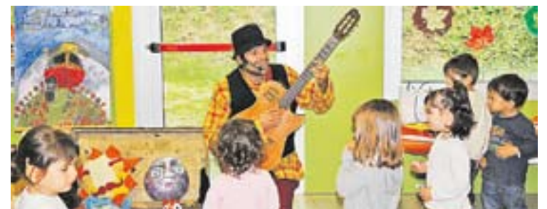
© Jaume Ibars durant una actuació a una llar d'infants castellarenca. || ARXIU

Aquest és un espectacle que ja ha visitat la biblioteca i farà vibrar a tota la família i tu en seràs el protagonista. +