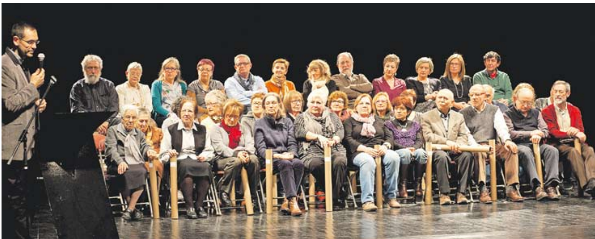
Foto de família dels mestres i professors homenatjats el passat dimecres a l'auditori Miquel Pont.