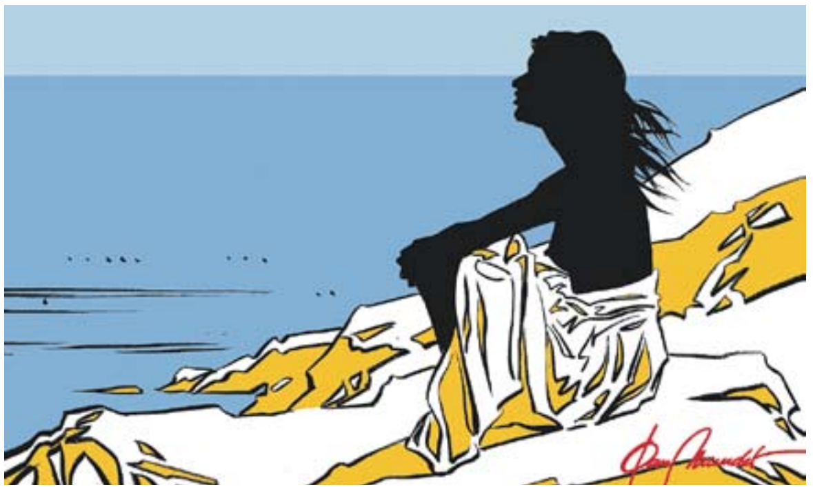
© Sense títol 4102. || JOAN MUNDET

a la vida, i l'educació sexual forma part d'aquesta educació integral. Primer de tot cal denunciar la manca de programes educatius destinats realment a la prevenció de l'embaràs. Programes que haurien de tenir una mirada ample; haurien d'estar dissenyats conjuntament per psicòlegs, educadors de carrer, pares i mares, mestres, metges, assistents socials, joves adolescents, criminòlegs, advocats... Haurien de formar part del currículum escolar des del primer cicle de primària perquè no tots els pares eduquen sexualment els fills, i la qüestió ens afecta a tots. El que ara es fa és insuficient. Això no és una crítica als mestres ni als professionals sanitaris, és una crítica a les famílies, que poden i no eduquen, i als partits polítics, que no escolten ni la veu del poble ni la de molts dels seus propis militants.