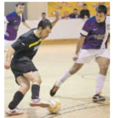
© L'Athletic, en acció. || Q. PASCUAL