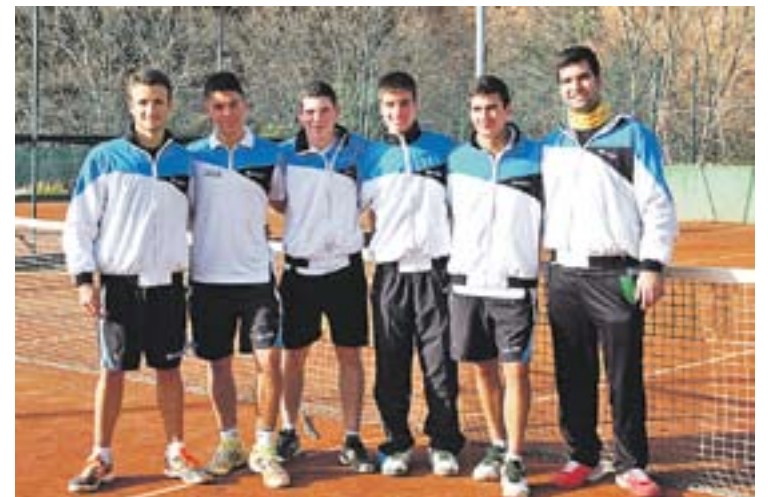
© Els jugadors del Club Tennis Castellar que han pujat de categoria. || CEDIDA