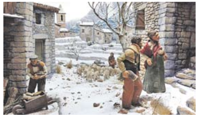
© Imatge d'un dels diorames exposats enguany, un pessebre nevat. || C.