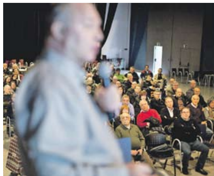
Un moment de la xerrada de Súmate, dissabte passat.

Podrem votar però no se si el novembre. D'una manera o altra haurem de votar però només depèn de nosaltres perquè està clar que allà no ens deixaran votar. Només demanem votar; i això està representant un fita democràtica. Si no votem a través de la consulta que s'ha pactat haurem de votar d'una altra manera. Digues-li eleccions plebiscitàries, una consulta en els termes que hem pactat mig any més tard... Acabarem votant perquè és impossible que no ens deixin votar. +