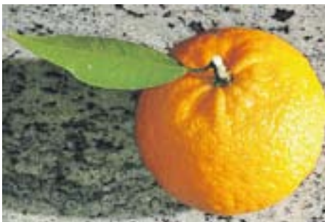
Fruita del temps Autor: Abraham Egea

Envia'ns fotos fetes amb el mòbil: lactual@castellarvalles.cat