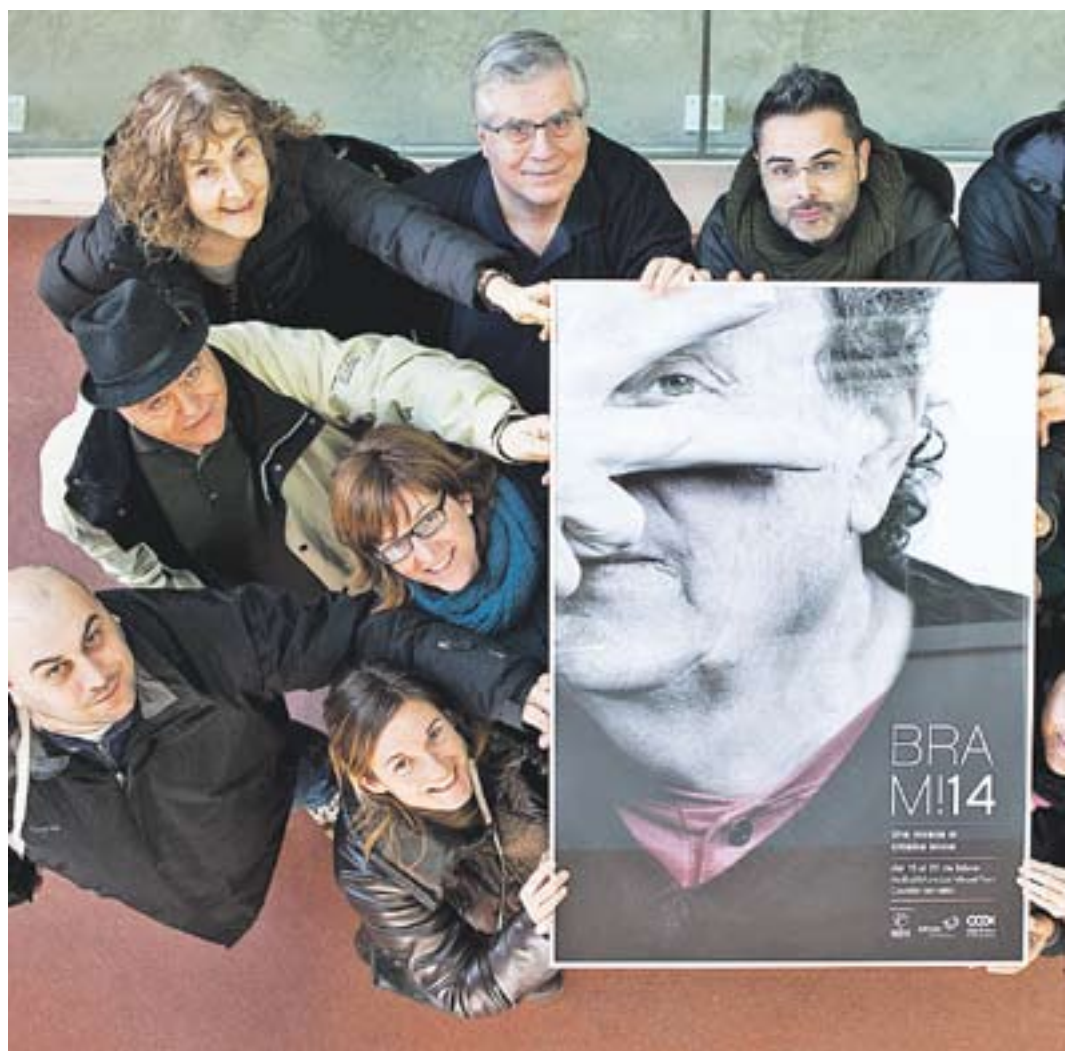
© Foto dels organitzadors del BRAM! amb el cartell d'aquesta edició. || Q. PASCUAL