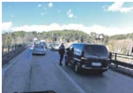
Retenció a la B-124