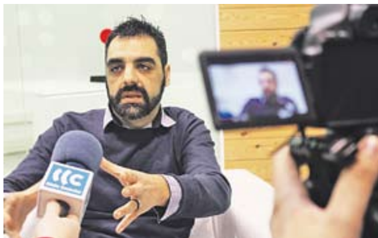
© Jofre Llombart, abans de la xerrada. || Y. CALVO

El santcugatenc va presentar di-vendres passat a la Sala Lluís Valls Areny, el seu primer llibre 'Desmuntant la caverna', publicació que 'contraataca' amb arguments algunes de les acusacions per desacreditar el sobiranisme català. La xerrada forma part del 10è aniversari del Correllengua de la CAL