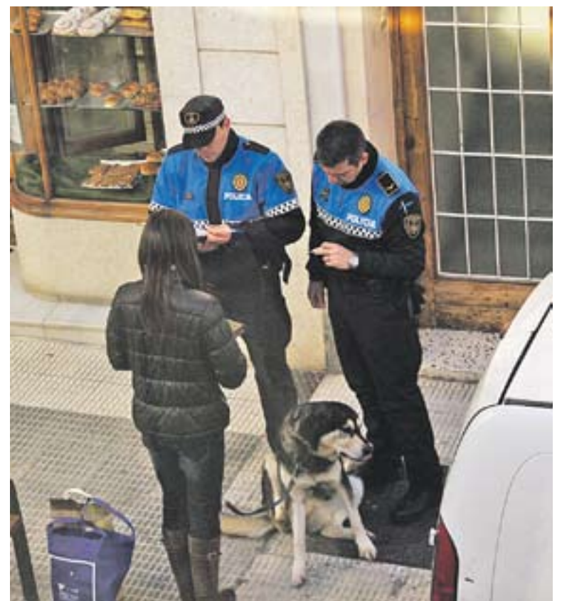
La policia local conversant amb una propietària d'un gos.

Així mateix, l'ordenança de civisme també incideix que les persones propietàries o posseïdores d'animals han d'evitar, en tot moment, que aquests causin danys o embrutin tant les vies com els espais públics, així com les façanes dels edificis. En especial, tenen la consideració d'infracció les deposicions i les miccions d'animals en els parcs o jardins d'ús infantil. +