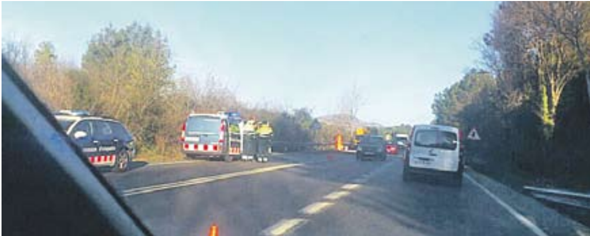
Agents de Mossos i policia local al punt de l'accident mortal del dilluns passat.