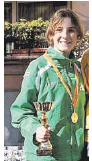
© Aina Muñoz, al podi. || CEDIDA