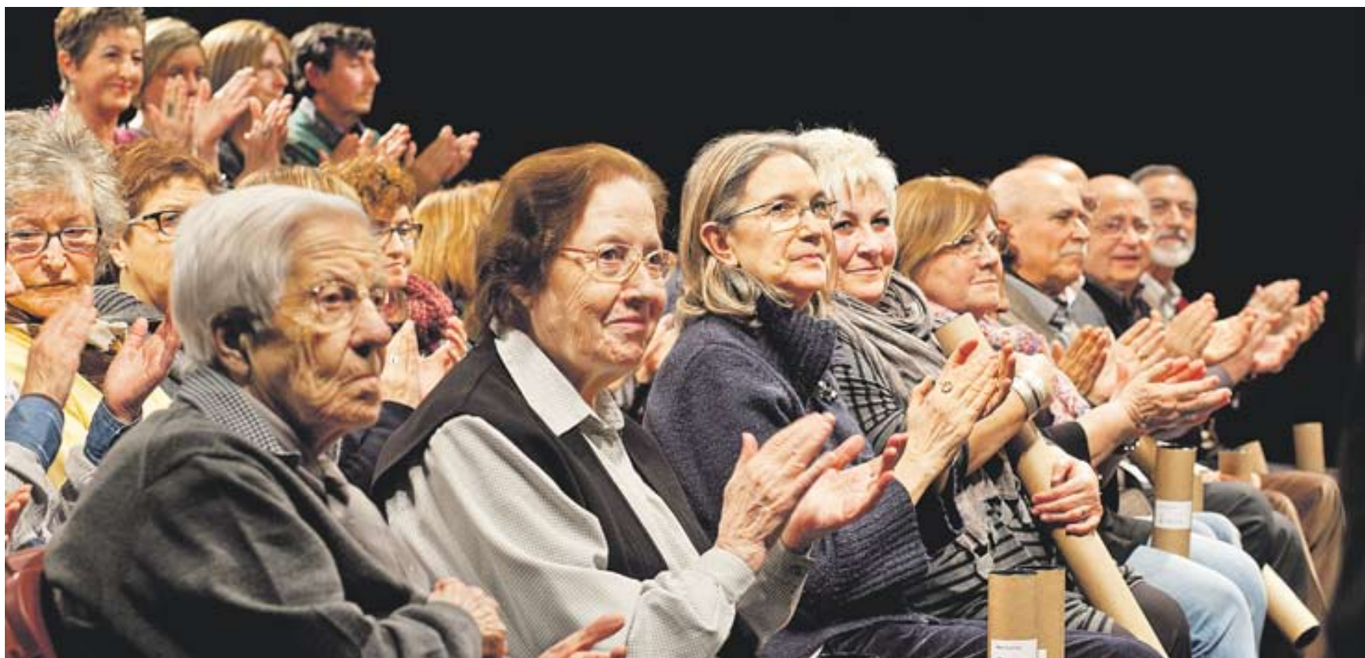
◉ Els docents homenatjats van protagonitzar moments emotius en l'acte celebrat dimecres passat a l'Auditori Municipal Miquel Pont. || Q. PASCUAL