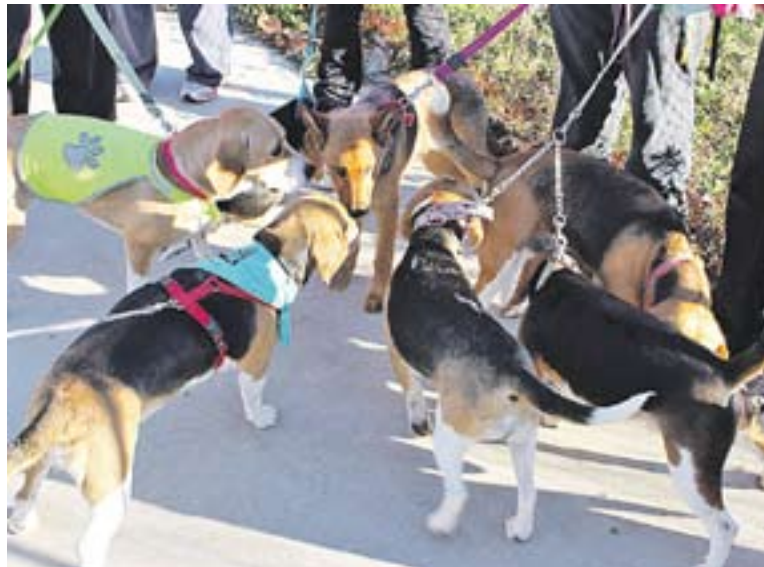
Els diferents exemplars de Beagles que van estar a la trobada.

Aquesta és la segona trobada d'aquesta raça de gossos que se celebra a Castellar, organitzada per Miquel Duarri, castellarenc i amo d'un Beagle. La trobada s'organitza a través de Beagles BCN i Beagles Catalunya, dos grups de Facebook on es reuneixen tots els amants d'aquest tipus de gossos. També hi ha estat present