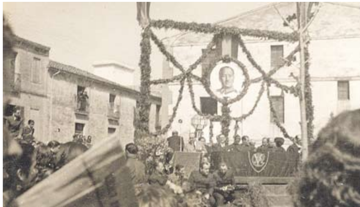
Un acte a principis dels anys quaranta a Castellar amb autoritats polítiques i eclesiàstiques.