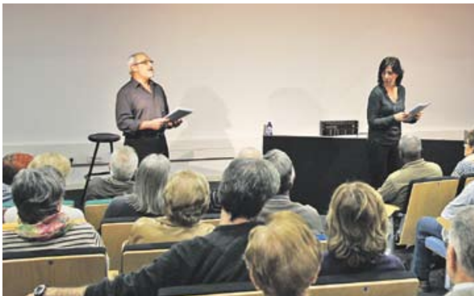
© Anterior 'Sagarra!' a la Sala d'Actes d'El Mirador. || ARXIU

La riquesa del verb dels diàlegs de Sagarra intentarà ser l'objecte de gaudi pel públic durant els aproximadament 75 minuts d'espectacle. +