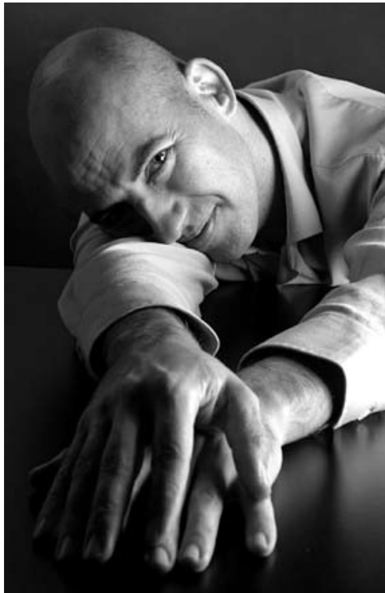
© Sebastià Soley acaba d'editar el seu primer disc. || CEDIDA

Capteu el QR i mireu el reportatge sobre 'La poma i el piano de cua'