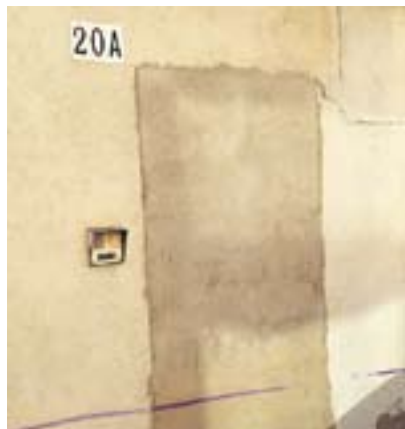
No esperem visites Autor: Pere Fité