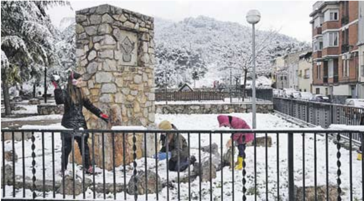
El 24 de febrer del 2013 la neu va fer acte de presència a Castellà