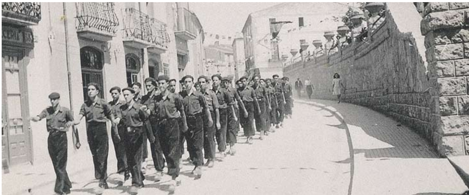
Desfilada de falangistes pel carrer Major de Castellar a principis dels anys 40.

Acord entre PSC, CiU i PP pel nou Pla General