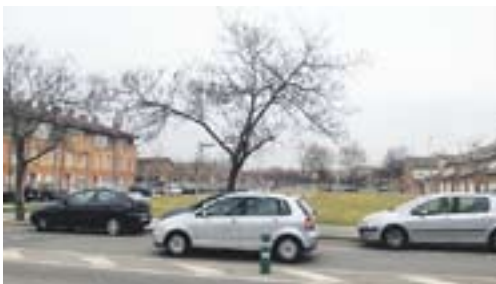
Postal d'hivern

Envia'ns fotos fetes amb el mòbil: lactual@castellarvalles.cat