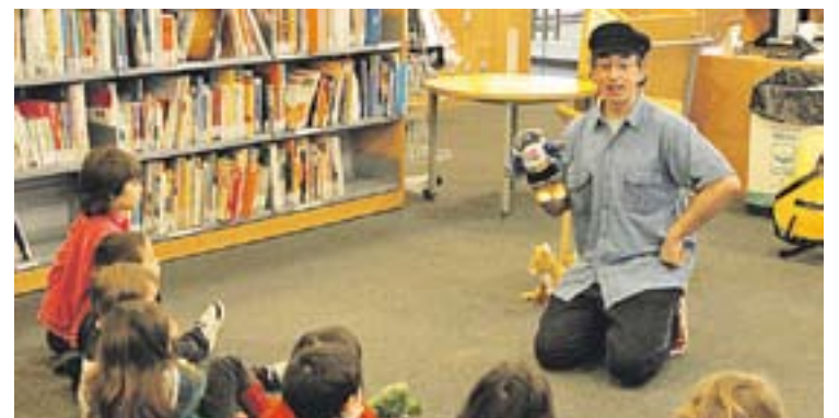
Un moment de l'Hora del Conte Infantil a la Biblioteca.