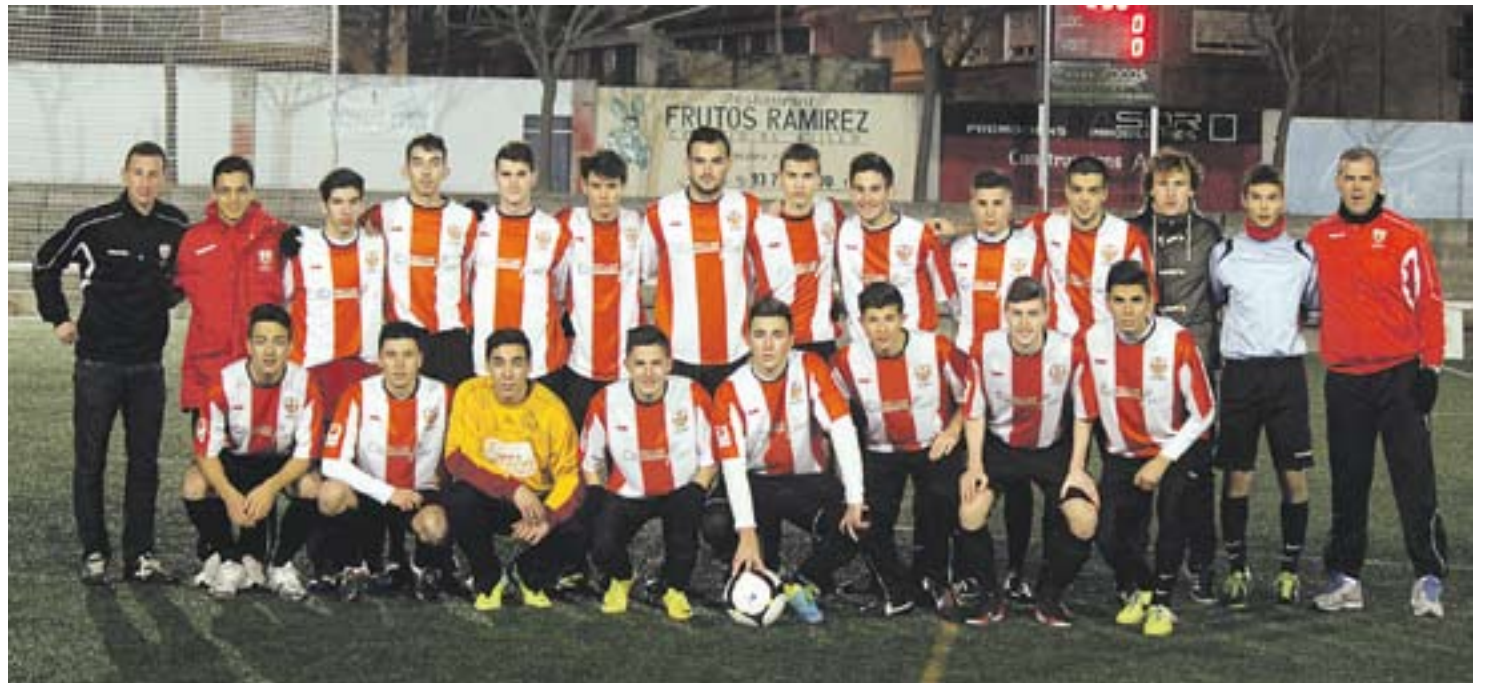
La plantilla del juvenil de la Unió Esportiva Castellar, abans del partit jugat aquesta temporada al Pepín Valls contra el Sant Quirze.