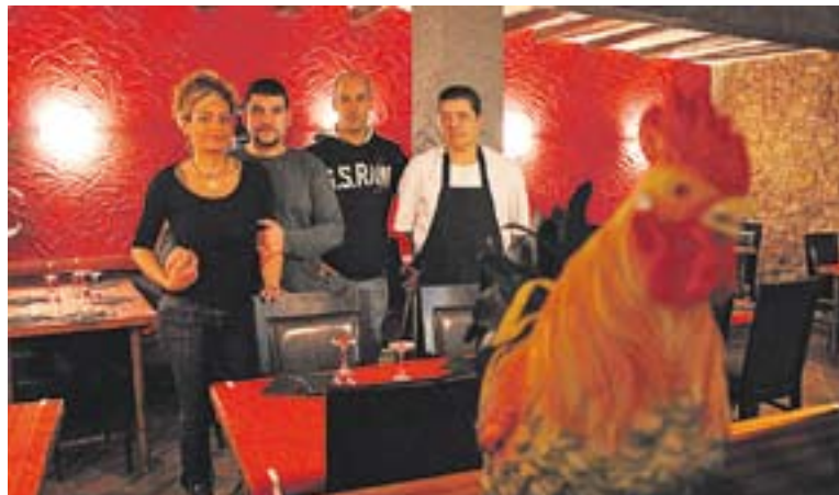
© Francisco Fuster, M. José Álvarez, el cuiner i el fogoner de la Taberna del Gall. || C. DÍAZ