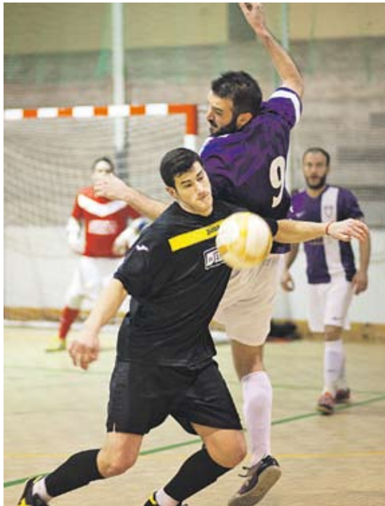
© Una imatge del duel entre l'Athletic 04 i el Picnic Nou Barris. || Q. PASCUAL

LA IL·LUSIÓ, INTACTA || L'ensopegada contra el Picnic no ha trencat