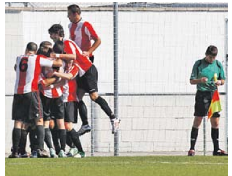
Els jugadors del Castellar celebren un gol, en una imatge d'arxiu.

el 70%", també argumentava, tot deixant clar que ja està preveient en l'horitzó la possibilitat de l'ascens: "No ens esperàvem estar tan bé. Fins i tot podria pujar el tercer per una reestructuració o alguna baixa. Econòmicament seria un gran problema però faríem tot el possible per no haver de renunciar". +