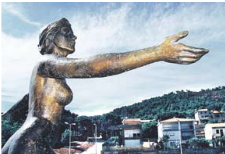
© Procés de creació de l'escultura i l'artista, M. del Mar Hernández. || J. SERRA