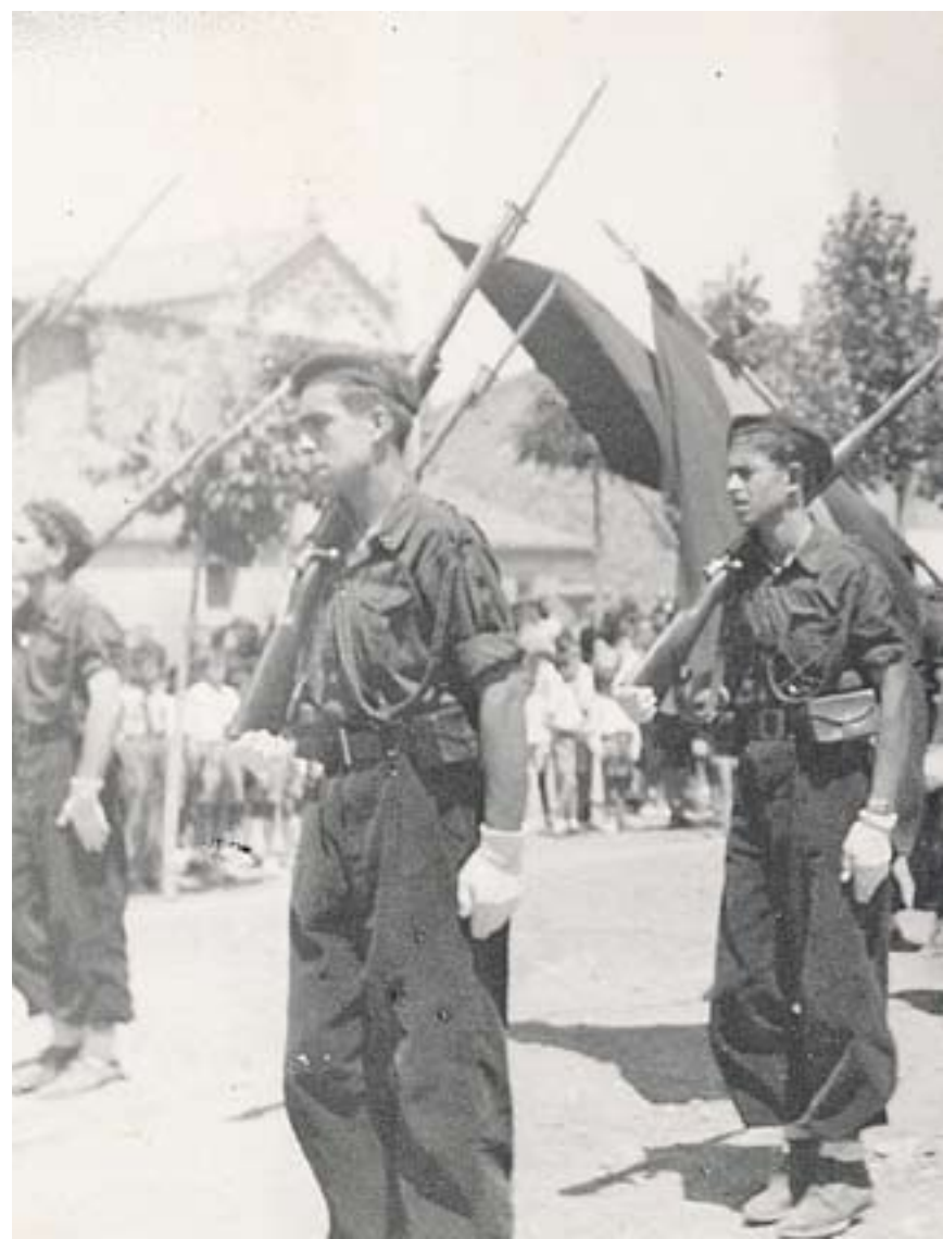
© La plaça Major de Castellar del Vallès, en una imatge poc després del final de la guerra civil.

Els soldats van entrar de nit, majoritàriament a cavall, per l'oest,