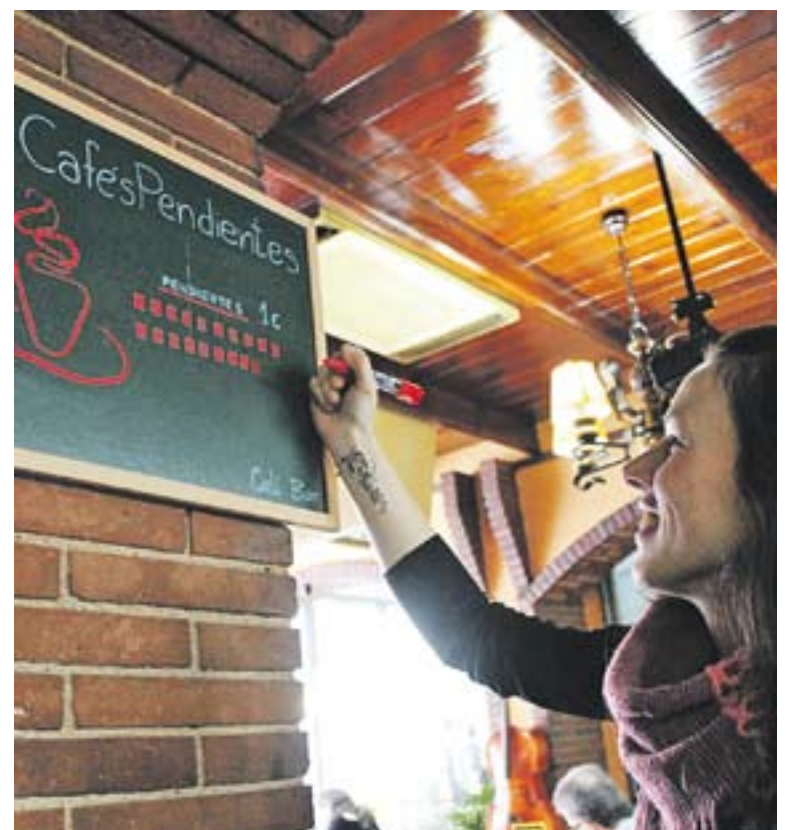
© Isa Gascón apunta els cafès pendents, en una imatge de dimecres passat. || C. DÍAZ

"Ens agradaria que altres bars de Castellar se sumessin a la iniciativa" , asseguren des de l'establiment. +