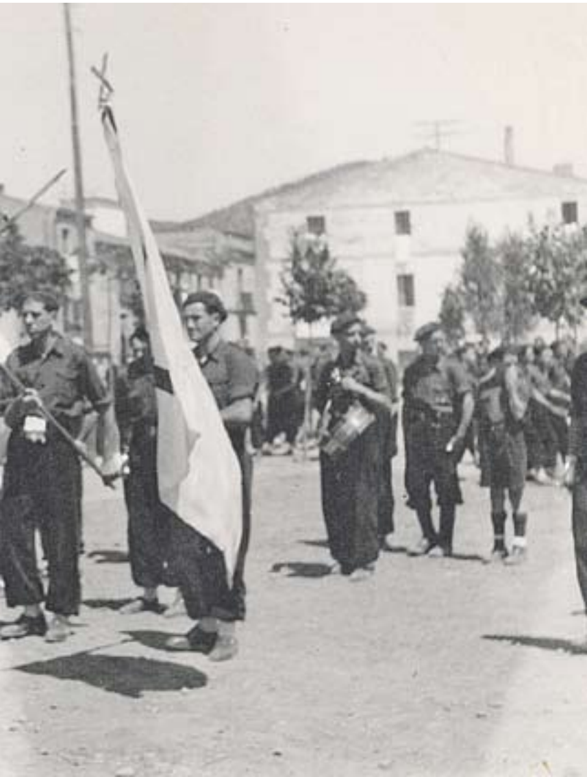
acull una desfilada de falangistes.

ris, la família Tolrà, a l'antic Ajuntament situat al carrer Major.