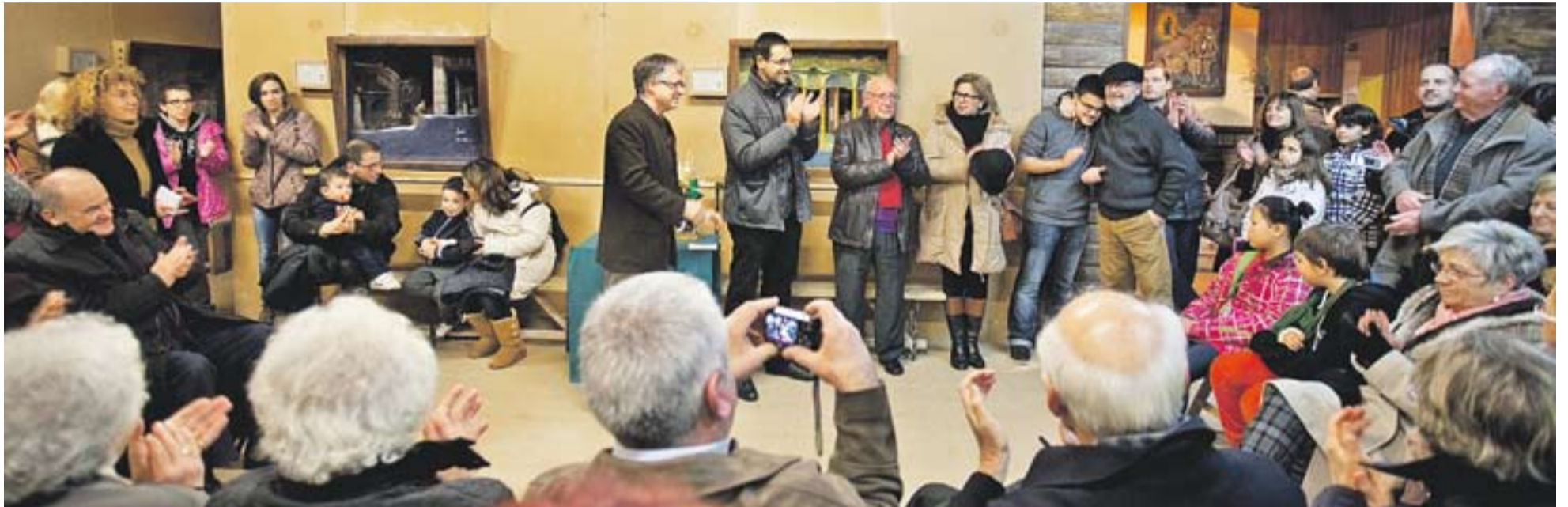
Un moment de la inauguració de l'exposició de Pessebres del Grup Pessebrista de la Capella de Montserrat.

La meteorologia és el comú denominador de l'exposició del Grup Pessebrista 2013, també s'inaugura una escultura de forja al jardí