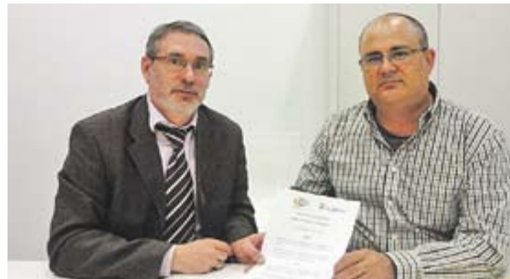
© Representants de Comerç Castellar i de CityApps. || COMERÇ CASTELLAR