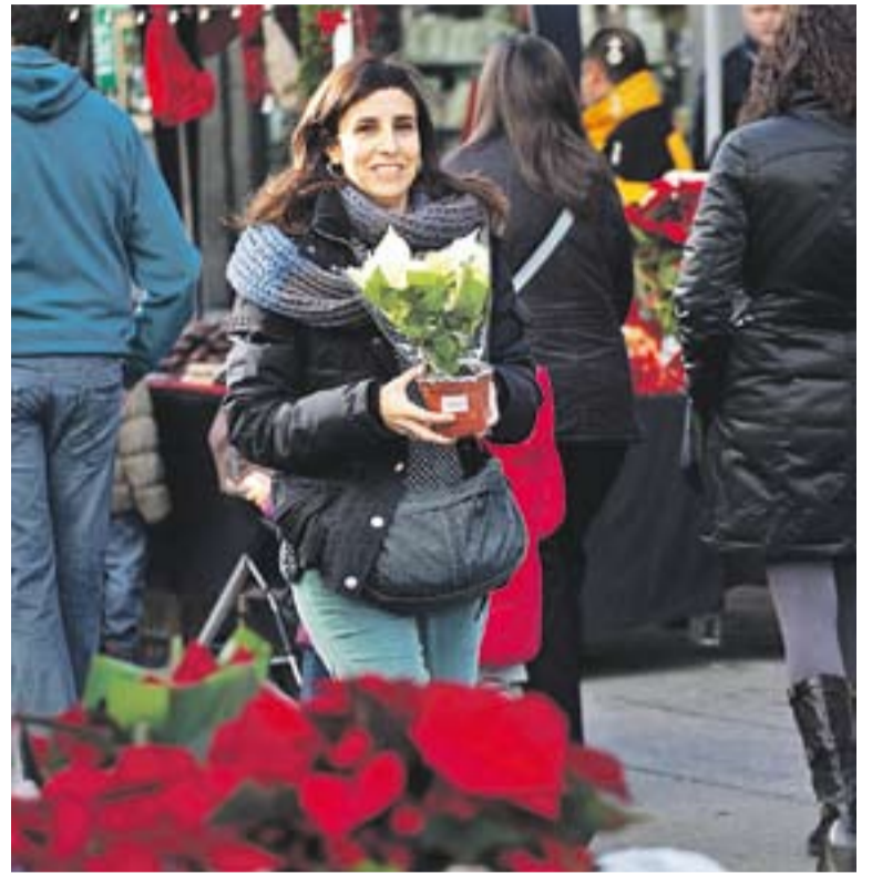
© Castellarenques fent compres a la fira de Sant Esteve dissabte passat al migdia. || Q. PASCUAL