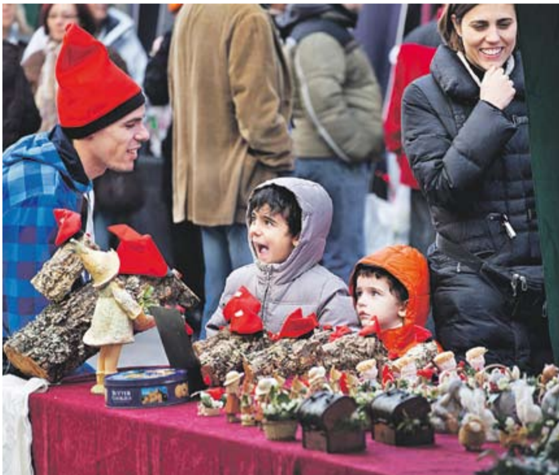
© Parada de la fira de Sant Esteve el cap de setmana passat al carrer Sala Boadella. || Q.PASCUAL ACTUALITAT P3

El Gran Recapte recull 9,5 tones a la vila