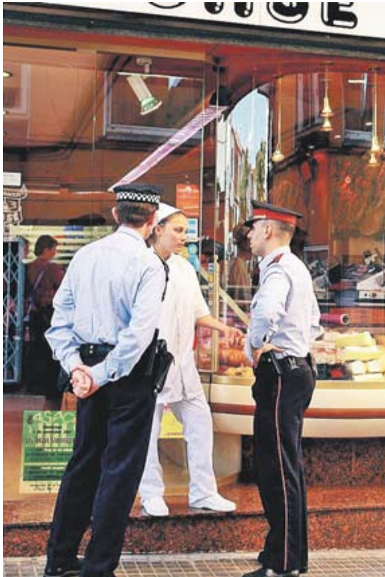
Patrulla policial mixta del pla Grèvol, a un establiment de la vila

En aquest sentit, la campanya policial també vol disminuir la percepció subjectiva d'inseguretat i fomentar la implicació i coordinació en matèria de seguretat