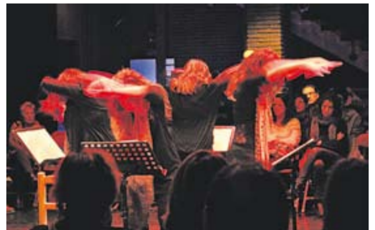
Actrius de 'Bruixes' a l'Auditori Municipal.

A tots els assistents se'ls va obsequiar, un cop acabat Vet aquí... 25 anys! , amb un tros de pastís d'aniversari al vestíbul d'El Mirador. Allí també es va poder adquirir marxandatge de La Xarxa i La Setmana del Pallasso. +