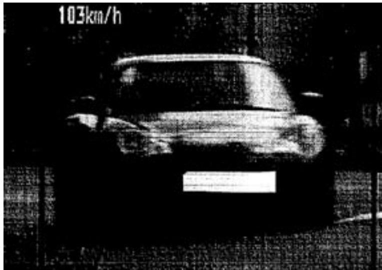
Fotografia del radar del vehicle a 103 km/h

El període que comprèn i precedeix les dates nadalenques és "especialment conflictiu i és molt necessària la sensibilització de tothom", explica el regidor de Seguretat, José Leiva. El regidor reconeix que "en els darrers dos caps de setmana el nombre de positius ha superat el percentatge mitjà". En aquest sentit, la campanya que posarà en marxa la Policia Local constarà de nombrosos controls en diverses franges horàries. Malgrat les últimes dades recollides, cal destacar que els resultats dels diversos controls d'alcoholèmia realitzats per la Policia Local durant aquest exercici són molt positius, com ho demostra el fet que només el 4% de les més de 1.500 proves realitzades enguany superessin els límits permesos. "Aquestes dades demostren la consciència que hi ha entre els conductors