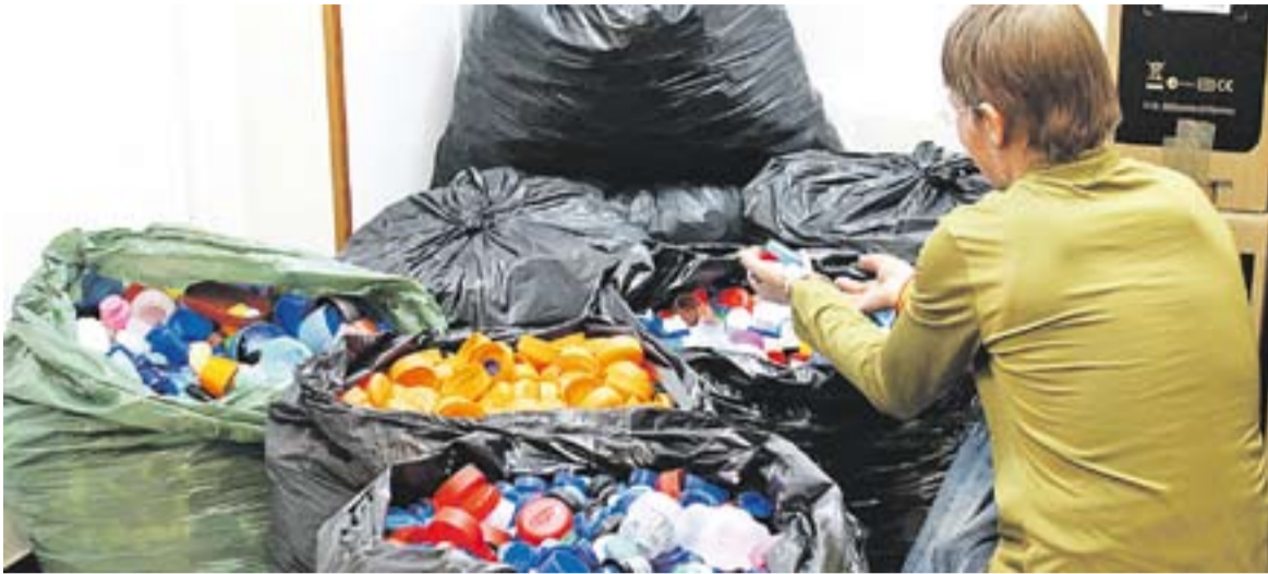
© Mila Méndez tria els talls de plàstic aptes per a la planta de reciclatge || Y.CALVO