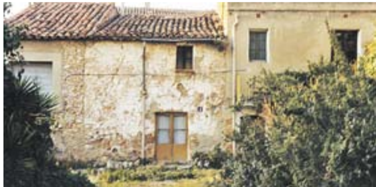
Camioneta de repartiment i façana abans d'enderrocar-la de Cal calissó.

els repartien pel poble amb la camioneta que podeu veure en la foto que s'adjunta a l'article (Pepet i la mare). També repartien taronjades i llimonades, i cervesa Moritz.