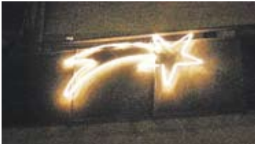
Camí de Betlem passant per la pl.Europa Autor: Montse Navas

Envia'ns fotos fetes amb el mòbil: lactual@castellarvalles.cat