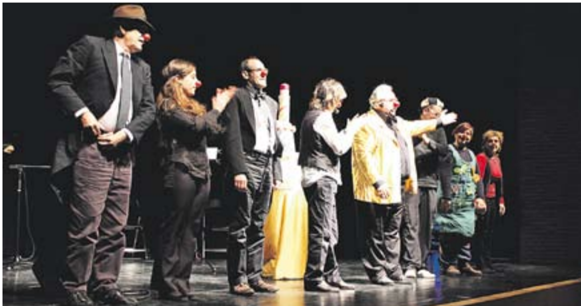
© Vet aquí... 25 anys! va ser l'espectacle de La Xarxa per celebrar els 25 anys d'història. || M. BONAFACIA

Més de 150 persones van gaudir de l'espectacle 'Vet aquí... 25 anys!'