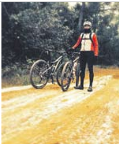
Pujant al Puig Autor: Òscar Martínez