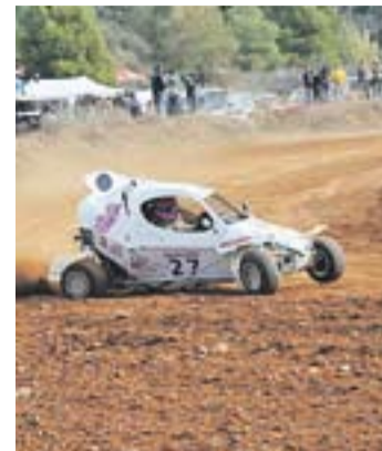
© Pujol, a Castellbisbal. || P. PUJOL