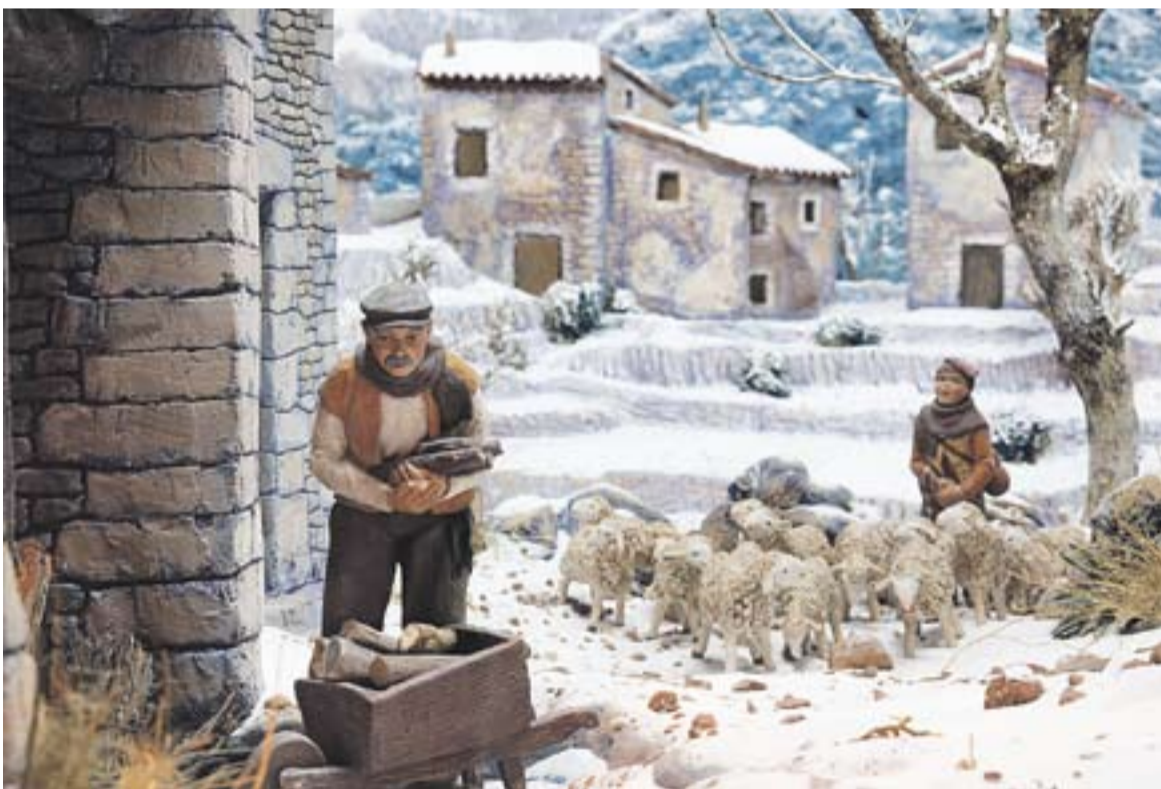
Diorama amb paisatge de neu.