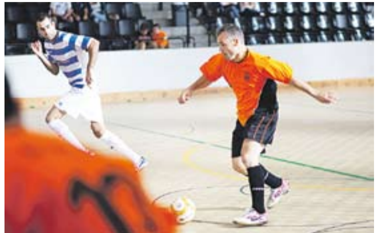
© Juan Antonio Fernández (FS Castellar), autor dels dos gols. || Q. PASCUAL

El pròxim duel del CB Castellar, que és setè amb un balanç de 7-5, serà el 14 de desembre al pavelló Puigverd contra el Martorell. Un conjunt, aquest, que és líder absolut amb deu triomfs de dotze. +