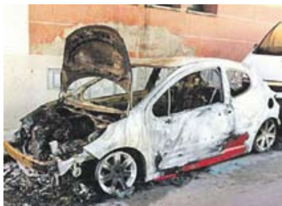
Un Seat Marbella cremat al carrer Catalunya i un Peugeot 206 al carrer del Centre.