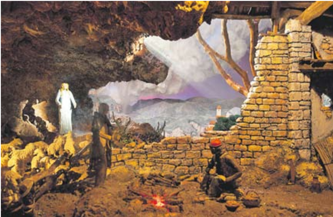
Diorama de l'anunciació amb fenomen meteorològic.