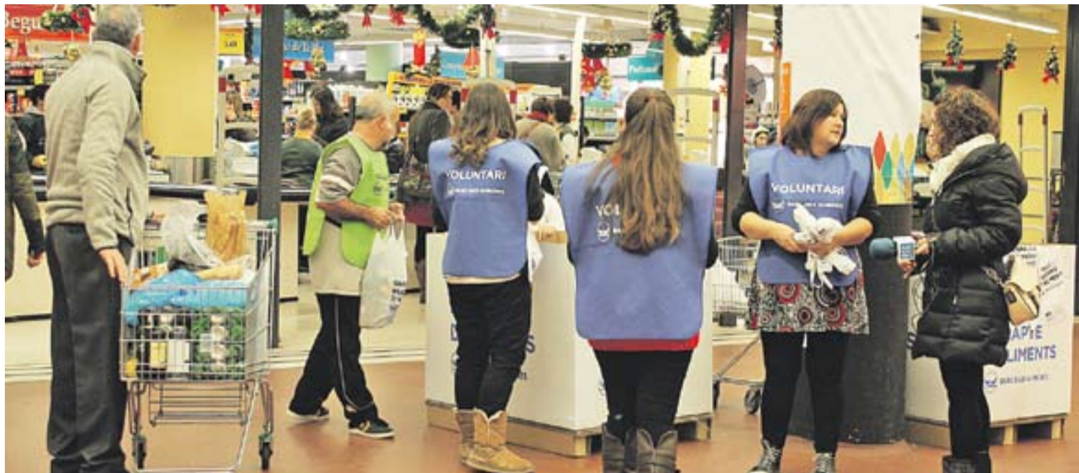
⊙ Voluntàries informant i recaptant aliments divendres al Mercat Central.

El càlcul que s'havia fet per computar els quilograms que s'havien de quedar per a les famílies de Castellar era de 10 kg per persona. Via Solidària-Càritas compta amb uns 620 usuaris aproximadament, per tant, s'havia pactat unes sis tones d'aliments. Però després de la recollida, Via Solidària-Càritas ha negociat amb el delegat del Banc d'aliments de la zona del Vallès per augmentar els quilos pactats i finalment les 9,5 tones es quedaran a Castellar: "Hem parlat amb el delegat per veure si ens podíem quedar alguna tona més i es veu que ha anat tan bé arreu, que ens han dit que sí. A més, s'estalvien la despesa de venir amb els camions i redistribuir-ho" , explica