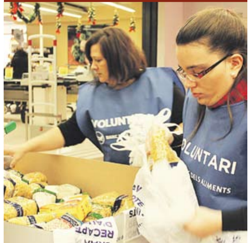
Dues voluntàries del Gran Recapten al Mercat el cap de setmana passat.