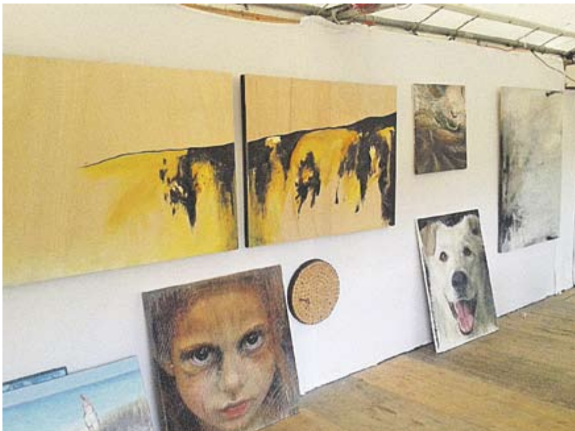
© Les obres exposades dels artistes catalans a París en una instantània. || CEDIDA

Va participar en una col·lectiva al Grand Marché de l'Art Contemporain