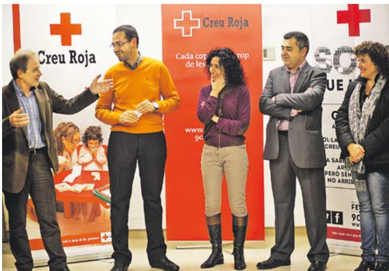
Responsables de zona de la Creu Roja i autoritats municipals de Castellar i Sentmenat, dilluns a la inauguració. || Q. PASCUAL ACTUALITAT P3