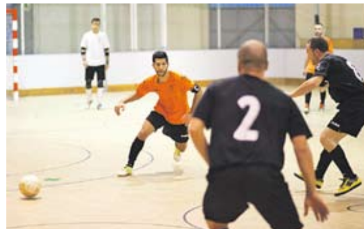
L'Athletic 04 defensa una jugada visitant, en una imatge d'arxiu.

En un altre ordre de coses, els socis del CB Castellar estan convocats el divendres dia 29 de novembre, a les 21 hores, a la sala d'actes d'El Mirador, per a l'assemblea ordinària. +