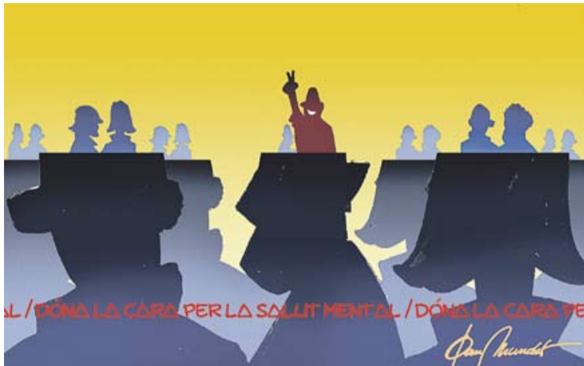
© Es busca famós. || JOAN MUNDET

És un fet que moltes persones amb problemes de salut mental amaguen el seu diagnòstic per por a ser discriminades