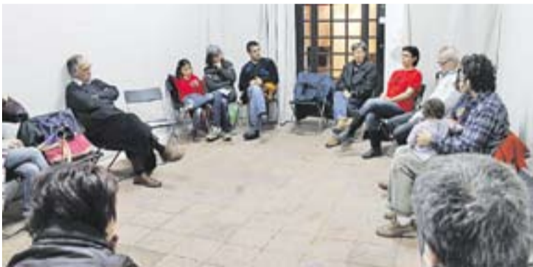
Alguns dels participants a l'assemblea que es va fer a Cal Gorina.