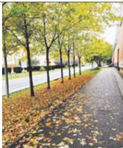
La tardor Autor: Gisela