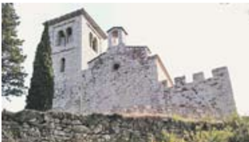
Puig de la Creu Autor: Óscar Moreno

Envia'ns fotos fetes amb el mòbil: lactual@castellarvalles.cat