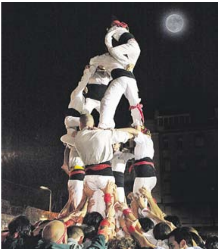
CAPGIRATS DE CASTELLAR