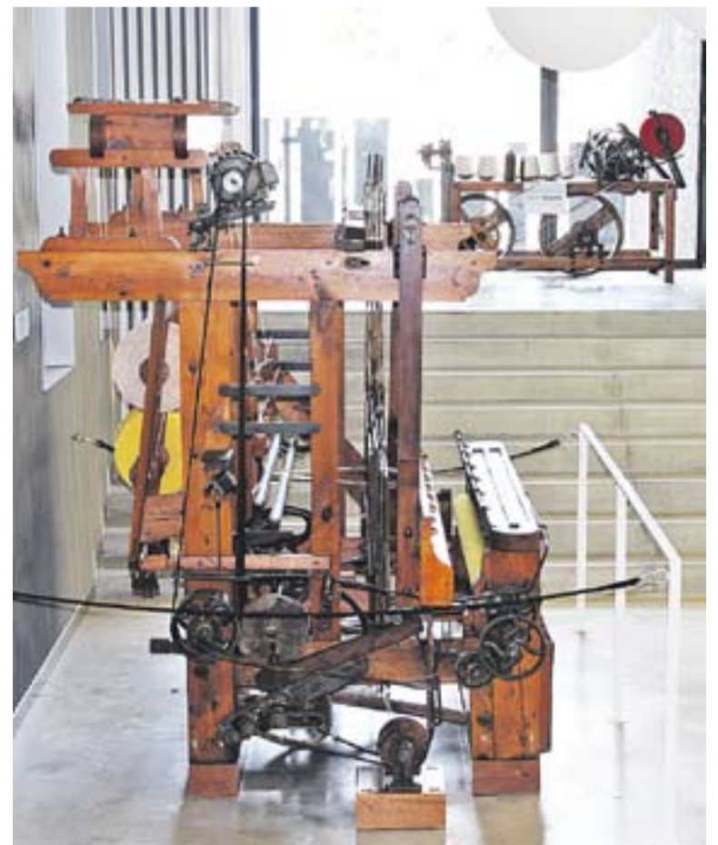
En primer pla, el teler. Al fons, l'ordidor. Exposats a El Mirador.

Cal assenyalar que es preveu que aquestes peces formin part, en un futur, d'una mostra de diferents elements recuperats de l'espai de la plaça Major, on també s'exposaran diferents peces trobades en les excavacions arqueològiques que es van dur a terme durant el procés d'urbanització i renovació profunda de la plaça Major. +