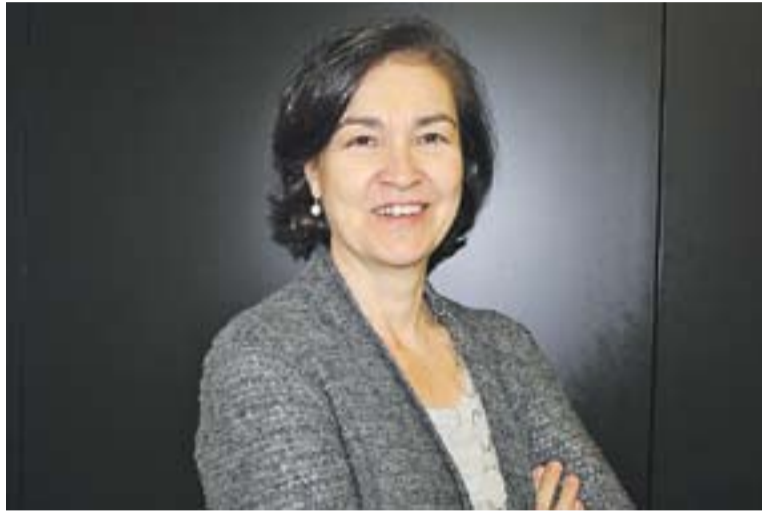
© L'advocada Nati Suils. || R.G.

De fet, s'ha detectat que un percentatge alt de noies de 13 i 14 anys han estat assetjades i controlades per les seves parelles a través de les xarxes socials i missatgeria com WhatsApp. No són conscients que no és una conduc-