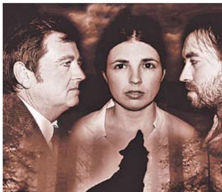
© 'Terra Baixa', de la companyia Kakaiba Associació Artística.