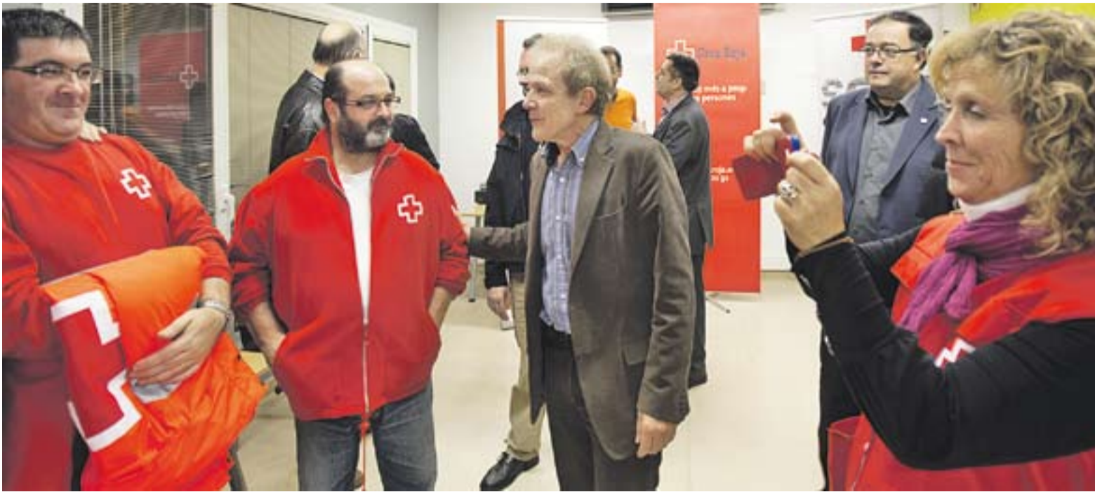
© Voluntaris i personal de la Creu Roja, dilluns passat, durant la inauguració del nou punt que tindrà l'entitat a Castellà del Vallès. || Q. PASCUAL