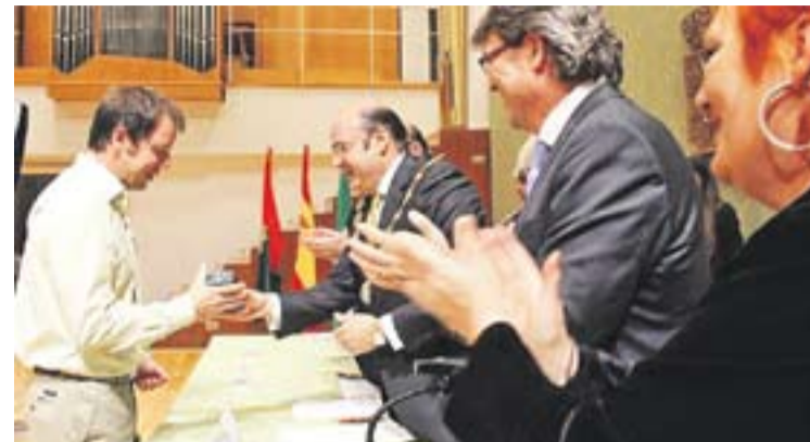
© Lluís Gibert, recull la medalla a l'Ajuntament de Granada. || DIP. GRANADA