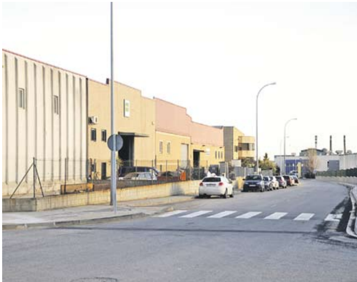
⊙ Es preveu que aquesta tecnologia es pugui posar en servei als polígons abans de finalitzar aquest 2013.