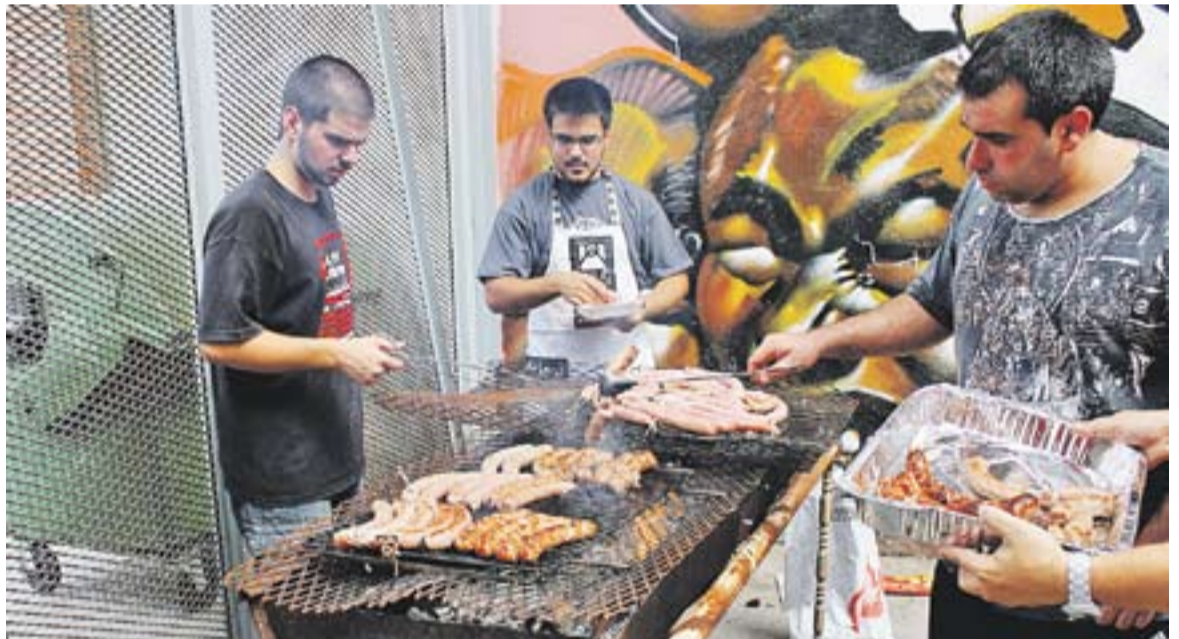
© Botifarrada del Ball de Gitanes de l'Espai Tolrà. || SERGIO RUIZ

D'aquí dues setmanes aproximadament, començaran els assajos de Ball de Gitanes per preparar la Gran Ballada al pavelló Joaquim Blume. + || S.R.