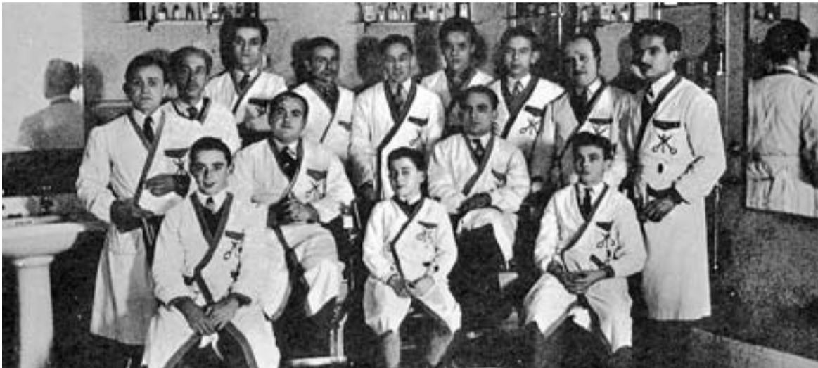
Plantilla d'empleats de la Barberia dels germans Altimira.

Amb aquest article, L'ACTUAL continua una sèrie que vol recordar botigues, entitats, establiments i llocs d'esbarjo de la nostra vila ja desapareguts