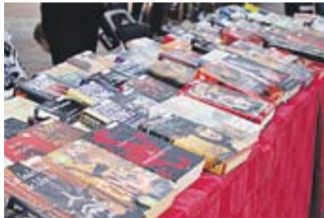
Mercat del Trasto Autor: Óscar Moreno