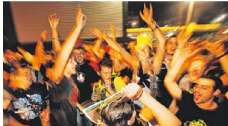
© Partipants del Correlokals d'enguany.