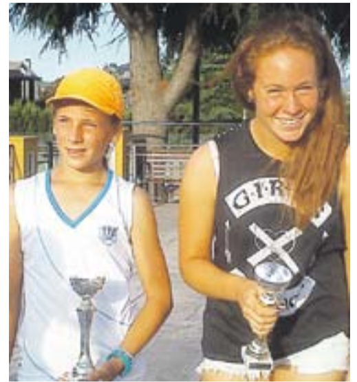
© Aina Domingo i Laura Ballesteros. || CTC