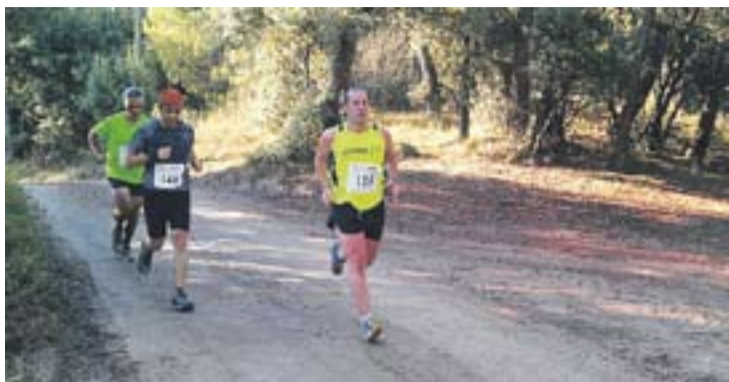
Una imatge de la cursa disputada en l'edició anterior. || CAC