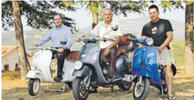
© Imatge de la Retrovespa 2012. || ARXIU

A les 11 del matí s'iniciarà la ruta motera, sortint de l'Espai Tolrà, i en direcció Sant Llorenç de Munt i l'Obach. "Són aproximadament uns