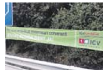
Pancarta a la B-124