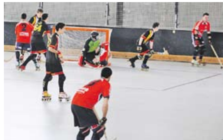
Els castellarencs, il·lusionats de començar la nova temporada.