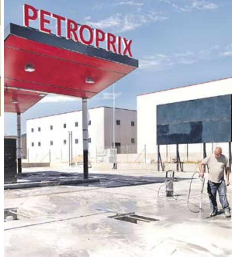
© En pocs dies obrirà a Can Carner Petroprix, autoservei 'low cost'. || QUIM PASCUAL