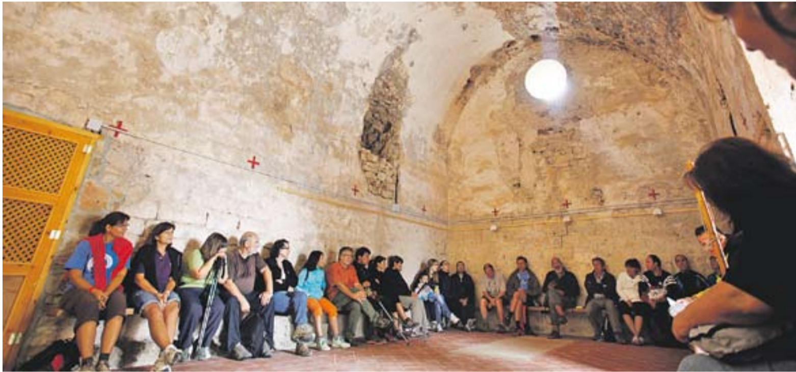
Interior de la capella romànica del Puig de la Creu diumenge passat al matí amb participants de la trobada de Tardor.