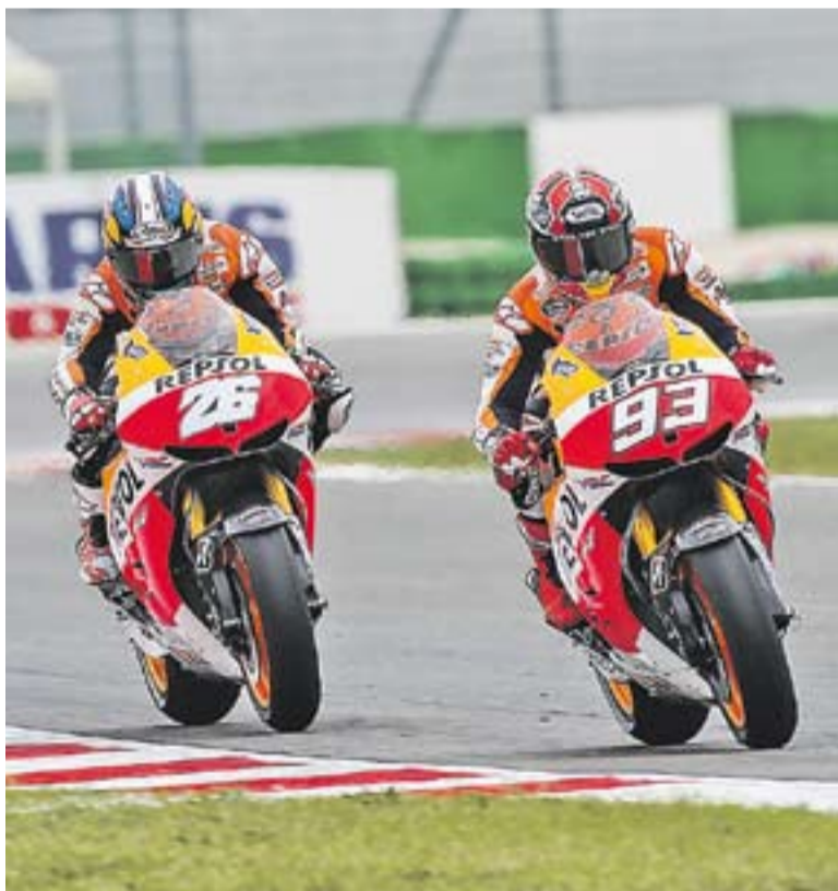
Pedrosa, per darrere Márquez durant la cursa a Misano.

Ara, Dani Pedrosa i Jorge Lorenzo empaten a 219 punts al capdavant de la classificació general del MotoGP quan falten cinc proves per finalitzar el mundial. El mallorquí quedaria per davant del castellarenc perquè ha guanyat cinc curses, per només dues de Pedrosa. Márquez, que continua liderant la cilindrada, es troba 34 punts per davant, més d'una cursa de diferència. †