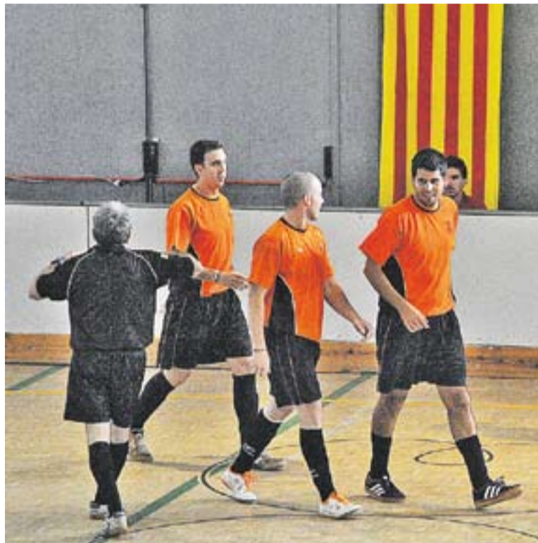
© Els castellarencs en el partit de l'ascens contra el Baganès. || J. GRAELLS

El club ha incorporat dos jugadors. En primer lloc Kiki, un pivot que prové de la Sardana de Badia del Vallès. Als seus 32 anys,