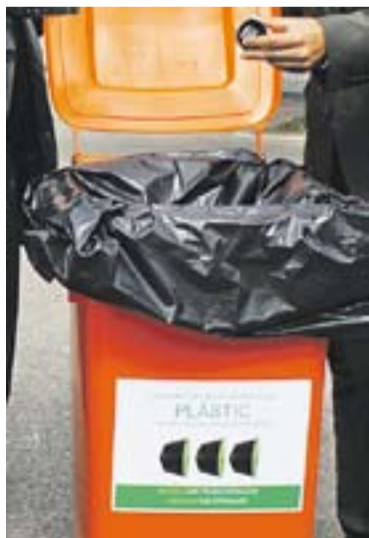
© El contenidor de càpsules monodosi

La deixalleria municipal de Castellar estrena un nou sistema de reciclatge de càpsules monodosi de cafè i infusions. És una de les 15 deixalleries municipals que aquest mes de setembre ja compten un nou sistema de reciclatge de càpsules monodosi de cafè i infusions. El nou sistema permet que la ciutadania pugui portar-hi tant les càpsules d'alumini com les de plàstic, evitant així dipositar-les als contenidors grocs destinats als envasos, amb l'objectiu d'afavorir tant el reciclatge integral dels materials que componen la càpsula com el residu orgànic del seu interior.