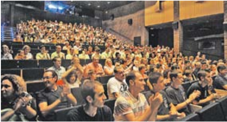
Acte de reconeixement a les entitats esportives, el juliol passat.

Les entitats de la vila crearan una associació per coordinar-se davant possibles inspeccions de treball