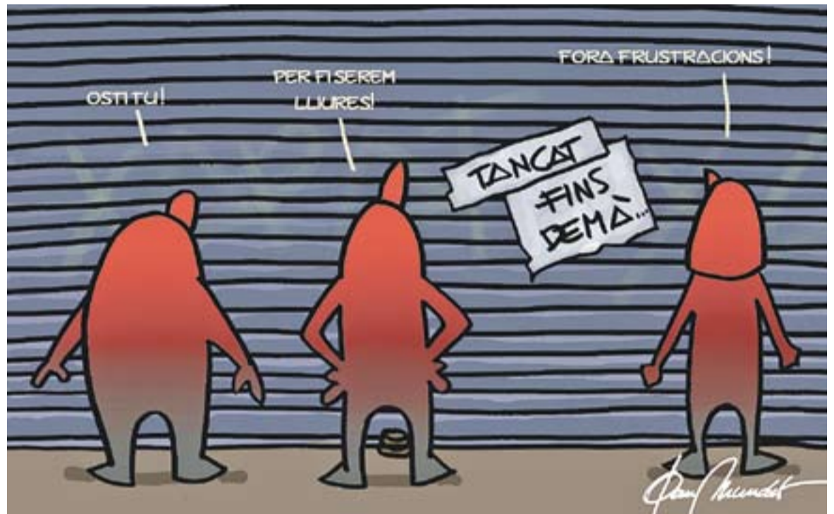
© Tornada de vacances. || JOAN MUNDET

Social: hi ha un acord cultural tàcit de "no molestin". Tot allò que és urgent i vital durant l'any, entra en una fase de letargia consensuada. Hi ha un relaxament col·lectiu i un respecte per aquest descans. Les fórmules socials de comunicació canvien; a l'inici de les