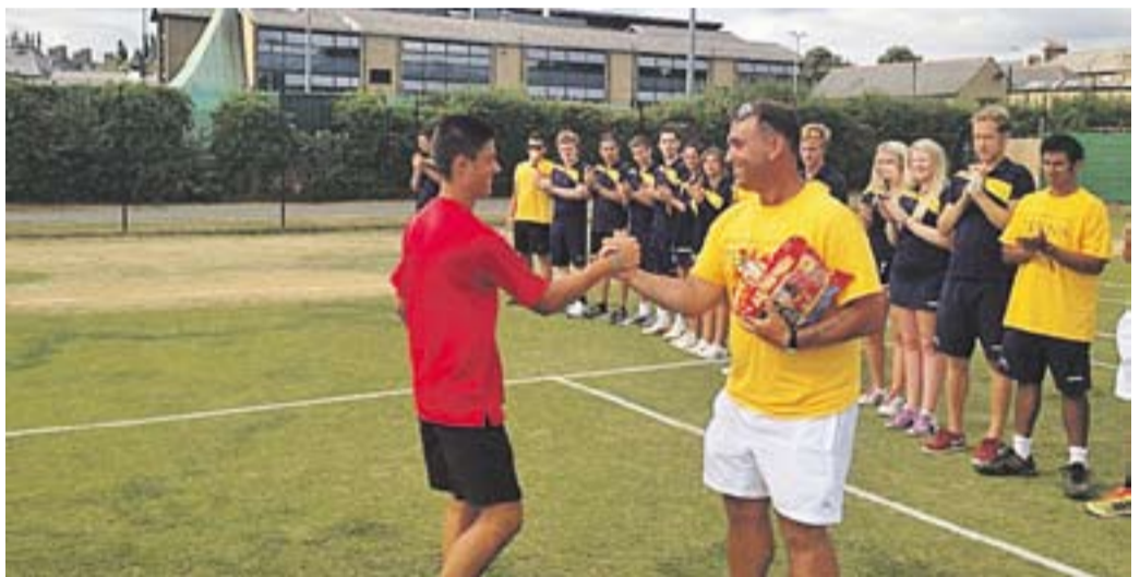
© Èric Domingo, a Oxford, on va aconseguir la victòria en dos tornejos. || CTC