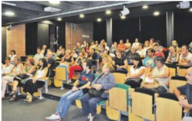
© Alguns dels nous alumnes de l'escola d'Adults a El Mirador. || ESCOLA D'ADULTS

horaris de matí i de tarda-vespre, ja que l'Escola d'Adults està oberta des de les 9,30 a les 12,30 h i des de les 15 fins a les 22 hores diàriament. L'Escola porta paral·lelament el projecte de Reforç Escolar per a la població escolaritzada de la vila, tant de primària com de secundària, que suposarà enguany entre 150 i 200 alumnes. També és centre de suport de l'IOC per fer l'ESO a distància amb 40 alumnes per aquest primer trimestre.