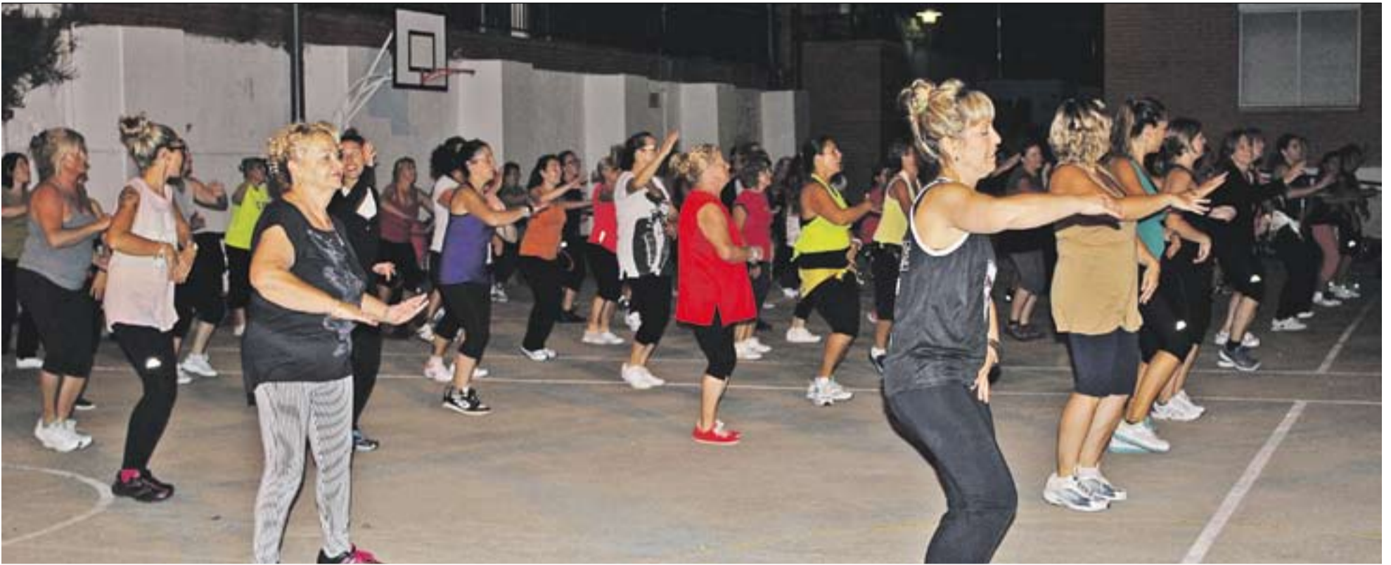
⊙ Aquesta setmana les classes s'han traslladat al pati de l'escola Bonavista. S'espera que a partir de l'octubre tornin al gimnàs del Joan Blanquer || CRISTINA DOMENE