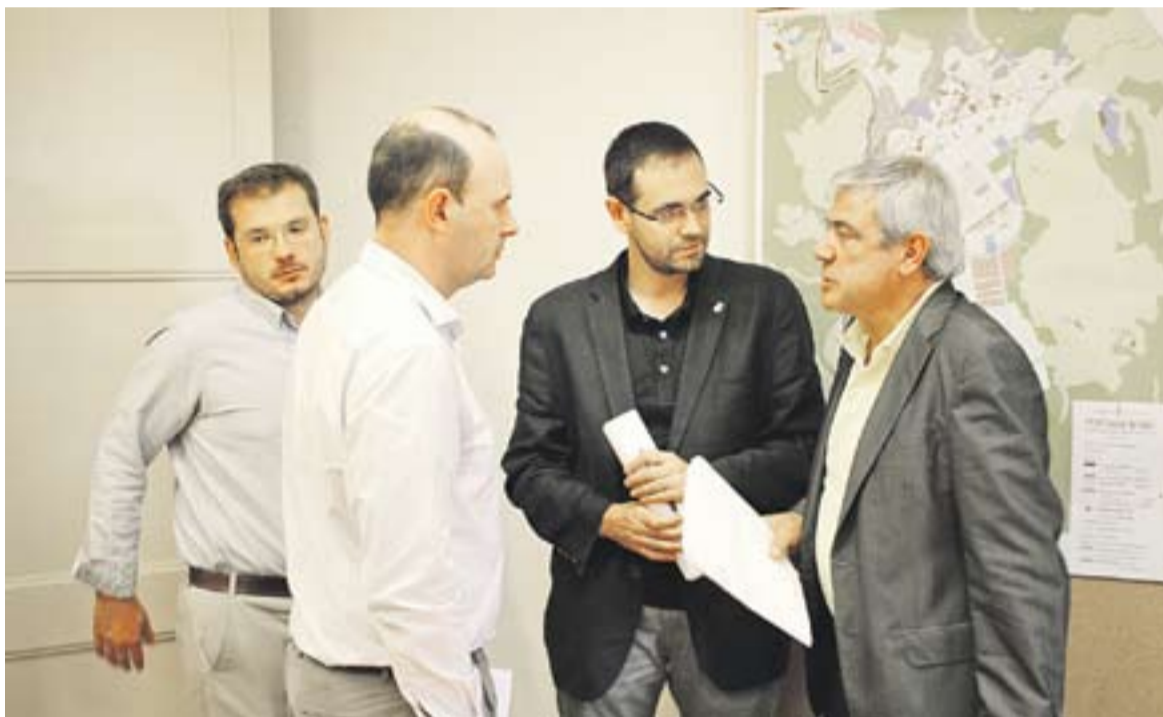
Trobada dels alcaldes de Castellar, Sant Llorenç i Gallifa dimarts passat al Palau Tolrà.