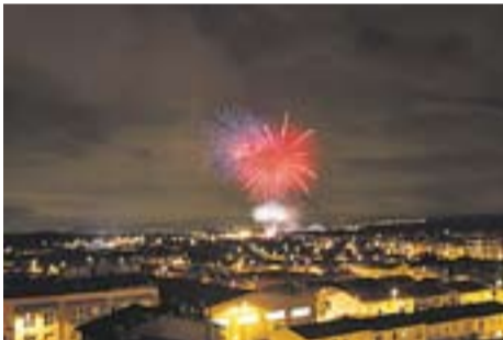
I la festa s'acaba Autor: Joan Puig

Envia'ns fotos fetes amb el mòbil: lactual@castellarvalles.cat