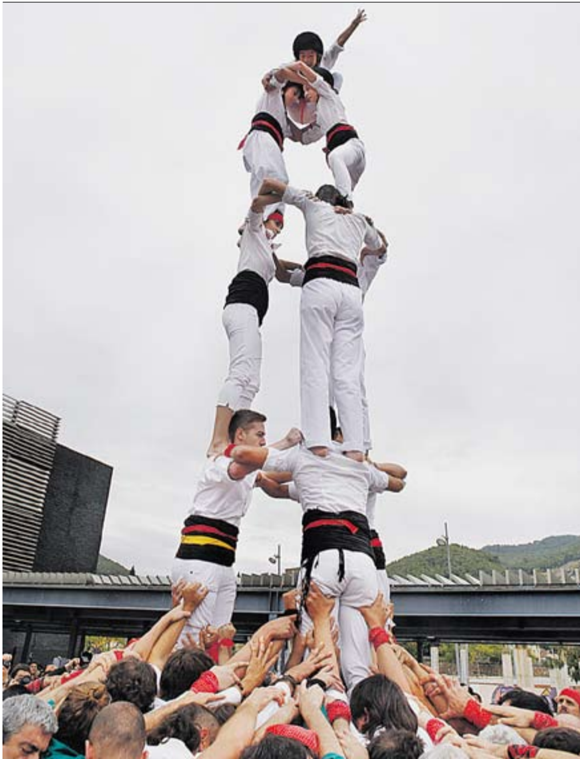
© La colla de Castellar carrega i descarrega amb èxit el 3 de 6 . || QUIM PASCUAL