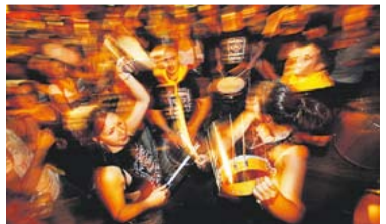
A dalt a l'esquerra Jornada de la infància, a la dreta, la Tabalada i a sota, el final de la festa de l'escuma