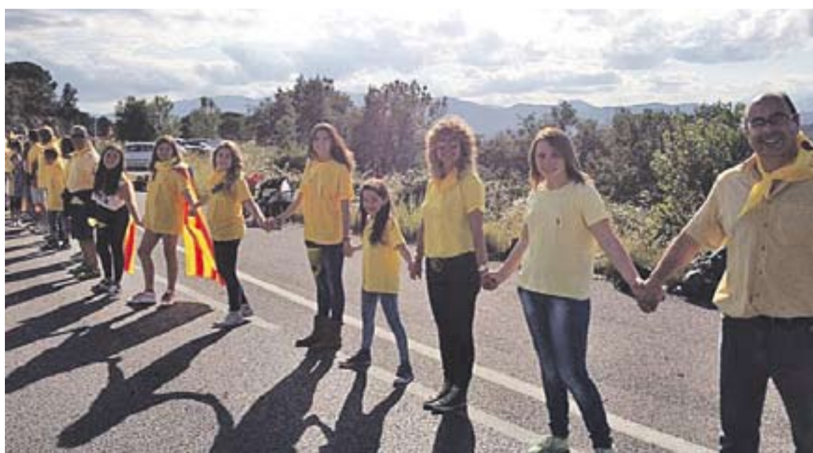
Alguns dels participants castellarencs a la Via Catalana a Tordera.