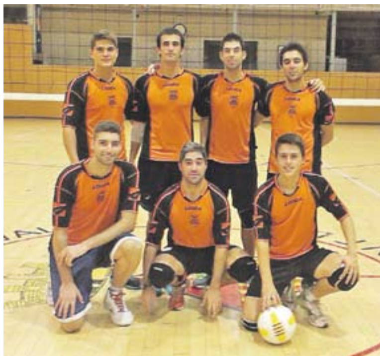
Els guanyadors del torneig de vòlei disputat per Festa Major.

PREPARANT LA TEMPORADA || El Futbol Sala Castellar ja es troba amb els preparatius de cara a la temporada 2013-2014. Un dels equips que