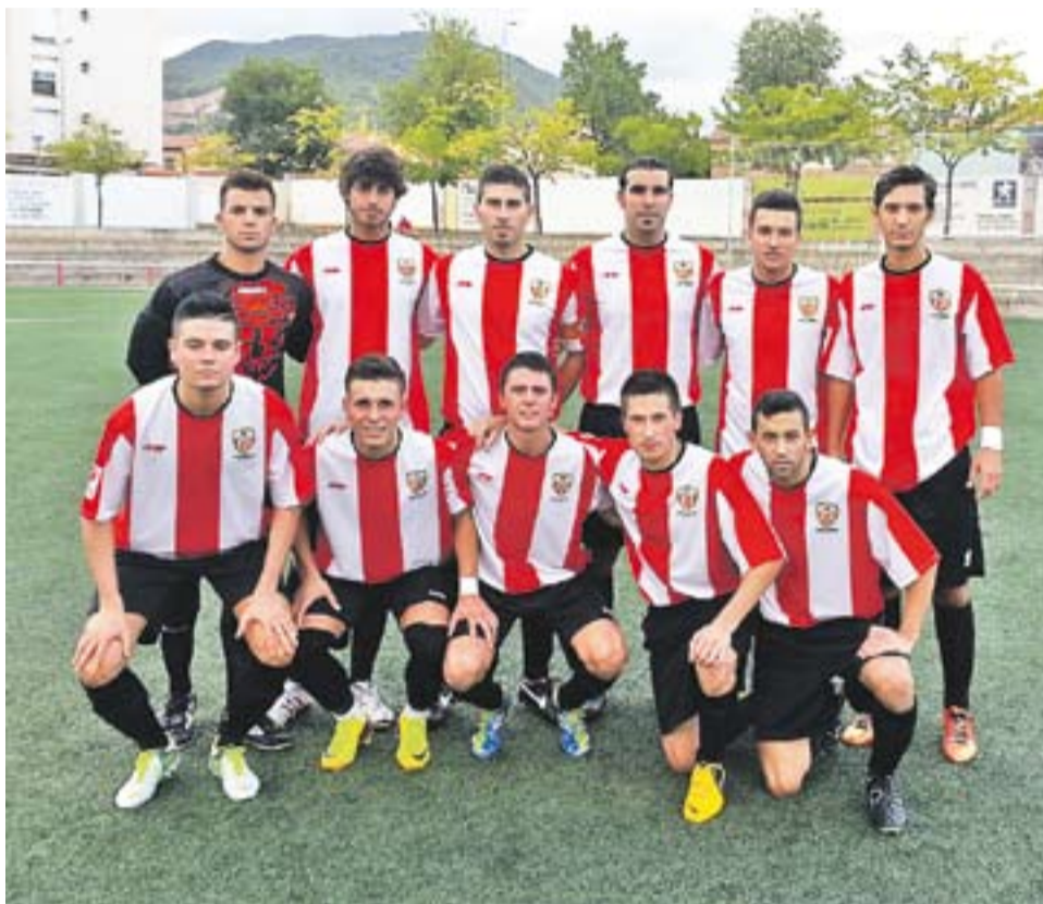
L'onze inicial que va treure Miguel Vidal aquest dimecres en el Torneig del Vallès.

L'empat del Sant Feliu de Codines va ser gairebé un miratge i el Castellar va