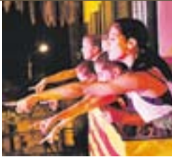
Macedònia Pregoneres de la Festa Major

"Amb una moto antiga el viatge comença molt abans, gairebé 5 mesos, perquè l'has de preparar"