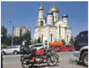
Arribada a Motegui i diverses etapes del viatge de Carles Humet i Edu Cots des de Barcelona a Tòquio