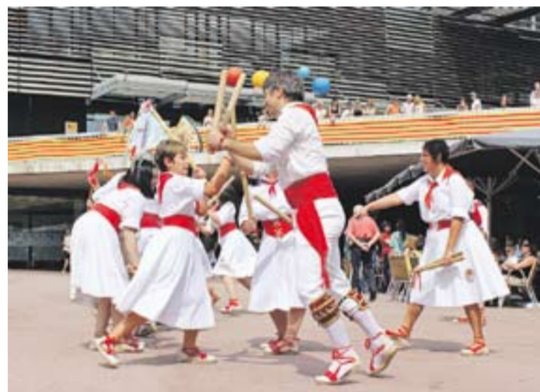
© Cercavila bastonera. || B. T.