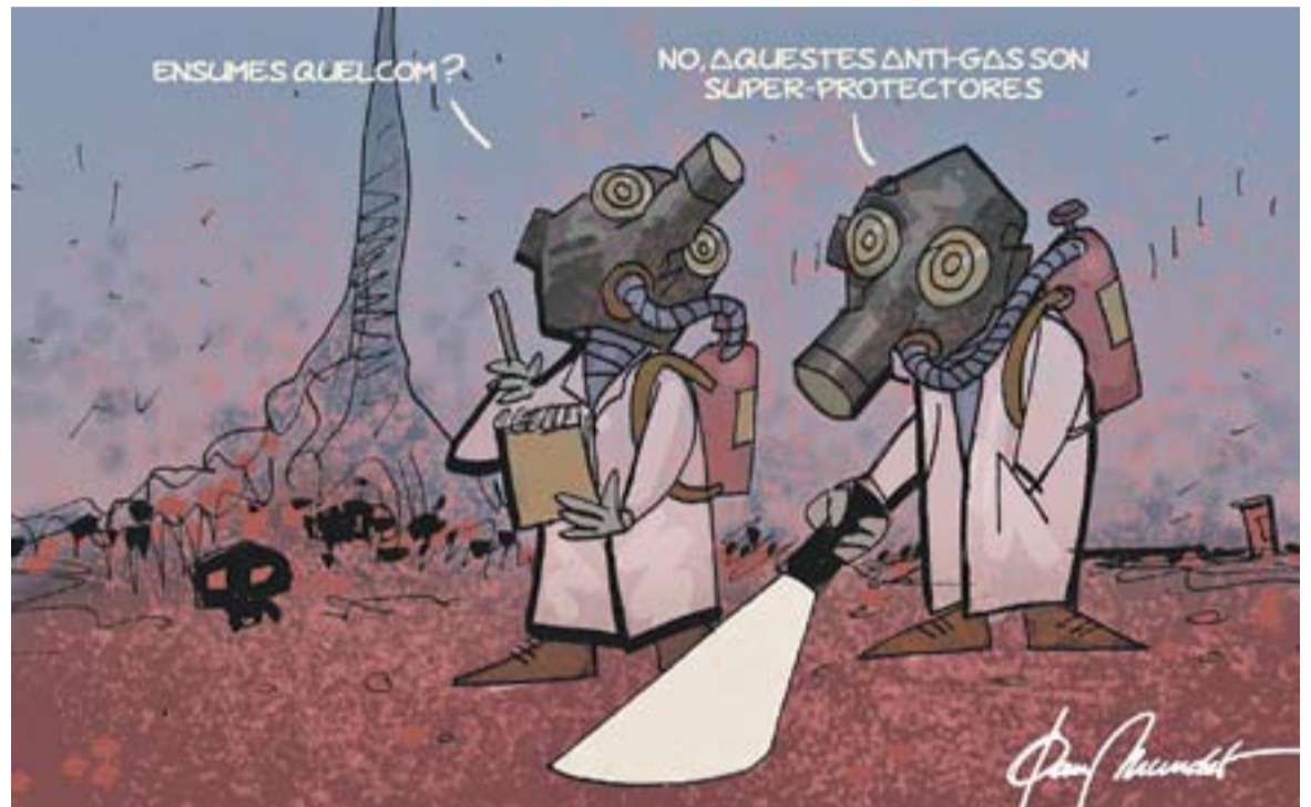
© Divendres 13. || JOAN MUNDET

exterior- van complicar la situació. L'ús de les armes no ha resolt i no resoldrà les causes profundes dels conflictes, incrementa el sofriment de la població civil, l'odi i fa retrocedir la capacitat de diàleg entre els diferents actors. Les ingerències externes tampoc solucionen els problemes interns d'un país. Poden conduir a una situació de no guerra: la història ens ensenya que no resol les causes, però les aparca momentàniament, per ressorgir més endavant - que, sovint a nivell polític i mediàtic s'interpreta com una situació de pau. Una molt probable intervenció per part dels Estats Units a Síria, sense la autorització del Consell de Seguretat de les NU i sense respectar el dret internacional - en una regió en ebullició, aportarà més incertesa, confusió, patiment i pot portar el règim a exercir represàlies contra els rebels i les poblacions en el seu afany