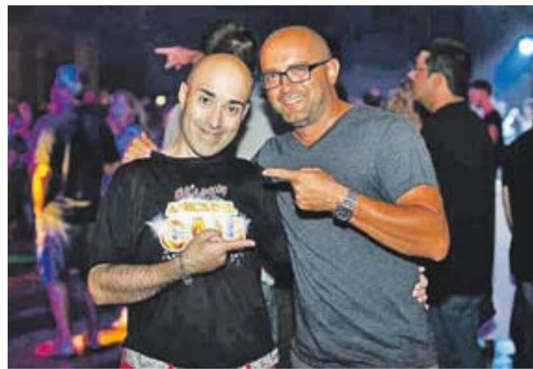
© Exitosa Festa 4a Trobada Amics dels 80's. || CEDIDA