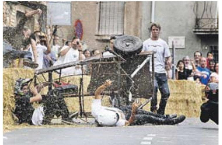
Un dels trastos accidentats durant la cursa

Per cloure l'acte, l'actriu Rosa Fitó va oferir una actuació de mitja hora al públic assistent. +