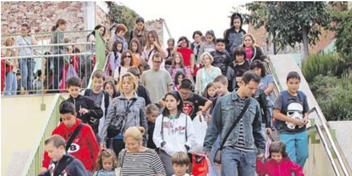
© Pares i mares acompanyen als seus fills i filles a les aules de El Sol i la Lluna en el primer dia de curs || CRISTINA DOMENE