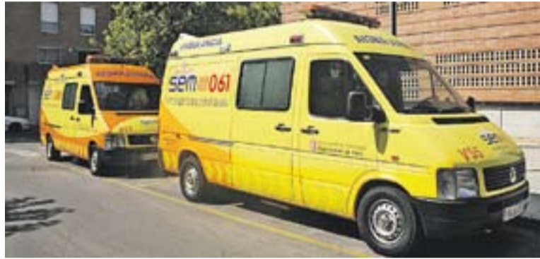
© Les ambulàncies SEM sí que van donar servei durant la vaga || L'ACTUAL

A Castellar del Vallès, el servei –ofert per Ambulàncies Lafuente– també va respectar els mínims, és a dir, les urgències. Els serveis del transport sanitari públic que es van veure afectats a la vila van ser sobretot els relacionats amb els trasllats de rehabilitació o de consultes externes programades a d'al-