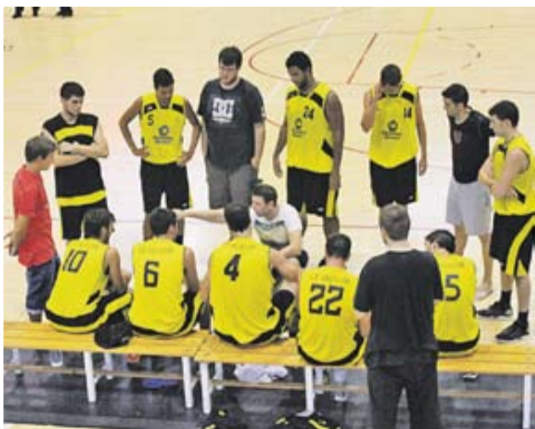
Un amistós disputat durant la pretemporada al pavelló Puigverd.

El partit es jugarà el diumenge 15 de setembre a les set de la tarda i els castellarencs no debutaran a casa fins la setmana següent, quan a la segona jornada de lliga rebran el Vendrell al pavelló Puigverd. +