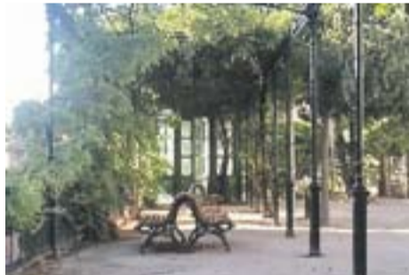
Jardins del Palau Tolrà Autor: Ousca.semese