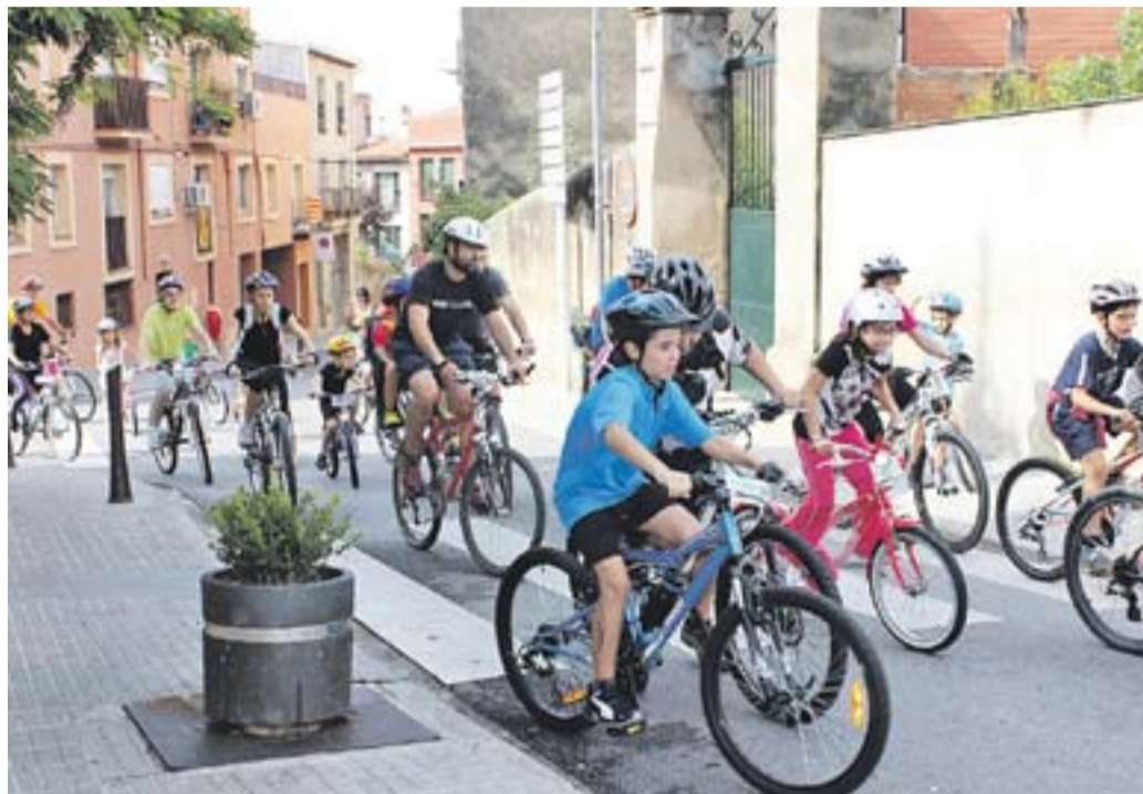
Una imatge de la bicicletada que es va fer aquest diumenge pels carrers de la vila.

Una edició més, el Club Ciclista Castellar Bike Tolrà torna a omplir la vila de bicicletes i uns 450 ciclistes van participar a la vetllada, que ja fa cinc anys que és al calendari de Festa Major