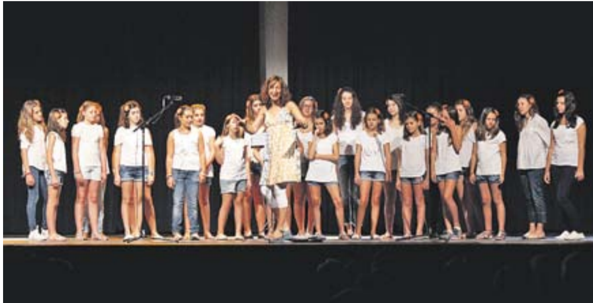
Cor infantil d'Espaiart durant el concert de Festa Major.

També s'inicien els cursos d'aprenentatge d'Arctàdia, un centre on s'ofereix formació musical, dansa, arts plàstiques i teatre jove. Els programes d'aquesta escola s'estructuren segons la franja d'edat. Petits: Ralet-ralet (nadons), sensibilització de 3 a 5 anys, als 6/7 anys: iniciació a la música, iniciació a la dansa, iniciació a les arts plàstiques i iniciació a l'instrument (dels que s'ofereixen a l'escola). Són un centre de referència en la pedagogia Suzuki en violí i violoncel (a partir dels 3 anys). Mitjans: Programa "Fem música a l'Arctàdia": Aprenentatge instrumental i llenguatge musical basat