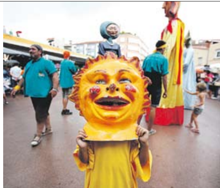
Fal·lera gegantera a la plaça Calissó i .