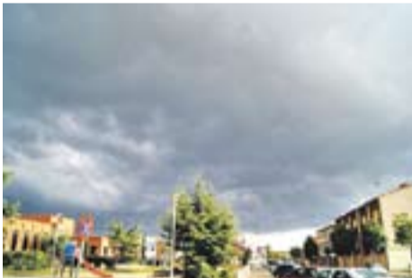
Amenança de tempesta per Festa Major

Envia'ns fotos fetes amb el mòbil: lactual@castellarvalles.cat