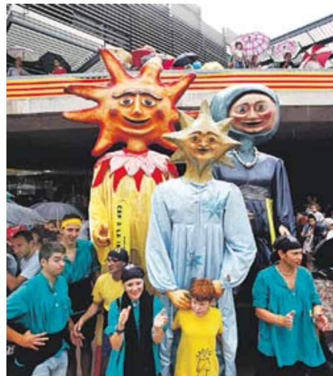
A dalt castell de focs, a baix els gegants de Castellà.

Altres activitats que van arribar al miler d'espectadors van ser els