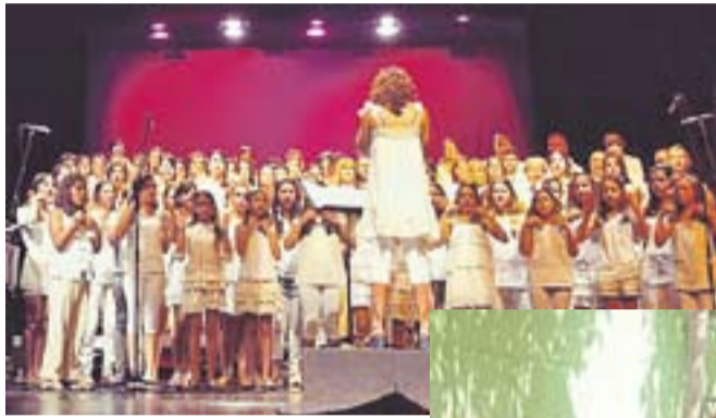
PLOUEN CANÇONS DE BROADWAY Irv_28

Els lectors de L'Actual comparteixen a través de les xarxes socials les millors instantànies de com han viscut la Festa Major