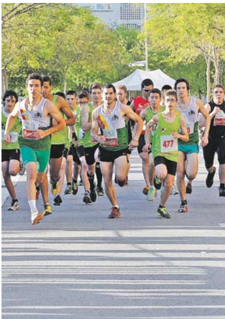
La sortida de la prova masculina de la Milla Urbana 2013.

Per escoles, 324 participants de les escoles de Castellà del Vallès van prendre part a la Milla Urbana. El Sant Esteve ha obtingut 78 punts, seguit del Bonavista amb 73. Tercera ha estat el Joan Blanquer amb 55. †