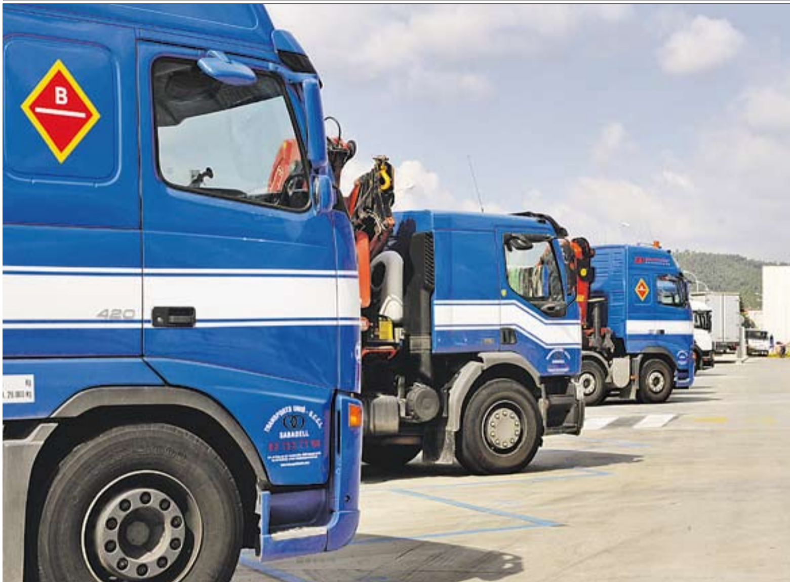
© Imatge d'arxiu de l'aparcament de camions, que va obrir les seves portes al març de l'any 2010. || J. G.