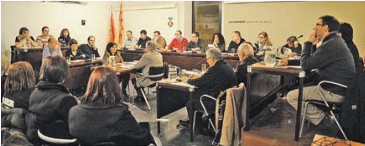
Una imatge d'arxiu del ple de l'Ajuntament de Castellà del Vallès.