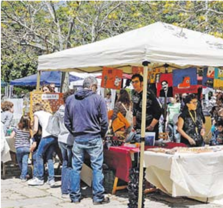
© Mercat de Primavera de Can Font i Ca N'Avellaneda 2013. || JOSEP GRAELLS

Dimecres 1 de maig, festiu arreu, les urbanitzacions de Can Font i Ca n'Avellaneda van celebrar el Mercat de Primavera de les 9 h a les 20 hores a la plaça de Can Font. "La jornada va anar molt bé, va fer molt sol i va venir molta gent", explica Roser Garró, de l'Associació de Veïns. En total, van passar pel Mercat entre 450 i 500 persones. Es van organitzar diverses activitats, com uns tallers de maquillatge i dibuix infantils, un taller de zumba i un concurs de fotos, el Segon Festival de Miniatures de Primavera, i l'acte estrella, les parades amb productes artesans. "L'afluència més gran de públic va ser al matí". Més de 100 persones van ballar country i "el ball zumba també va aplegar moltíssima gent", diu la Roser. +