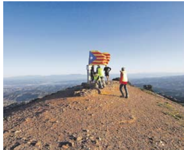
© El Montcau. Els Cinc Cims, edició 2013. || MARINA ANTÚNEZ