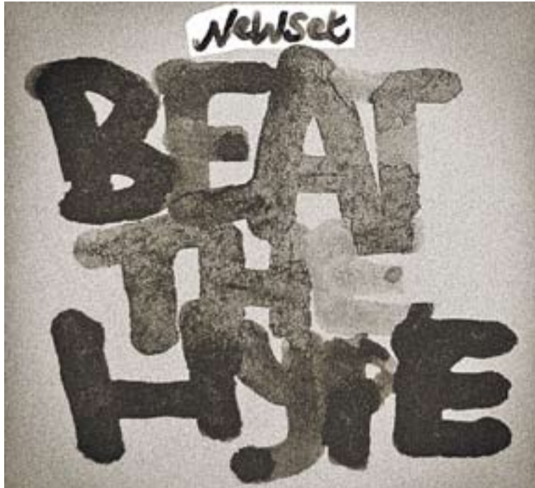
Portada del disc 'Beat The Hype', obra del castellerenc Xavi Roca.

Les lletres de Zafra són una crida a l'optimisme "però també expressen una dura crítica social al voltant dels temps d'incerte-