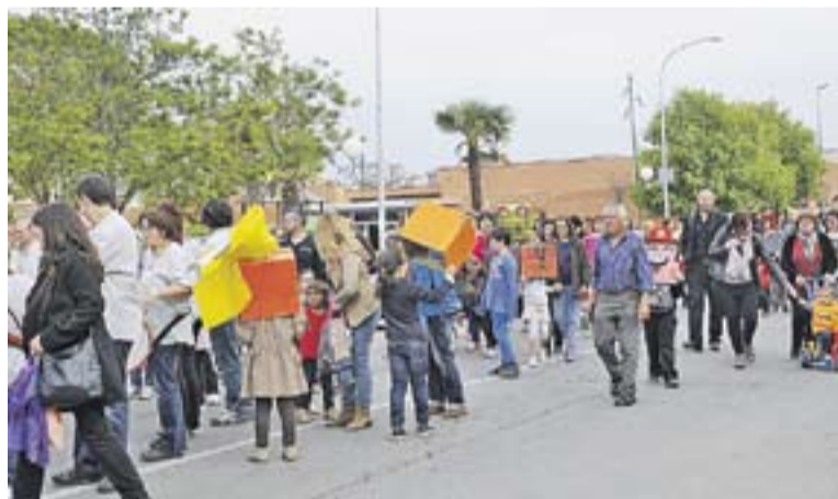
Cercavila de pares, mares i alumnes de l'escola Mestre Pla.

L'Escola Mestre Pla ha dedicat la vuitena Setmana Cultural a les tradicions catalanes. Les activitats d'aquesta proposta, que es van desenvolupar la setmana passada, van combinar tallers i activitats culturals de danses populars, castellers, capgrossos i contes, entre d'altres, amb una gran festa de cloenda divendres passat. L'origen de la Patum o la celebració de la nit de Sant Joan són alguns dels aspectes tradicionals que també s'han treballat durant aquesta iniciativa.