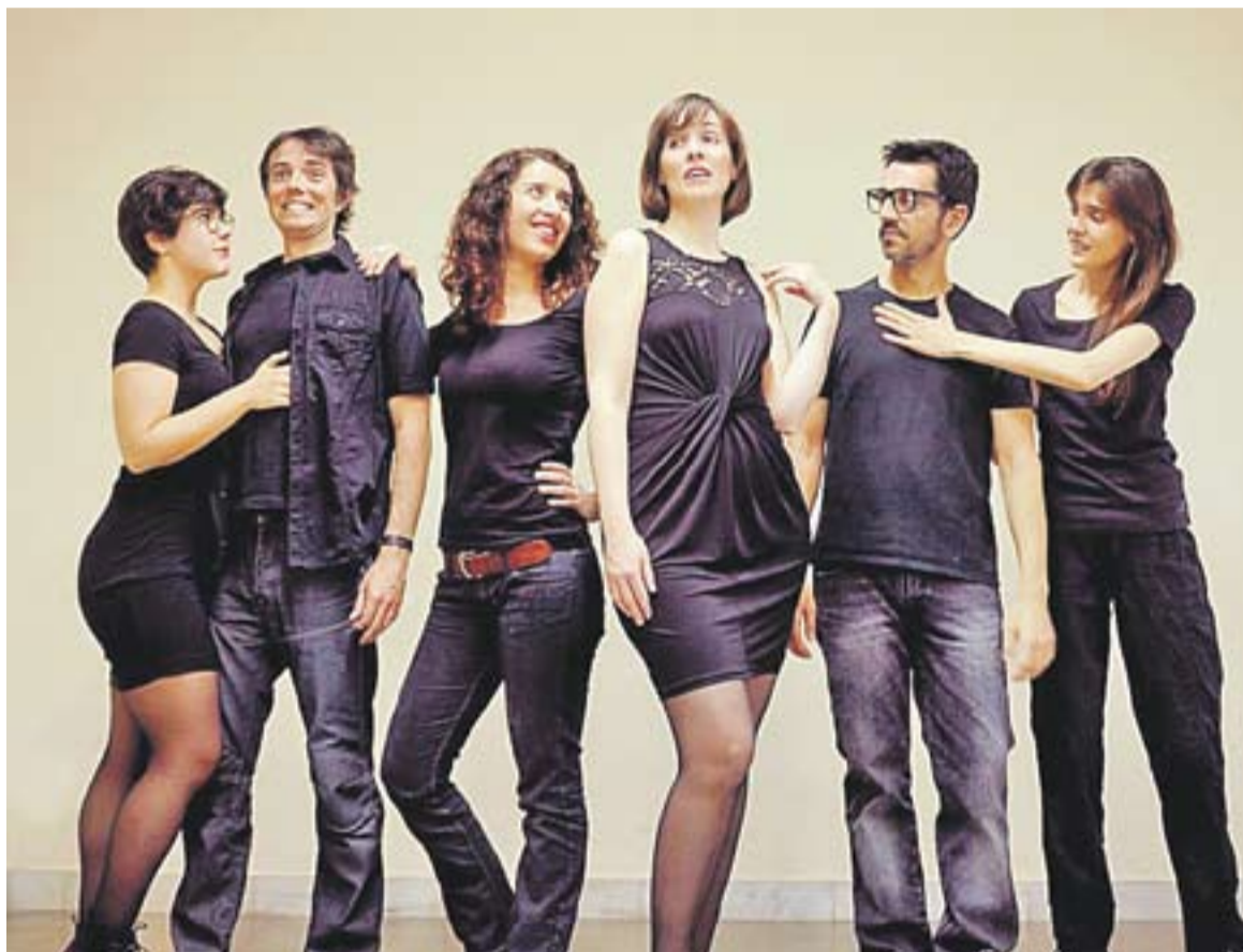
© Actors i actrius de la companyia TIPS. || CEDIDA

La companyia TIPS va néixer a Sabadell, formada per un grup de gent que volia fer alguna cosa diferent del que es feia a nivell de teatre en aquell moment a la ciutat. "Ens diem TIPS perquè érem