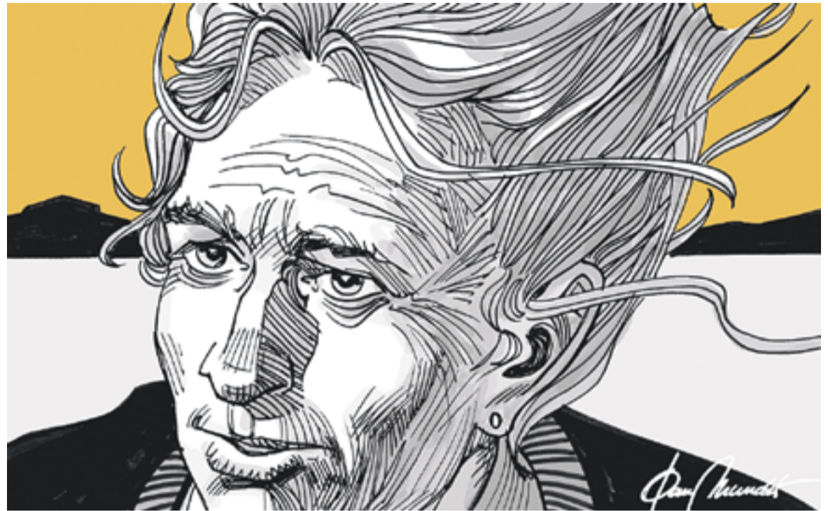
© Horitzons Il·lunyan. || JOAN MUNDET

bert que les coses no són tan fàcils com ens pensàvem i que les previsions de futur no deixen de ser això, previsions. La jubilació ha esdevingut un concepte difús, flexible i poc fiable. L'horitzó somiat dels 65 anys com a límit de l'activitat laboral i porta oberta a l'esperat descans s'ha fos. La meta s'allunya uns metres fins a situar-se als 67 anys. Dos anys, dos anys que poden ser molt o poc dependents del plaer que ens proporciona la nostra professió, l'estat físic, la salut... l'economia!