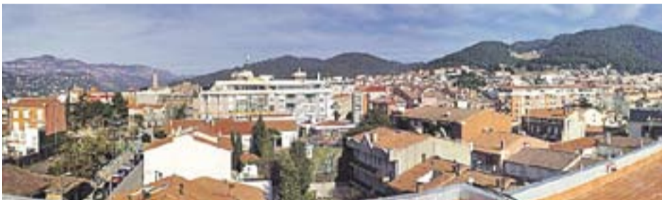
La Mola i el Puig Autor: Jordi Béjar

Envia'ns fotos fetes amb el mòbil: lactual@castellarvalles.cat