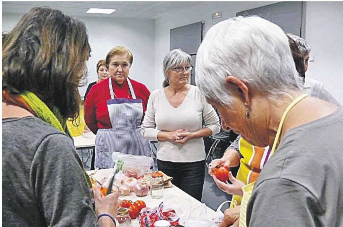
Imatge d'un taller de conserves dolces i salades com el que es farà aquest maig a El Mirador.

A més de les activitats puntuals, al llarg de tot el mes es podran visitar tres exposicions, dues a l'Espai Sales d'El Mirador i una tercera que s'ubicarà al Mercat Municipal. Així, del 6 al 31 de maig, El Mirador acollirà les mostres "Varietats locals d'horta 2013", a