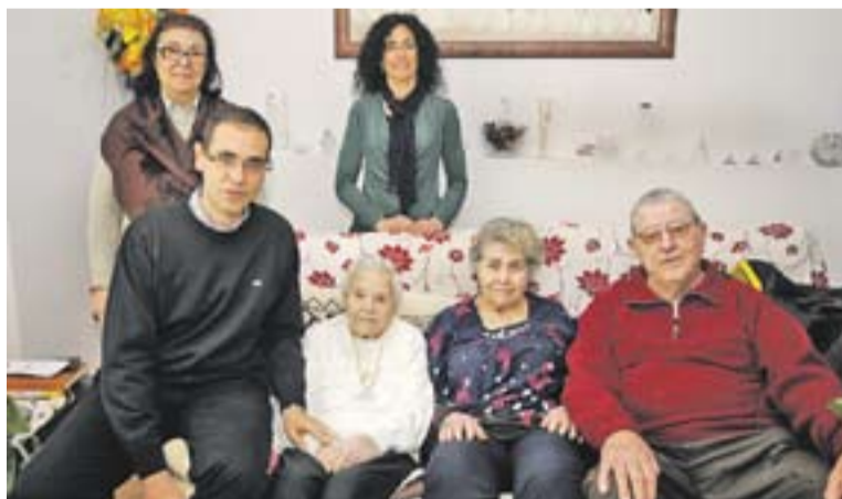
La Rosa, amb la medalla centenària acompanyada per la filla i el gendre

Tot i trobar-se bé, la seva mobilitat és molt reduïda. per això, tant la Rosa com la filla i el gendre han guanyat en qualitat de vida gràcies a una cadira puja-escales. “Abans havia