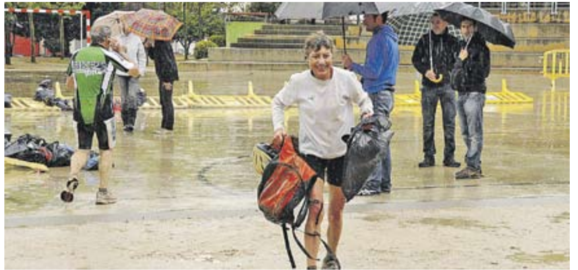
Participants després d'acabar el triatló organitzat per Sige dissabte. La pluja va endurir encara més la prova.

També al pavelló Puigverd, després es va celebrar un sopar, que va anar des d'amanides a carn a la brasa. Gratuït pels voluntaris del triatló, el sopar va tenir al voltant de cinquanta assistents. Tots aquells cossos espectaculars, que