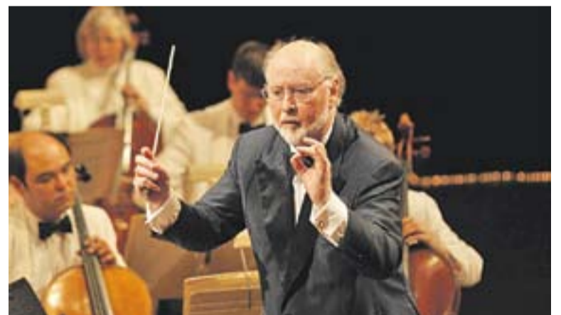
© John Williams serà homenatjat per Orquest:art.

musical per les bandes sonores més emblemàtiques de John Williams. D'aquesta manera, es vol commemorar la música d'aquest cèlebre compositor: Al concert es podran escoltar bandes sonores tan conegudes com: 'Jaws', 'Harry Potter' o 'Star Wars', entre d'altres. +