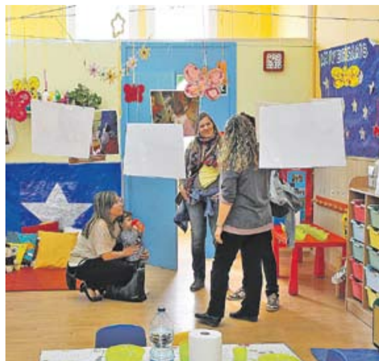
Jornada de portes obertes a l'escola bressol El Coral.

MÒDUL DE JARDINERIA || El proper dilluns s'ha programat una jornada de portes obertes i una reunió