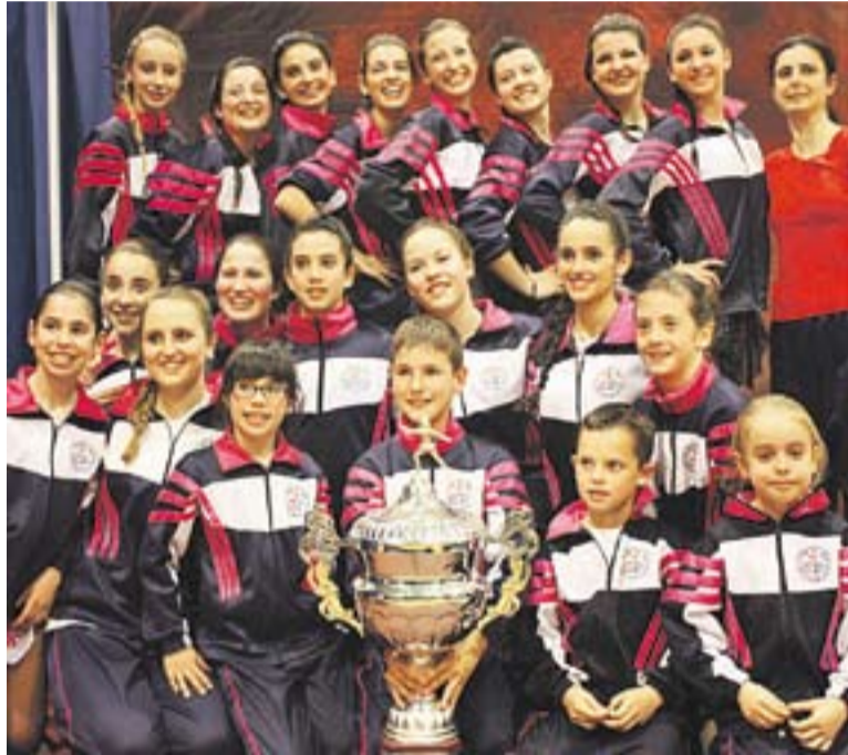
El Castellar ha aconseguit la vuitena victòria de la temporada a casa.

L'expedició castellarenca estava formada per 25 integrants i l'equip tècnic, que es fa concentrar a Meze des del dijous. Durant el cap de setmana, dividits en categoria, van defensar els programes que havien estat assajant durant els últims mesos. La bona actuació de tots els membres van permetre assolir uns resultats excel·lents i tornar cap a Castellar amb un merescut premi. ➔