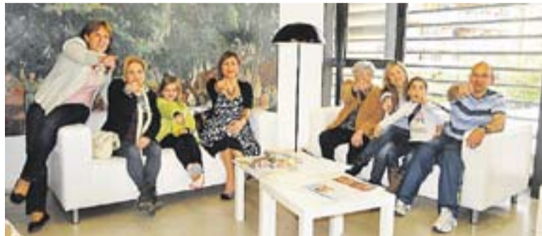
Imatge del grup de l'entitat Castellar X Colòmbia que participa al concurs.

Les bases del concurs a les que Castellar X Colòmbia i tots els participants s'han hagut de cenyir són: el tema, sobre 'Mi generación'; que