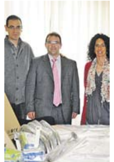
L'alcalde i la regidora de Serveis Socials amb un responsable d'ANIA.