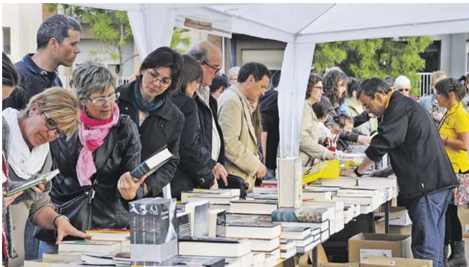
Centenars de castellarencs van passar per la fira de Sant Jordi que per segon any es va establir a la plaça d'El Mirador.