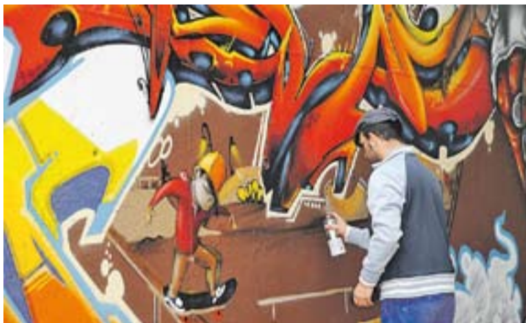
© Moment del Castellar Urban Festival celebrada aquest cap de setmana. || J.G.

Curiosament, les editorials catalanes són les que més interès mostren per aquests nous formats, perquè poden arribar a més públic i la inversió és menor. Són fàcils de transcriure en altres idiomes. "I de moment, es venen més a Mèxic i als Estats Units que a Espanya. I ara per Sant Jordi hem penjat la versió catalana, que ja es pot descarregar en línia" . +