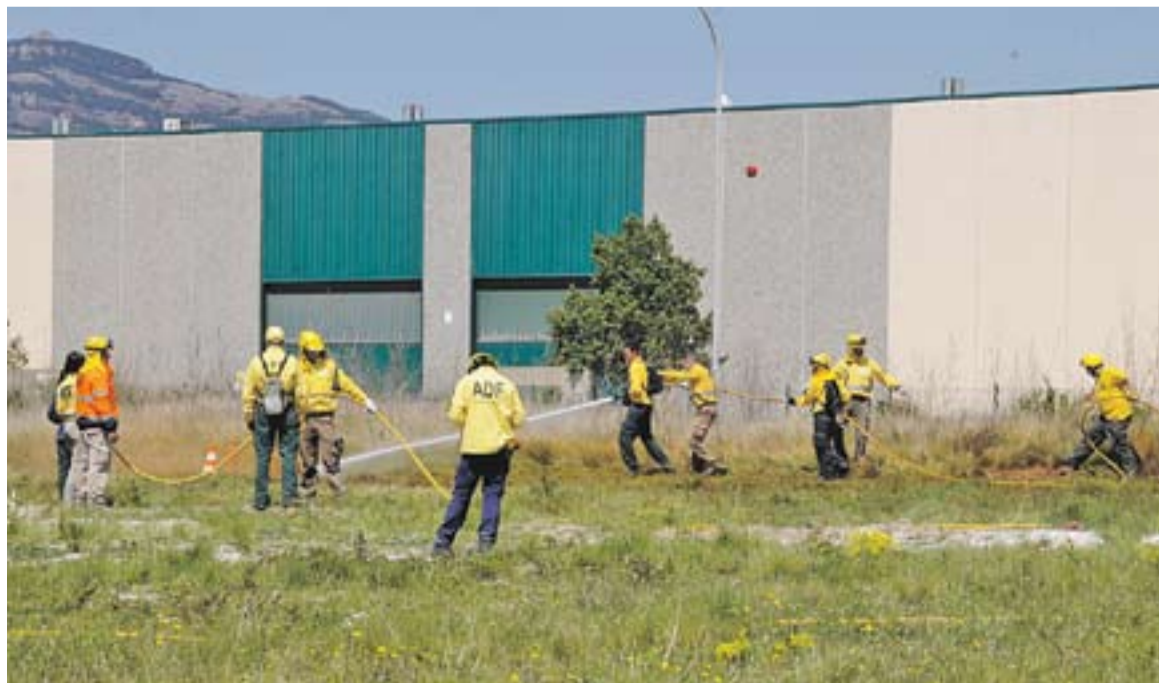
© Voluntaris de la Federació d'ADF del Vallès Occidental a les jornades pràctiques, diumenge passat || JOSEP GRAELLS

El Parc de Bombers acull jornades de formació teòriques i pràctiques per a situacions d'emergència pels ADF de la comarca. A la trobada que va tenir lloc el cap de setmana passat, organitzada per l'ADF de Castellar i la Federació d'ADF del Vallès, van participar 120 agents. Dissabte passat els continguts teòrics van centrar la formació de la jornada, amb xerrades sobre cartografia, primers auxilis i estructura legal i de funcionament de l'ADF. L'endemà va ser el moment d'aplicar els coneixements adquirits al Parc de Bombers amb pràctiques d'estesa i recollida de mànegues, aspiració amb motobomba, i proves cartogràfiques. “És una formació imprescindible que ajudarà als ADF a saber com actuar durant l'estiu en situacions d'emergència” , explica Josep Casajuana, cap de Bombers Voluntaris de Castellar.