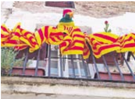
Bon Sant Jordi Autor: Carme Padrisa

Envia'ns fotos fetes amb el mòbil: lactual@castellarvalles.cat