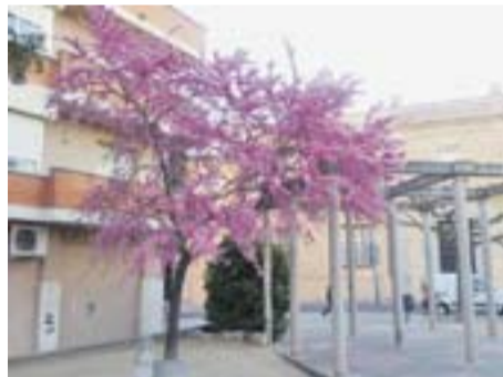
La primavera a Castellar Autor: José Zaguirre