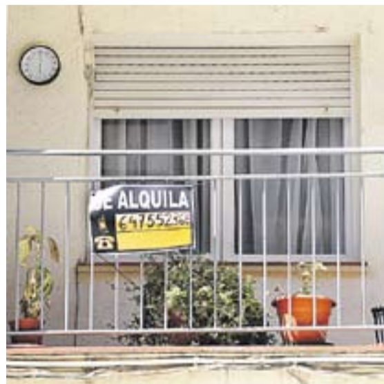
Pisos de Castellar que estan en lloguer en aquests moments.

La Borsa de Mediació és un servei adherit a la Xarxa per al Lloguer Social d'Habitatges de la Generalitat que permet posar en contacte propietaris i llogaters. El servei ofereix als propietaris