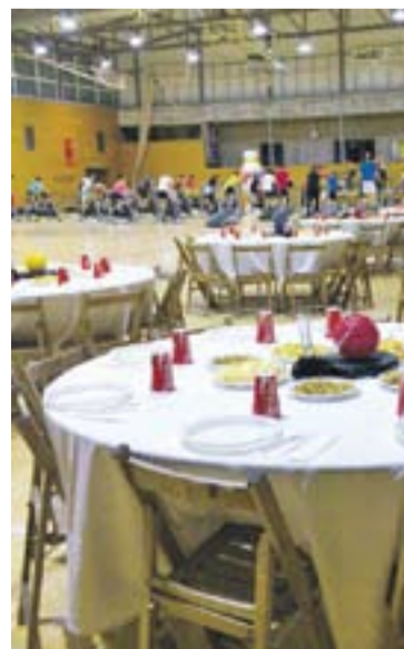
El Puigverd, divendres passat.

Dissabte 20, les celebracions van continuar amb un campionat de volei platja i un circuit d'alta intensitat 'cross fit'.