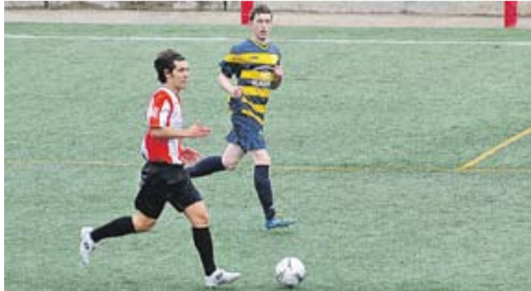
El Castellar ha aconseguit la vuitena victòria de la temporada a casa.