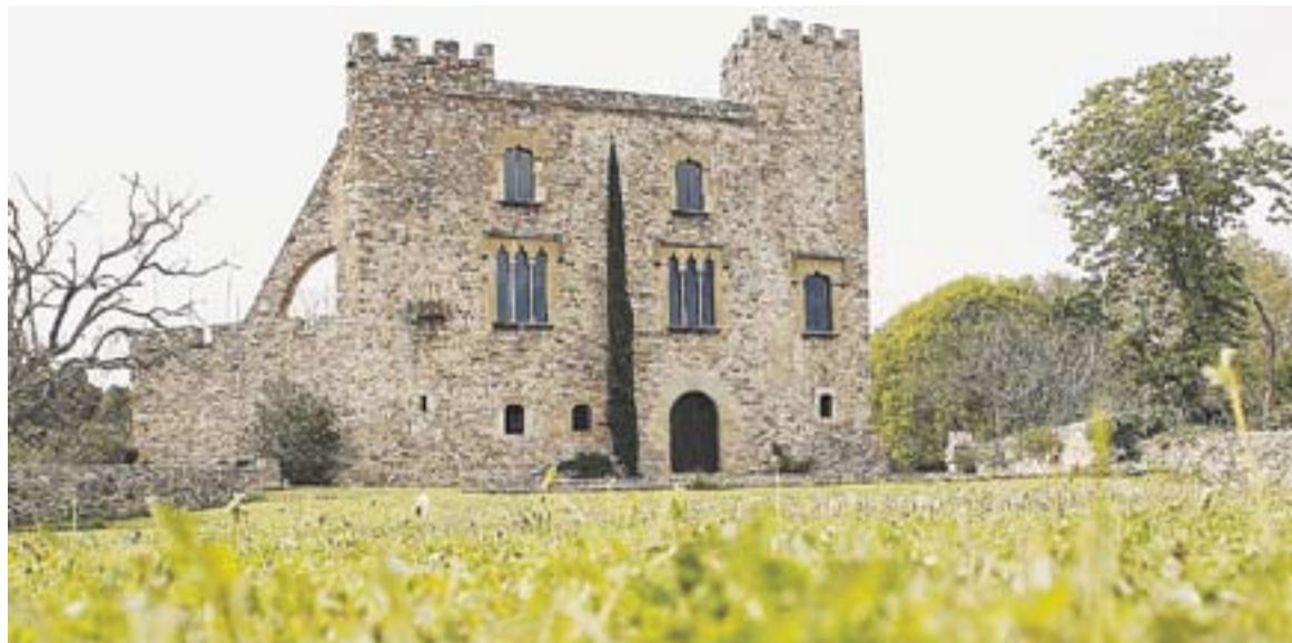
© Imatge recent del castell de Clasquerí.