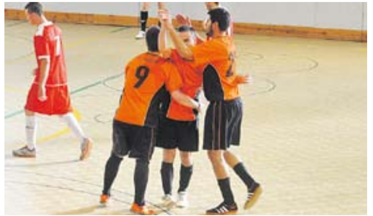
Un dels gols del FS Castellar marcats dissabte al Joaquim Blume.

tres jornades sense perdre. "Hem d'intentar quedar el millor possible, tenim molts equips amb pocs punts per sota nostre i si no competim fins al final baixarem moltes posicions" , assegura el tècnic. +