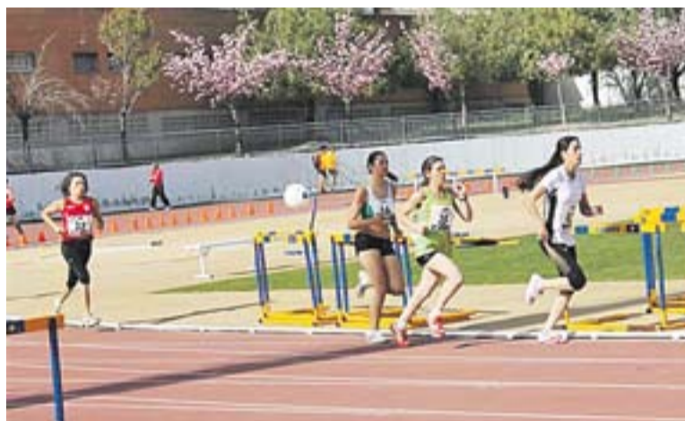
La resolució de la Lliga Catalana haurà d'esperar al 5 de maig.

de 4'21.32. També va ser destacable la marca de Garcia, Fernández, Gómez i Sansano en els 4x100 masculins amb un temps de 44'81, superats per només quatre clubs en una prova molt competitiva.