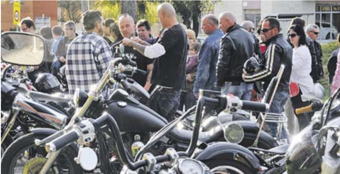
Dues imatges de diumenge passat a la ja popular trobada de motos i cotxes.

Les exhibicions de motos custom i cotxes americans protagonitzen una trobada multitudinària durant tot el cap de setmana passat