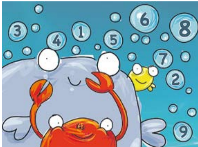
© Mob i Dic, creats per Alfons Freire || ÀVIA PEPA © JOMA. MOB © ALFONS FREIRE.

torial, és un treball d'investigació, més que una eina pedagògica. "Intentem descobrir les possibilitats de les noves tecnologies de cara als llibres infantils" .