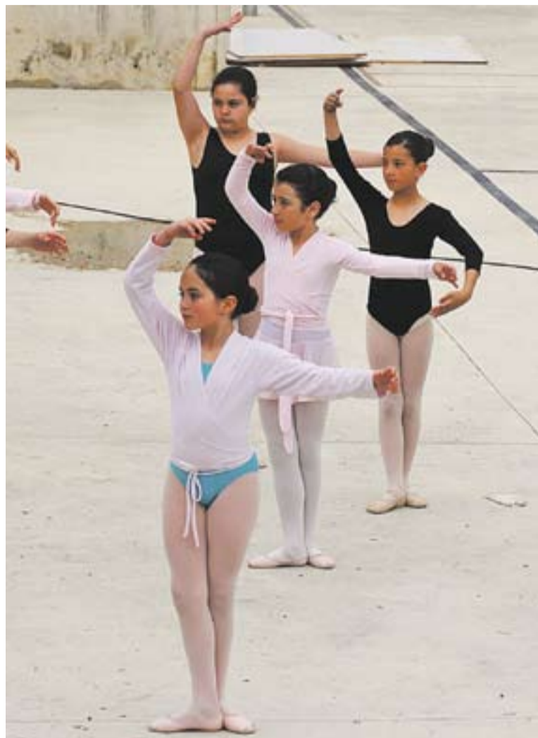
Moment de l'acte de celebració del Dia Mundial de la Dansa, l'any 2011.

MOTIU DE L'EFEMÈRIDE || El 29 d'abril se celebra el Dia Internacional de la Dansa (DID). El Comitè Internacional de Dansa de la UNESCO proposa aquesta data per commemorar el naixement de Jean-Georges Noverre (29 d'abril de 1727), considerat el pare del ballet modern. Cada any el DID converteix la dansa en la gran protagonista, reconeixent i recolzant l'esforç constant de totes aquelles persones que fan que la dansa sigui un fet i no només un somni. El DID també vol aproximar la dansa a tothom. Al llarg dels anys, l'APdC ha organitzat activitats de caire festiu amb el propòsit de fer-ne màxima difusió a través dels mitjans de comunicació i aconseguir sensibilitzar la ciutadania. ✦