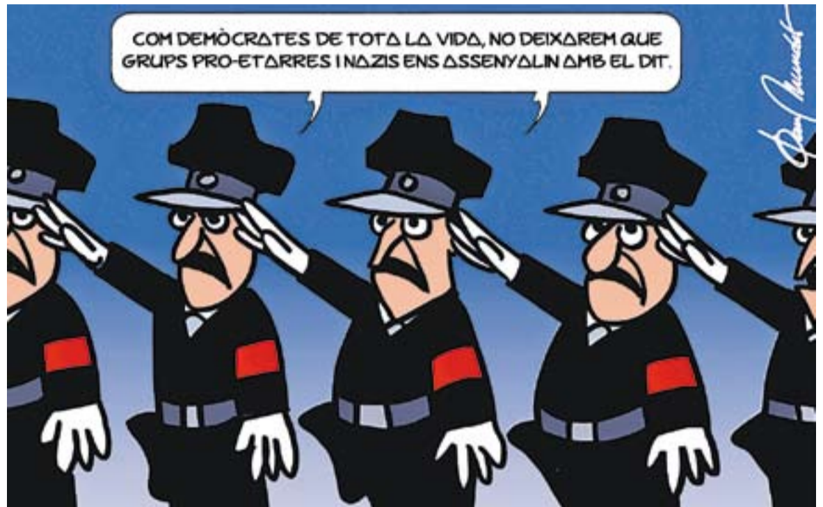
© Nova democràcia. || JOAN MUNDET

Les comparacions ja havien arribat amb l'escrache com a forma de protesta amb tot tipus de connexions proetarres, inspiracions nazis, pràctiques assetjadores i altres actituds pròpies del més cruel dels càstigs medievals. I el cert és que dirigir-se al polític de torn a cop d'insult a la porta de casa o davant la seva feina no sembla el millor dels arguments, però d'aquí a in-