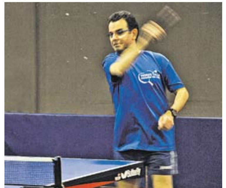
Els castellarencs en un partit a casa jugat a l'Espai Tolrà.