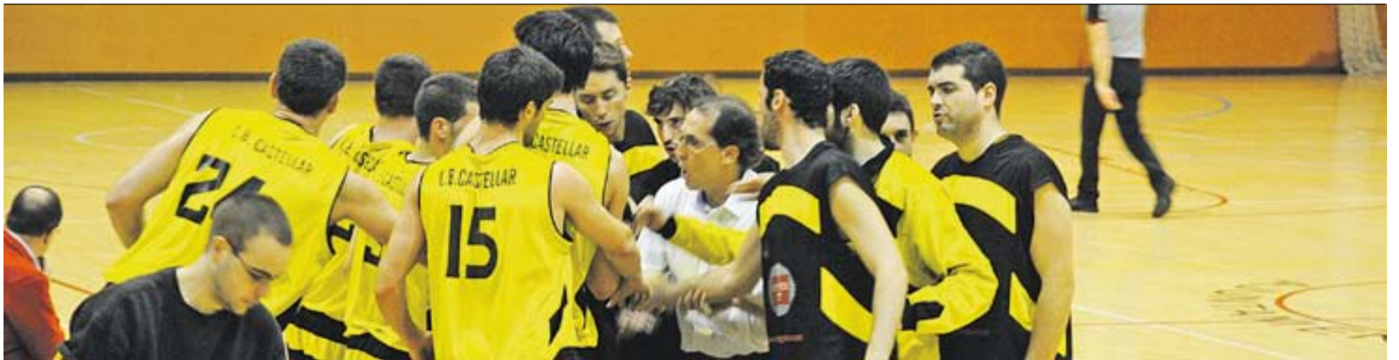
Els castellarencs en un temps mort en el partit contra el Roser, detonant de la mala ratxa de partits que han encadenat.

Marc Márquez, que va establir un nou rècord de precocitat a la categoria reina: es va convertir en el pilot més jove a guanyar una cursa i també a fer la pole position. Márquez i Lorenzo dominen la classificació amb 8 punts més que Pedrosa.