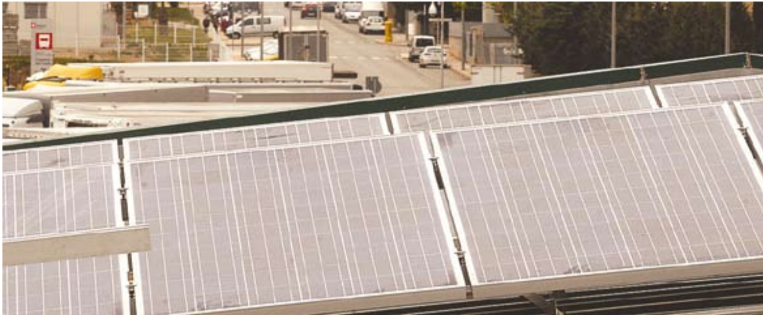
Plaques solars de la coberta de les dependències de Via Pública.

Les plaques solars instal·lades a tres edificis municipals van cobrir el 73% del consum energètic durant el primer any de funcionament