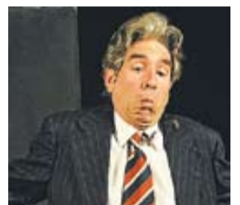
2008: Claret Clown