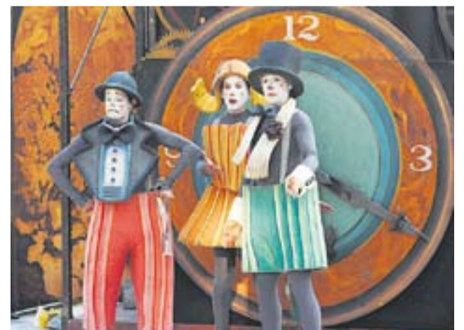
2013: Cia. La Tal

Aquest any 2013, en una divertida deliberació al voltant d'una taula, entre acudits, raonaments i rialles, tal com correspon a un inigualable jurat de pallassos, s'ha atorgat el Sabatot Alegre a la Cia. La Tal. La trajectòria d'aquesta companyia és llarga, excepcional i de qualitat, aspectes que hem pogut comprovar repetidament a la nostra vila.