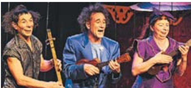
2009: Los Excéntricos