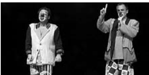
2005: Companyia Ínfima la Puça

El Sabatot Alegre és una figura de terracota creada per l'artista i artesà Joan Mundet, i representa una sabata de pallasso.