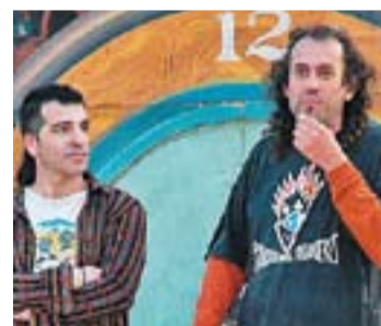
2007: Pallassos sense Fronteres