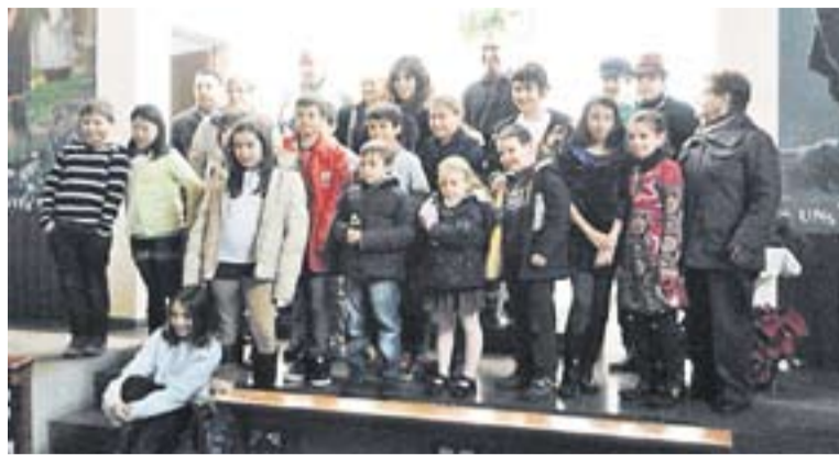
⊙ Premis del 70è Concurs de Pessebres.

⊙ Es lliuran els premis del 70è Concurs de Pessebres