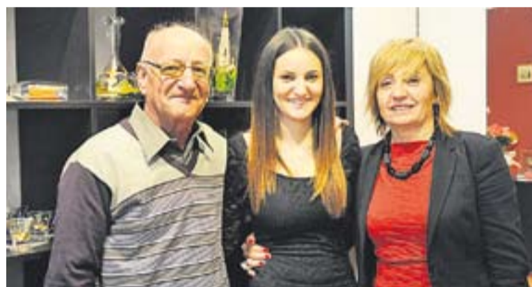
© Dos negocis que s'han iniciat aquest any: Sweet Photo i Nualart. || J. G.-C. CANOVAS