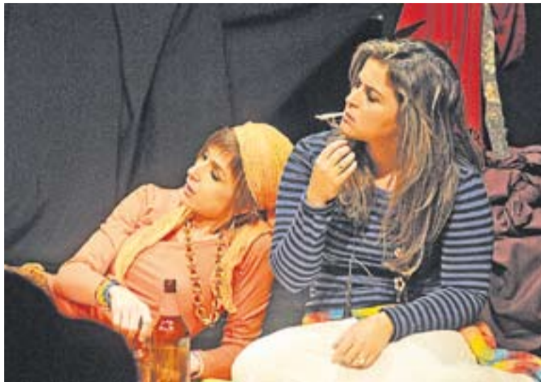
Moment de la representació 'Dona havia de ser!'.

Les actrius del muntatge, dirigides per Marina Antúnez, van oferir un total de set esquetxos on, des de diferents perspectives, mostraven el caràcter de la dona d'avui i d'ahir. El primer esquetx, titulat 'El mort' girava al voltant d'un difunt, home. Diversos personatges femenins li feien la darrera visita, un cop aquest ja era mort: l'amant, la dona, una boja i un esperit del cementiri. El segon esquetx, 'La desgraciada', tenia com a protagonista una dona vella, amargada, que havia decidit deixar el marit i fill plantats per iniciar una nova vida en un poblet del pirineu. El tercer, una escena on una psicòloga rebia la visita d'unes pacients ben peculiars: una 'pija', una dona bipolar i una policia. L'obra seguia amb una escena titulada 'El tren', on dues dones acabarien maquinant l'assassinat dels