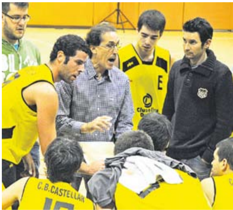
Els castellarencs en un temps mort en un partit casa.

fins a la sisena posició de la classificació de Copa Catalunya, i és la primera vegada a la temporada que aconseguen un balanç de dues victòries més que de derrotes a la taula -vuit triomfs per sis derrotes-. La primera setmana jugaran a la pista del Vic.