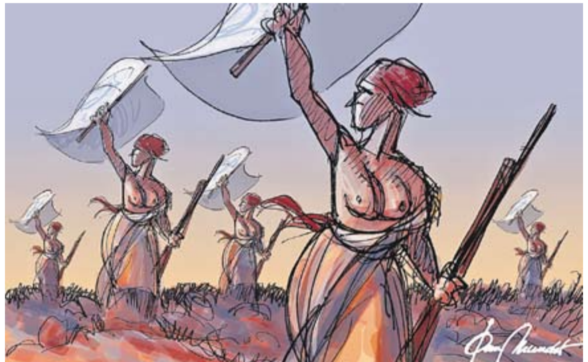
© Qui no té por. || JOAN MUNDET

L'episcopat francès ha donat un suport molt mesurat a aquesta manifestació. El president de la conferència episcopal francesa ha dit ue ell no hi aniria però que potser aniria a saludar els manifestants. Vaig pensar que aquesta postura, aparentment progressista, és més sibil·lina que la bel·ligerància manifestada del Rouco. Si la laïcitat sempre havia estat bandera dels moviments d'esquerra, aquests dies he vist com els lepenistes feien seva la defensa de