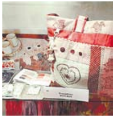
Creacions amb teles Dispatchmon || R.F.

En un context econòmic complicat, l'empresa castellanca està creixent, gràcies, en part, a la seva expansió internacional. "Anem creixent, lluitant contra les adversitats. Ja distribuïm a quinze països, entre els quals n'hi ha d'Amèrica del Nord, Amèrica del Sud i Austràlia. A Europa, vam començar per Catalunya, Espanya, de seguida amb França i ara també despatxem al Regne unit, Alemanya, Itàlia i Països Baixos" .