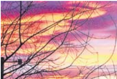
Cel de Castellar.Capvespre

Envia'ns fotos fetes amb el mòbil: lactual@castellarvalles.cat