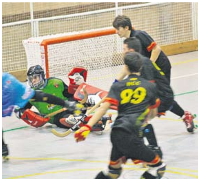
© És una de les victòries més importants que han aconseguit fins ara. || HCC

DERROTA DE L'ALEVÍ || Primera derrota de la temporada de l'aleví A de l'HC Castellar a la pista del GEiEG