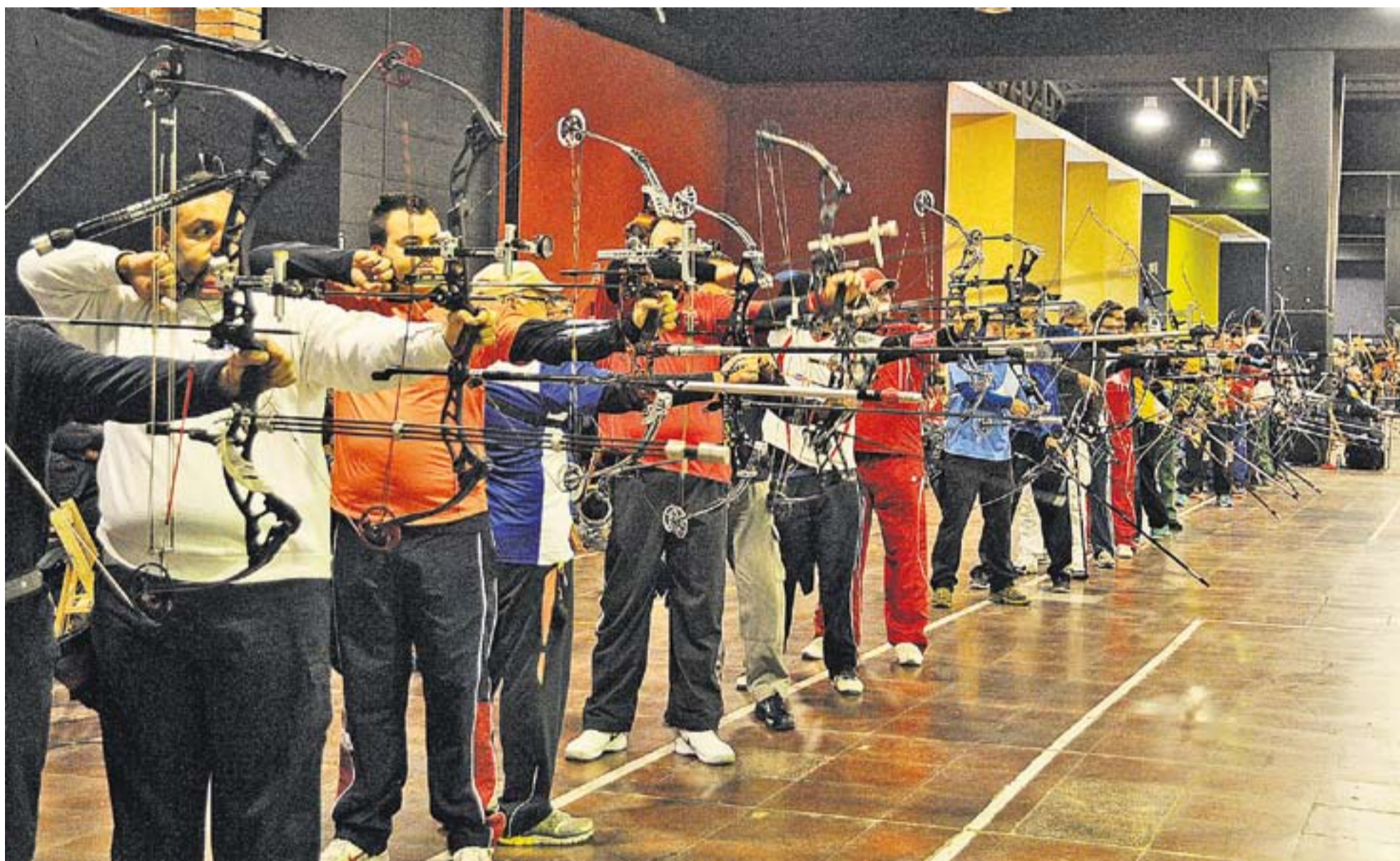
Gràcies a les dimensions de l'Espai Tolrà, els campionats de Catalunya de tir amb arc 'indoor' van poder comptar amb 192 participants, rècord absolut de participació d'aquesta disciplina.

El tir amb arc bat rècord de participants a l'Espai Tolrà