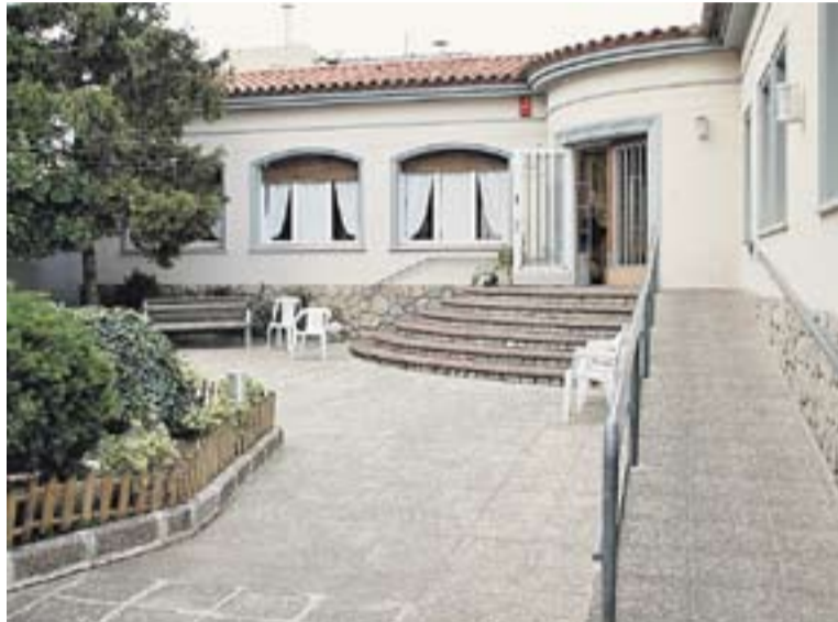
⊕ Entrada principal de l'OSB. || JAVI LÓPEZ

comptes del centre obeeixen al fet que les despeses per al seu funcionament ordinari són més altes que els ingressos corrents per prestació de serveis, que procedeixen quasi exclusivament de les tarifes de concertació pública de 70 places de residència amb l'Institut Català d'Assistència i Serveis Socials.