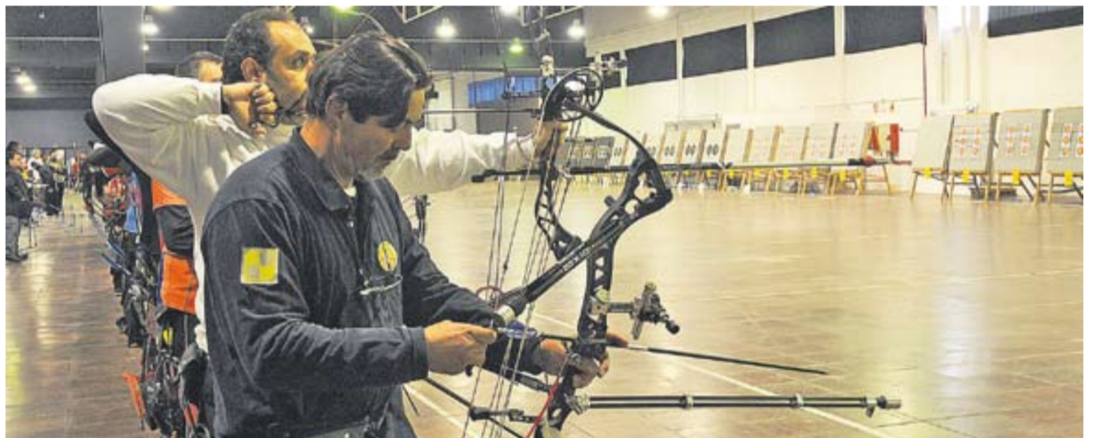
Els arquers es van concentrar durant tota la jornada de diumenge al matí a l'Espai Tolrà per participar en diversos campionats de l'especialitat.

A més d'això, la Federació també està estudiant la possibilitat de celebrar curssets d'iniciació per als nens de Castellar del Vallès.