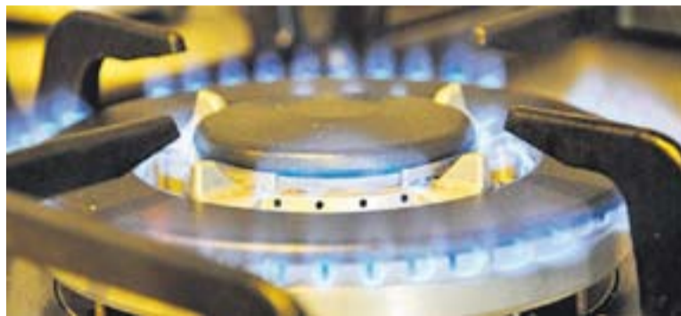
© Les flames han de ser de color blau i mantenir-se estables || C.D.

El CO és tòxic perquè quan entra al cos impedeix que la sang porti oxigen a les cèl·lules, teixits i òrgans. Com que és difícil de detectar, pot causar danys greus, o fins i tot la mort, si s'inhalava durant un llarg període de temps. És per això que des de la Regidoria de Protecció Civil s'han elaborat diverses recomanacions a tenir en compte durant aquesta època de l'any. D'una banda, s'explica