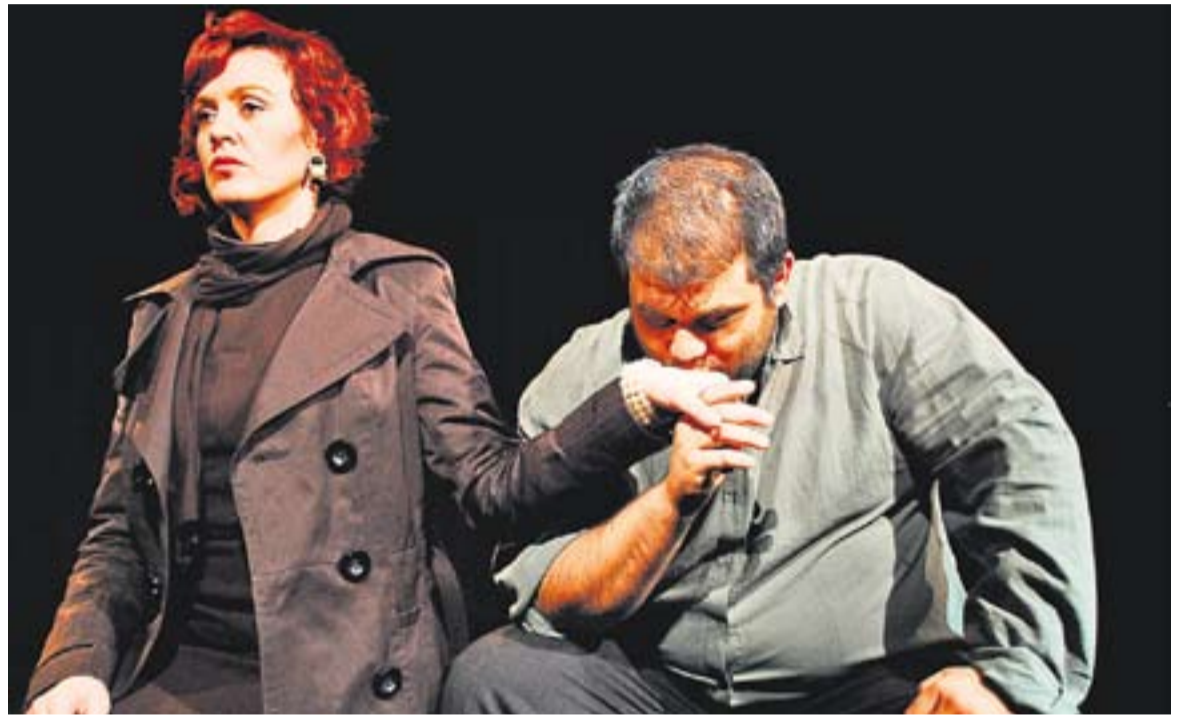
Moment de l'obra d'El Ciervo Teatro 'La visita de la vella dama'.

L'argument se situa en el petit i empobrit poble de Güllen, que deixa enrere la seva tranquil·litat habitual amb l'arribada de la multimilionària Clara Zachanassian, que ofereix 1.000 milions als veïns i al poble. Imposa una condició macabra que desembocarà en una creixent desconfiança entre els habitants de la població. +