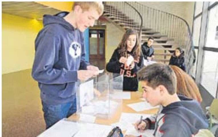
Un moment de la votació a l'Institut Castellar dimarts passat.

El consell escolar d'un centre educatiu és un òrgan de govern, de consulta, de decisió, de gestió i de participació. Així, a través del consell s'avalua el funcionament del centre, s'aprova i s'actualitza el règim intern, s'aprova el projecte de pressupost i la