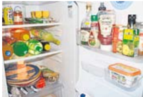
Nevera plena Autor: Javi Barbosa