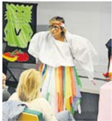
© Rosa Fité, conta contes || ARXIU

Amb el títol Un Pessic de contes podrem gaudir de les peripècies d'en Roger a l'hora d'arreglar-se l'habitació, o del dia que a en Mi-