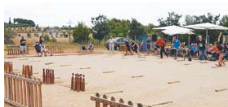
La superfície de bitlles a la zona del Parc de Colobres.