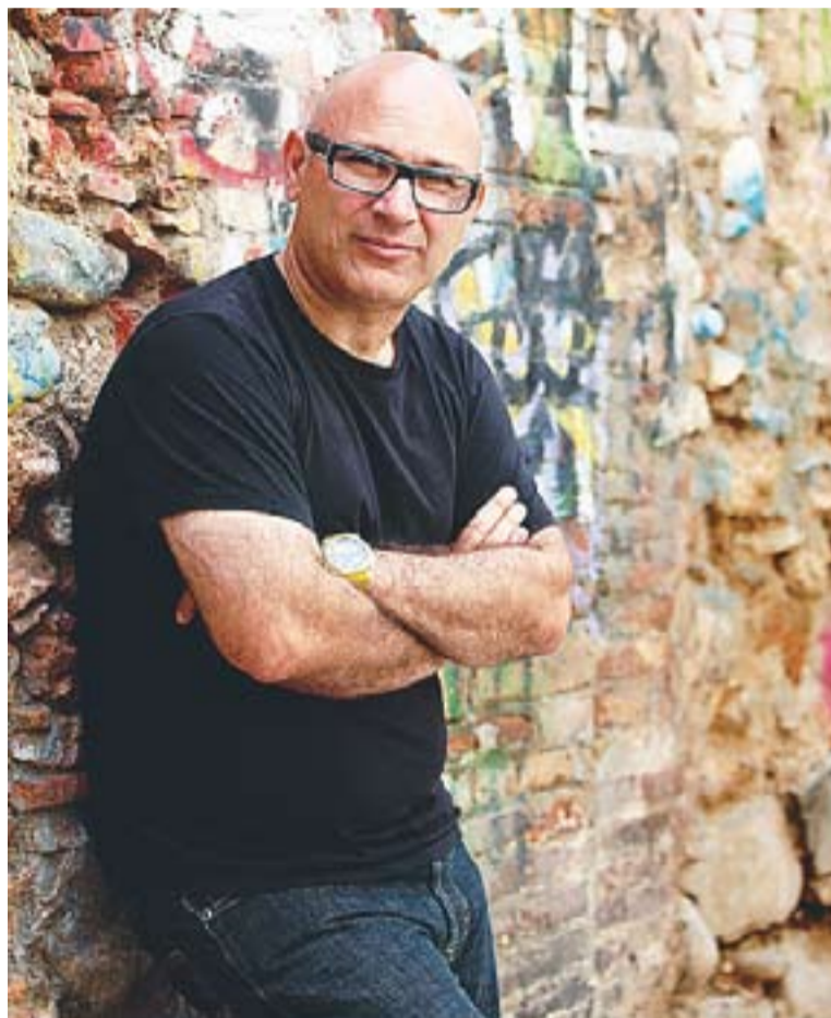
© Santi Baró (Olesa de Montserrat, 1965) és l'autor de 'Tres en ratlla'.

Recrea les 24 hores del dia que el Parlament de Catalunya ha de votar la llei per a una declaració per a la independència. Hi apareixen diferents escenaris: La Moncloa de Madrid, el Parlament, la casa del president, la ca-