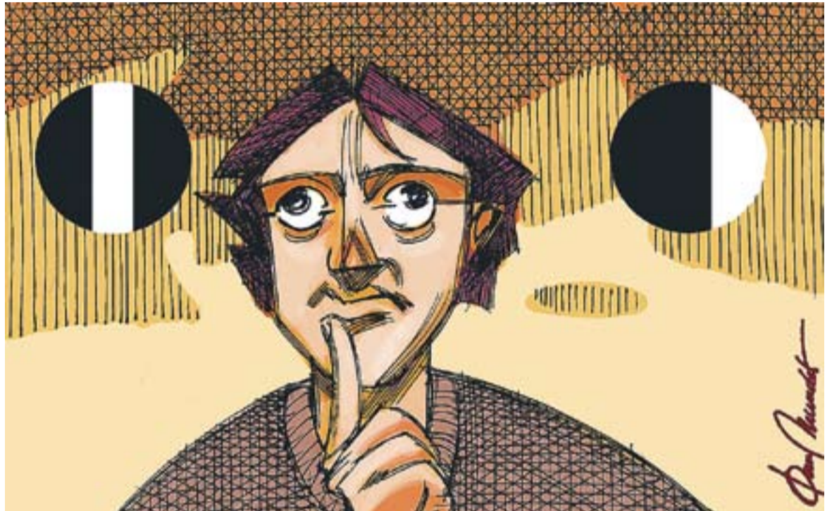
© Jornada partida o intensiva. || JOAN MUNDET

tant no hi ha cap disminució del nombre d'hores que els alumnes fan de les diferents matèries educatives. Cal recordar també que la implantació és provisional i per a un any, i no entenc la desqualificació i el tractament mediàtic que en fa la fundació, menyspreant sense coneixement de causa i de forma massa precipitada els beneficis i per descomptat alguns "handicap" que aquesta jornada pot significar, pels alumnes i per les seves famílies. És cert que una de les premisses en la qual se sustenta la bondat de la jornada intensiva es basava en el fet que els adolescents podien passar més temps amb les famílies i així contribuir a millorar les relacions entre pares i fills. Quan tant el pare com la mare tre-