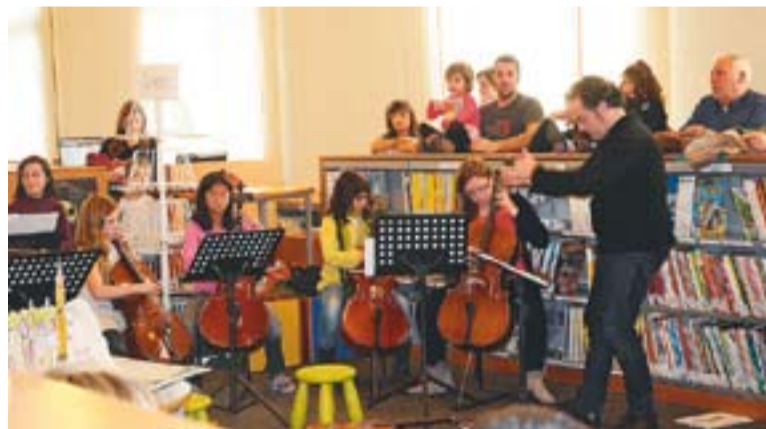
Una de les audicions que l'alumnat d'Arctàdia va oferir a la Biblioteca.

El Centre de formació, creació i producció artística Arctàdia ha programat, pel proper 19 de desembre, una audició de Nadal de guitarra, guitarra elèctrica, baix, trompeta, bateria i combo, a les 18.30 h a la Sala de Petit Format oberta a tothom. El dia 22 de desembre, a les 12 h a la Capella de Montserrat es durà a terme el Concert de Nades dels Petits de l'Arctàdia i a les 18 h a la Sala de Petit Format, audició de violí, violoncel i flauta travessera i. ✦