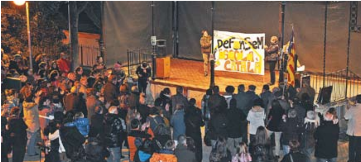
Concentració a Palau Tolrà convocada per Somescola.cat en protesta de la reforma educativa de la LOMCE.