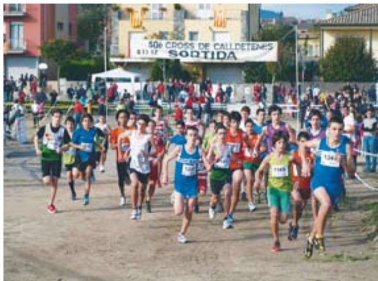
Una de les curses de cros que s'han fet aquesta temporada.

La representació castellarenca va ser d'uns 40 atletes, que van fer uns bons resultats tenint en compte el nivell d'aquesta competició. Les millors posicions van arribar a la categoria prebenjamí, amb una dotzena posició de Laia Arderius i Marc Bertran en les categories femenina i masculina respectivament. Arderius va quedar només una posició per davant de Xiaodan Avellaneda, també del