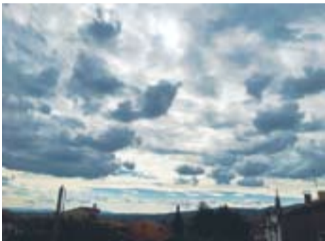
Cel ennuolat Autor: José Zaguirre

Envia'ns fotos fetes amb el mòbil: lactual@castellarvalles.cat