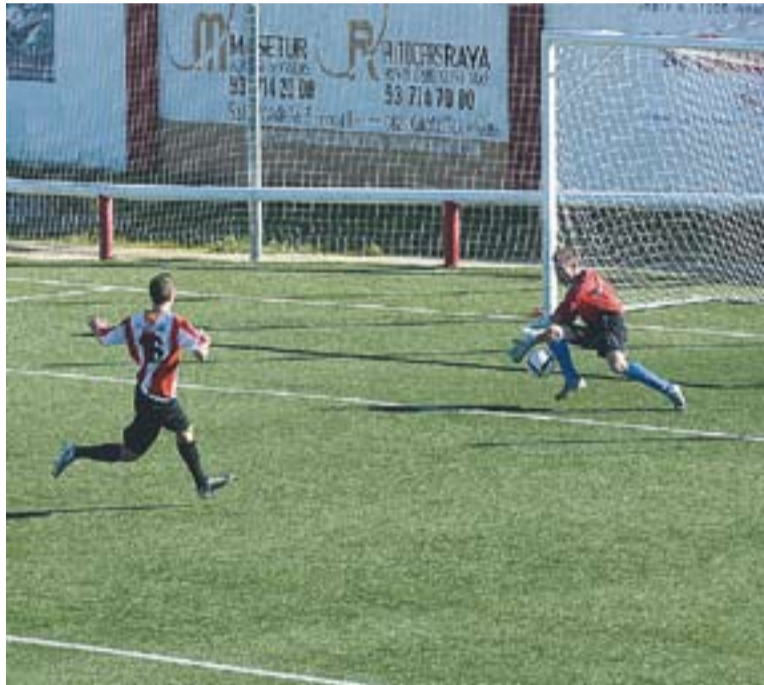
© Una ocasió de la Unió Esportiva en un partit a casa. || JOSEP GRAELLS

Abans de finalitzar l'any jugaran al camp del Canovelles, un equip en hores baixes. Els del Vallès Oriental tanquen la classificació del grup amb només cinc punts en 13 jornades. +