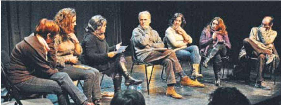
© Tertúlia poètica amb Miquel Desclot al centre, a la Sala de Petit Format de l'Ateneu. || JOSEP GRAELLS

ALTRES ACTES POÈTICS || A més dels actes Desclot, també dimecres 12 va tenir lloc una tertúlia literària al voltant, en aquest cas, de l'obra d'Haruki Murakami Kafka a la platja i dijous es van llegir textos de Pere Calders. +