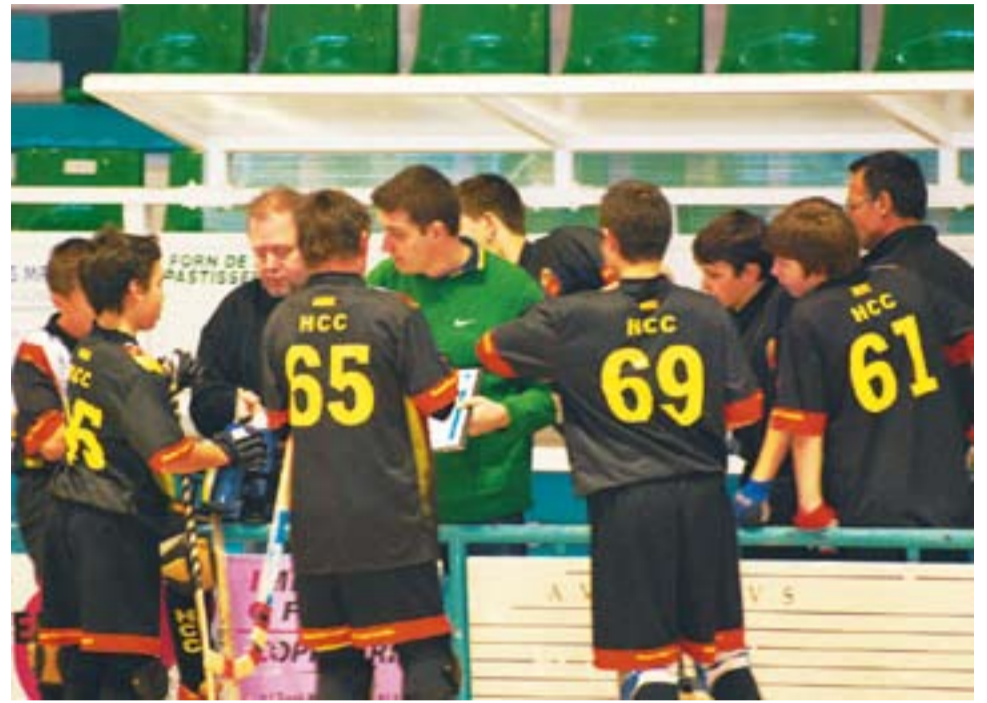
L'aleví està format per jugadors de primer i segon any que mai havien jugat tots junts.