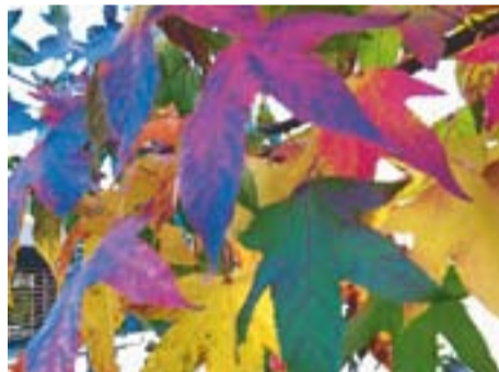
Tardor Autor: Carme Padrissa