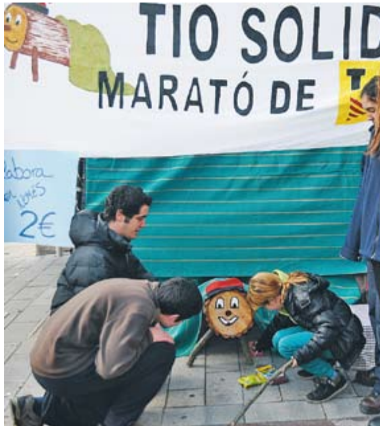
© A la fira de Sant Esteve ja es van fer activitats per a la Marató, com cagar el tío. || J. G.

Un dels punts neuràlgics per fer donatius serà la plaça del Mercat, on diumenge 16, al matí, se succeiran diverses actuacions. Tot i això, al llarg de tot el cap de setmana també hi haurà moltes més activitats en altres espais on la ciutadania tindrà l'oportunitat de fer els seus donatius. "Tenim d'exhibicions de ball, tenim totes les corals involucrades, el corociero, també música tradicio-