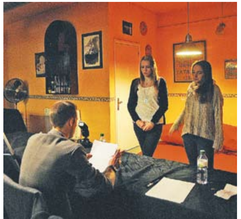
Moment del càsting de 'Bad night', dilluns passat.

La idea d'aquests joves castellarencs és que Bad night es pugui veure a El Mirador i presentar el film en algun festival. +