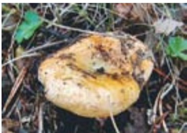
Rovelló o vinader Lactarius sanguifluus

Si les pluges continuen, les gelades arribaran al gener. "Això vol dir que al desembre encara tindrem bolets, que aniran sortint aquí i allà si plou". Siscart diu també que "a l'alta muntanya, les gelades faren que la temporada s'acabi abans". +