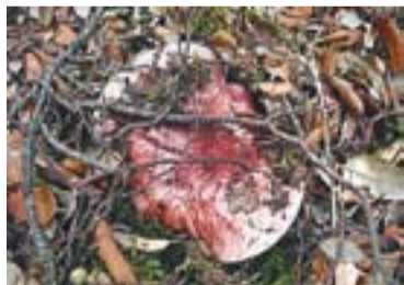
Carlet Hygrophorus russula

També anomenat esclata-sang, el rovelló és un bolet mediterrani, de textura carnosa i ferma i amb làtex de color vinós. Creix a les pinedes i és molt similar al rovelló pinetell ( Lactarius deliciosus ), tot i que el vinader és més apreciat organolèpticament. És molt usat a la cuina i també és habitual trobar-ne en conserva.