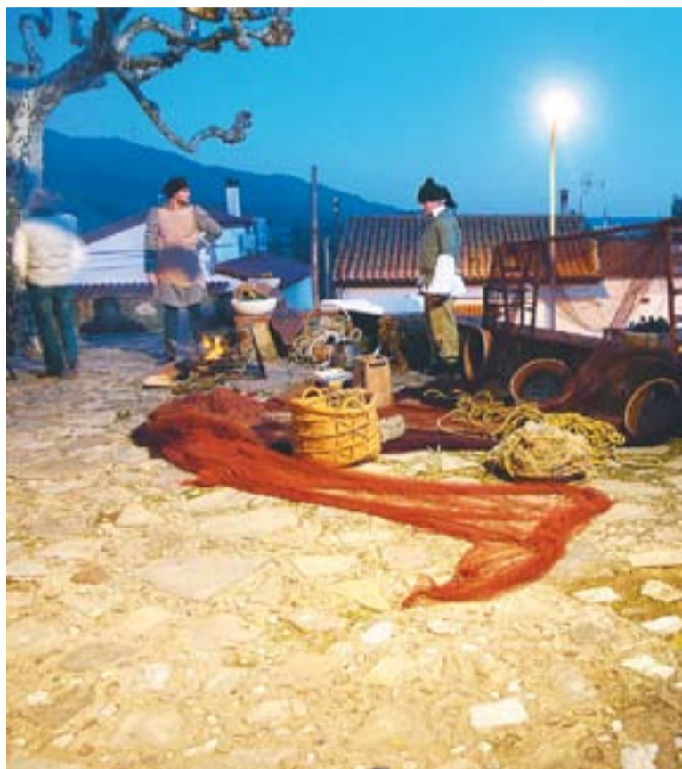
El pessebre vivent de Sant Feliu del Racó de l'any passat.

novetats d'enguany serà el concert d'homenatge a l'escriptor castellà Miquel Desclot amb la participació d'Artcàdia i la coral Sant Esteve, i sota la direcció de Josep Vila Casañas, director de l'Orfeó Català, el 23 de desembre a l'Auditori Municipal. El mateix dia 23 de desembre el Teatret de Colònies i Esplai serà l'escenari d'un concert de la coral inclusiva Pas a Pas, formada per persones amb discapacitat procedents de diverses entitats de la vila.