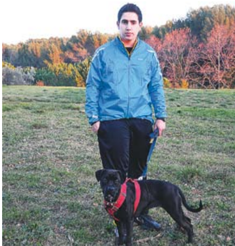
El passejador de gossos amb la Pruna al Parc de Colobrers. || JOSEP GRAELLS

Cuenca té com a principal avantatge que li agraden els gossos i va ser el seu entorn familiar i d'amics que el van animar a emprendre la iniciativa. "De fet, la meva germana em va dir que si m'hi llançava, el primer gos que tindrà seria la seva gossai així va ser", assegura el jove. Ha obert una pàgina al Facebook ( http://www.facebook.com/passejador.de-