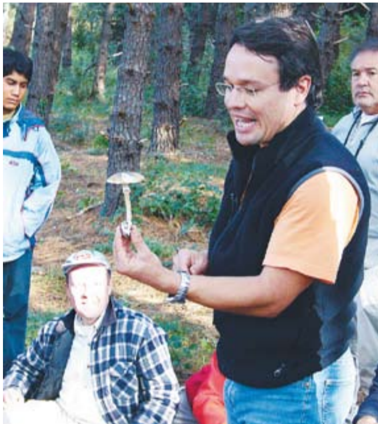
© Dani Siscart explica les característiques del bolet als aficionats. || L'ACTUAL

"Molts fongs viuen de l'arrel de la planta, que els proporciona