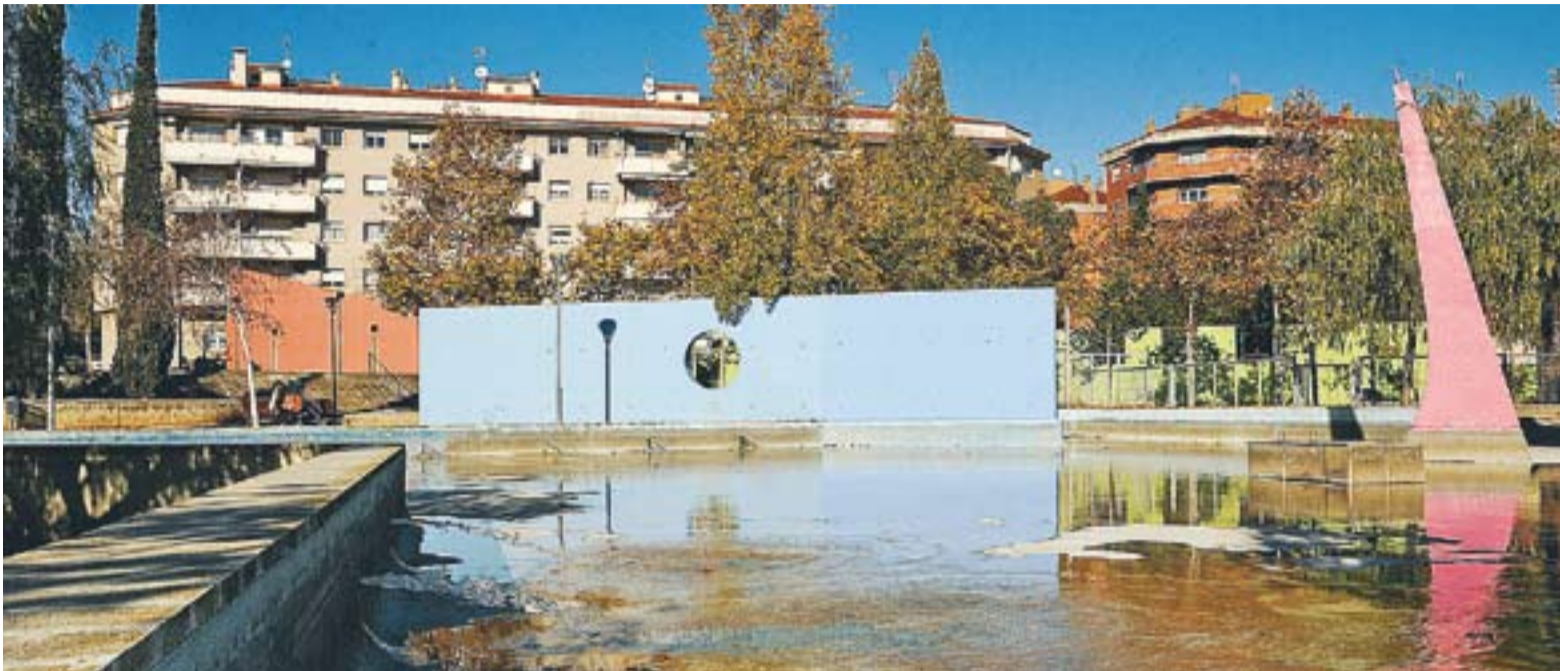
La bassa de la Plaça Catalunya es va començar a omplir dimecres dia 5, després d'unes setmanes d'obres d'arranjament.