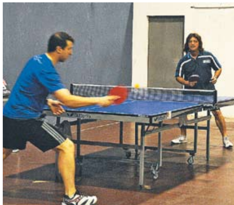
Una acció d'un partit.

D'altra banda el segon equip va perdre per un ajustat 3-4 contra un rival directe, el Parets. Les partides individuals van finalitzar-se amb empat a tres en el marcador global i l'enfrontament es va decidir en els dobles, en què Gordon i Larocca van caure per 1-3. Els castellarencs són quarts del seu grup a Tercera Divisió. +