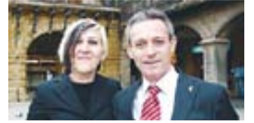
© Roig amb Josep Anglada, de PxC.