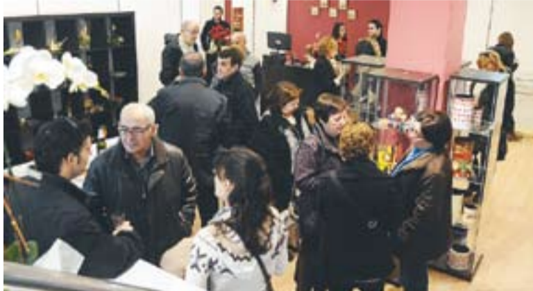
Aquest era l'aspecte de la nova botiga el dia de la inauguració.