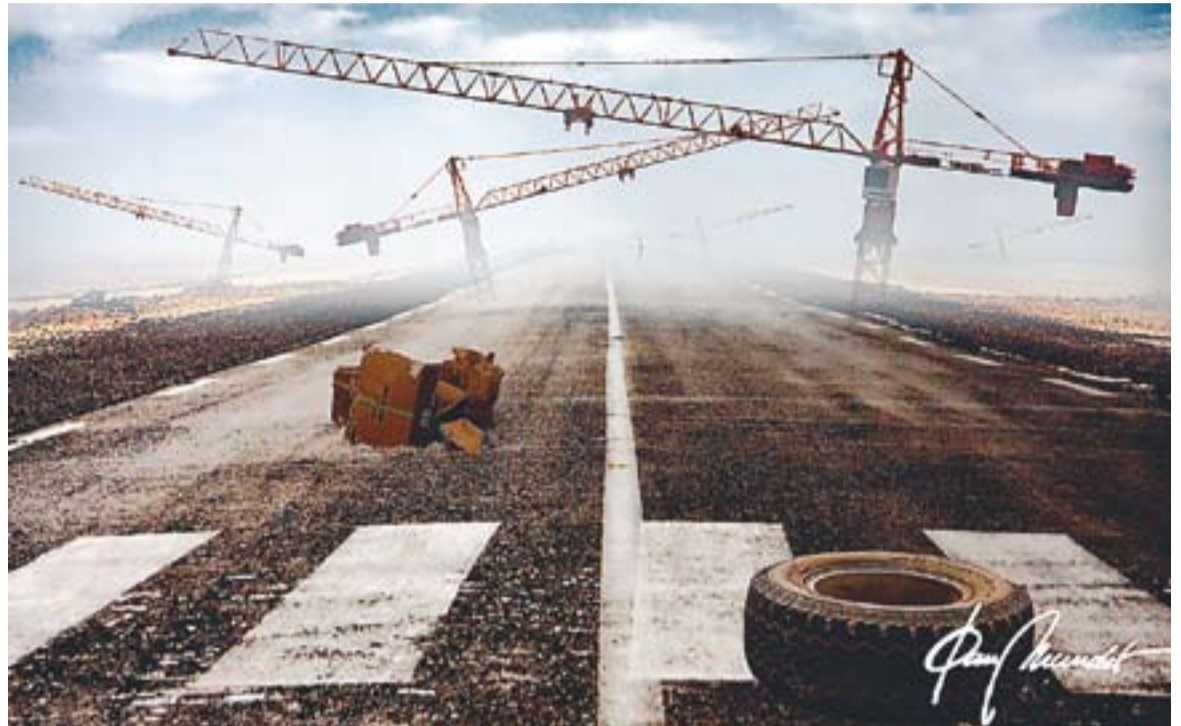
© "Road to nowhere". || JOAN MUNDET

Diuen, també, que a les nits ventoses i de lluna plena, se sent el xiulet del Molí d'en Busquets convocant el canvi de torn del personal