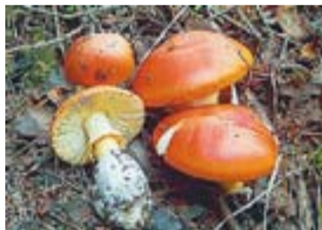
Ou de reig Amanita caesarea

És un bolet típic de la franja mediterrània, de color rosat. Creix agrupat i per sobreviure necessita l'alzina, així que a les pinedes és absent. Té una carn abundant i compacta, fibrosa al peu. Té un gust dolç i suau, tot i que sovint també té un punt amarg. A la cuina, es fa servir més per acompanyar guisats que no cuinat sol.