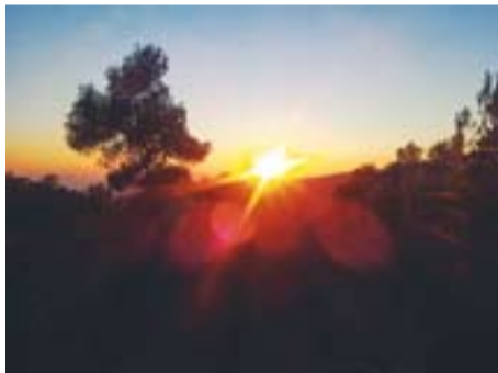
Posta de sol al Puig de la Creu Autor: Marc Taló