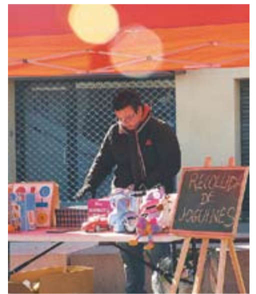
A dalt, moment de la Festa del Country. a baix, a l'esquerra les joguines recollides, a la dreta, la paradeta del Consorci

INTERCANVIAR-LES || Una altra opció – a banda de donar joguines – és intercanviar-les amb la intenció de reutilitzar-les i allargar la seva vida. Aquesta possibilitat ens la dona, un any més, la Ludoteca Municipal Les 3 Mores, que des d'aquesta setmana i