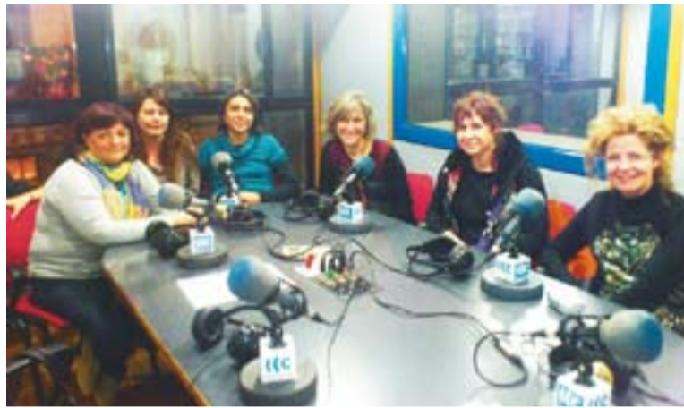
© Grup de mestres que ha participat en aquest seminari formatiu. || L'ACTUAL

La matèria compartida ha passat des del funcionament tècnic d'una emissora de ràdio, passant per l'elaboració de guions, els gèneres radiofònics o la locució. Entre d'altres, hi han participat docents d'escoles de Palau-solità i Plegamans, Polinyà, Santa Perpètua de Mogoda, Sant Llorenç Savall, Sentmenat i també Castellar del Vallès. De fet, en tots els casos els coneixements adquirits serviran per aixecar projectes radiofònics diversos que posaran en pràctica als propis centres però