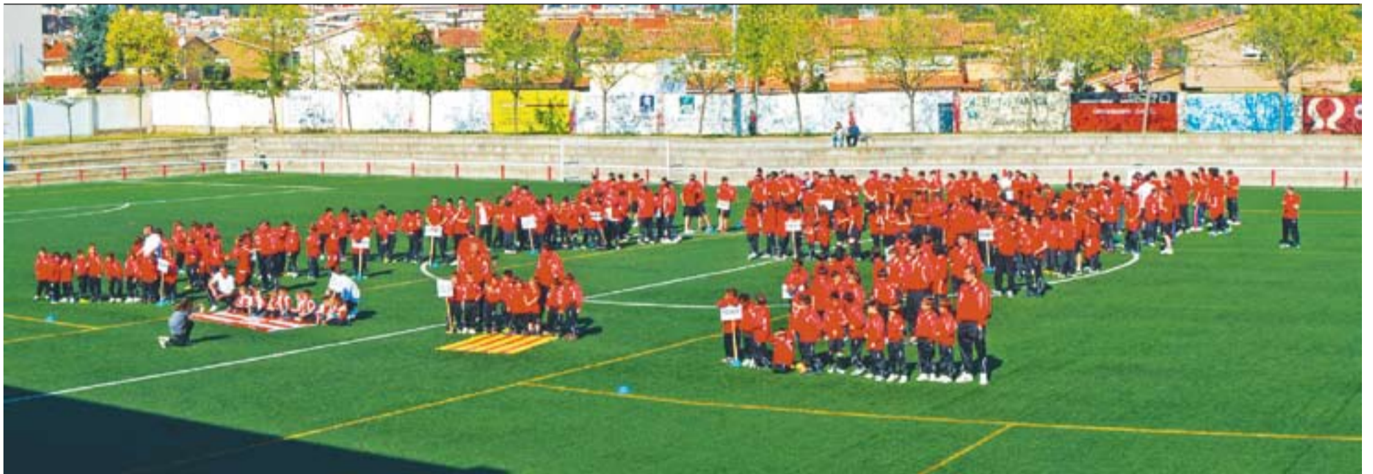
© Una imatge de la presentació de l'any passat al camp de futbol Pepín Valls, en què la Unió Esportiva Castellar va superar la xifra de 25 equips. || JOSEP GRAELLS

pista del Calafell per 1 a 8. L'aleví és l'únic equip del club que es troba disputant eliminatòries. El partit de tornada serà el dia 15 de desembre al pavelló Dani Pedrosa. La resta de competicions han acabat la primera volta i tornaran el 2013.