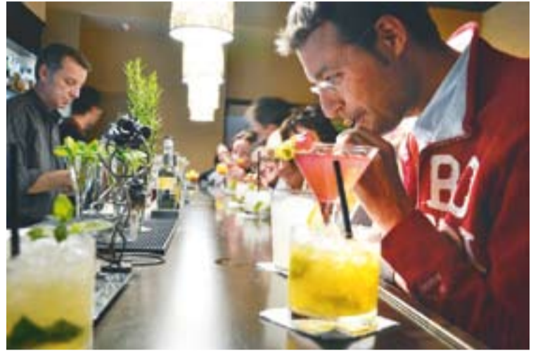
L'interior de la cocteleria Boston durant un dels tallers.