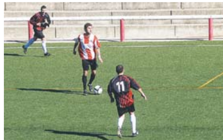
La UE Castellar no va estar encertada com en altres partits.