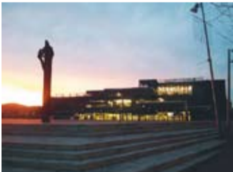
El Mirador Autor: José Zaguirre

Envia'ns fotos fetes amb el mòbil: lactual@castellarvalles.cat