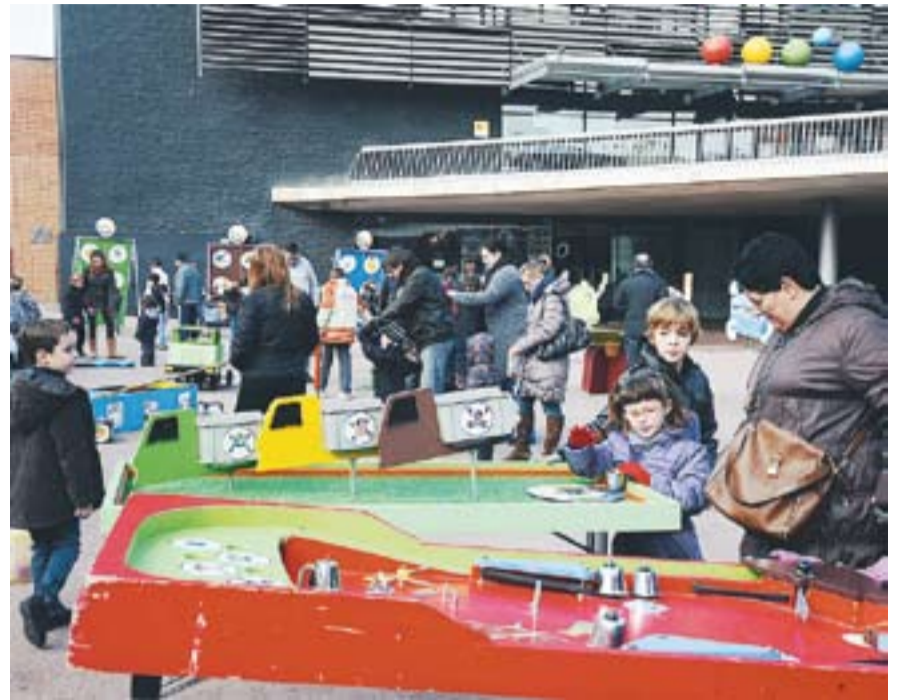
Dues imatges de la Fira de Sant Esteve que va tenir lloc el cap de setmana passat: a la l'esquerra, el carrer Sala Boadella i a la dreta, jocs infantils instal·lats a la plaça del Mercat.