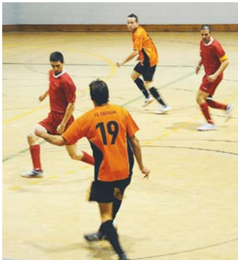
Els castellarencs en el partit de dissabte passat.

En qualsevol cas, l'equip castellarenc ha resolt amb absoluta comoditat els enfrontaments que ha tingut fins ara, fent gala sobretot d'un gran control de pilota que els permet no tenir excessius problemes defensius –són l'equip menys golejat del grup–. Cinc partits, cinc victòries, i encara un encontre pendent a la pista del Navàs que es va ajornar. "Si entenes bé acostumes a jugar bé al proper partit i també acostumes a guanyar. Els jugadors estan complint, no fallen als entrenaments i m'està costant fer les convocatòries" , diu Jiménez. El d'aquest dissabte pot ser exemple de molts altres partits, en el qual els castellarencs havien liquidat el marca-