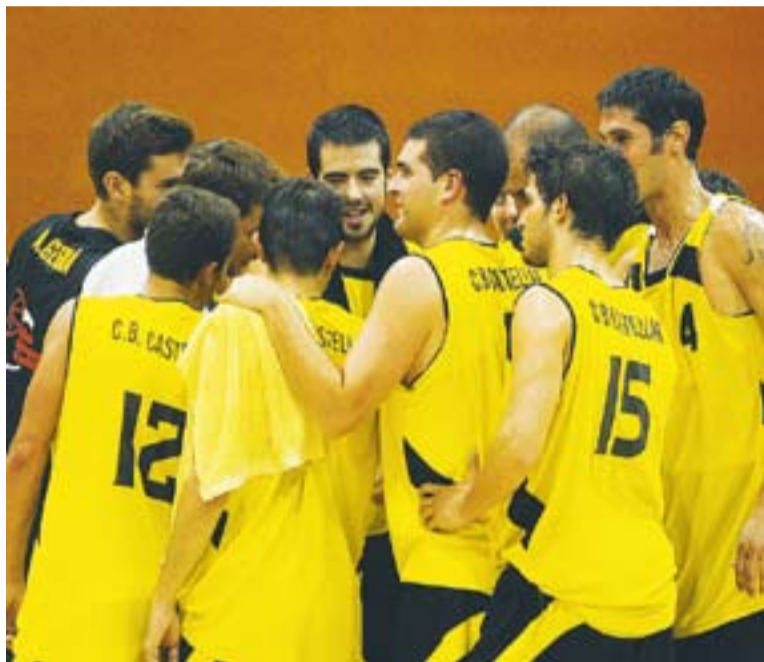
Els jugadors del CB Castellar en acabar un partit a casa.