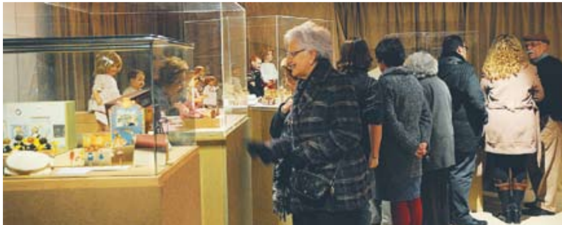
Dos moments de la inauguració de l'exposició de pessebres: els parlaments i la visita posterior.