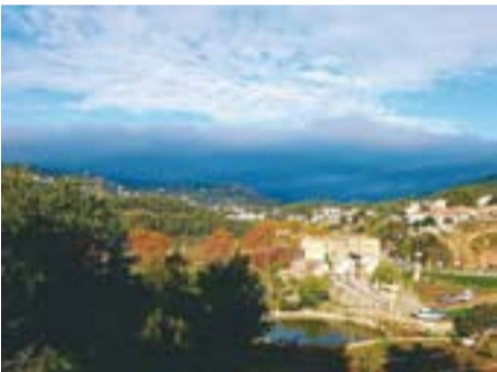
El Brunet Autor: Carme Padrisa

Envia'ns fotos fetes amb el mòbil: lactual@castellarvalles.cat