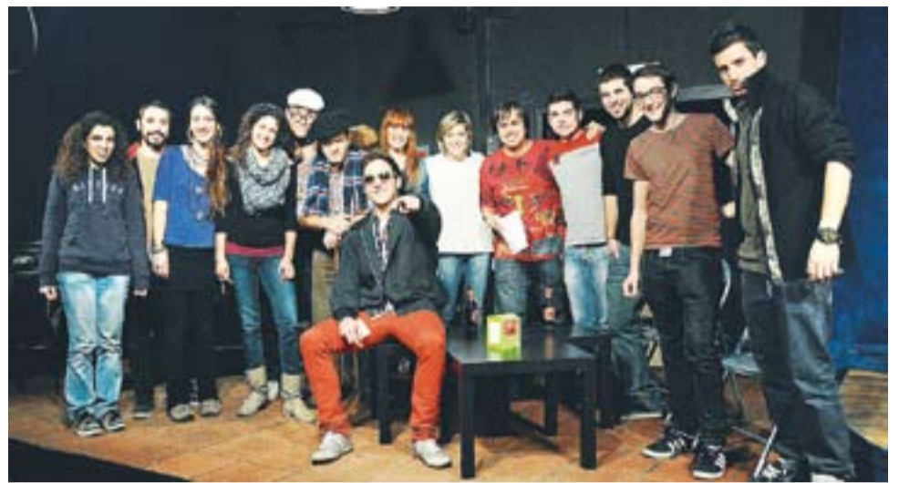
⊙ L'equip de col·laboradors que va participar en la primera emissió. || J. G.

El primer programa s'ha titulat Bar Tomeu. "Amb aquest joc de paraules ini-