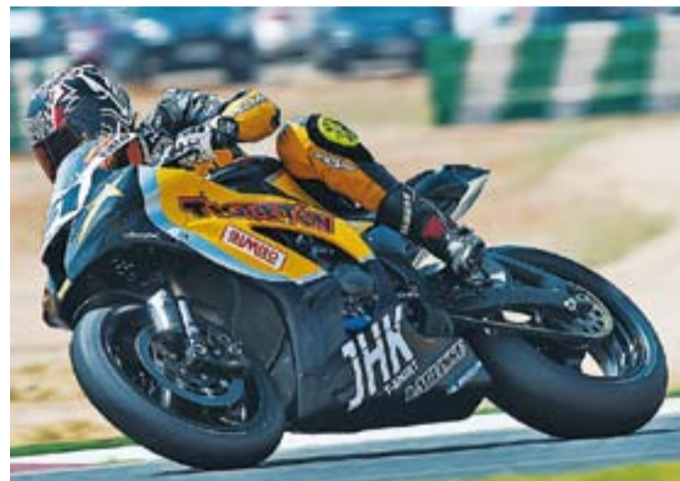
© Morales en una de les proves d'aquest any. || LAGLISSE

a dos quarts de nou del matí i finalitzarà més tard de dos quarts de tres del migdia. Es podran veure tretze curses, 22 categories i els millors especialistes de Catalunya en competició lluitant pels premis que es donen als 10 primers classificats de cada categoria. La prova castellarenc també és coneguda perquè dona un pernil als tres primers de cada prova. +