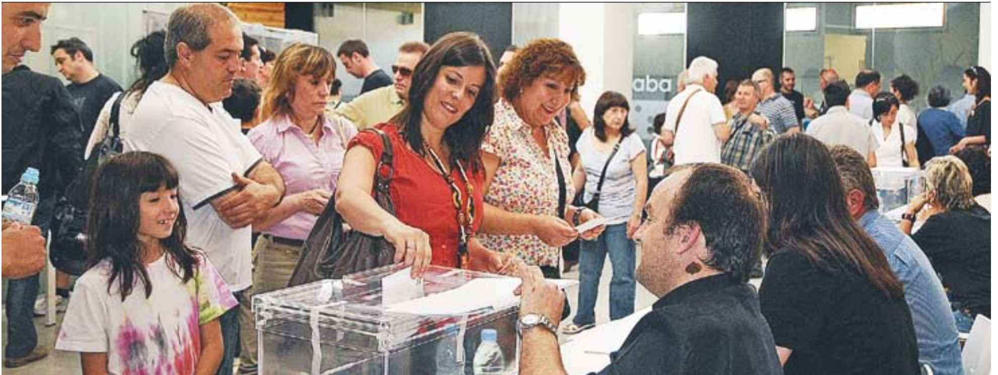
Les castellarenques i els castellarencs van votar per darrera vegada el maig de l'any passat a les eleccions municipals.