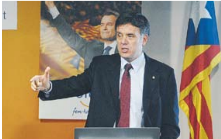
© Recoder va fer campanya a Castellar divendres passat. || JOSEP GRAELLS

També va apuntar que “abans de la crisi totes aquestes mancances passaven desapercibudes perquè el país creava ocu-