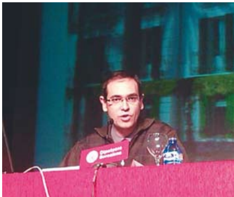
L'alcalde de Castellar presentant el projecte de finestra única