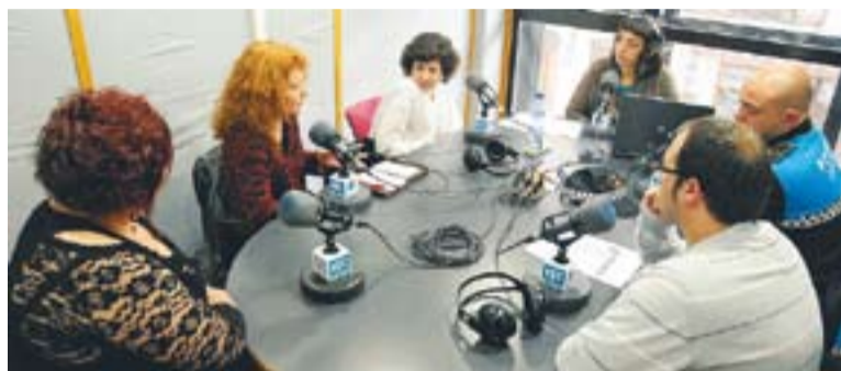
© La tertúlia del magazín Dotze va comptar amb diversos professionals.