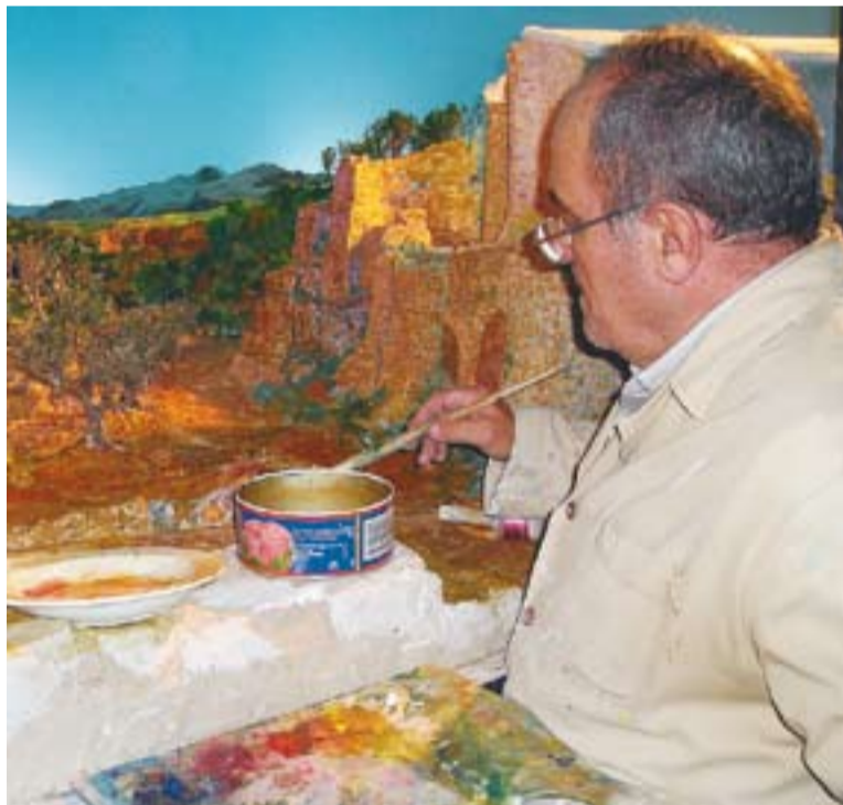
© Adalt, Albert Antonell i Joan M. Garsot, pessebristes guardonats.

han intentat fugir de l'estètica més clàssica. Les figures de Garsot són d'una força expressiva important, tot i que sòbries en la composició.