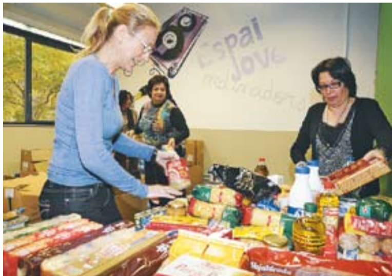
Les caixes recollides ara s'estan distribuïnt en lots.

A banda de la recollida en els equipaments, els dies 9 i 10 de novembre es va preparar una acció de recaptació 'in situ' davant dels supermercats de la vila. Amb l'ajuda dels membres de la borsa de voluntaris s'informava la gent que passava als súper de la campanya i després s'anava recollint tot el que aportàvem. Va resultar