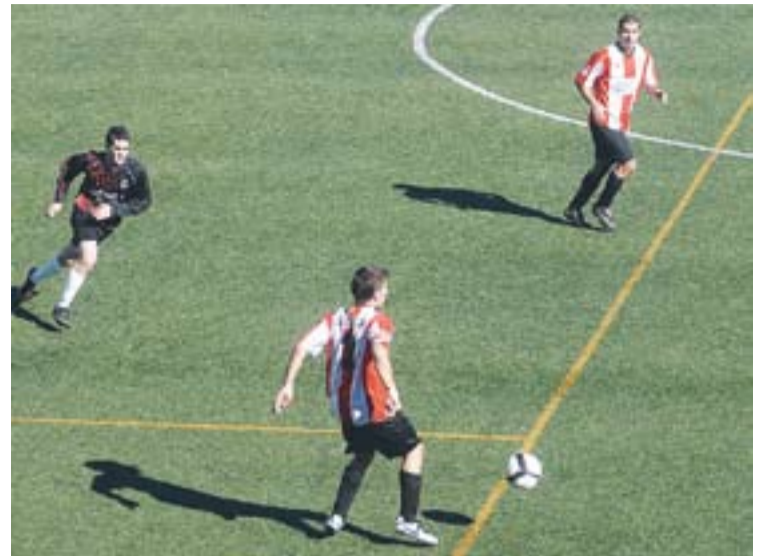
Els castellarencs van perdre fora de casa.

per 41-54. La primera part va ser molt igualada amb petits avantatges del Castellar. A mitja part les noies d'Esteve Chavala guanyaven per 23-27. Una defensa més agressiva i uns atacs més treballats van portar a la victòria final. Brena i Marina, amb 11 punts cadascuna, van ser les màximes anotadores del Castellar. +