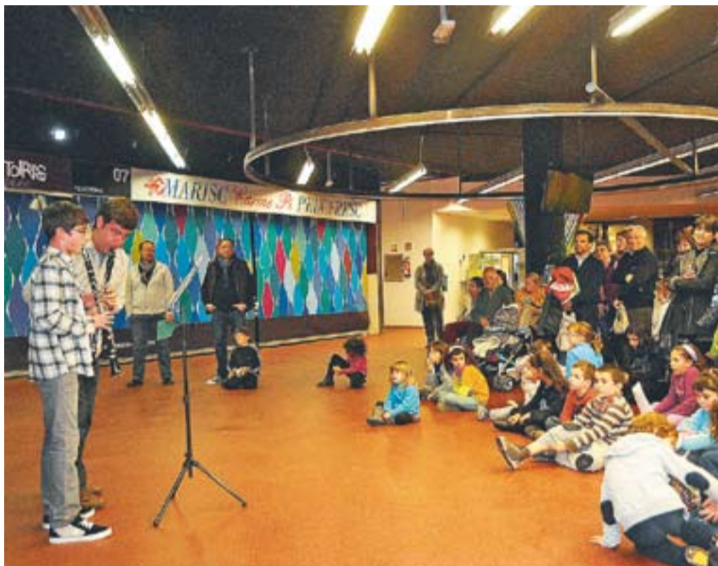
© Alumnes de l'Escola Municipal de Música Torre Balada. || JOSEP GRAELLS

ESPAIART || D'altra banda, l'escola Espaiart ha programat una activitat en motiu de la celebració de