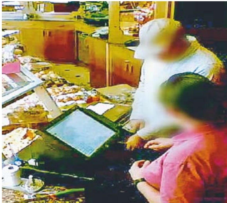
Fotograma d'un vídeo de seguretat on es pot veure el lladre atracant una pastisseria.

Segons una nota dels Mossos, el primer dels robatoris va tenir lloc el passat 17 d'octubre, la resta es van produir en els següents quinze dies. En tots els casos, el 'modus operandi' utilitzat per l'autor era el mateix. Actuava sol i, durant el matí, seleccionava una fleca o pastisseria on treballés per norma general una única persona, preferiblement dona. Entrava al local un cop comprovava que no hi havia cap client a l'interior. S'adreçava a la dependenta i la intimidava verbalment per tal que li lliurés els diners de la caixa registradora, al mateix temps que esgrimia algun tipus d'objecte que col·locava contra el cos de les víctimes. Per tal de dificultar el