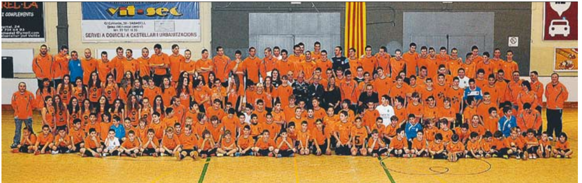
© Tot la família del Futbol Sala Castellà, també amb l'equip de vòlei femení a la part esquerra, va presentar-se dissabte a la tarda al pavelló Joaquim Blume. || JOSEP GRAELLS

dels equips favorits a pujar de categoria aquesta temporada. Després de quatre jornades de lliga, l'equip que entrena Fran Ortega és últim de grup i encara no ha puntuat. La propera jornada jugaran a casa contra el Grups Arrahona de Sabadell.