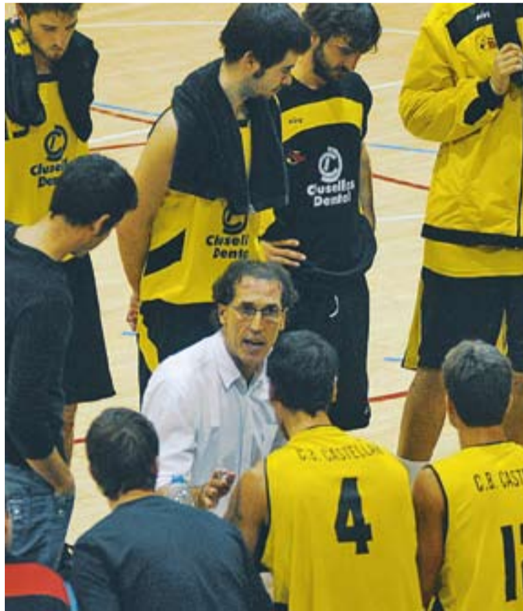
Una imatge d'un partit disputat al pavelló Puigverd.

Un triomf permet a l'equip de Txema Solsona estar amb cinc victòries i cinc derrotes a la classificació de Copa Catalunya. Els cas-