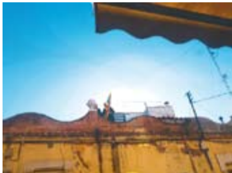
Penjant l'estelada Autor: Santi Q.