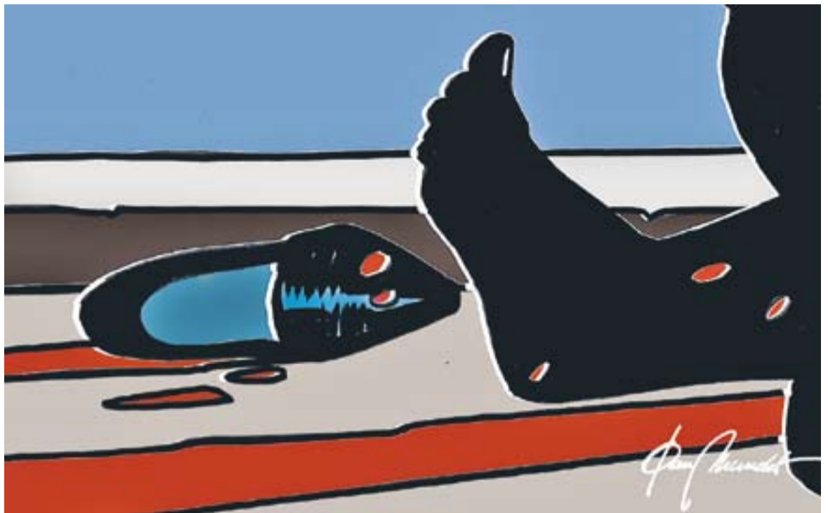
© Sense títol 7000. || JOAN MUNDET