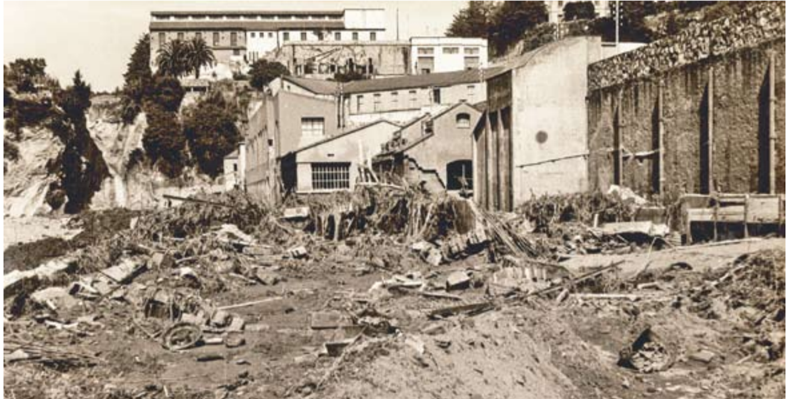
Els efectes l'endemà de la riuada a la planta de Can Barba de la Vídua Tolrà.