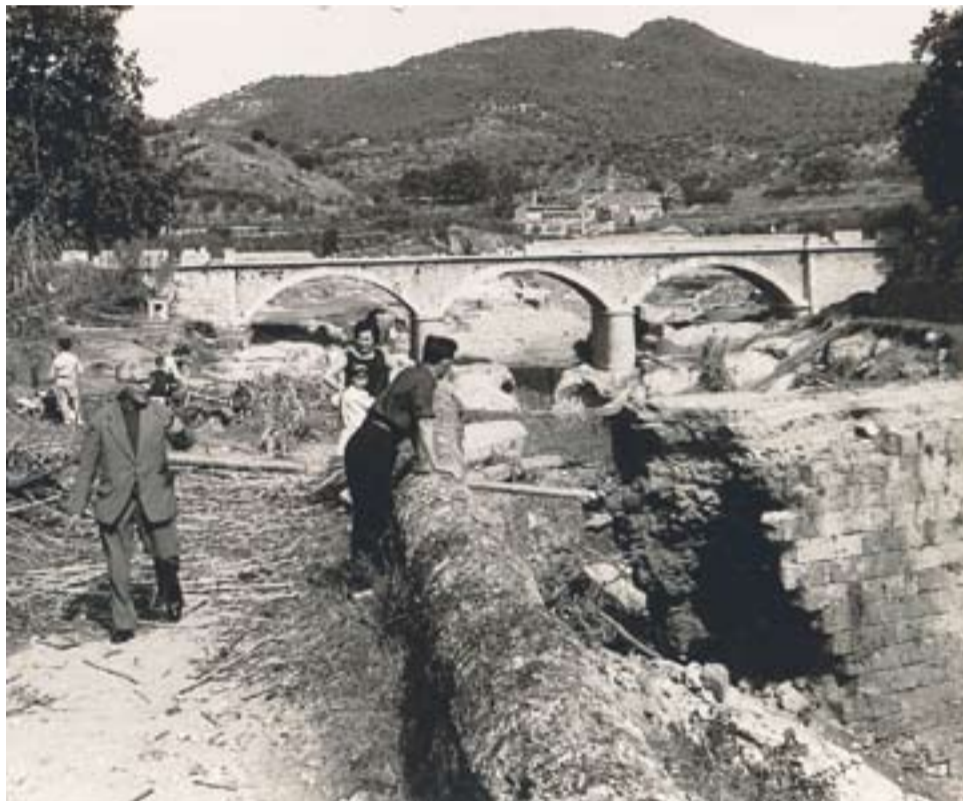
Veïns i veïnes de Castellar visiten una de les zones afectades per la crescuda del Ripoll.