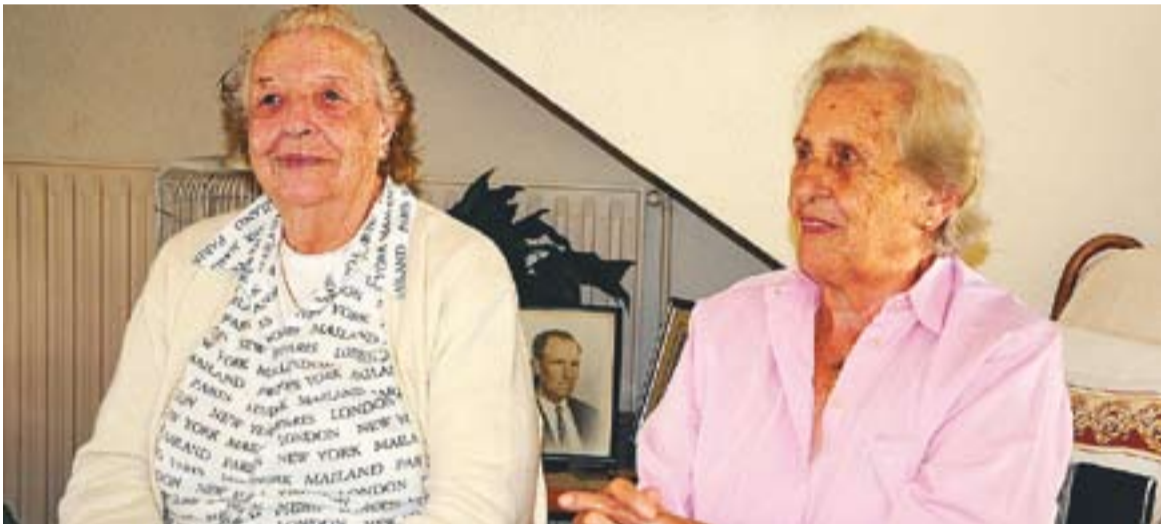
© Matilde i Camila, germanes d'Antoni Casanovas, que va morir ofegat. || JOSEP GRAELLS