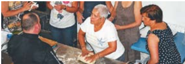
Algunes alumnes del curs elaborant la massa per a una coca de recapte.