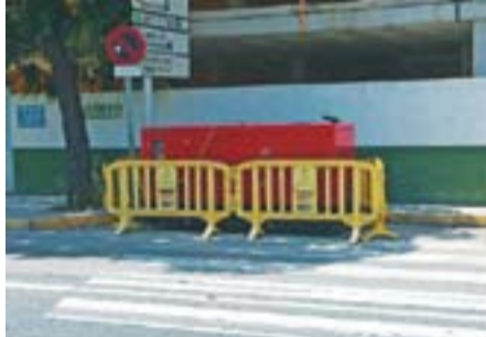
Pas de vianants ocupat pel consistori