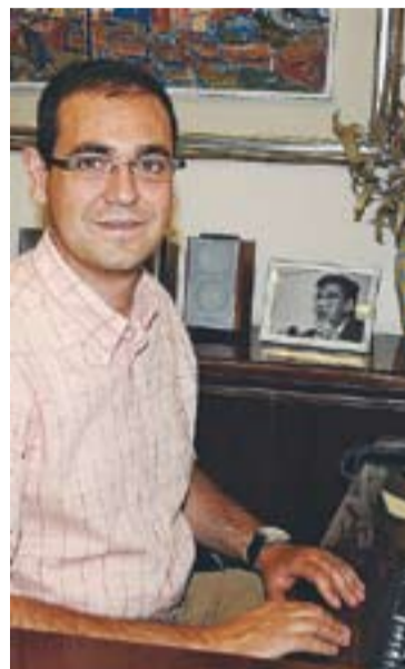
© L'alcalde, Ignasi Giménez. || J. G.

El web www.castellarvalles.cat compleix amb el 78% d'un total de 41 indicadors que es basen en quatre grups: informació sobre quins són els representants polítics; informació sobre com treballen els repre-