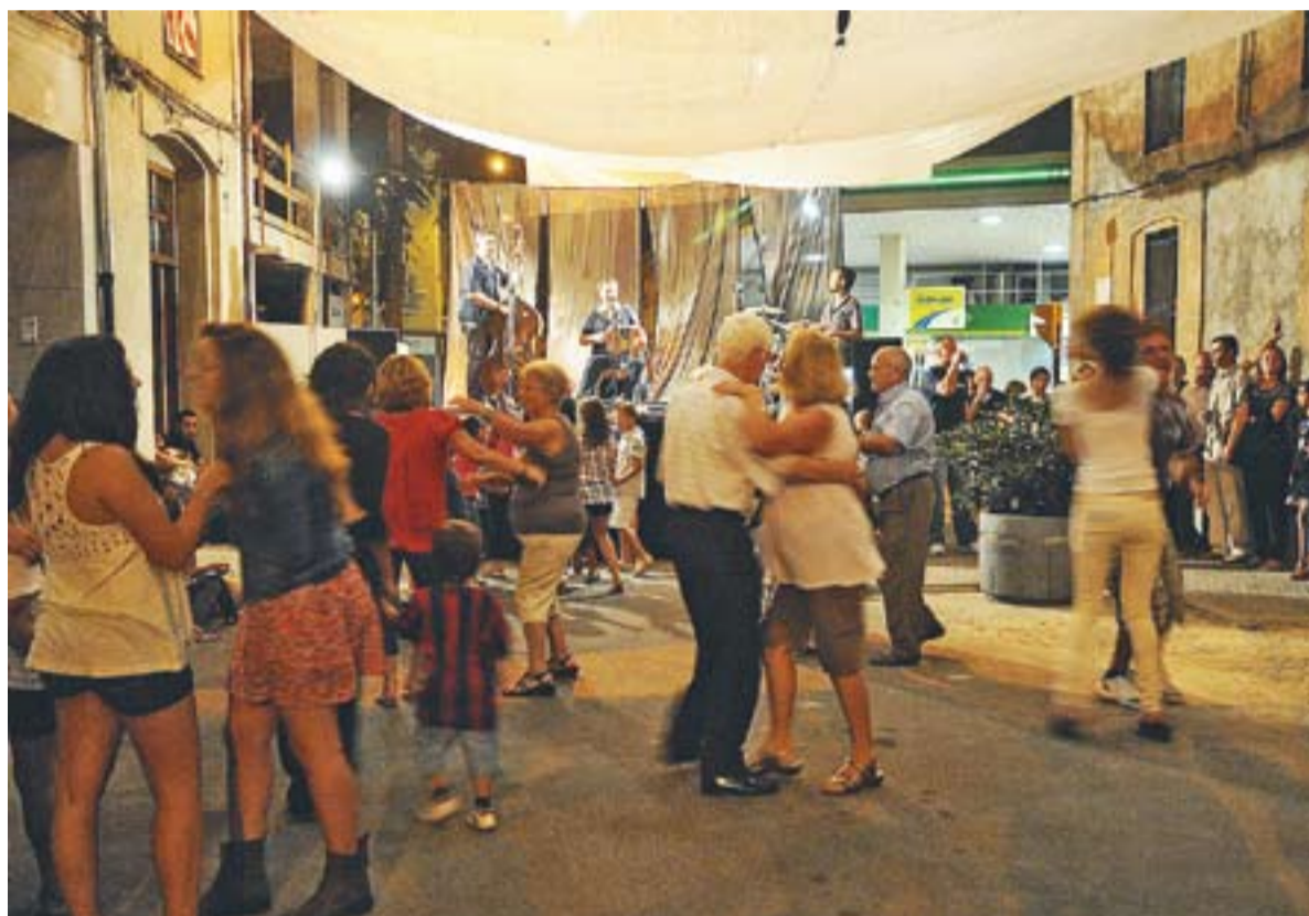
© Ball amb el trio de Carles Belda a les festes del carrer Sant Jaume. La propera festa serà a Sant Feliu, el 31 d'agost || J. G.