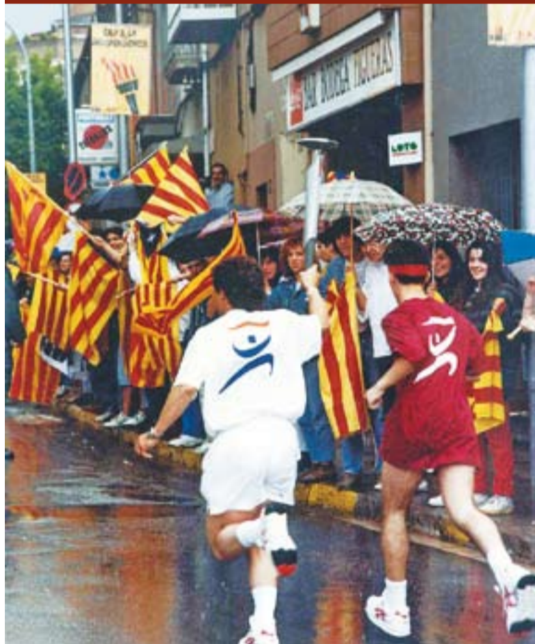
© 16 de juny de 1992: la torxa olímpica passava per Castellar del Vallès. || J. G.