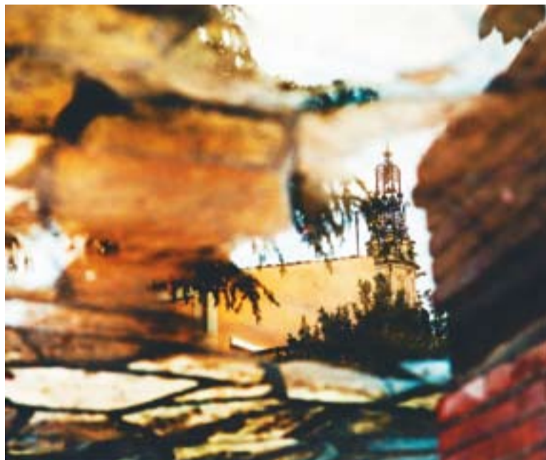
Foto d'un bassal on queda reflectida l'Església de Sant Esteve.

gui, el que és important és que el fotògraf ho porti a dins. “Una càmera més bona no fa bones fotos perquè sí. El fotògraf es pot ajudar amb una bona càmera, però això ha d'anar sumat a la seva mirada” .