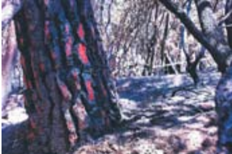
Foc forestal

Envia'ns fotos fetes amb el mòbil: lactual@castellarvalles.cat