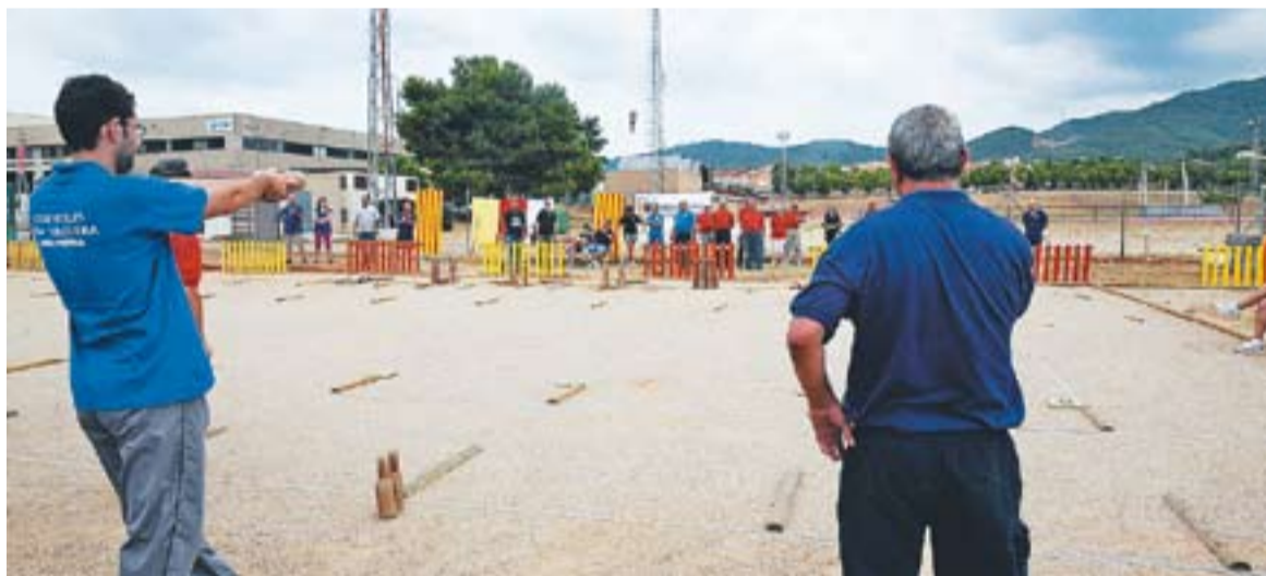
Campionat que va celebrar-se després de la inauguració de les noves pistes del Club de Bitlles de Castellar

de ferro que servirà per emmagatzemar material.