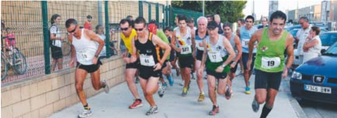
© Alguns dels participants a la X Cursa de Togores || JOSEP GRAELLS