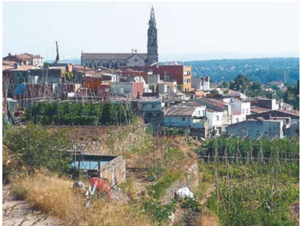
Dipòsit d'aigua de Canyelles i horts castellarencs regats pel torrent

del Torrent de Canyelles amb més poder adquisitiu van escripturar en un notari els drets sobre l'aigua que podien percebre els seus horts, i és gràcies a aquests documents que podem datar el naixement de la nostra comunitat a l'època de Jaume I, al segle XIII", explica Font. La comunitat castellarenca ha descobert un document del 1700, aproximadament, dels drets d'aigua del Torrent de Canyelles que tenia el Mas Mir, l'actual Can Torras del carrer del Centre. A l'escrit es fa referència a un altre document del 1291 de compravenda de la finca i dels drets de l'aigua. "Les comunitats de regants neixen per regular aquests drets i evitar les disputes entre els propietaris, i és per aquest motiu que tenen capacitat