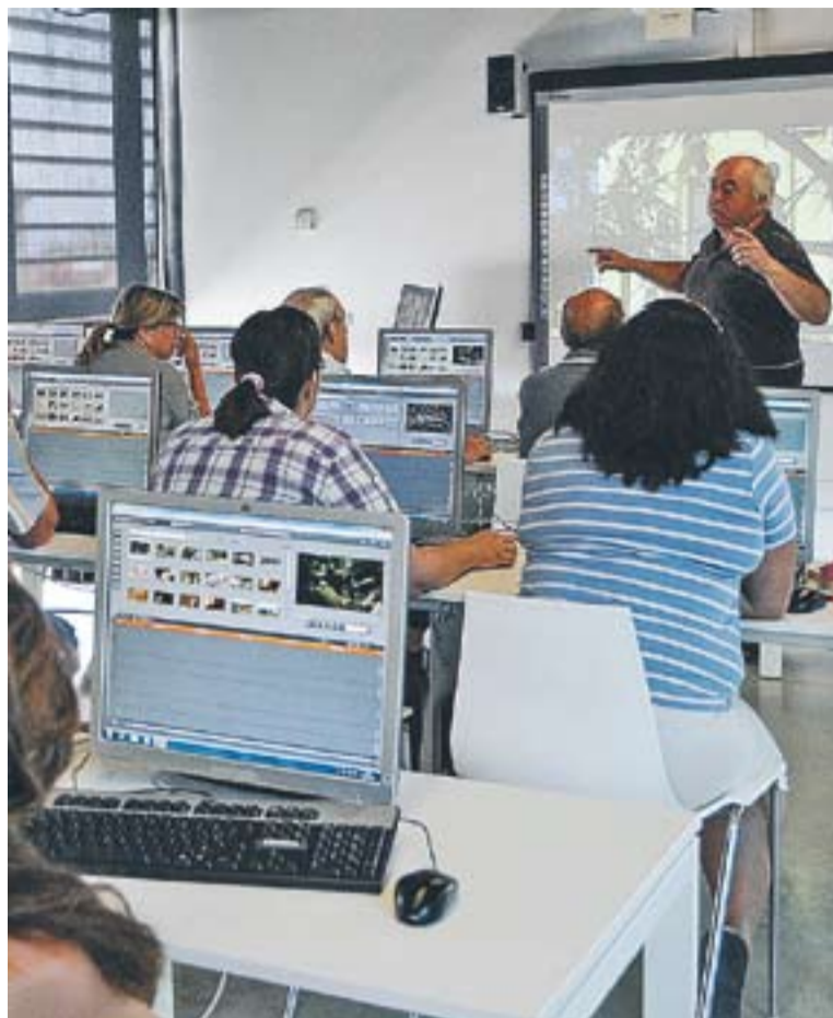
Curs de producció audiovisual d'El Mirador d'aquest juliol.

Entre les novetats dels propers cursos, també destaquen els cursos d'administratiu comptable, que s'ha dividit per trimestres en els nivells inicial, mig i avançat. Enguany, continuaran els cursos d'ofimàtica i Tecnologies de la Informació i la Comunicació. "El Mirador vol potenciar la seva vessant més acadèmica amb aquest tipus de cursos, que com el de nòmines i seguretat social que s'han dut a terme aquest curs, van tenir molta demanda", apunta Guirao. D'altra banda, també es programaran cursos de disciplines i àmbits