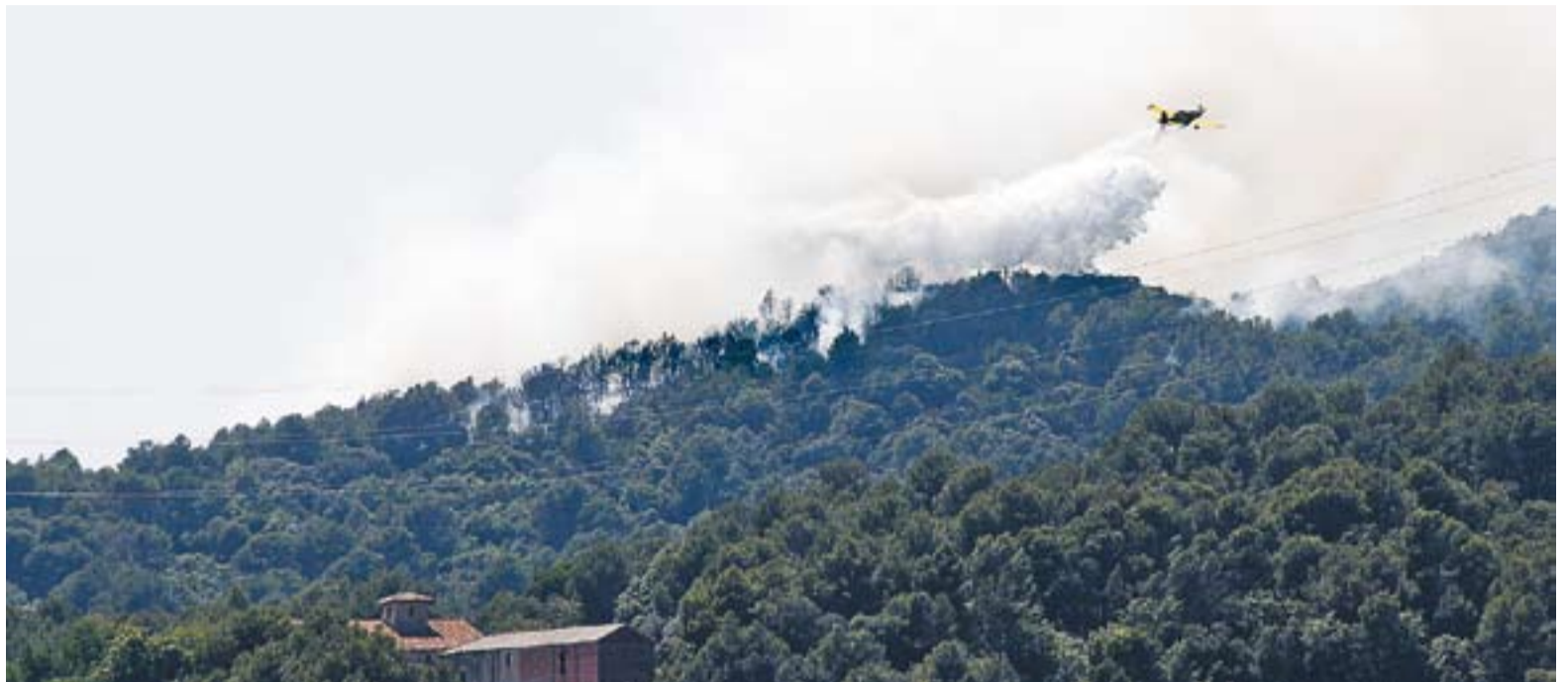
Un hidroavió treballa per apagar les flames que es van generar a la zona de Can Font, dijous passat.

A primera hora de la tarda la humitat era molt baixa però a mesura que van passar les hores, la humitat va pujar a cotes elevades afavorint les tasques d'extinció dels efectius d'emergències. La feina dels bombers es va centrar, durant les