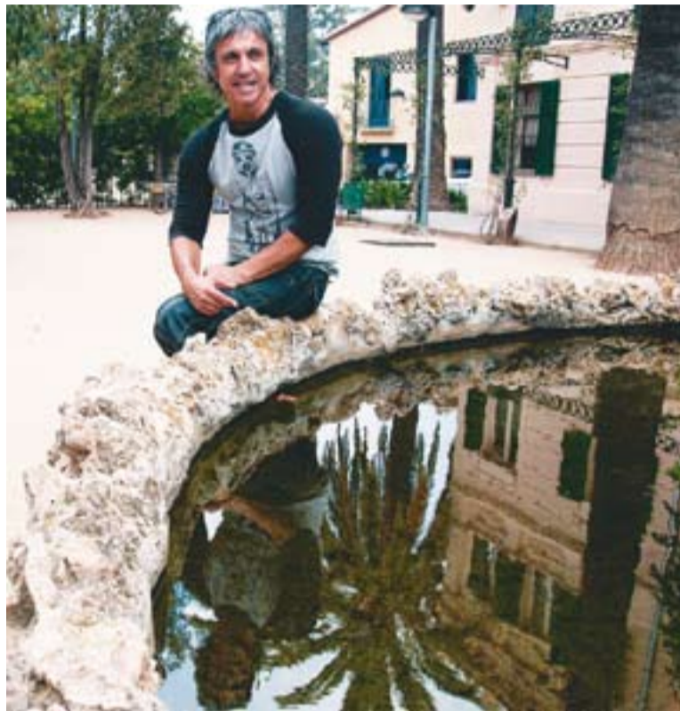
© Diego Koltan als Jardins del Palau Tolrà. || TXELL BIGATÀ

Koltan fotografia indistintament paisatge i persones. Més enllà de la càmera que hom tin-