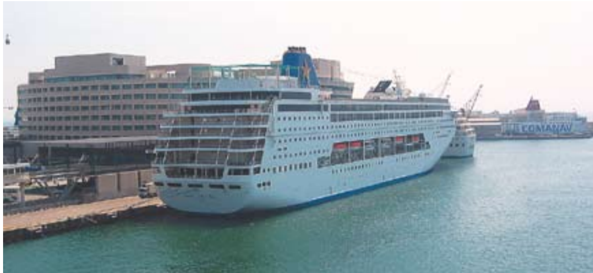
© Creuers al port de Barcelona. || L'ACTUAL

Després dels creuers, s'està demanant, en llarga distància, Es-