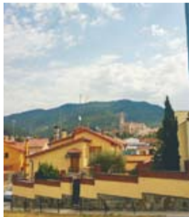
La catedral del Vallès Autor: Xavier Cano