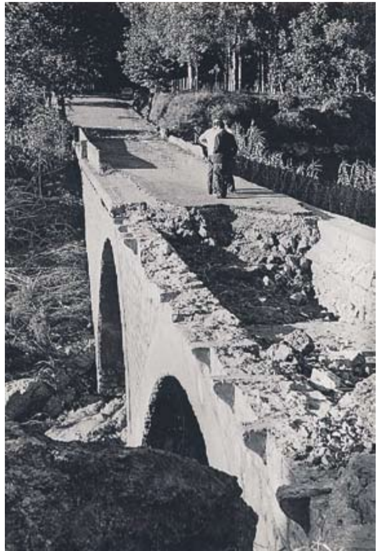
El pont de Turell després de la riuada del setembre del 62.