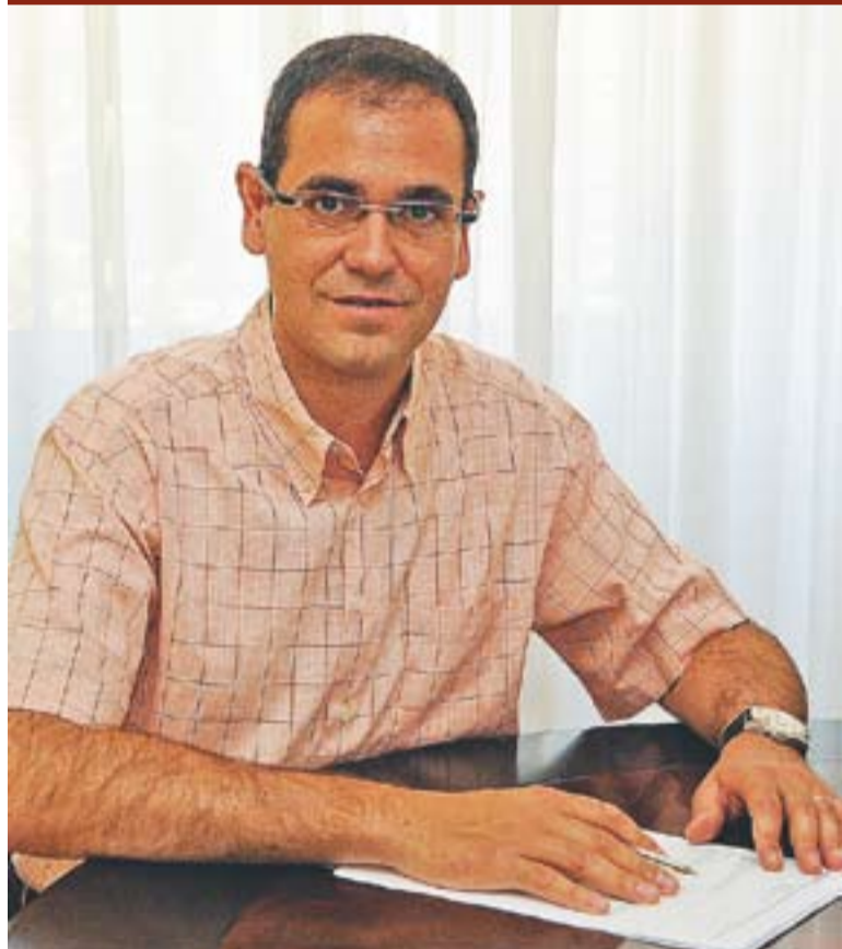
© L'alcalde Ignasi Giménez fa balanç del primer any de mandat. || J. GRAELLS