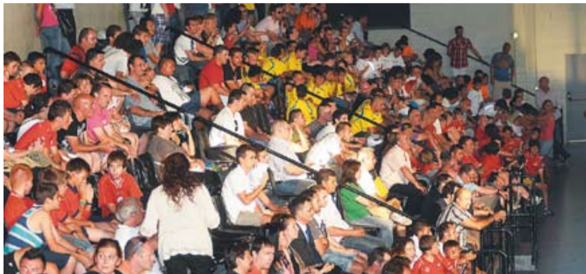
Un dels partits disputats el primer cap de setmana del Torneig Joan Cortiella al Pepín Valls.

La delegació de Sabadell de la Federació Catalana de Futbol entrega els trofeus als guanyadors de la lliga al pavelló Joaquim Blume