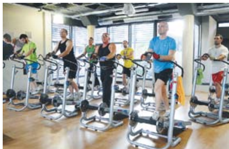
Socis de SIGE realitzant una sessió de 45 minuts de 'striding'

genolls. "És apte per a tothom, et pots posar la resistència que et vagi bé per seguir la classe i, a més, hi ha menys fregament als genolls. Es cremen fins a 800 calories per classe, mentre que en el cycling se'n cremen unes 400 o 500 per classe" , segons explica Joan Carles Rodríguez, responsable de SIGE. La resposta per part dels usuaris i dels monitors ha estat molt bona. "Tenim setze màquines i la gent s'ha d'apuntar per poder fer la classe. Els agrada i repeteixen, tenim fins i tot llista d'espera" . Rodríguez ha detallat que si la demanda continua així, intentaran ampliar el nombre de cintes. +