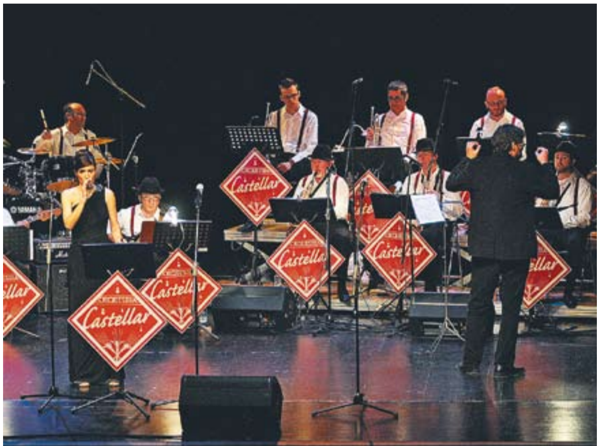
L'Orquestra Castellar en un dels concerts que va oferir a l'Auditori Municipal de Castellar.

La formació ja compta amb més de 40 concerts i durant aquest estiu continuarà la seva gira arreu de Catalunya per a presentar el disc 7 colors . +