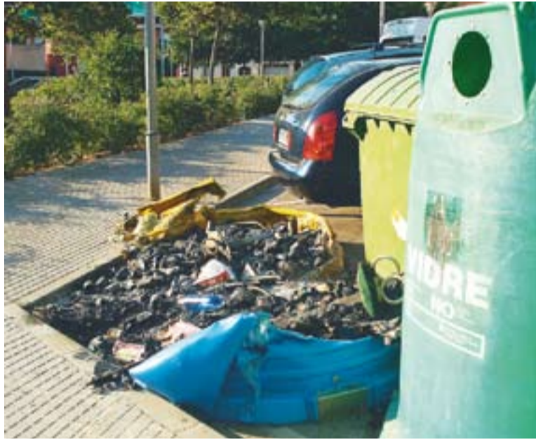
Dos dels contenidors de plàstic cremats, aquests al carrer Anselm Clavé

El cap dels Bombers va manifestar que van haver de fer 12 sortides, algunes per falsa alarma. "Ens trucaven per columnes de fum que sortien de contenidors, però van resultar falses alarmes", va afirmar Casajuana.