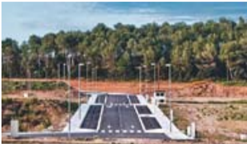
Can Bages

Envia'ns fotos fetes amb el mòbil: lactual@castellarvalles.cat