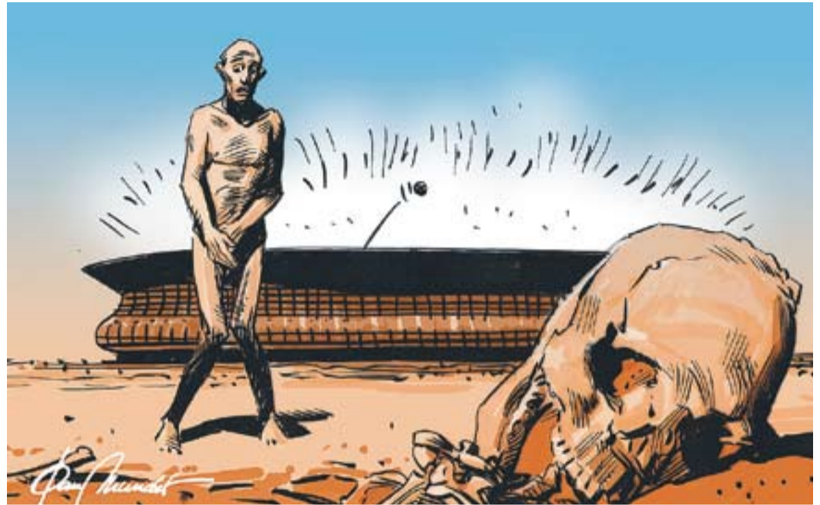
© L'opi de color... || JOAN MUNDET

Sempre ens quedarà 'La Roja' i als catalans (també o només) el 'Barça'. O no?