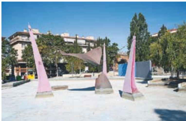
© S'ha hagut d'avançar l'extracció de l'aigua de la bassa per una bretolada. || J.G.

La Policia Local també va informar que va realitzar dues actuacions per requerir l'apagament de dues fogueres enceses sense permís, una al polígon de Can Nicolau i una altra al camp de golf. A més, el cap de la Policia, també va explicar que a banda de les trucades pel foc, van rebre moltes, de gent que es queixava del soroll. "És clàssic