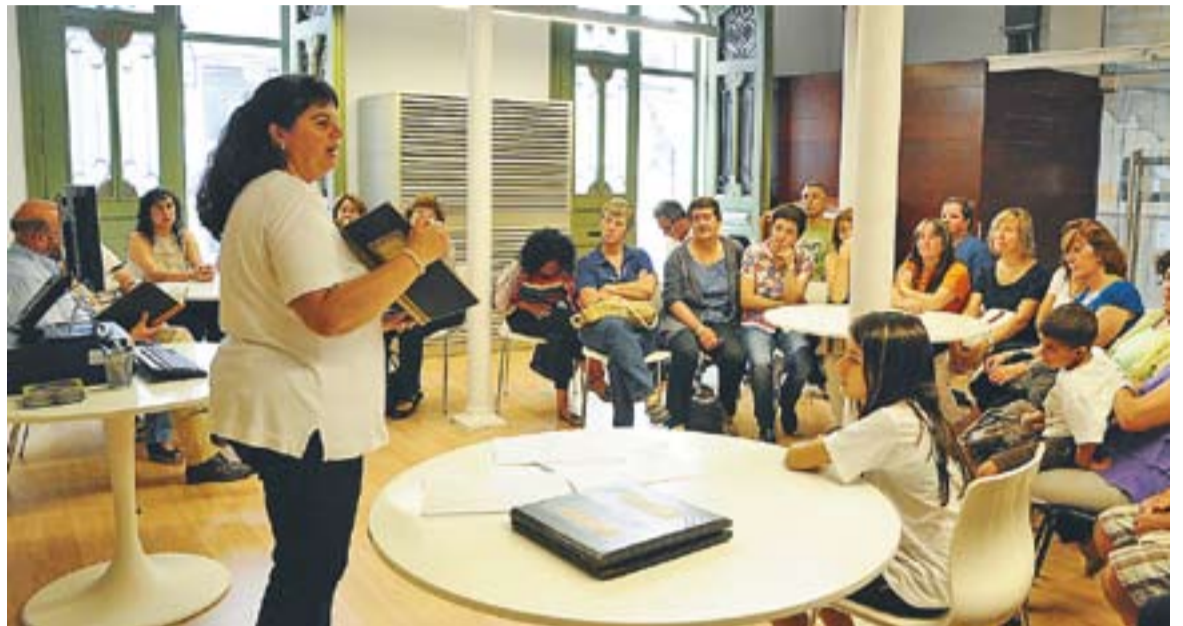
① Final de curs de l'SLC a l'Arxiu

CURSOS DE CATALÀ || Una cinquantena de persones han finalitzat aquests dies algun dels cursos presencials o semipresencials que ha impartit el Servei Local de Català (SLC) des del mes de febrer, que va celebrar la festa de final de curs l'Arxiu Municipal. L'SLC continuarà amb els cursos presencials i semipresencials durant el curs 2012-2013. Així, es farà el curs presencial de Bàsic 2, un Elemental 2 i un Suficiència 1 (nivell C), mentre que també s'oferiran els tres cursos semipresencials de nivell intermedi i els tres de suficiència. A finals d'octubre es realitzaran unes sessions inicials de llengua oral adreçades a persones novingudes, en col·laboració amb la regidoria de Nova Ciutadania i l'entitat Castellar x Colòmbia. +