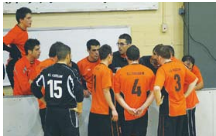
Jugadors del FSC escoltant les indicacions de l'entrenador de l'equip

Després d'aquesta trobada, els jugadors tornaran a posar-se en marxa el proper 27 d'agost quan comencen els entrenaments de manera oficial. +