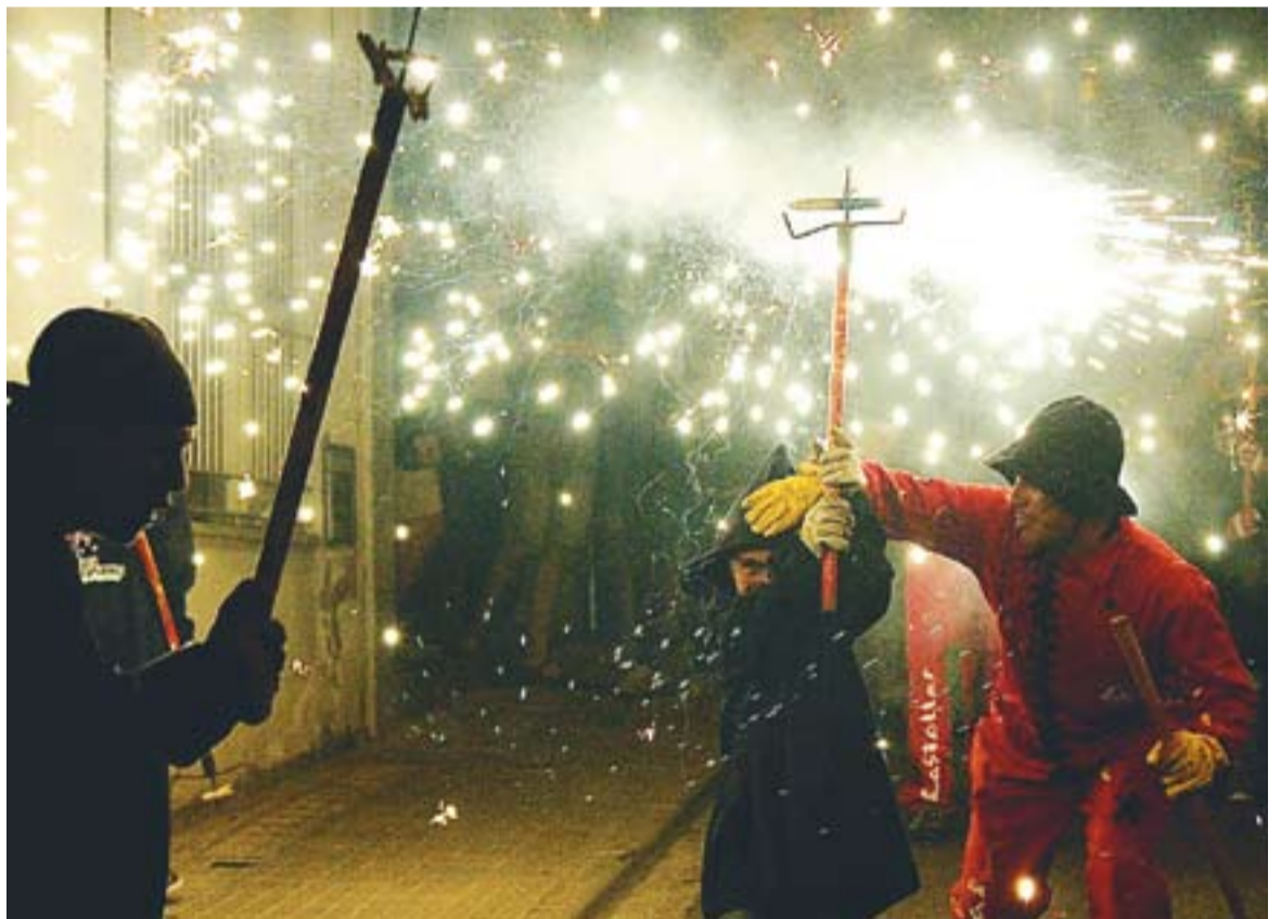
© Una Espurna, acompanyada per un diable durant les Nits d'Estiu 2011. || L'ACTUAL

fes-te veure per la festa major Anuncia't per partida doble!