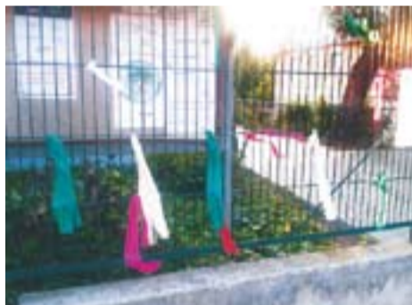
Llaços contra les retallades Autor: Jordi Niñerola