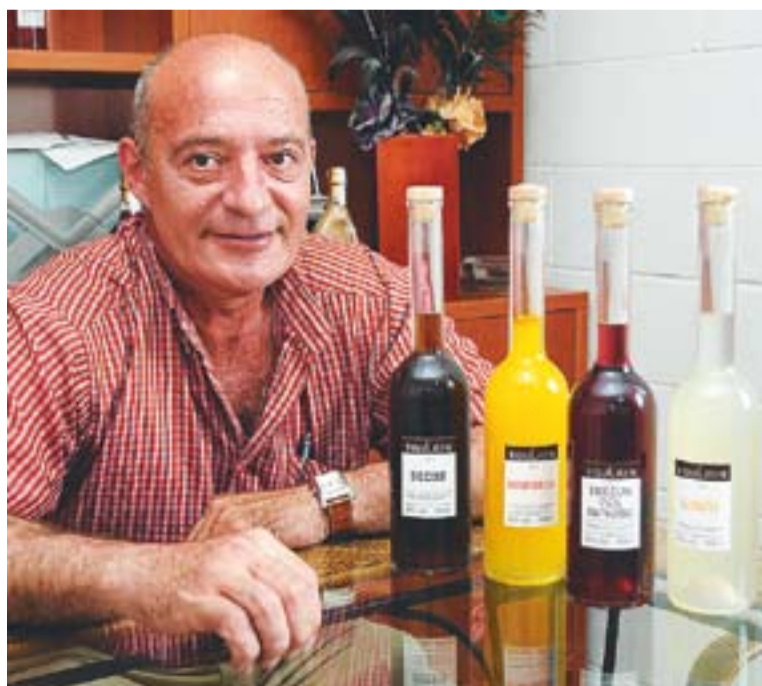
© Marc Roca amb algunes creacions pròpies de licors a la seu de l'empresa. || J.G.

La setmana passada es va celebrar la final de la Copa del Rei