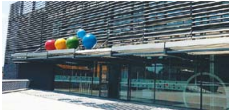
© El Mirador, equipament que acollirà part de les activitats del cicle Juliol Jove | J.G.

L'oferta de l'Espai Jove es durà a terme de dilluns a divendres i inclou, entre d'altres propostes, tallers de cuina o decoració, activitats esportives com una bicicletada, escalada o capoeira, jocs populars i gimcanes, una dormida a l'Espai Jove i sortides a diferents indrets com la platja, Sant Feliu del Racó on es farà una parada a la piscina, l'hípica Binomio Ecuestre, Illa Fantasia, el Natupark de Cerdanyola del Vallès, la Bassa de Sant Oleguer, l'Alienzone o el Cosmocaixa. "Cada setmana es programaran sortides orientades