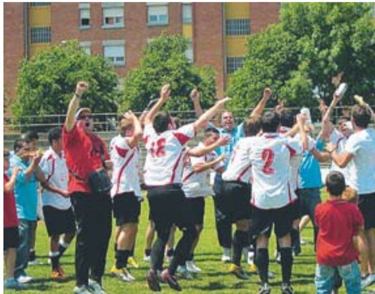
© Jugadors i afició celebrant la salvació al camp de l'OAR Vic || UE CASTELLAR

han fet tot el possible durant la penúltima jornada de Lliga i s'han imposat al camp de l'OAR Vic (2-3). Això sumat a la resta de resultats de Segona Catalana han fet que la Unió aconseguís els punts necessaris per no haver-s'ho de jugar tot a l'últim partit davant del Puig-reig.