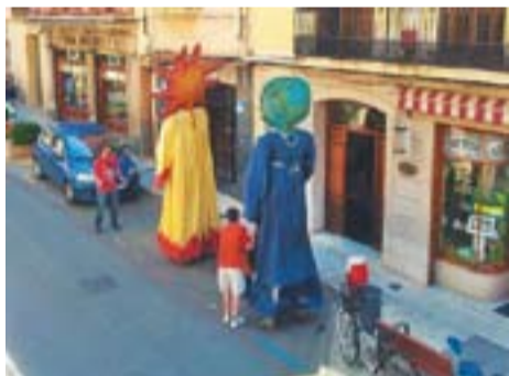
Els gegants aparquen al c/Major Autor: Loli Giner

Envia'ns fotos fetes amb el mòbil: lactual@castellarvalles.cat