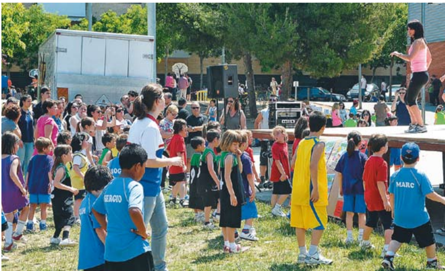
Una de les activitats que han tingut lloc durant la festa amb més aflluència del bàsquet castellarenc.

Més de 100 escoles a la festa del bàsquet i la salvació de la categoria del sènior del CB Castellar culmina un cap de setmana rodó