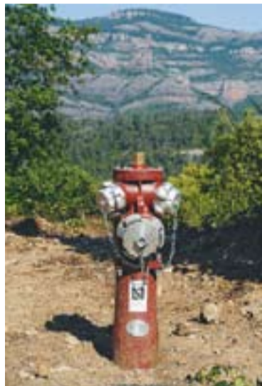
Un dels nous hidrants d'El Racó.