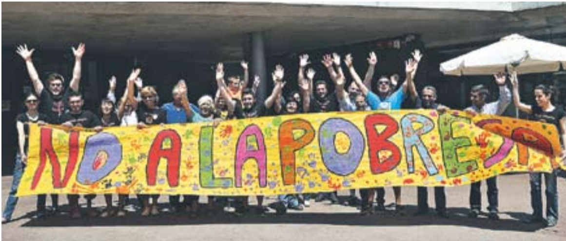
© El crit mut contra la pobresa va ser una de les activitats de la jornada solidària a Castellar. || J. GRAELLS

Els veïns de Castellar van participar en la Marató contra la pobresa de TV3