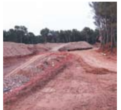
© Obres just darrere de la B-124. || L'A

L'Altraveu afirma en un comunicat que les obres del gasoducte “destrossen el sud de Can Bages” . Segons L'A, per accedir als torrents de Can Bages ENAGAS ha optat “per la perforació des del fons dels torrents i això és el que ara s'està fent al sud de Can Bages. Aquesta opció està suposant un desmunt de terres i una destrossa vegetal molt gran en punt on conflueixen els dos torrents” . També expliquen que s'han abocat fangs al riu a causa de la tuneladora que perfora el pas del gasoducte per la zona. En aquest sentit, el regidor de Territo-