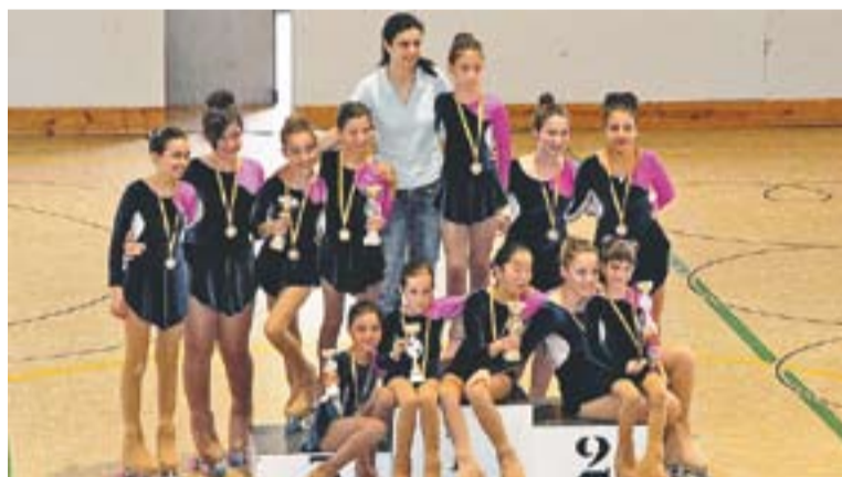
Algunes de les patinadores celebrant el podi i el pas a intercomarcals