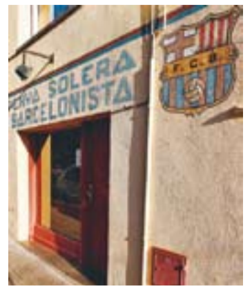
© Local social de la penya || J.G.

Així i tot, aquest diumenge tenen l'últim partit, que de fet només és un pur tràmit, però on de ben segur també donen l'espectacle i l'emoció que aquest final de temporada es mereix, perquè la UE ha aconseguit una remuntada èpica i no han deixat de confiar mai en les seves possibilitats. Com sempre, demanen la companyia d'aquesta afició castellarenca que tant els ha ajudat a remuntar la situació. +