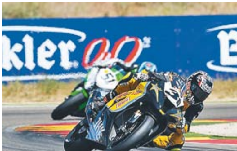
© Carmelo Morales durant la cursa al circuit aragonès de Motorland || MOTOR PASION

De fet, diumenge l'acció començava abans d'apagar el semàfor, ja que Xavi Forés, que sortia segon a graella, tenia problemes en la seva BMW i havia de sortir des del pit lane. Amb aquest contratemps es donava la sor-