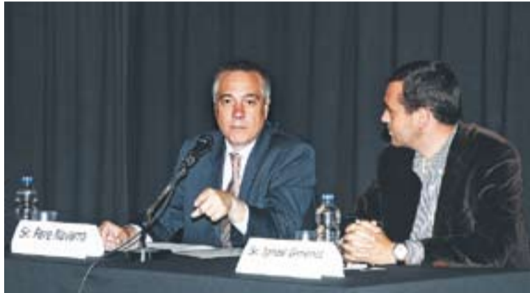
© El primer secretari del PSC, Pere Navarro, amb l'alcalde I. Giménez, al debat || J.G.

Durant la conferència Navarro va assegurar que “cal abandonar el discurs de la por i apostar pel discurs de la confiança” . “Les retallades no són només polítiques d'ajustament sinó que també busquen un canvi de model. Els mercats, les empreses i la població en general estan molts espantats, i això ens perjudica. No hem d'oblidar que Catalunya compta amb empreses i sectors de primer nivell mundial, i hem de reivindicar-ho i apostar-hi ara més que mai” , afegeix el socialista. Així mateix, Navarro puntualitza que està a favor de les polítiques de retallades perquè són “necessàries” , però que “han d'anar acompanyades de polítiques de creixement” .