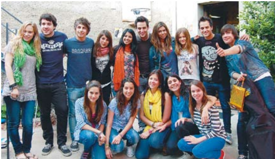
© Les noies que fins ara havien estat fruites de Macedònia i les cinc noves fruites, acompanyades pel grup Amelie. || CEDIDA

El passat 20 de maig les noies de Macedònia van fer el relleu generacional