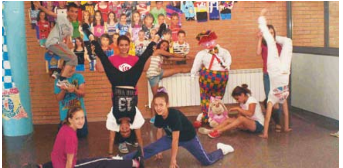
© Alumnes de l'escola Mestre Pla es preparen per a la Setmana Cultural dedicada al circ. || CEDIDA

A les vuit s'ha programat un gran espectacle per al final de la Setmana Cultural a càrrec del Circ Petit, amb l'espectacle titulat Super-Repus . Finalment, es farà un sopar a les 21.30 h amb actuacions en directe al pati de l'escola.