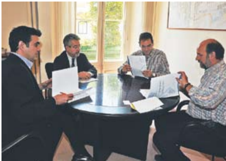
Signatura del conveni entre l'Ajuntament, els Bombers i les ambulàncies.

D'aquesta manera, s'ha donat compliment a un conveni signat el mes de novembre passat entre l'Ajuntament i l'Associació de Veïns del Racó, segons el qual, l'entitat adquiriria els hidrants per un import de 7.850 euros i els cedia a l'Ajuntament, que n'ha assumit el cost d'instal·lació i el manteniment.