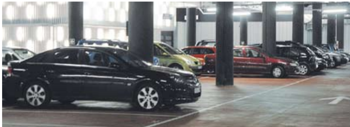
Imatge d'arxiu de l'aparcament soterrat del Mercat.

"Tant si es presenten ofertes com si no, l'Ajuntament surt beneficiat" amb l'actual situació perquè si hi ha ofertes a la licitació s'aconseguiran ingressos i si es declara deserta, "recuperem el pàrquing, net de càrregues i podem decidir, sense condicionants, la forma futura d'explotació" , va aclarir González. Els problemes econòmics de Tiferca i el seu incompliment dels compromisos adquirits van portar l'Ajuntament el març del 2009 al segrest del servei. Tiferca va entrar en concurs de creditors i el mes d'abril del mateix any 2009, el ple de l'Ajuntament declarava extingida la concessió a Tiferca. A partir d'aquí es van produir diversos conflictes jurisdiccionals que finalment s'han resolt per la via d'un acord "que ja