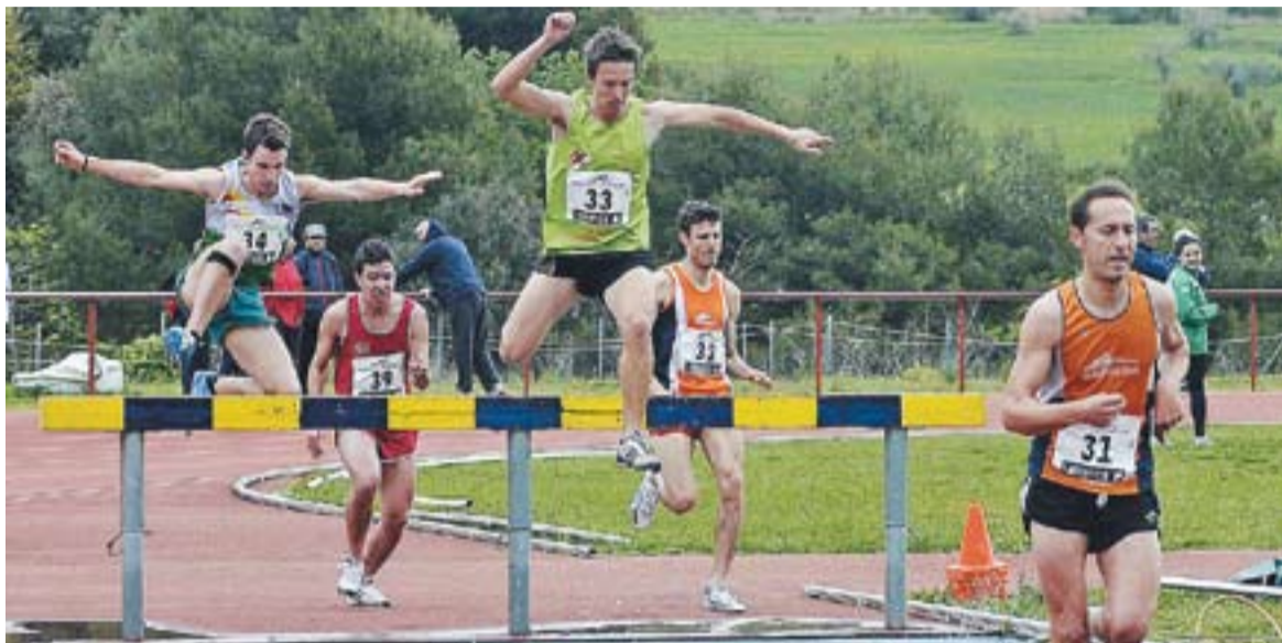
Un moment de la competició celebrada a les pistes d'atletisme castellarenques.

Les pistes d'atletisme han acollit la segona part de la lliga de primera divisió catalana amb una potent participació del CAC