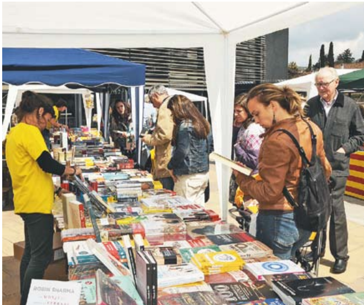
Tot i la pluja i els núvols, la plaça d'El Mirador va tenir moments de força aflluència de castellarencs.