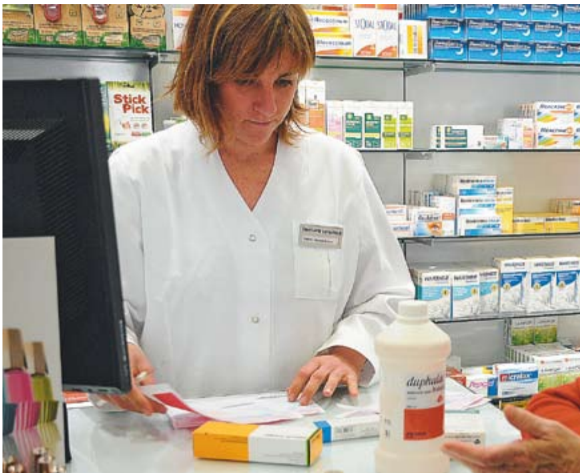
⊙ Una clienta demana unes receptes a la Farmàcia Yangüela.