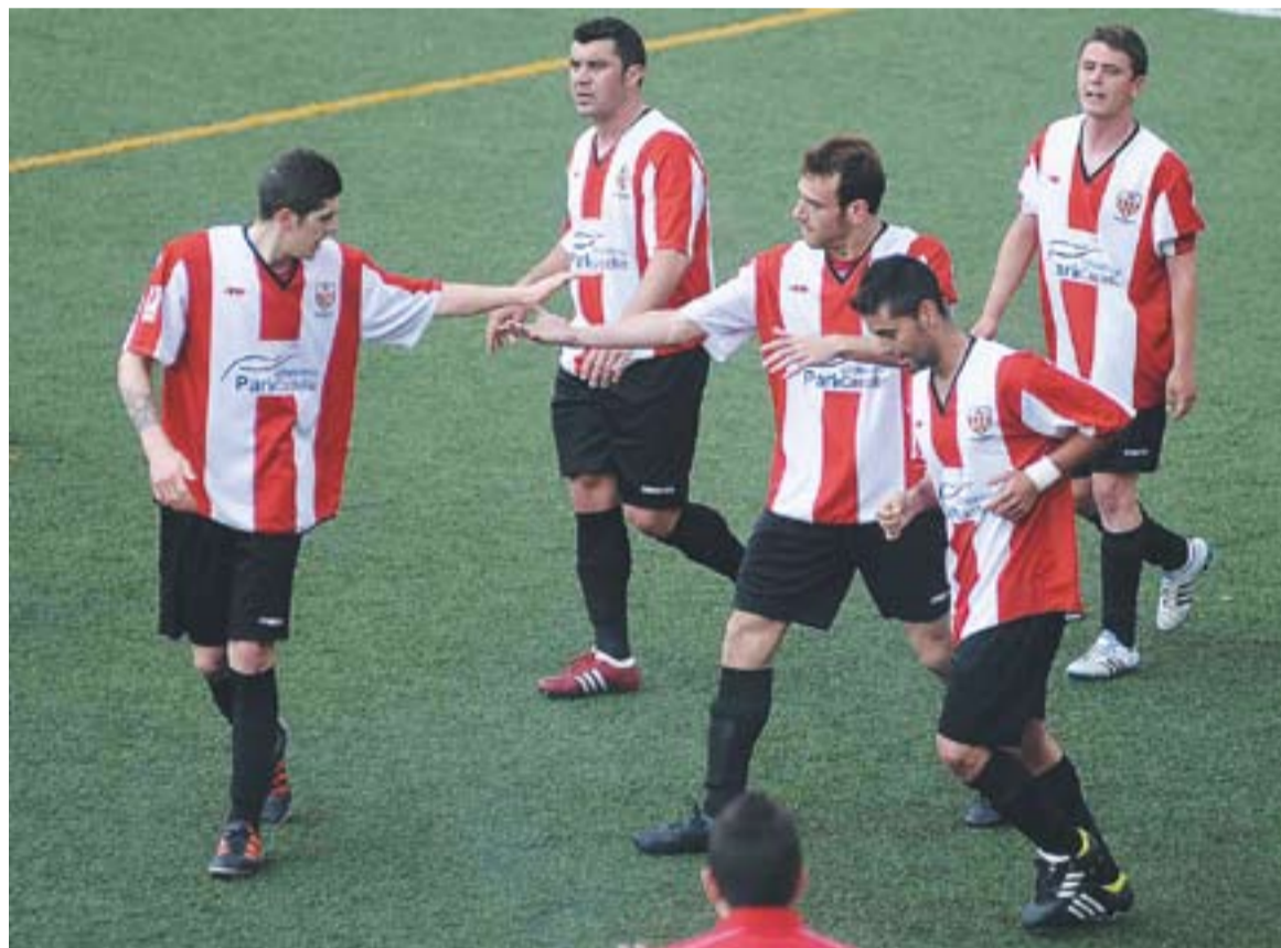
Ⓞ Jugadors de la Unió Esportiva celebrant un dels dos gols que van marcar al Pepín Valls. || JOSEP GRAELLS

“A aquesta recta final guanyar dos partits seguits significa una injecció de moral molt potent, a més, l'equip està capacitat per guanyar tots els partits que queden”, assegurava Díaz. El cert és que diumenge a Vilanova del Vallès tornaran a protagonitzar un altre duel entre equips que no tiren la tovallola. Malgrat estar en descens, el Vilanova arriba en línia ascendent. Quatre victòries, dos empats i només una derrota en els últims set partits han permès als del Vallès Oriental seguir somiant una permanència que a principis de la segona volta quedava molt lluny. Com el Castellar, afrontaran el partit de diumenge conscients que la lliga s'acaba, hi ha poc marge