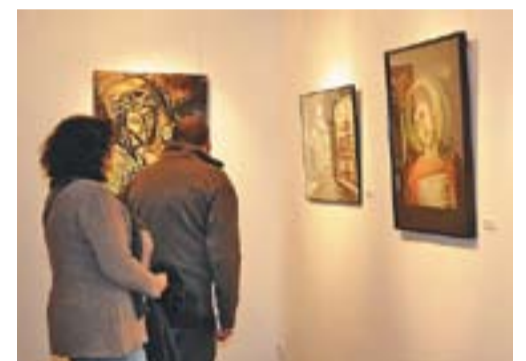
Moment dels parlaments, en la imatge superior, i dos visitants d'una de les quatre exposicions de l'homenatge Raimon Roca.