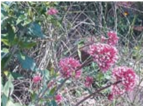
La veritable flor de Sant Jordi Autor: Carme Padrisa

Envia'ns fotos fetes amb el mòbil: lactual@castellarvalles.cat