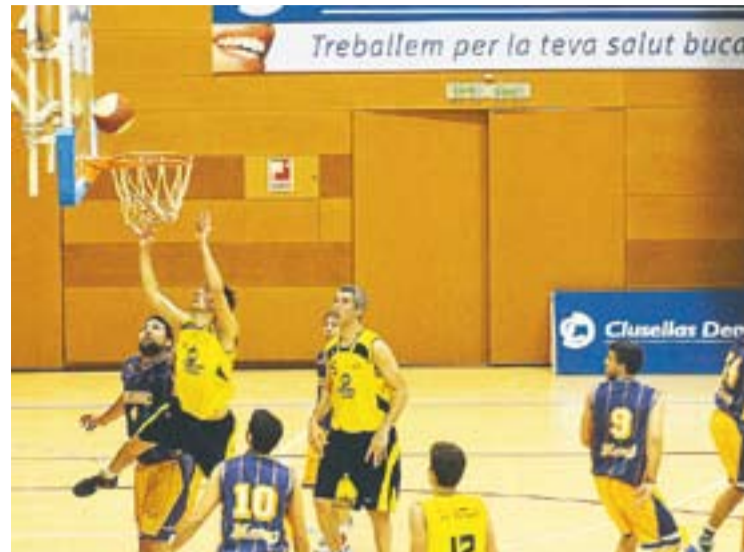
© Un moment del partit disputat al Pavelló Puigvert. || J.G.