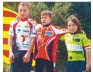
© Axier Casado al podi || CEDIDA

De la seva banda, Axier Casado a la categoria de principiant va aconseguir pujar al podi en tercera posició i es va consolidar com un dels favoritats per guanyar. || A.G.