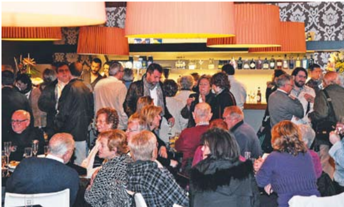
Aquest era l'ambient el dia de la inauguració del Calissó reformat, divendres passat.

L'equipament ha programat un cicle de projeccions, monòlegs i actuacions