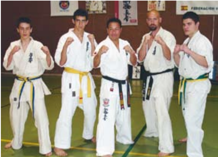
© Els participants del campionat que s'ha celebrat a Madrid. || CEDIDA