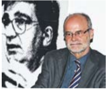
© Castells a la xerrada. || J. GRAELLS

Una altra de les qüestions en què han centrat la xerrada inaugural del grup ha estat la unió monetària d'Europa que segons Castells “està incompleta fins que no s'assoleixi la unió política amb una integració fiscal”. El catedràtic apunta que “la unió política s'ha de fer de manera federal i no intergovernamental, com fins ara, perquè França i Alemanya tenen capacitat de decidir