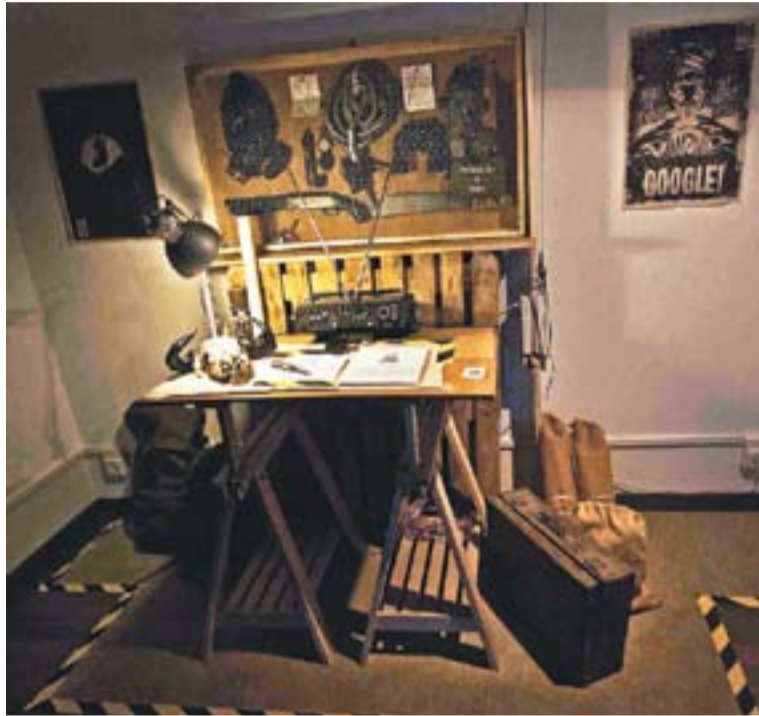
Muntatge per una de les exposicions anteriors de Jordi Ponsa.

un escenari, i acompanyats d'una emissora de ràdio "que també juga un paper important, ja que durant la inauguració es podrà sentir un àudio, amb anuncis inclosos, i amb una temàtica relacionada amb el contingut de les obres", afegeix Ponsa.