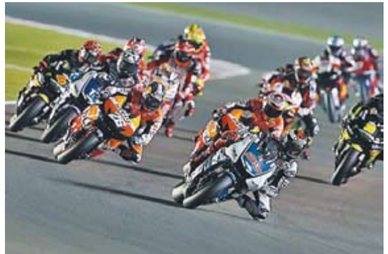
Un moment de la cursa a Qatar.

ELS RIVALIS DE PEDROSA || Jorge Lorenzo va tenir un inici perfecte a Qatar aconseguint la seva pri-