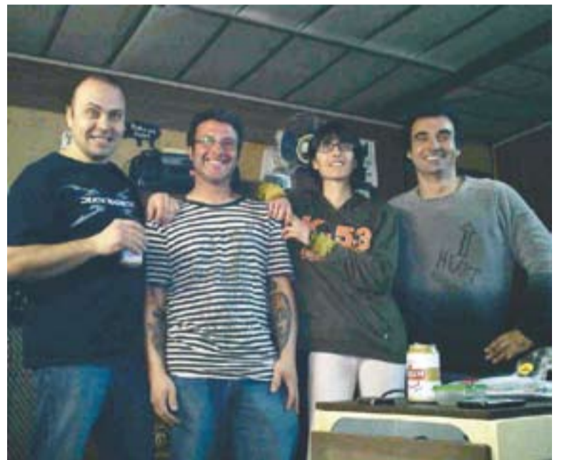
© El grup Tot presenta el seu primer disc. || L'ACTUAL

La presentació del disc es farà el mes de juny a Sabadell i anirà de gira per Catalunya. El primer concert previst serà el 17 de maig a Terrassa.