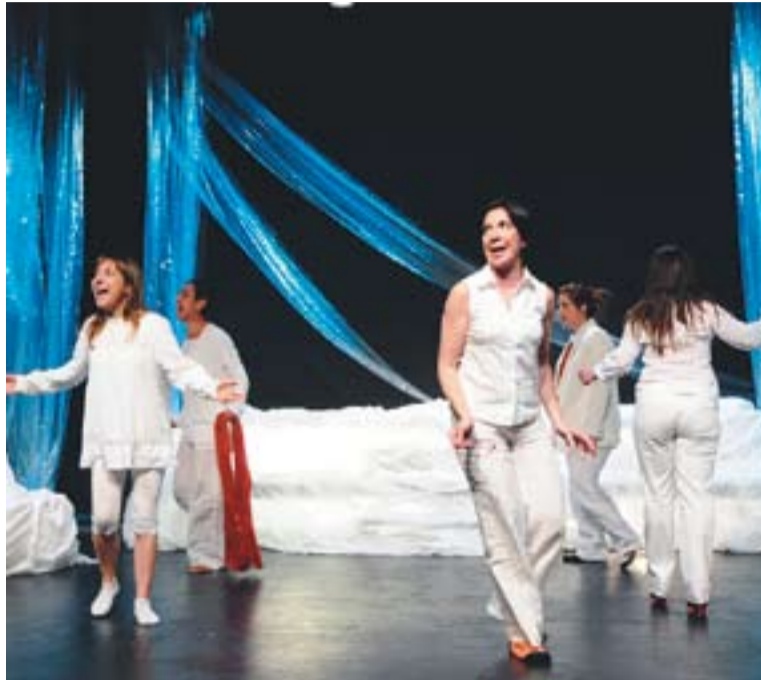
⊙ Imatge de l'assaig de l'obra 'Això no és vida' || JOSEP GRAELLS

S'ha variat molt poc el text, que és el més destacat de l'obra,