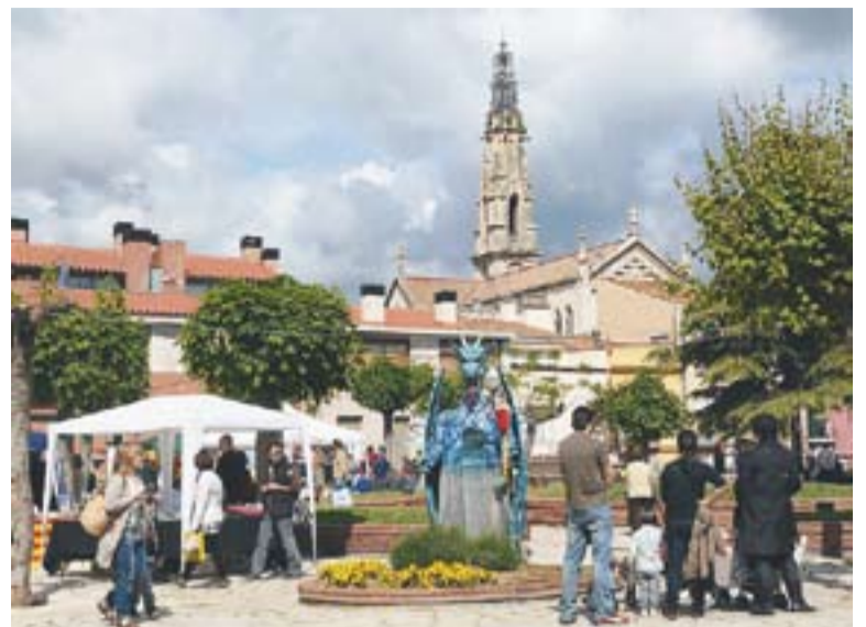
Celebració de Sant Jordi a la plaça Major, any 2011.