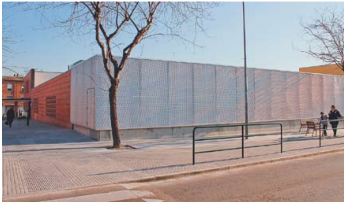
⊙ Vista del CAP Castellar ampliat

Amb la nova reordenació, el Centre d'Atenció Especialitzada de Sant Fèlix prestarà atenció diària de 8 a 20 hores i atendrà les visites relacionades amb diagnòstic prenatal (amb capacitat tècnica per fer ecografies d'alta definició i processos inva-