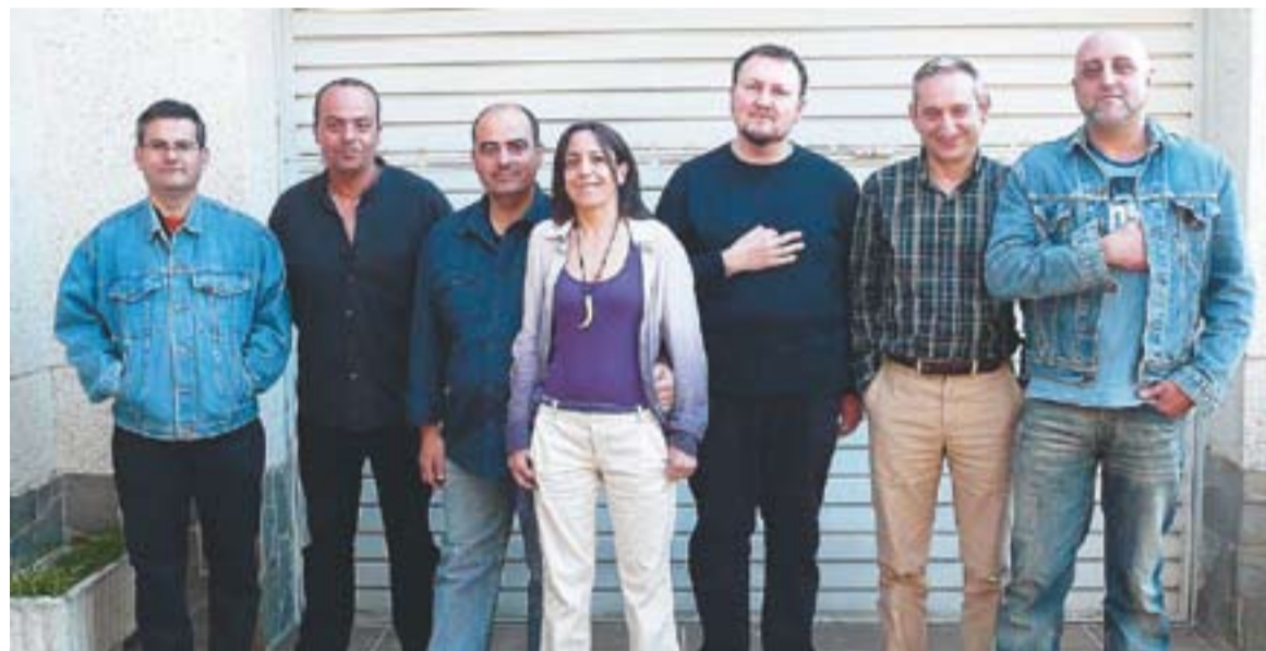
© Components de l'entitat Zeta Acció Cultural, de la qual en formen part castellarencs. || L'ACTUAL

Seràn quatre taules rodones a la Sala d'Actes d'El Mirador de Castellar [com es pot veure en el quadre que acompanya aquesta informació], i la projecció de quatre Audiovisuals i la presentació d'una Exposició, per fer-nos reflexionar