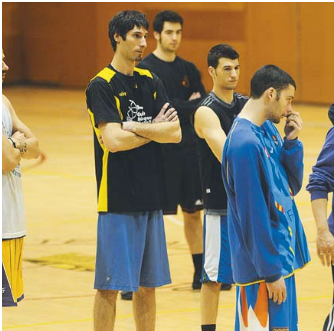
Jugadors del Club Bàsquet Castellar en un entrenament recent al Pavelló Puigverd.