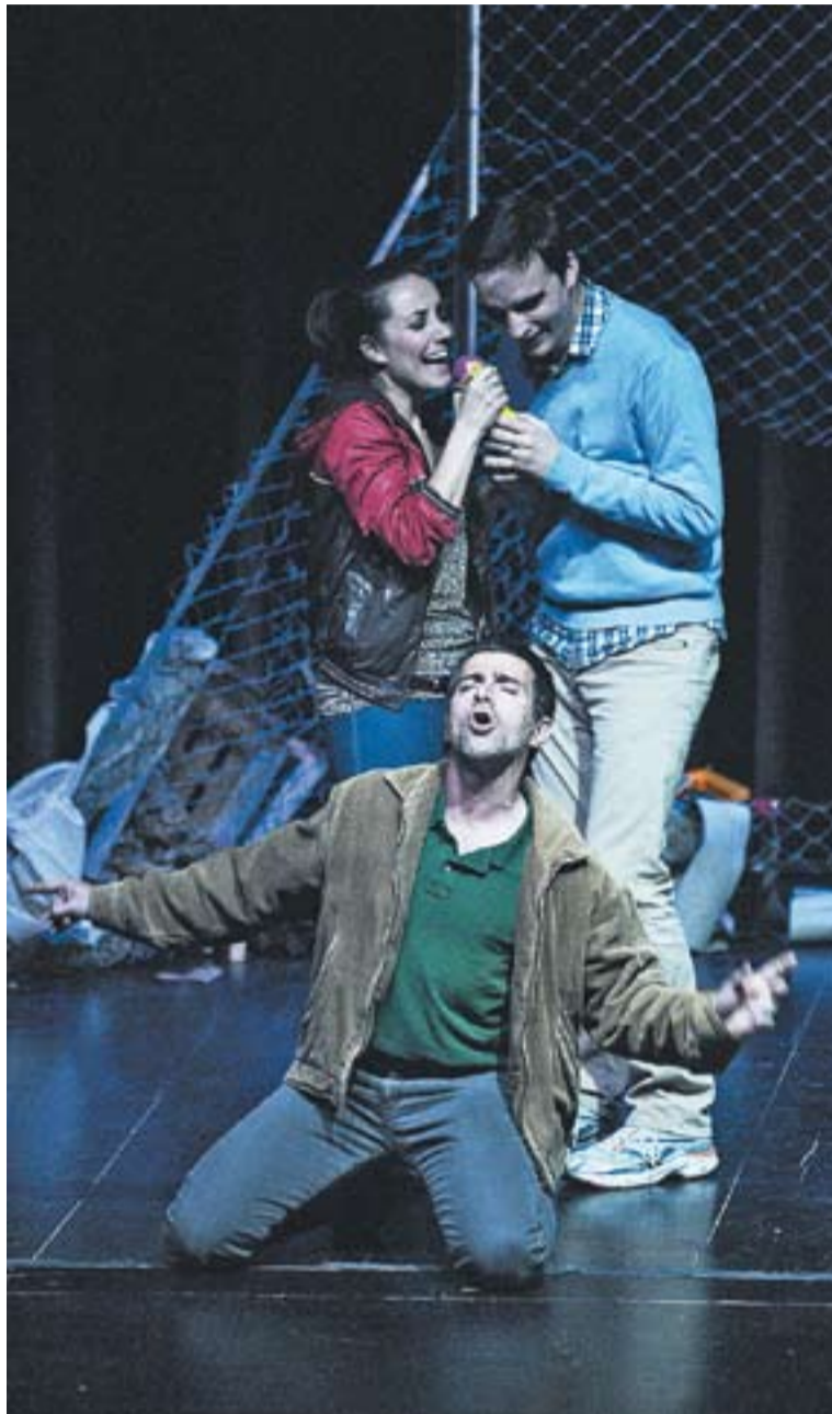
© Els tres actors protagonistes de l'obra, dissabte passat. || JOSEP GRAELLS

més volgudes. Els actors de 'Rates (abans que la lluna caigui)' no són mediàtics, ni veterans, ni reconeguts, però són gairebé perfectes mentre els veiem actuar en un escenari ombrívol, nocturn, abandonat. Un escenari ple d'escombraries i rates, uns animalons que ells s'imaginen com esquiroles saltant damunt dels seus caps. Per fi, mentre la lluna cau, s'imaginen que són lliures i que podran ser lliures. La felicitat és la catarsi d'allò que ens ha fet patir en el passat. Forma part de la condició humana, s'acabi o no s'acabi el món. En aquesta producció de J.J. Moyano se'ns obre la ferida del dolor per ser cicatrizada. +