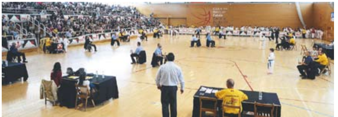
Un moment del campionat de Katas al Puigverd ple de gom a gom.

la vila 4 anys i ja compta amb 80 adeptes que el practiquen i que entrenen setmanalment, “és la modalitat més dura que existeix de karate on s'apliquen tècniques de defensa personal i de combat que cada cop agrada més a