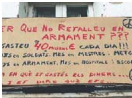
Diga'm en què retalles... Autor: Carme Padrisa