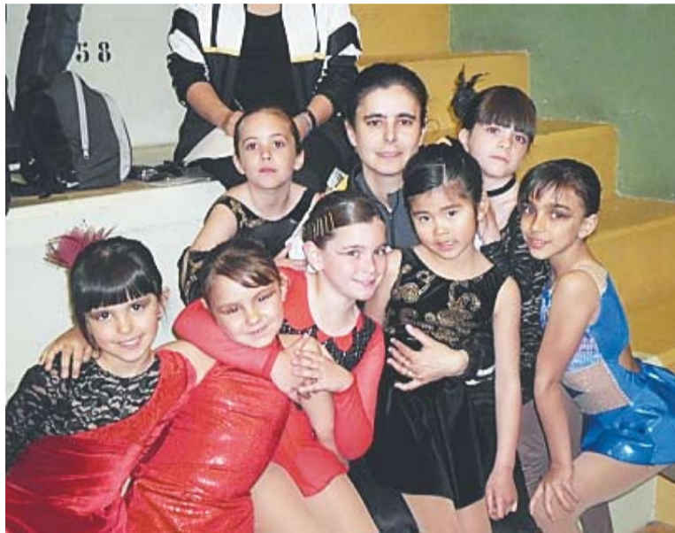
Algunes de les participants del campionat i l'entrenadora de l'equip.

“Ens ho hem passat molt bé i s'han superat les expectatives que teníem” , assegurava Puigbó, i és que només cal analitzar els resultats: 8 copes, 5 medalles de plata i 4 medalles de bronze. Tot un rècord que en aquests 6 anys de participació castellarenca mai s'havien aconseguit. Però això no és tot, perquè dels 22 clubs participants s'ha fet una llista dels millors i dels que han aconseguit les