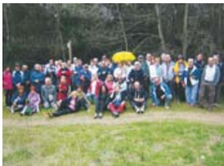
Darrera sortida Vine i Camina +60 Autor: Jaume Vinyals

Envia'ns fotos fetes amb el mòbil: lactual@castellarvalles.cat