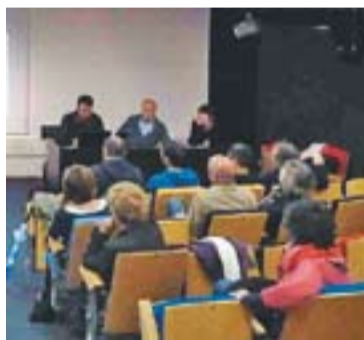
⊙ Assemblea CCCV. || CEDIDA

Per finalitzar, es va aprovar la ratificació dels membres de la junta que s'ha reduït lleugerament de 12 a 10 membres i s'ha renovat amb una nova vocal. Com a novetat, l'entitat començarà a partir d'ara amb col-