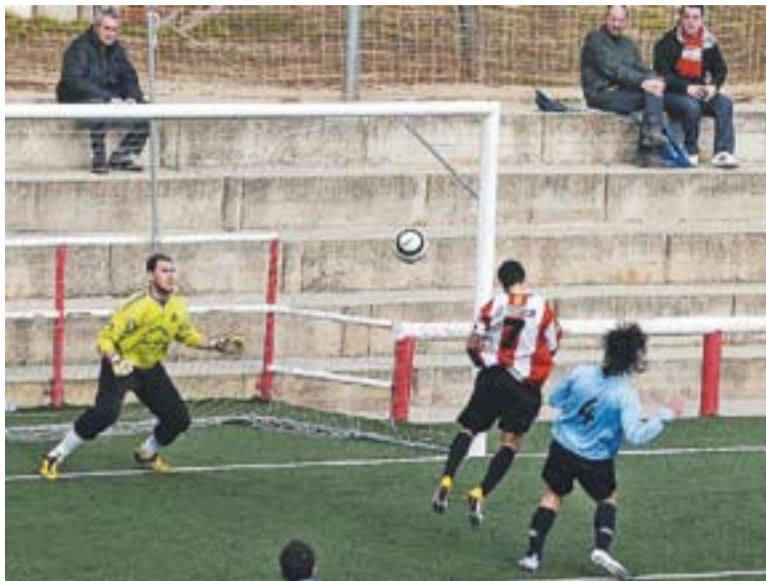
Un dels últims partits de la Unió Esportiva Castellar