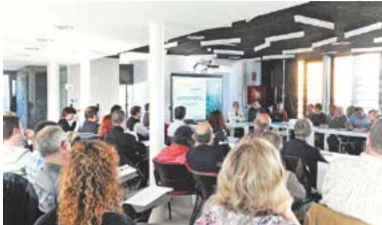
La reunió va tenir lloc a la sala Opensurf d'El Mirador.

Alhora, també es van plantejar les determinacions que s'estableixen en el Pla Territorial Metropolità de Barcelona aprovat el 2011.