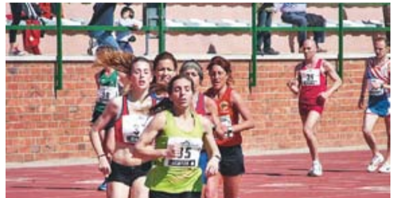
Una prova femenina amb una participant del CAC en primer terme.

D'altra banda, diumenge se celebrarà a la vila la segona part de la trobada de la lliga de primera divisió catalana on vuit equips lluiten per intentar quedar entre els primers i no haver de baixar a segona categoria.