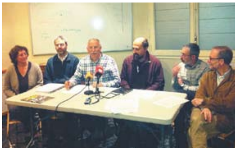
© Membres d'Entesa, L'Altraveu, l'ADENC i la UES a la roda de premsa. || ADENC

A la carta del Ministeri d'Indústria, Energia i Turisme es pot llegir una altra justificació d'aquesta obra fins a Hostalric, concretament: “La seva justificació és d'una altra índole i es desen-