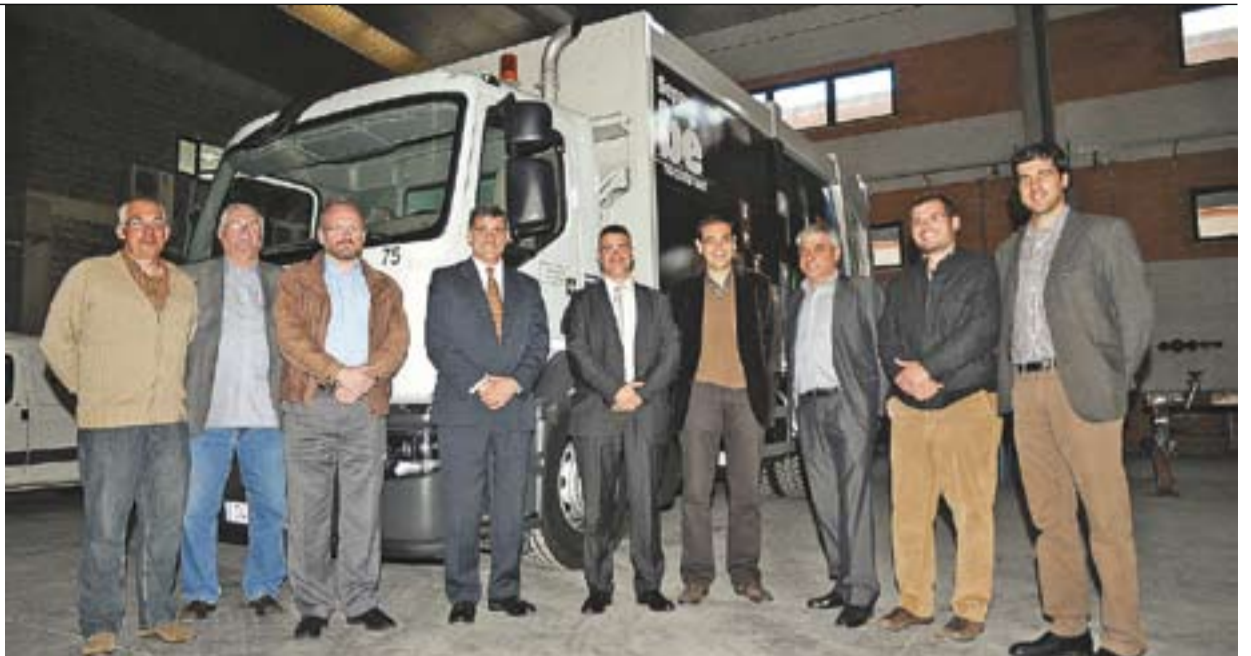
© Directius de MOBA d'EUA i Castellar, acompanyats de l'alcalde i els regidors de Castellar. || JOSEP GRAELLS