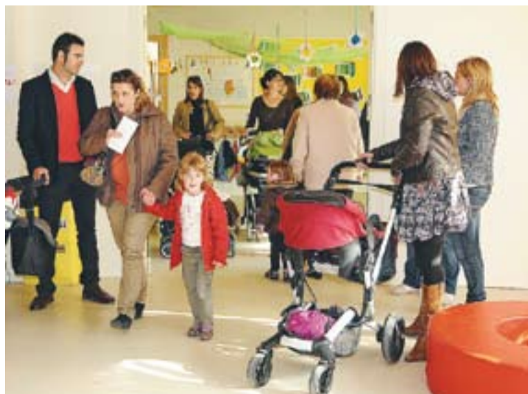
⊙ Pares i mares visiten les instal·lacions de l'Escola Bressol Colobriers.

PORTES OBERTES || Precisament les dues escoles bressol municipals, l'EBM Colobriers (de 94 places) i