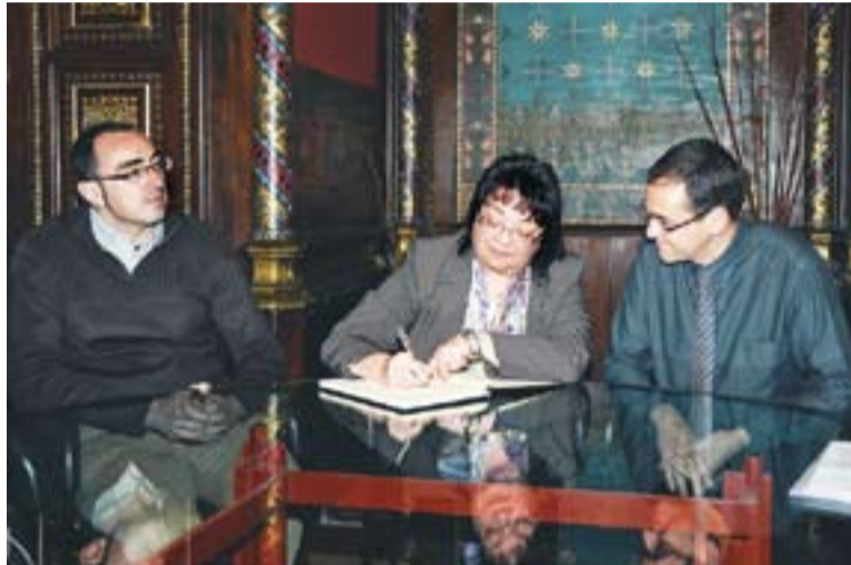
La presidenta del Consell Comarcal signa al Llibre d'Honor del consistori.

Durant la reunió l'alcalde ha informat la presidenta de l'experiència que en els darrers mesos han dut a terme els municipis de Castellar, Sentmenat i Sant Llorenç Savall "per tal d'estudiar la possibilitat de mancomunar serveis i poder fer compres i licitacions conjuntes". La col·laboració entre els tres municipis que es va iniciar fa més de vuit mesos, es