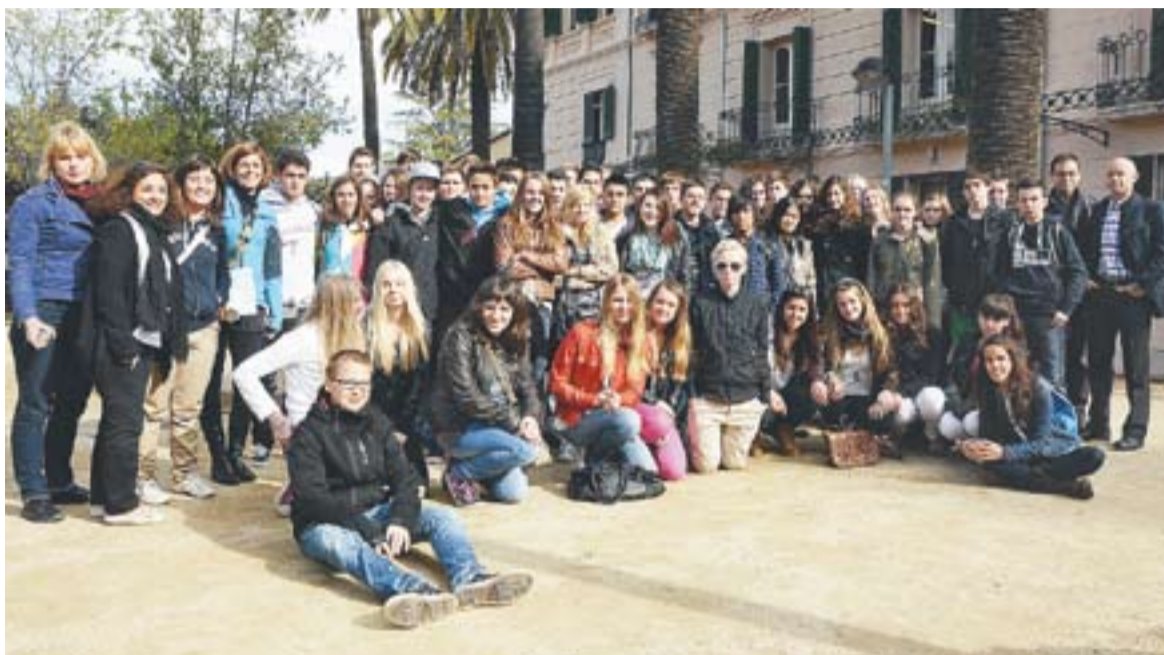
Foto de família davant del Palau Tolrà dels alumnes suecs amb els castellarencs, professors i autoritats municipals.