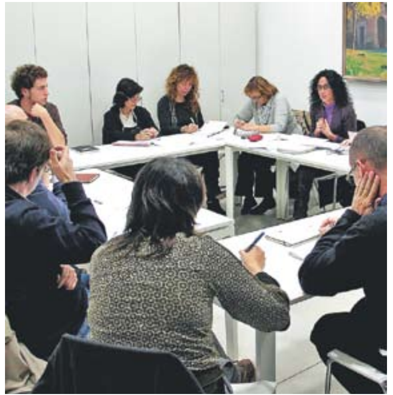
⊕ Reunió del Consell de Cooperació al novembre passat.

clogui algun tema relacionat. Així va passar recentment amb la Federació d'Associacions de Mares i Pares defensant una moció en defensa de les inversions de la Generalitat al municipi. I també podria passar a la sessió d'aquest dimarts que ve, ja que hi podria intervenir el membre d'ERC, Oriol Papell, defensant la moció de sumar-se a la xarxa de municipis per a la independència. +