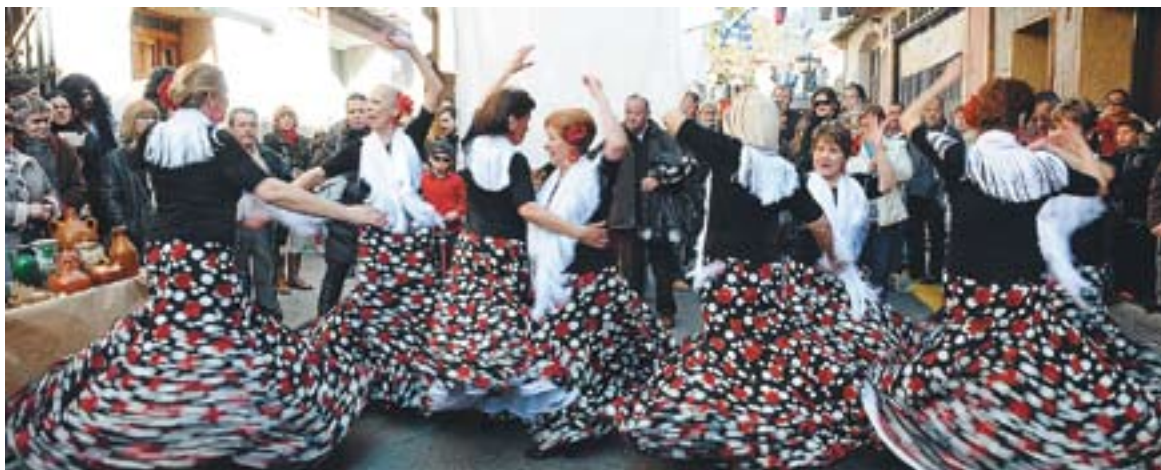
El mercat gitano del Carrer Major es va omplir de colors i de gent durant tot el matí.