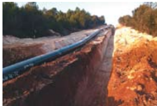
Avancen les obres... Autor: Josep Maria Borruei