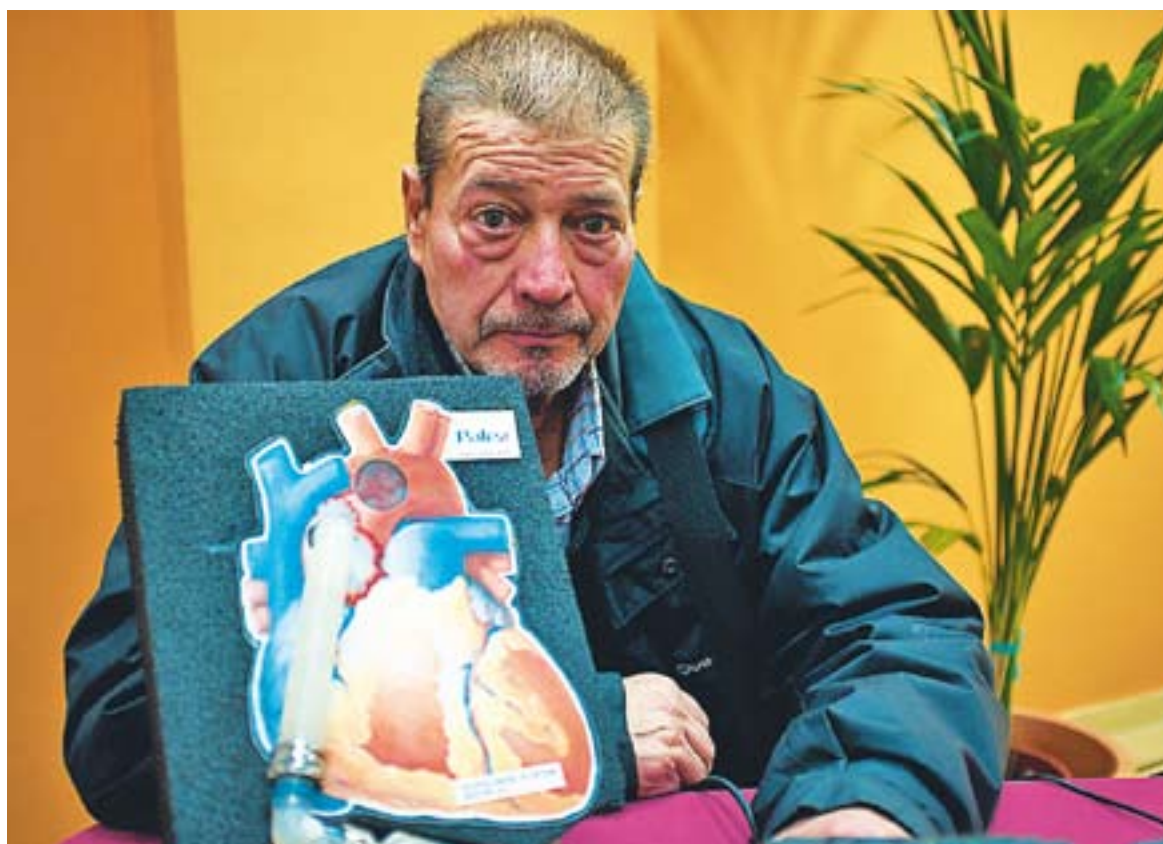
© Eufemio García, dilluns passat a l'Hospital de Bellvitge, on va ser operat.