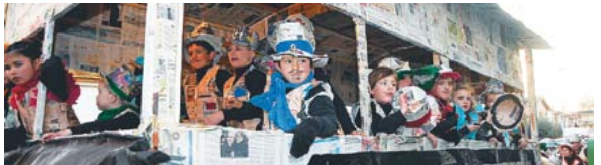
© Carrossa i comparsa guanyadora de l'AMPA El Sol i la Lluna. || JOSEP GRAELLS