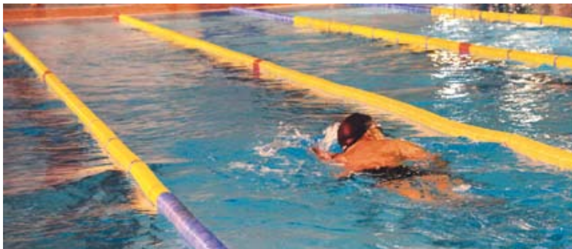
© La triatló inclourà una prova de natació de 500 metres a més d'una cursa a peu i una altra en bicicleta || I.M.

L'Arturo ha aconseguit que el patrocini empreses castellanques com JF Painter, Fotonova i la coneguda empresa de cascos LS2 Helmets. ➔