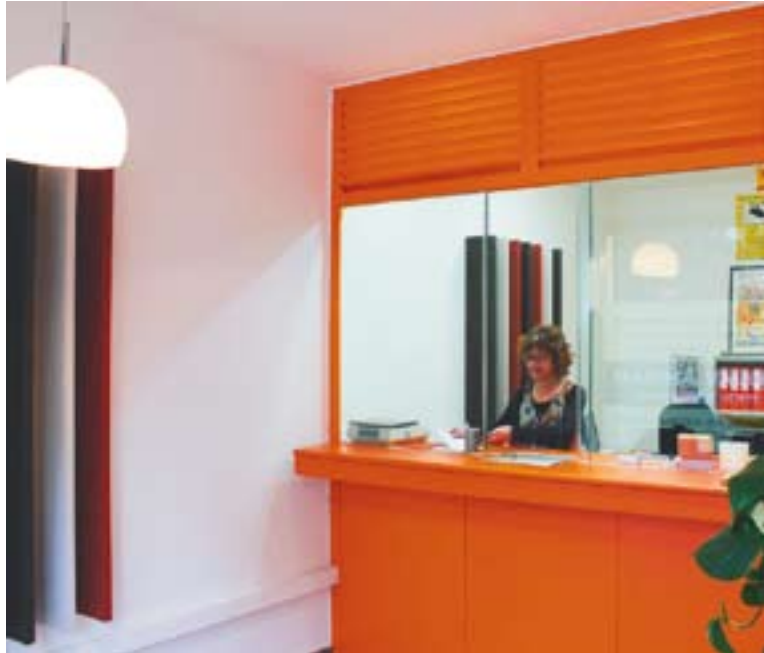
© Interior de la botiga '3 Or' que ha obert recentment. || ISMAEL MARTÍNEZ

L'activitat principal d'aquests negocis és la compra d'or. L'inte-