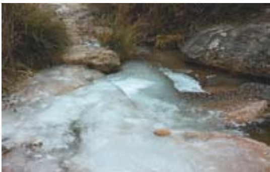
El Ripoll gelat Autor: Carme Padrissa

Envia'ns fotos fetes amb el mòbil: lactual@castellarvalles.cat