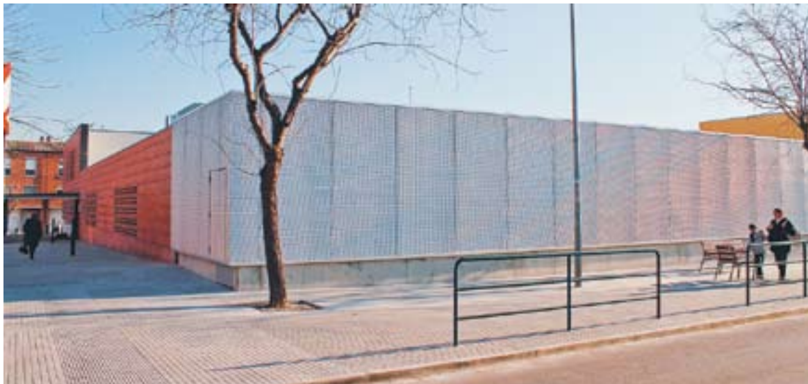
El CAP amb la part que s'ha acabat d'ampliar recentment.

La desaparició del servei d'urgències nocturn ha propiciat un canvi a les visites