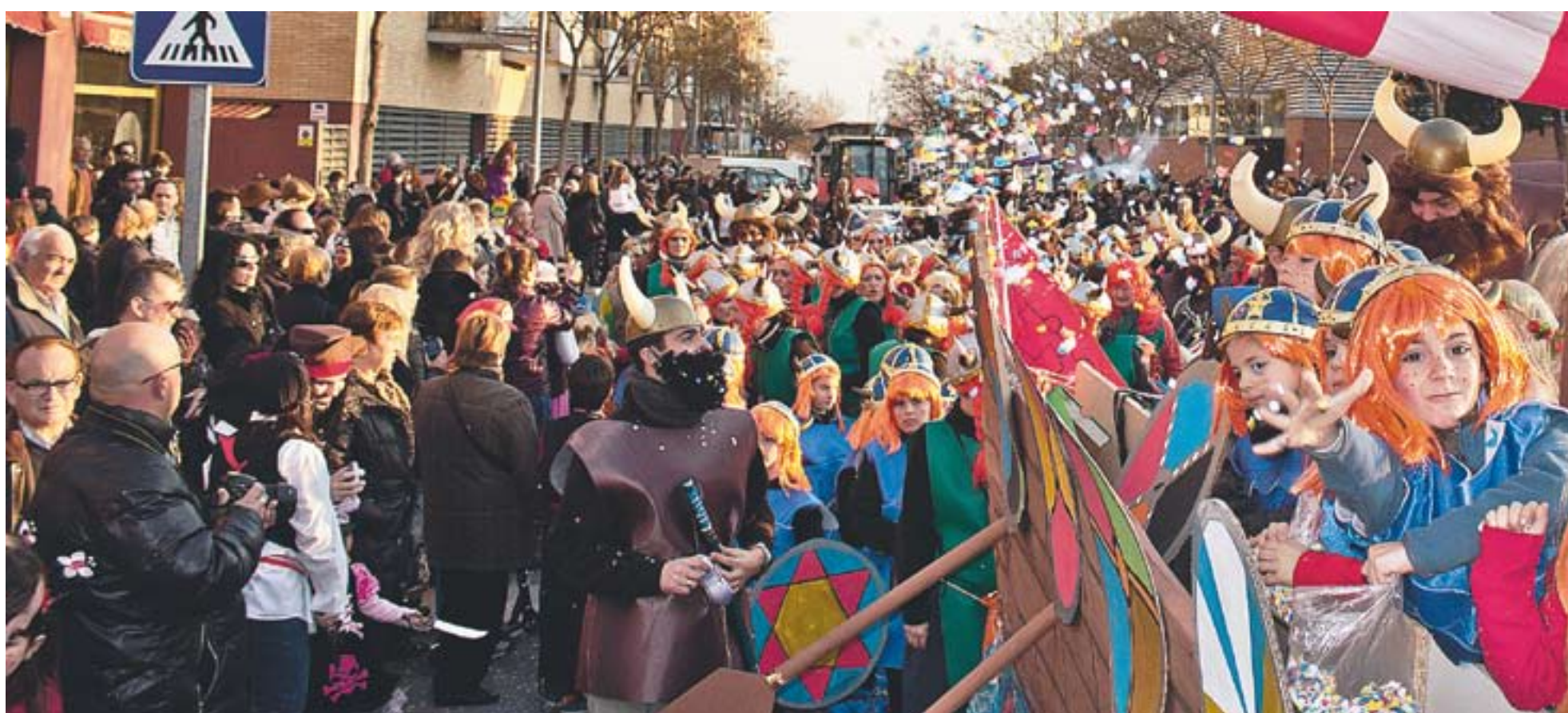
Una de les colles surt de l'Espai Tolrà en l'inici d'una rua que va comptar amb un total de 1.200 participants.