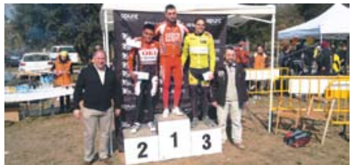
Ciclistes de Bike Tolrà al pòdium.

cidit un dia amb el partit del Barça de Champions i, evidentment, són dies en els que a la gent li costa més venir i jugar". Tot i aquestes petites coincidències més de 132 persones han pogut gaudir del pàdel en competició durant aquesta setmana i rebre per la seva participació una samarreta de regal. +