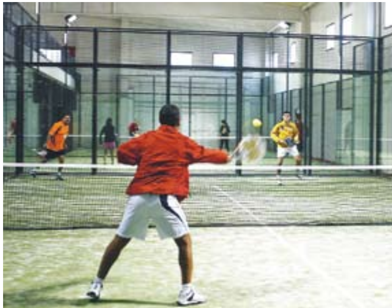
Un partit al matchball pàdel.