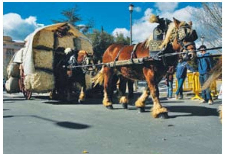
⊙ Tres Tombs de l'any passat.

L'Associació Amics de Sant Antoni Abat organitza la festa de Sant Antoni des de l'any 1994, amb la col·laboració de l'Ajuntament de Castellar i la Federació Tres Tombs. +