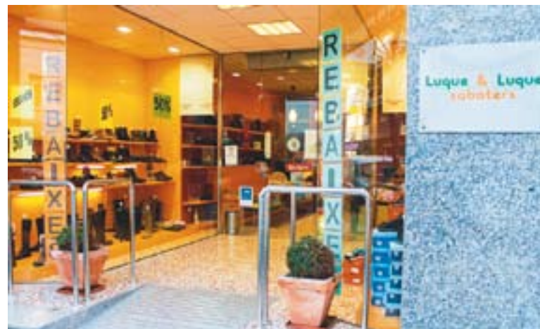
A l'esquerra La Merceria, a la dreta la sabateria Luque & Luque.