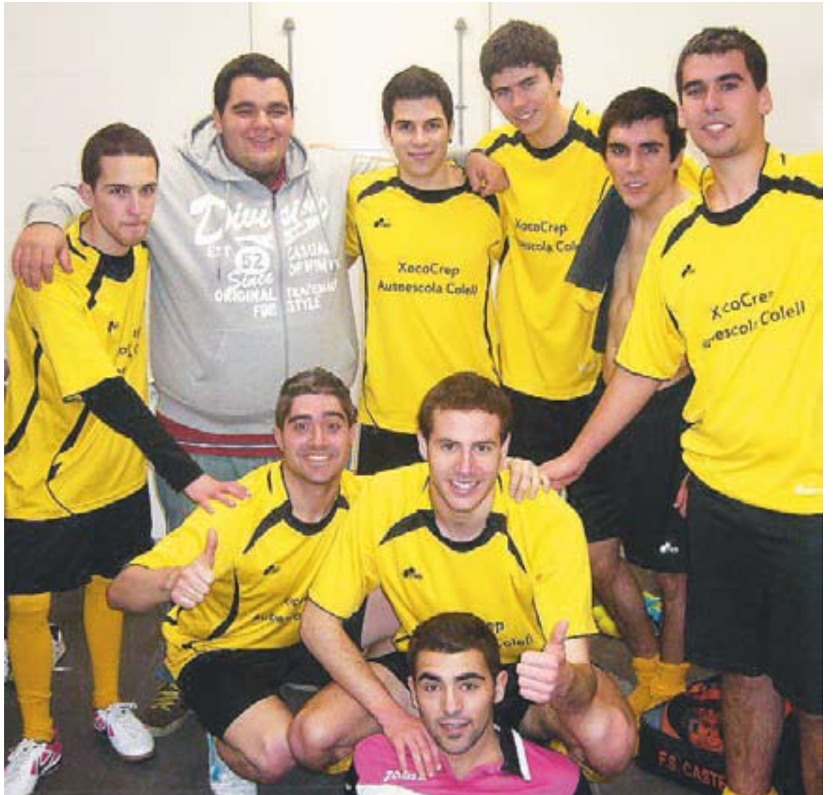
Equip guanyador de la Copa Social organitzada per Futbol Sala Castellar.

Pel que fa al golejador de la Copa Social 2012, el títol ha recaigut en Joel, un dels jugadors de l'Autoescola Castellar - Can Juliana amb 9 gols aconseguits durant les 5 jornades del torneig. +