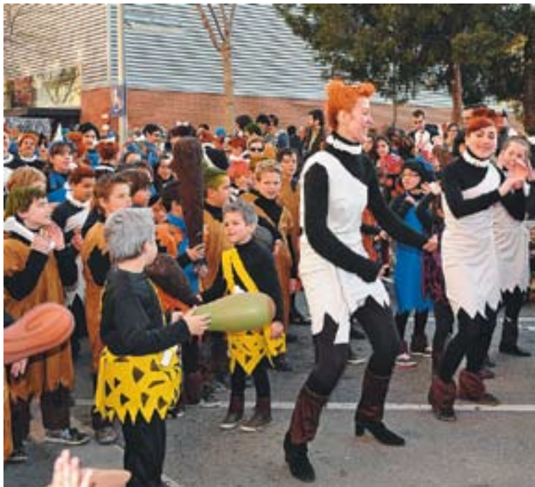
© 'Els Picapedra', comparsa guanyadora de l'AMPA Bonavista. || ISMAEL MARTÍNEZ

La Rua de Carnestoltes, la festa al carrer, el ball i la disbauxa van ser els protagonistes de la vila durant tot el cap de setmana