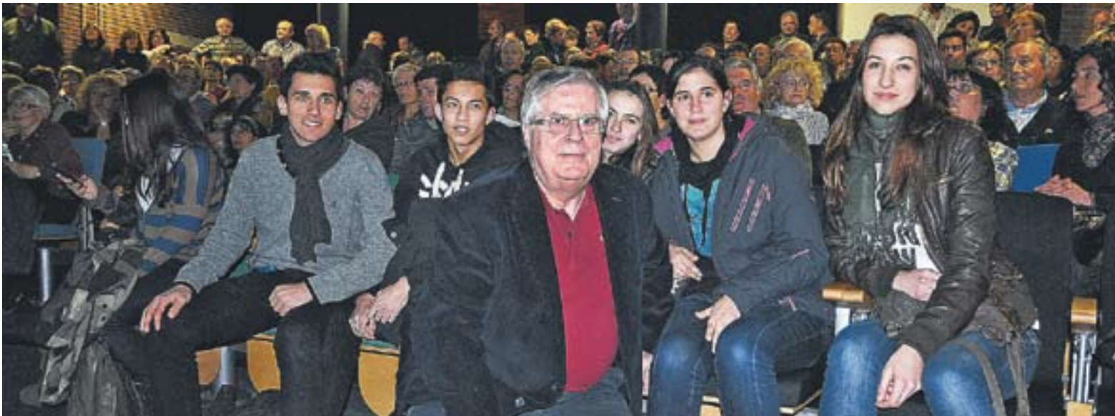
En primer terme, els autors dels curts castellarencs projectats amb gran èxit de públic dilluns passat.