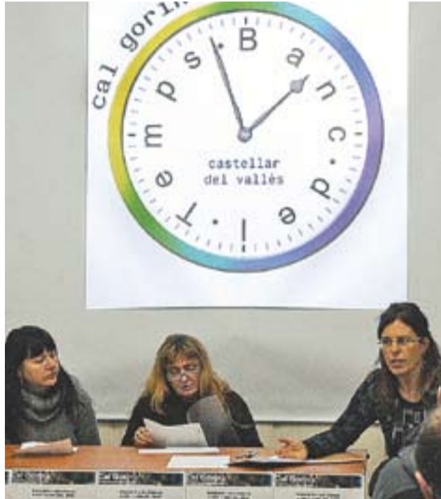
Presentació del Banc del Temps a Cal Gorina.