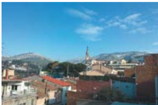
Castellar amb muntanyes emblanquinades

Envia'ns fotos fetes amb el mòbil: lactual@castellarvalles.cat