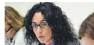
© Massagué, regidora de Serveis Socials.

Els adults també seran un dels principals àmbits d'actuació del pla. Massagué apunta que s'intentarà donar cobertura a necessitats com el servei l'assessoria jurídica gratuïta, i "es promouran els ajuts puntuals per superar situacions com l'impagament de rebuts de subministraments o alimentació" . D'altra banda, també