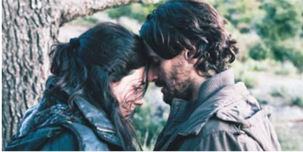
⊙ Els protagonistes de 'Dictado' rodada al Parc Natural de Sant Llorenç.

Aquesta cinta s'ha fet amb muntatge analògic, "que és el muntatge clàssic de seqüències empalmades amb acetones i rodada en 35 mil·límetres" , explica Martos. És un format que actualment s'utilitza molt poc, "però que encanta al director Antonio Cha-