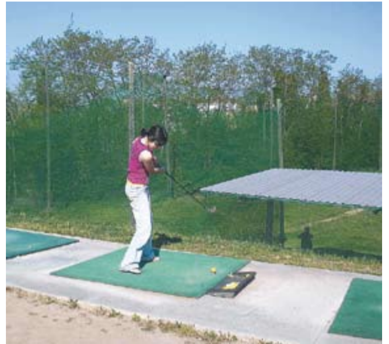
A l'esquerra, vista general de les instal·lacions on es pot practicar golf a Castellà. A la dreta, dues persones practiquen aquest esport a les instal·lacions.