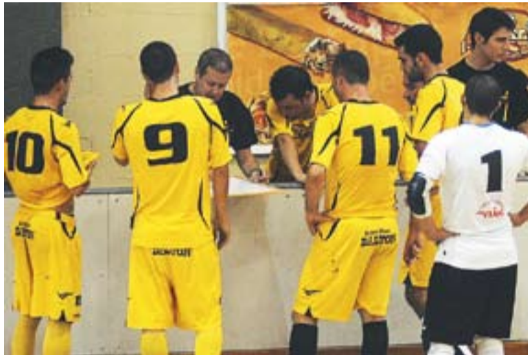
Marta, envoltat dels seus jugadors, en una imatge d'octubre passat.

EMPAT DEL FS CASTELLAR || D'altra banda, tampoc no van acabar contents del tot els del Futbol Sala Castellar el cap de setmana passat. Van aconseguir un empat a 2 que, segons el seu entrena-