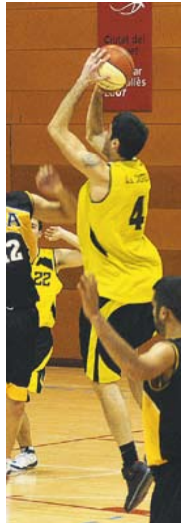
© Els sous del sènior s'han reduït. || J.G.

Comellas i el seu equip preveuen eixugar totalment el dèficit en tres o quatre anys i la seva intenció és tenir-lo rebaixat uns 8.000 euros per a final d'aquesta temporada. Per ajustar els pressupostos ha estat clau la col·laboració de jugadors i entrenadors, que han acceptat una nova revisió a la baixa de la seva remuneració. També es preveu que hi hagi alguna aportació individual que permeti alleugerir les arques del club. Poc temps hi va haver a l'assemblea per a la plana esportiva. L'objectiu principal és mantenir el sènior a Copa Catalunya. †