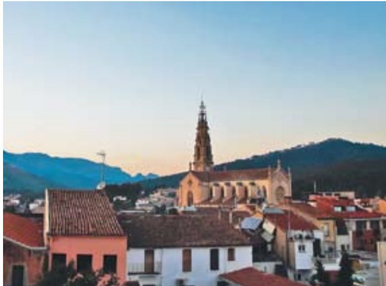
El POUM determinarà les línies futures de desenvolupament del municipi.

El POUM és l'instrument d'ordenació integral del territori que té per objectiu determinar les línies bàsiques futures del desenvolupament del municipi. En aquest sentit, defineix el model de ciutat