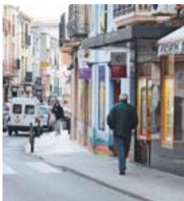
A l'esquerra, el carrer Major i a la dreta, el de Sala Boadella.