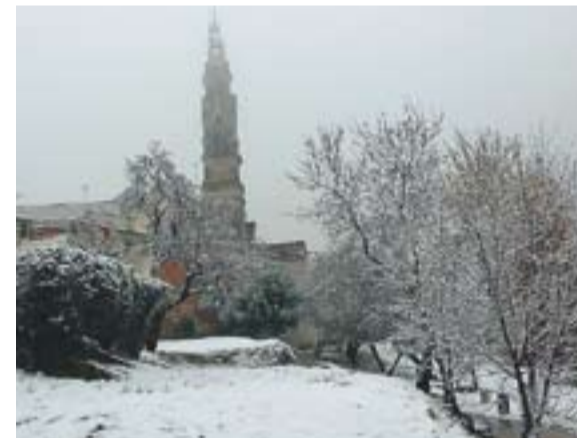
© Imatge del parc de Canyelles nevat. || CARMÈ PADRISSA