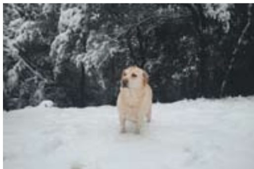
Sherpa trepitjant la neu