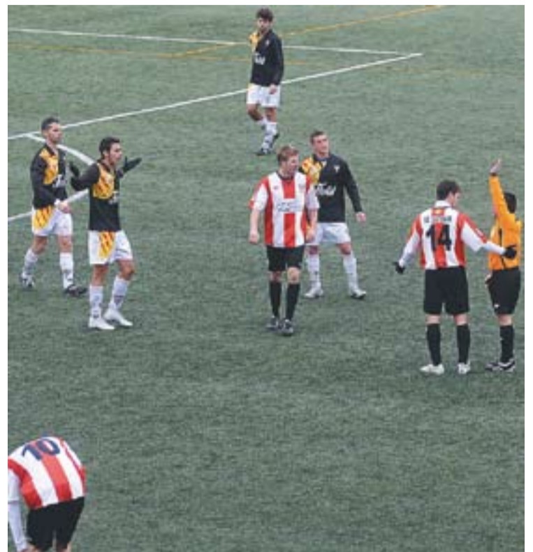
Un moment del partit entre la UE Castellar i el Parets.

na s'enfronten a l'equip de Quatre Camins que “són fluixos i més al camp contrari, així que hauríem de guanyar de manera sobrada” , apunta Jiménez. Els de Jiménez tenen les properes dues setmanes la possibilitat de millorar els resultats que fins ara han aconseguit. El tècnic ha explicat que confia en l'equip i que només vol recuperar els lesionats, ja que d'aquesta manera i amb una mica de sort està segur que podran lluitar per l'ascens i quedar segons o tercers de la classificació. +