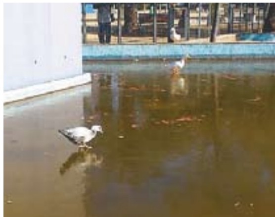
© Ànecs caminant sobre l'aigua. || EMMA QUER