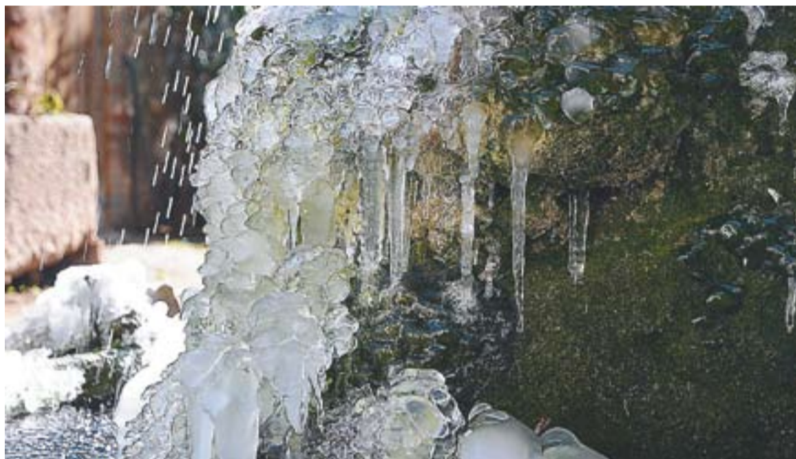
Aquest era l'aspecte del sortidor de Cal Gorina.

El fred siberià situa els termòmetres a prop dels zero graus aquest febrer