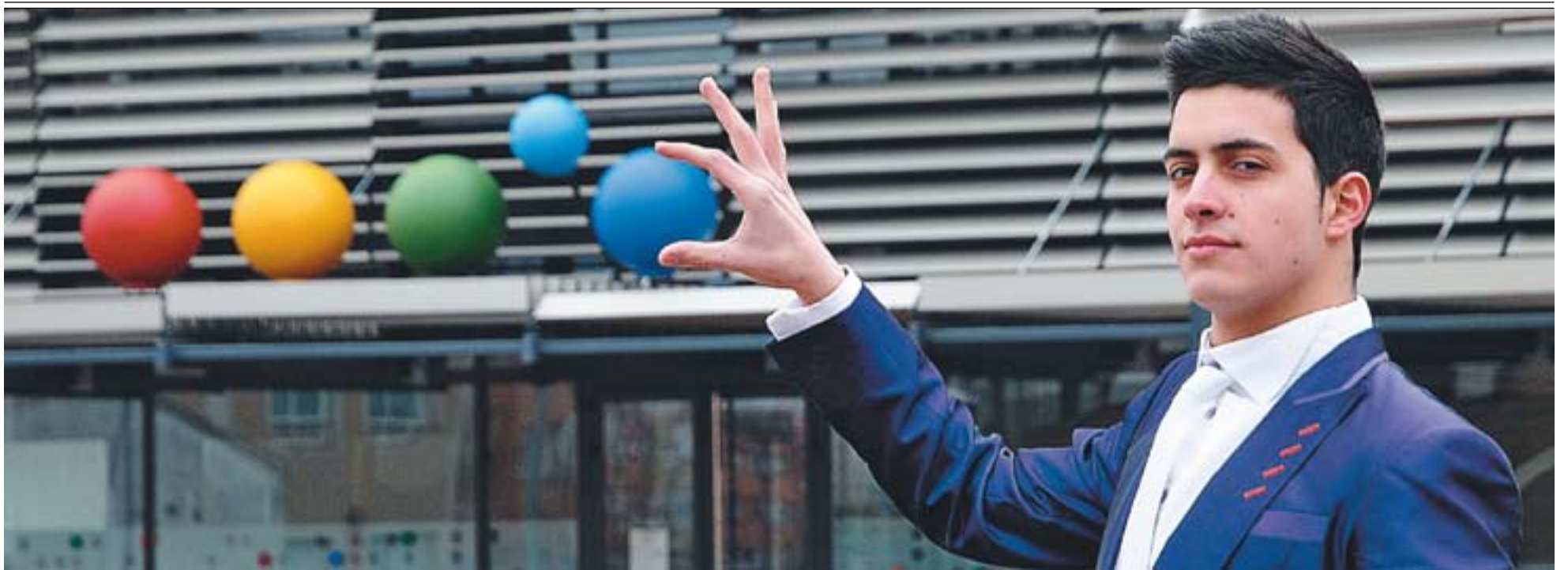
© Roger Oller, davant d'El Mirador, juga amb la perspectiva. || JOSEP GRAELLS