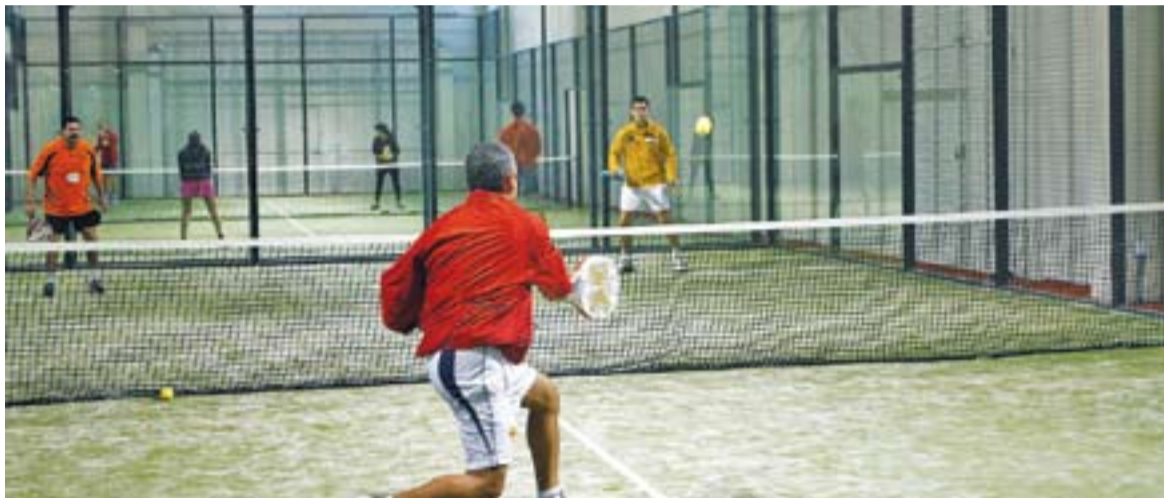
© Les instal·lacions de Matchball Padel, a banda de pistes de pàdel, compten amb altres espais per a fer esport. || I. MARTINEZ

Les inscripcions per participar en aquesta primera edició encara estan obertes fins les 21 hores d'avui divendres