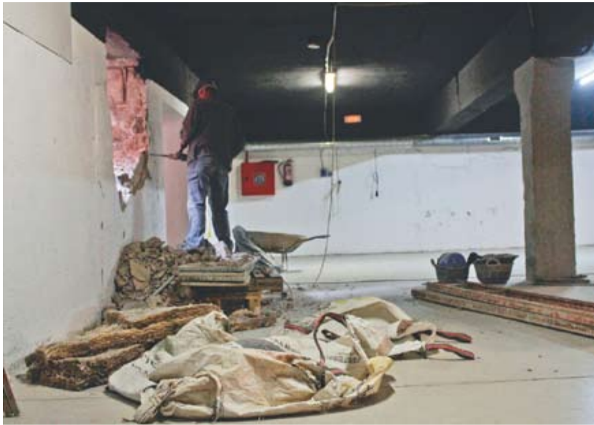
Les obres han començat en el soterrani de l'edifici on es preveu obtenir fins a sis sales

El soterrani de l'edifici, que fins ara acollia una sola sala on es realitzaven exposicions i tallers, es reconvertirà de manera que s'hi adequaran sis sales. Així aquest espai comptarà amb una sala d'exposicions de 191 m 2 , una sala de 69 m 2 amb terra de goma per facilitar la realització d'activitats corporals, tres sales on principalment es duran a terme tallers i manualitats i que tindran sortida al pati posterior de l'edifici, on s'instal·laran piques, i una sisena sala polivalent, de 43 m 2 , on es podran dur a terme activitats com ara els tallers de construcció de robots de Lego Education. “La sala amb terra de goma la fem perquè és una demanda de moltes entitats que volen fer