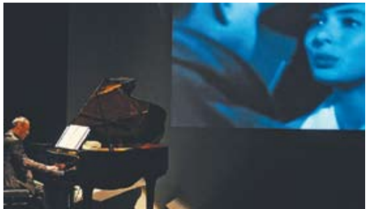
© Fotograma de 'Casablanca' de fons, al concert de Zulueta. || J. G.

Per això, el concert va anar acompanyat d'una pantalla on es podien veure fragments de les pel·lícules escollides que van anar des de les protagonitzades per Chaplin fins a Casablanca passant per clàssics com Cinema Paradiso . "Quan vaig fer aquest projecte, vaig pensar que estava una mica desfasat com a músic fent projectes relacionats amb el cinema antic i de sobte ens trobem amb The Artist , una pel·lícula de cinema mut que està nominada a 10 Oscars. Així que després de saber la notícia em vaig quedar més tranquil", declarava l'artista. || A.G.