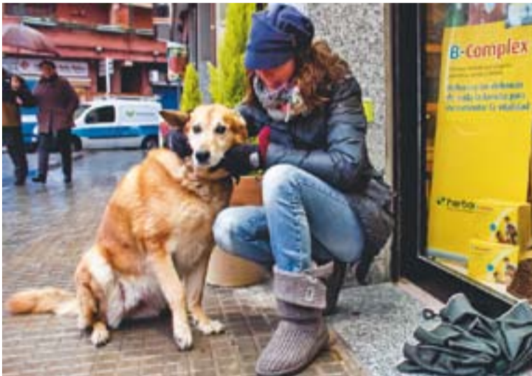
© Del total d'animals censats, 3.130 són gossos || ISMAEL MARTÍNEZ

Durant el 2011, el nombre d'animals domèstics censats a Castellar es va apujar en 311 exemplars, arribant així a un total de 3.339 exemplars segons el registre que manté des de fa 11 anys la Regidoria de Salut. Del total d'animals censats, 3.130 són gossos, 208 són gats i 1 és una fura. El cens d'animals també especifica que un total de 152 gossos són potencialment perillosos. La tinença d'aquests animals està condicionada a l'obtenció prèvia d'una llicència per part del propietari que, a més, ha de disposar de la certificació del Registre Central de Penats i Rebels que especifica que no té cap condemna, ha de tramitar una assegurança i ha d'obtenir el certificat de capacitació.