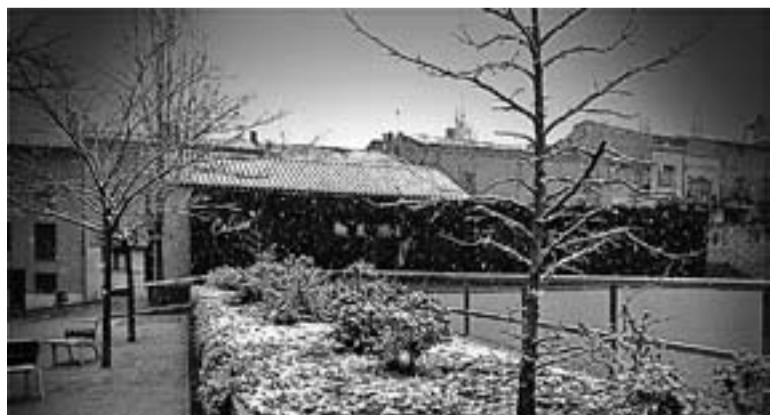
© Imatge en blanc i negre de la plaça Calissó ahir al matí. || C. M.

♦ L'Escola Municipal d'Adults bufarà 25 espelmes el pròxim 23 d'abril. L'ACTUAL recull 10 testimonis d'alumnes del centre