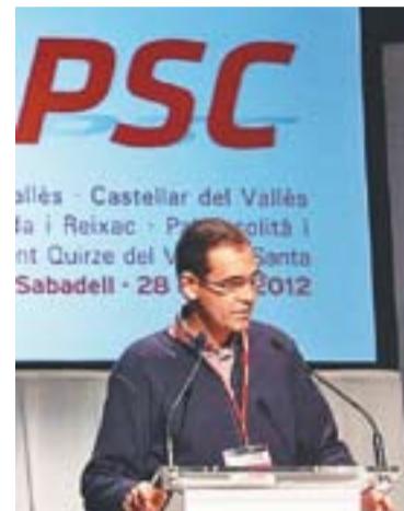
© Intervenció de Giménez al congrés de la Federació Sud. || L'ACTUAL

Segons una nota del PSC local, el Consell Territorial del Vallès Occidental Sud agruparà els alcaldes i portaveus de grups municipals socialistes a l'oposició de la comarca. També formaran part d'aquest consell els representants electes de la demarcació al Parlament de Catalunya i al Congrés dels Diputats, el responsable de Política Municipal i el Primer Secretari de l'Executiva de