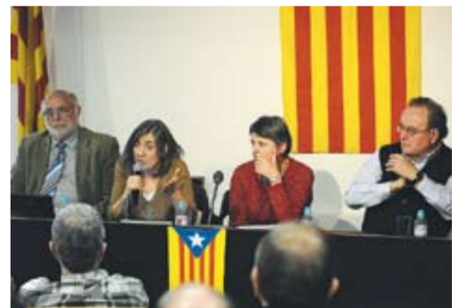
© Miquel Sellarés, primer per la dreta. || ISMAEL MARTÍNEZ

Castellar x la Independència va omplir el 25 de gener la Sala d'Actes d'El Mirador amb una conferència sobre les raons econòmiques, polítiques i socials de Catalunya per ser un estat. Miquel Sellarés, Ricard Garreta i Àngels Folch van ser els encarregats d'explicar per què la nació catalana hauria de disposar del seu propi estat. El polític, filòsof i periodista Miquel Sellarés, un dels fundadors de Convergència Democràtica de Catalunya i de l'Assemblea de Catalunya, argumenta que "sense estat, Catalunya és invisible al món" i que, d'altra banda, "és inacceptable la pressió fiscal a la qual es veuen sotmesos els catalans". "Els americans i els australians paguen un 2,5%, els canadencs un 2%, els alemanys un 4%, i nosaltres paguem un 10%. Som una anomalia i això ha de canviar. Volem ser normals", explica el Sellarés.