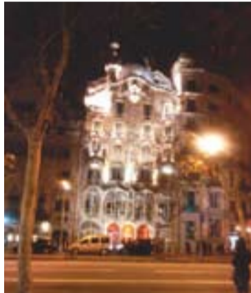
"Tiatru", sopar i passejada Autor: Àngel Pastor