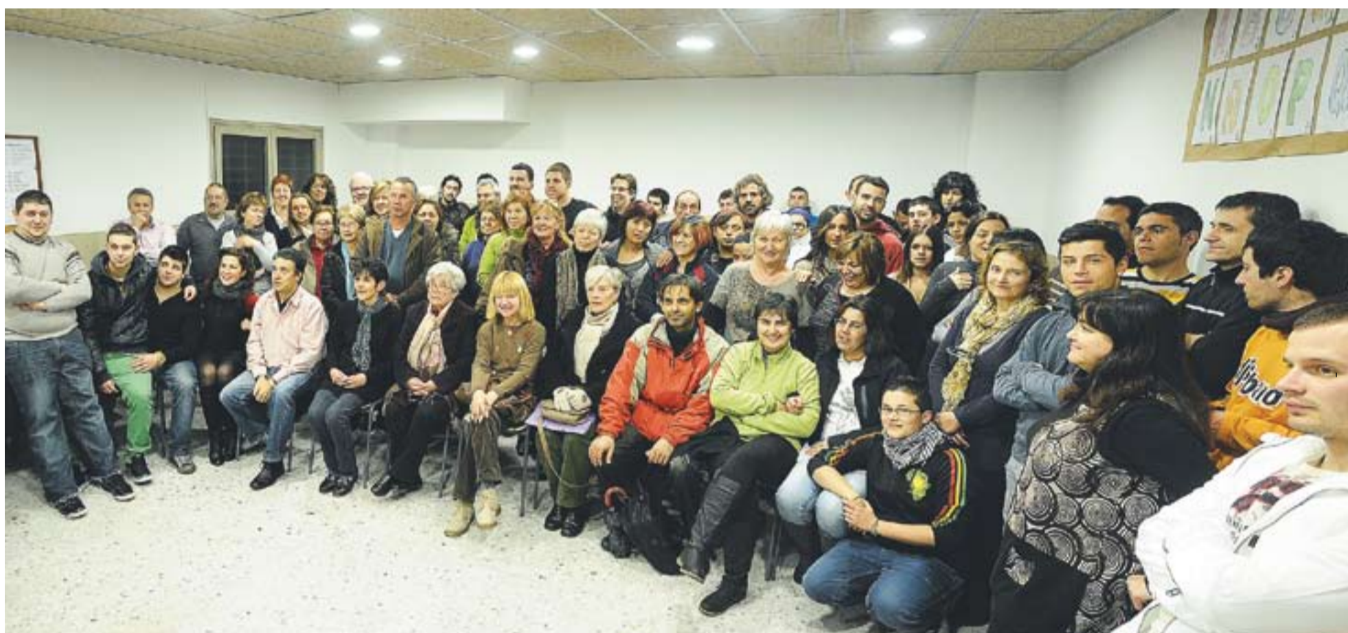
© Alumnes, exalumnes, personal de l'Escola Municipal d'Adults en una foto de família que evidencia l'èxit d'aquest centre després de 25 anys de vida. || JOSEP GRAELLS