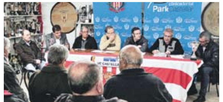
L'assemblea de la Unió Esportiva Castellà divendres passat.

L'última vegada que el Jabac -abans de la fusió- va puntuar contra el Barça va ser el 2002. Al conjunt egarenc hi havia jugadors com Sergio Busquets, Víctor Sánchez o Víctor Vázquez. Al Barça hi havia Gerard Piqué, Leo Messi i Cesc Fàbregas. +