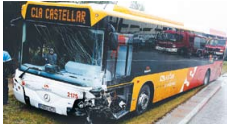
L'autobús accidentat a la carretera B-124.