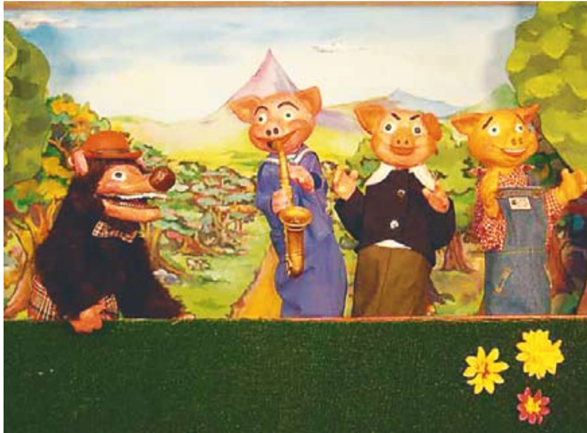
© 'Els tres porquets' de la Companyia Sebastià Vergés. || L'ACTUAL

L'obra Els tres porquets té una durada total de 50 minuts i comp-