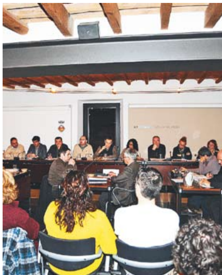
Un moment de la sessió plenària celebrada a Ca l'Alberola de dimarts.