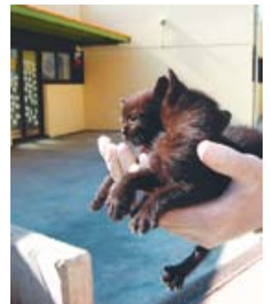
© Una trentena de gats rondan per l'escola || ESCOLA EL SOL I LA LLUNA

valors que treballem i transmetem a la nostra escola però hem de vetllar per la salut dels nostres alumnes". Fins i tot els "reporters" de la classe de 4t de l'escola van fer una notícia on escrivien: "Des del primer trimestre els gats van entrar a l'escola El Sol i La Lluna. Un gat va entrar al pati interior, després va entrar a dins de l'escola i va deixar un "regalet" no gaire agradable i feia molta pudor. Un cop portava 2 dies, l'Amalia se'l va emportar al pati interior. I ara cada 2 per 3 trepitgem una caca i ja estem cansats d'això".