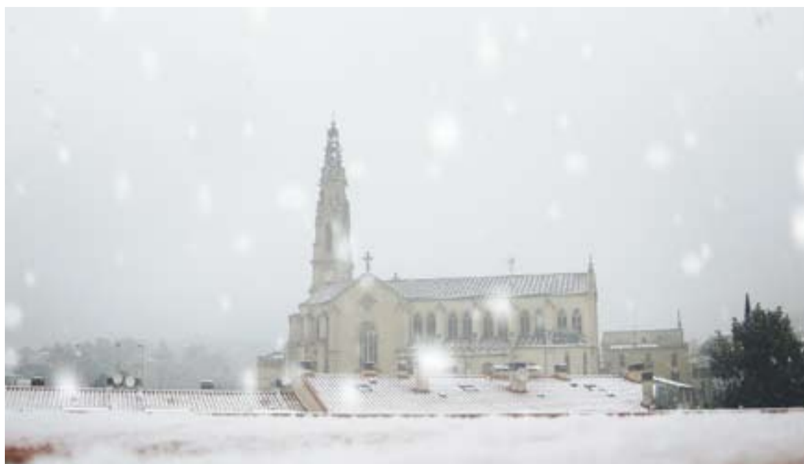
⊙ Una imatge de l'església de Sant Esteve amb els flocs caient i un quadre de temperatures per als propers dies. || GEO

Segons el Servei Meteorològic de Catalunya, el cel estarà molt ennuvolat, amb nuvolositat menys compacta a ponent. S'esperen pre-