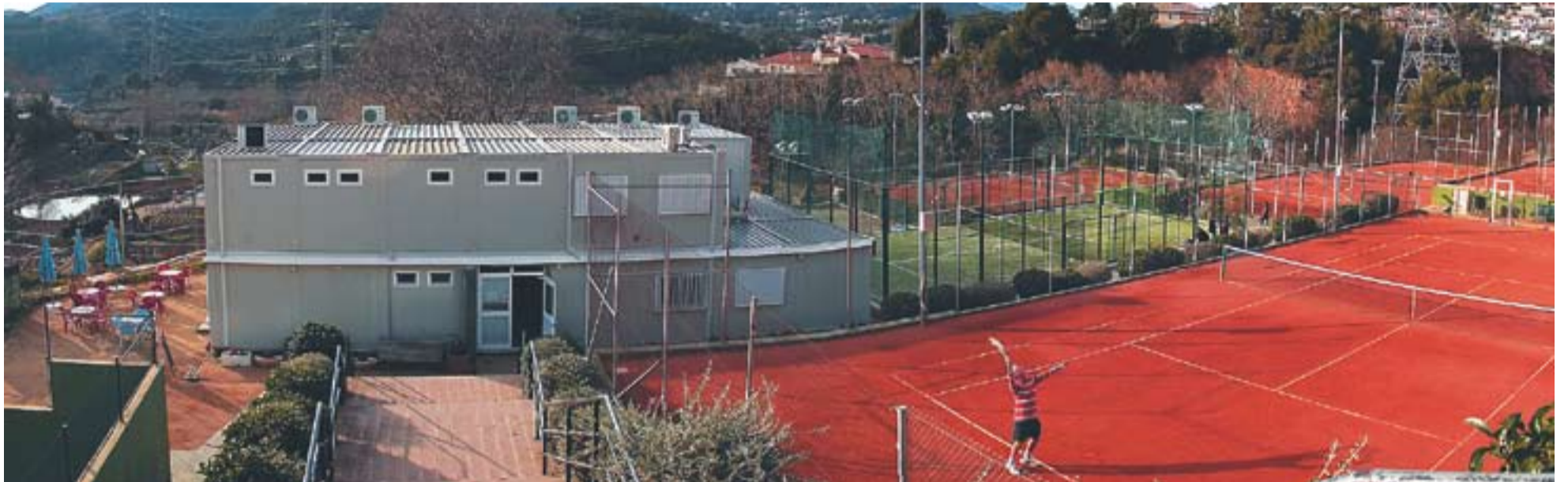
L'aspecte de les pistes de tennis del carrer Sant Feliu ha canviat en el darrer any amb la instal·lació d'un edifici i una nova pista de pàdel.

al descans de 26 punts però es va relaxar en els darrers dos períodes i el partit va acabar amb empat a 75 al final dels 40 minuts reglamentaris. El Castellar suma la seva setena victòria de la temporada a Copa Catalunya.