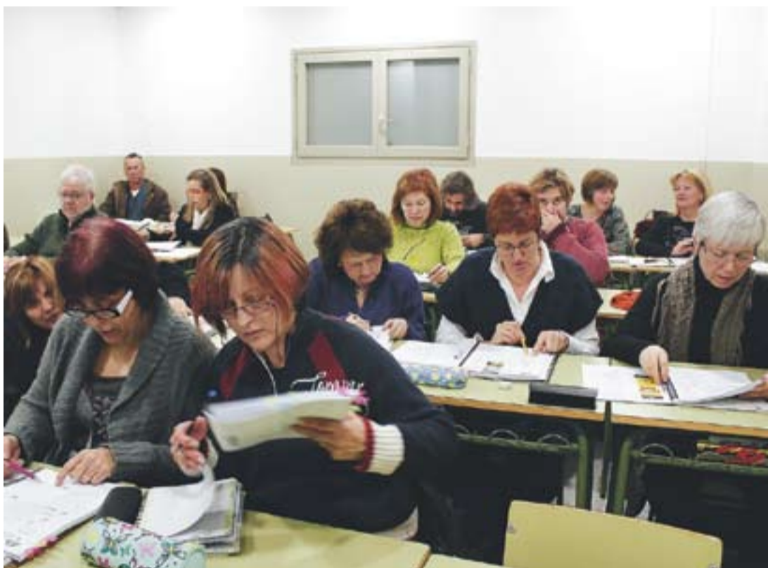
Alumnes de l'Escola d'Adults treballen en una aula, dimecres passat.

El centre celebrarà el seu primer quart de segle el 23 d'abril coincidint amb la diada de Sant Jordi i la celebració dels Jocs Florals a l'auditori Miquel Pont. En 25 anys han passat 3.900 alumnes.