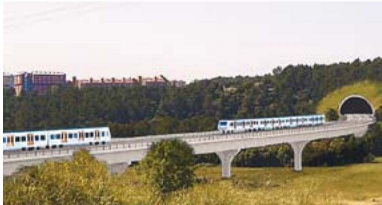
ⓐ Imatge virtual del tren travessant el riu Ripoll direcció Castellar