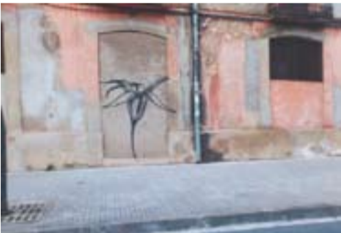
Una flor del conegut grafiter Werens Autor: J.G.

Envia'ns fotos fetes amb el mòbil: lactual@castellarvalles.cat