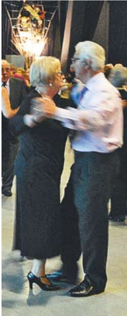
© Manel Da Silva en el darrer ball organitzat per l'entitat. || JOSEP GRAELLS

Els balls tenen lloc cada diumenge a les 18 hores a la Sala Blava i s'hi pot practicar tot tipus de modalitat de balls de saló, des dels tangos, boleros, txa-txa-txa, rumbes, pasdobles, etc. A ballar hi ha més gent de fora que de Castellar. "Véuen de Caldes, Sentmenat, Sabadell, Mollet, Terrassa, etc".