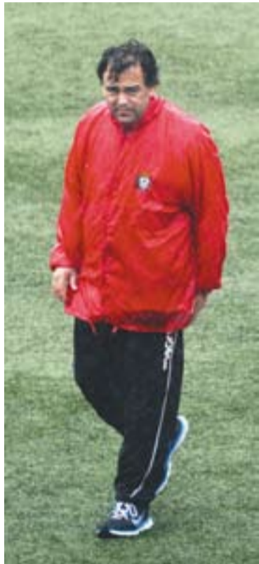
© El tècnic Quico Díaz. || J. G.

La de diumenge era la cinquena derrota de la temporada de la UE Castellar fora de casa al camp del Puig-reig. Els castellarencs van caure per un solitari gol (1-0), marcat al temps de descompte de la primera part. La Unió va desaprovechar un penal que hauria pogut trencar l'empat, però Juanito va fallar l'oportunitat cap a meitats de la primera part. Més sort va tenir el Puig-reig, que va aprofitar, al minut 46, una de les poques arri-