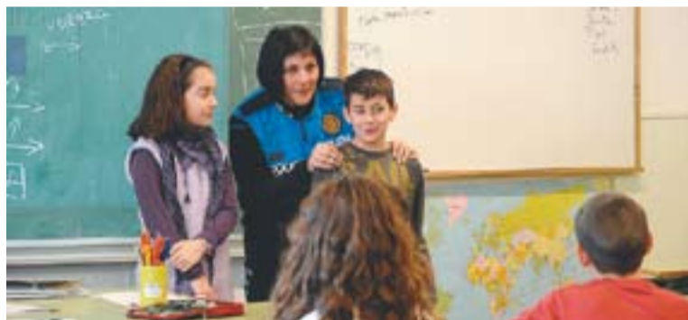
Una policia a la classe d'educació viària a l'escola Sant Esteve.