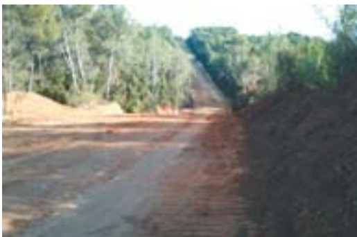
El pas del gasoducte pels boscos

Envia'ns fotos de Castellar fetes amb el mòbil: lactual@castellarvalles.cat