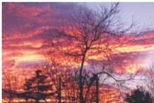
Sol rogent a la plaça de l'Espai Tolrà Autor: Tomàs i Carles Sanjuán