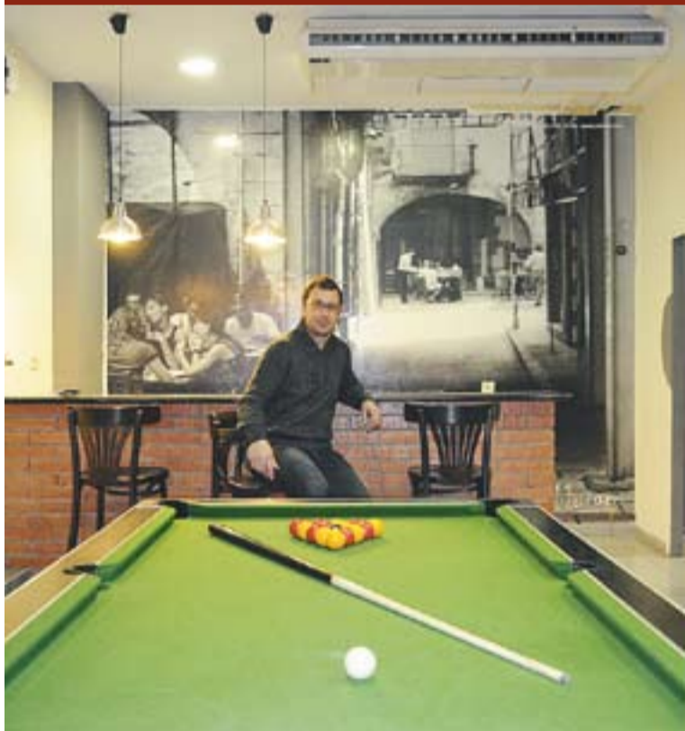
© La franquícia Al Teu Aire acaba d'obrir portes a l'Avinguda Sant Esteve. || J.G.