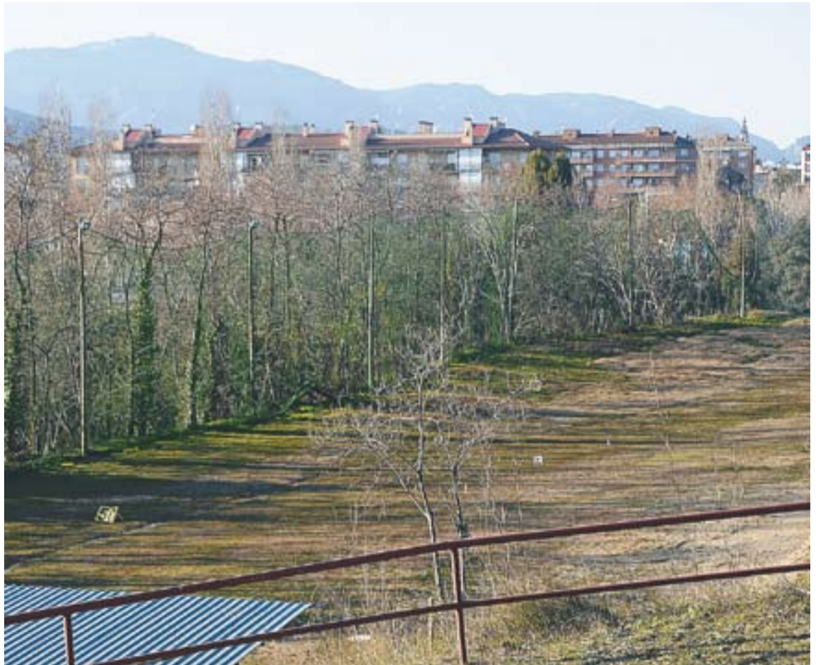
Una part de les instal·lacions esportives que fins ara utilitzava el Golf Castellar.

El problema, segons Bullón, és que és molt difícil aconseguir que qualsevol entitat esportiva pugui finançar-se ella mateixa i, més si no tenen un espai propi on desenvolupar la seva activitat. Bullón té clar que "el golf és un esport que no està considerat com la resta i no podem autofinanciar-nos, cosa que si d'altres entitats esportives haguessin de fer tampoc podrien subsistir" . També ha explicat que aconseguir sostenir-se econòmicament només com a es-