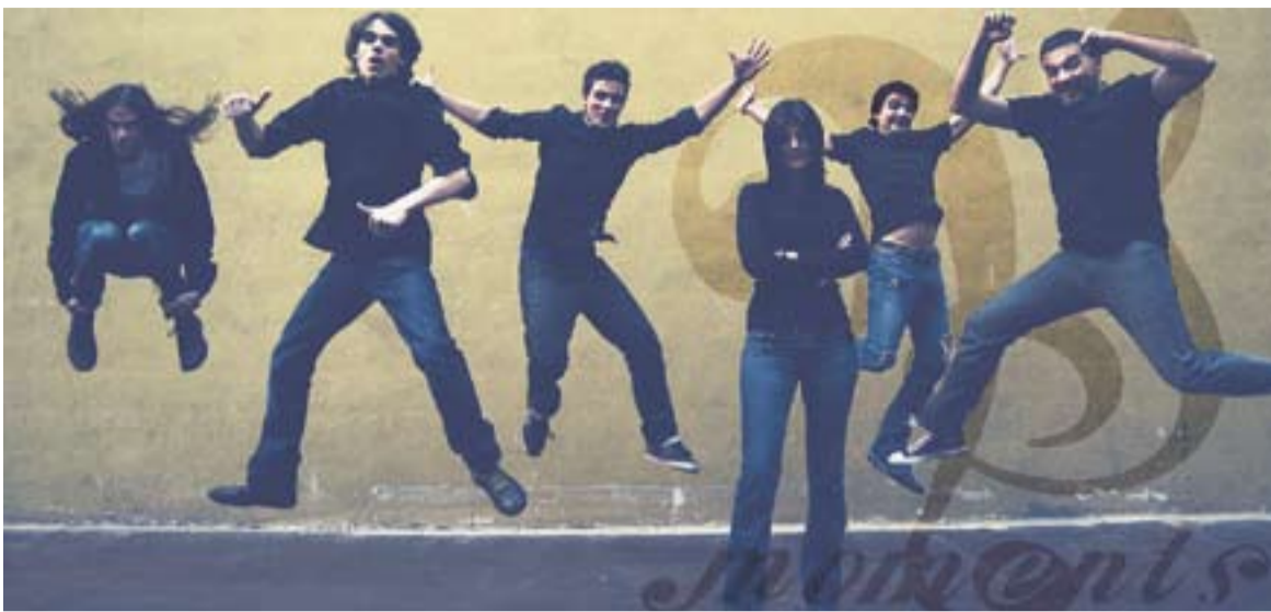
© Els sis components de Moments en una de les imatges que s'inclouen al llibret del seu primer disc. || L'ACTUAL