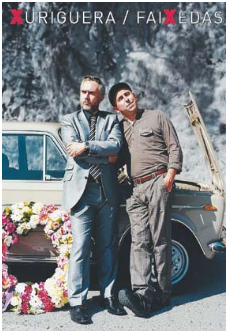
Carles Xuriguera i Fel Faixedas protagonistes 'No som res'

SINOPSI || El muntatge teatral explica la història de dos cosins que van a l'enterrament del seu avi en cotxe, però com que tenen pena,