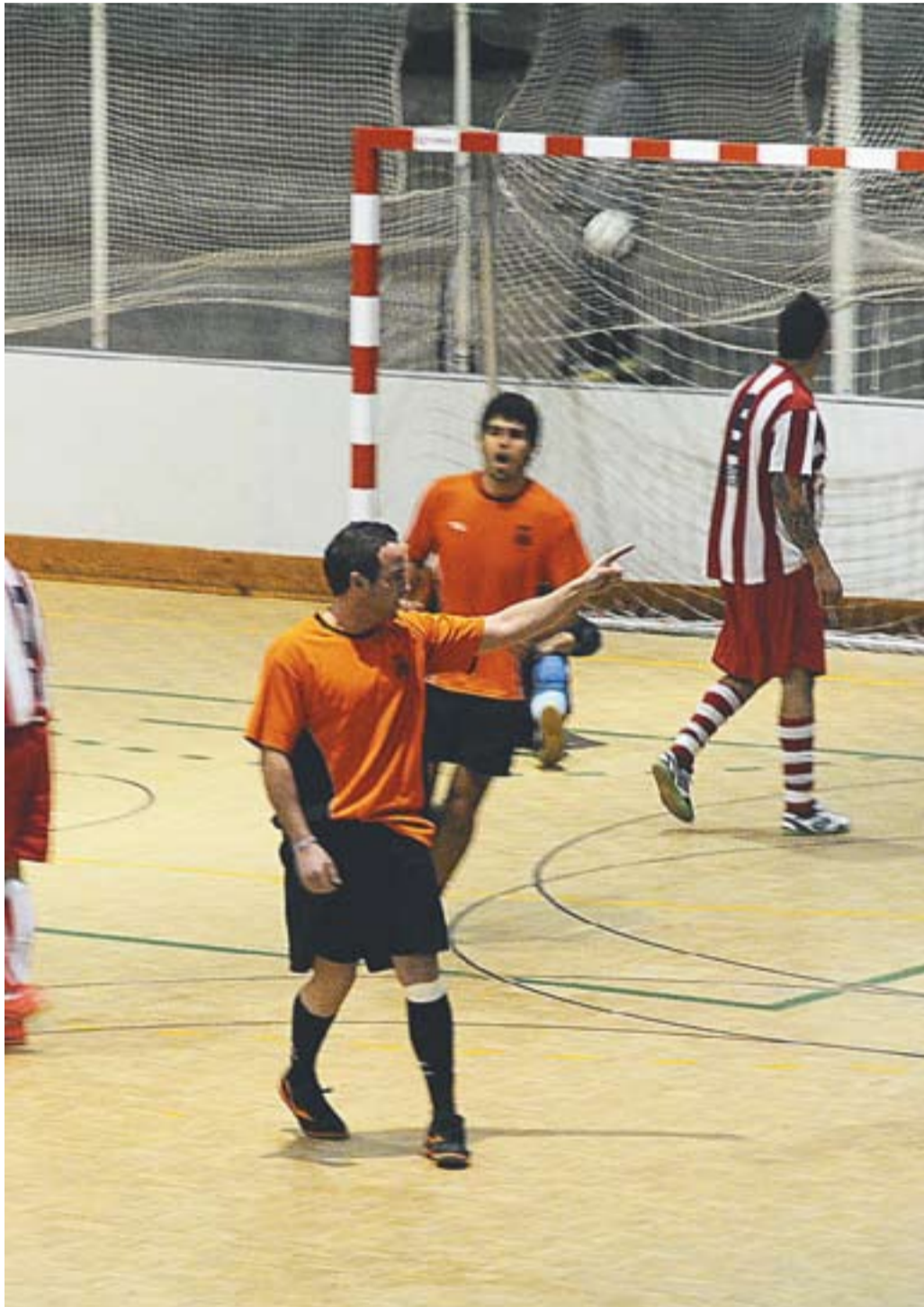
© El gran partit del Castellar no va ser suficient per aconseguir la victòria. || JOSEP GRAELLS

tagh-Ata, una muntanya de 7.546 metres situada en territori xinès. Deu, soci del Centre Excursionista de Castellar, va fer aquesta aventura amb tres expedicionaris catalans més. El mateix dia es va projectar un documental.