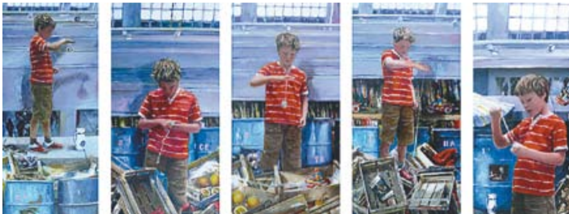
© 'Etcéteras', políptic de pintura acrílica sobre lona impresa. || ALFONS FREIRE

L'exposició inclou una vintena de quadres i es podrà visitar fins al dia 15 de març, en horari d'obertura de la botiga d'art ceràmic Sargadelos. +