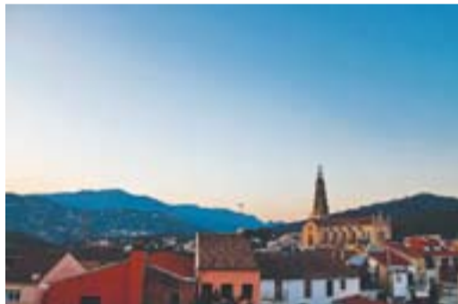
Castellar a la posta de sol Autor: Ismael Martínez