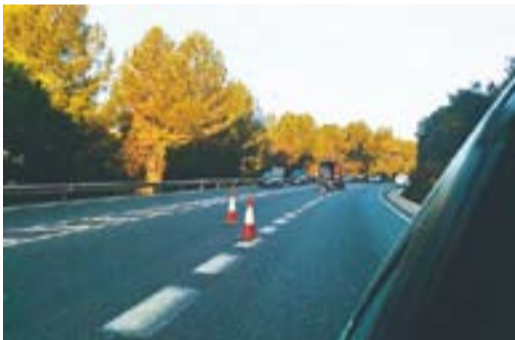
Repintant la carretera Autor: J. G.

Envia'ns fotos de Castellar fetes amb el mòbil: lactual@castellarvalles.cat