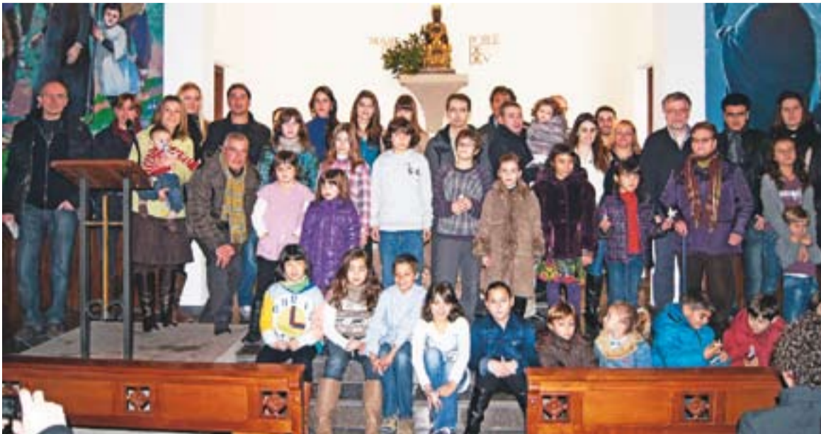
© Els diferents premiats diumenge passat a la Capella de Montserrat. || CEDIDA