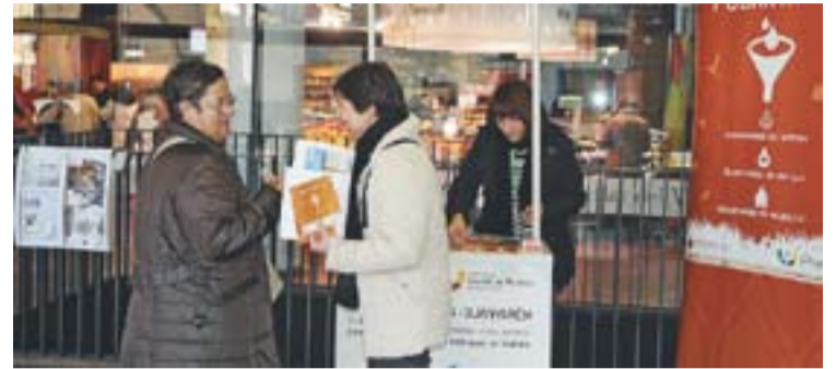
⊙ A més d'informació, al punt donen un sabó fet amb oli reciclat. || J. G.

Dos nous tallers de sabó amb oli domèstic