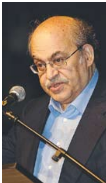
Andreu Mas-Colell, conseller d'Economia, va visitar Castellar en campanya.