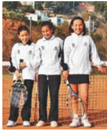
© Tots els components que integren els equips aleví masculí i femení del Club Tennis Castellar. || L'ACTUAL