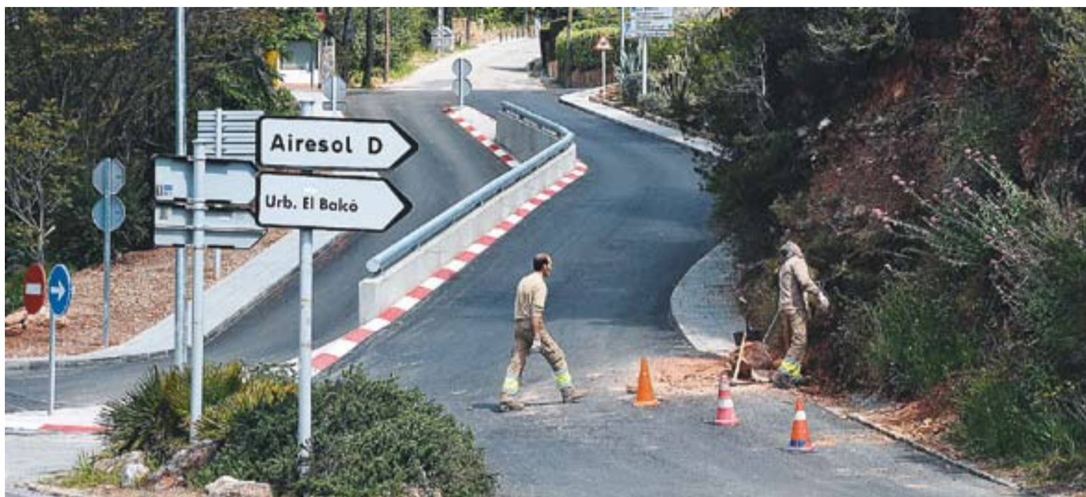
© Empleats de la Brigada Municipal treballant en una esllavissada de terreny a l'entrada de la urbanització Airesol D. || JOSEP GRAELLS