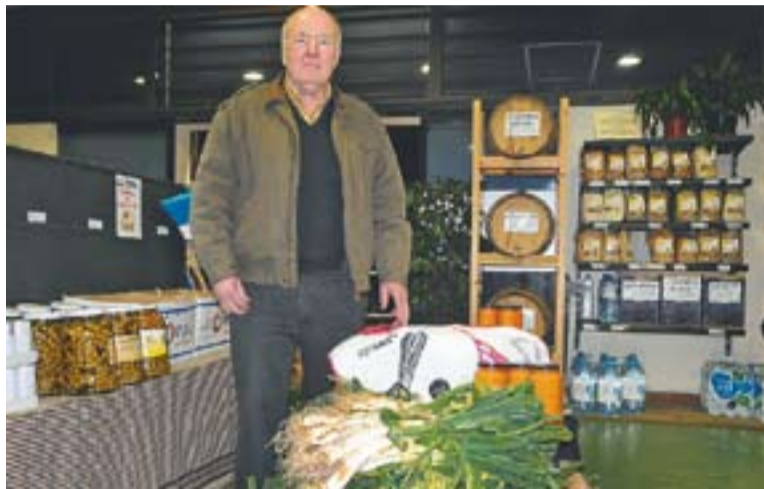
⊙ Calçots d'Agrosans. || JOSEP GRAELLS

Una de les agrotigues que n'ofereix és Agrosans, situada a la carretera B-124. "Hi ha llocs