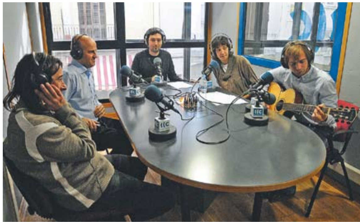
La Rubia del Fa va actuar en directe al magazín 'Dotze' de Ràdio Castellar.