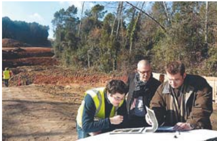
⊙ La comissió de seguiment a les obres en la visita feta dimarts passat.