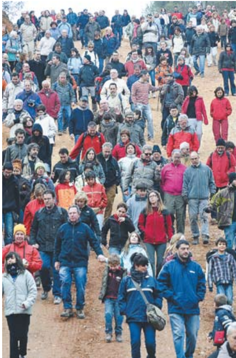
⊙ Els assistents a la visita caminen per una de les zones afectades per les obres. || J. G.

AVALUAR L'ESTAT || Per la seva banda, la comissió de seguiment de les obres de construcció del gasoducte Martorell-Figueres va reunir-se dimarts 17 per avaluar l'estat dels treballs d'aquesta infraestructura energètica al seu pas per Castellar. Els integrants d'aquesta comissió, formada pel regidor de l'Àrea de Territo-