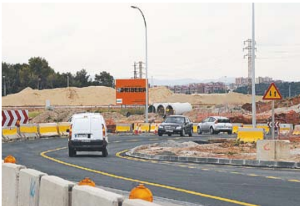
Aquesta setmana els vehicles ja podien circular per una part de la nova rotonda de la B-124

A més d'aquests, un aspecte a destacar és que continua endavant el procés del desdoblament de la B-124. Els 804.000 euros es destinen a l'execució de la rotonda, unes obres que ja estan bastant avançades. Canalís va assegurar que encara que ja s'ho esperaven, “és una tranquil·litat que aparegui el desdoblament dins les inversions”.