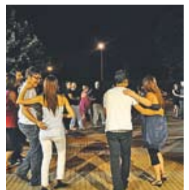
AAVV Can Carner

+ INFO: Cafè del Sol (plaça Europa) vilabarrakes@gmail.com www.facebook.com/vilabarrakes