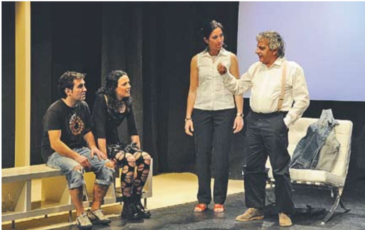
Moment de l'obra 'Fuita', de Jordi Galceran, interpretada per la companyia Entre Cametes.