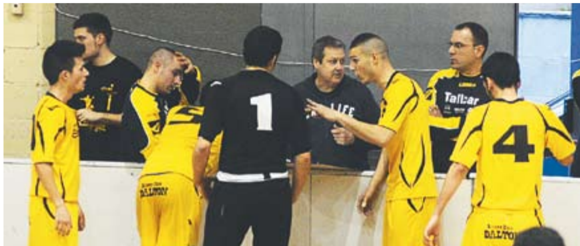
© Els números demostren que l'Athlètic 04 Castellar ha millorat en defensa aquesta temporada. || JOSEP GRAELLS

L'equip de Ferran Marta tanca la temporada a la quarta posició amb 81 gols encaixats i es converteix en l'equip que ha rebut menys gols del seu grup