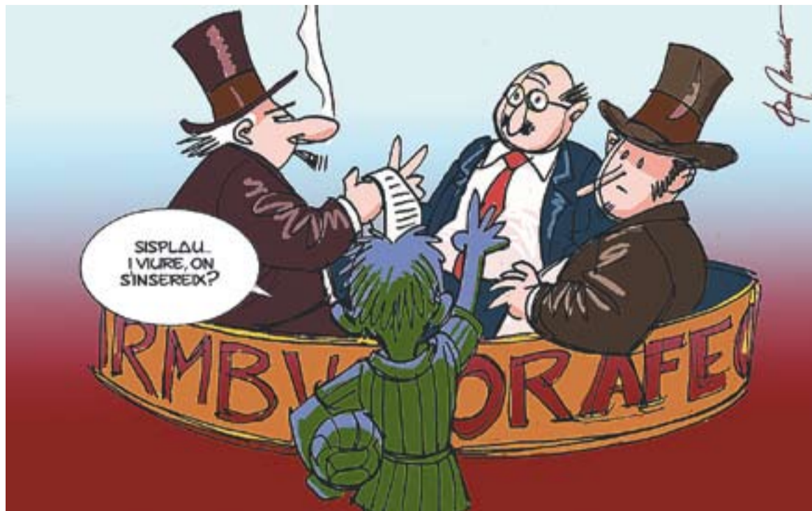
© Reunió sobre les corones de la RMB. || JOAN MUNDET

Rebem com una (relativament) bona notícia el fet que l'augment de l'atur a Castellar, que ha estat d'un 113% entre 2007 i 2011, amb 1.862 aturats l'abril del 2011, hagi estat 11 punts percentuals inferior respecte el promig comarcal, donades les característiques del nostre mercat de treball, amb una alta mobilitat de treballadors cap a