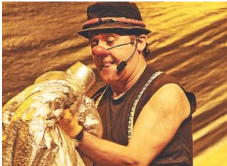
Marcel Gros en la seva representació a Castellar.

El públic menut, entregat totalment a l'atenció pel pallaso, gaudeix de les més senzilles claus humorístiques presentades per Gros amb l'única ajuda del seu enginy i alguns objectes, poc més que jogui-