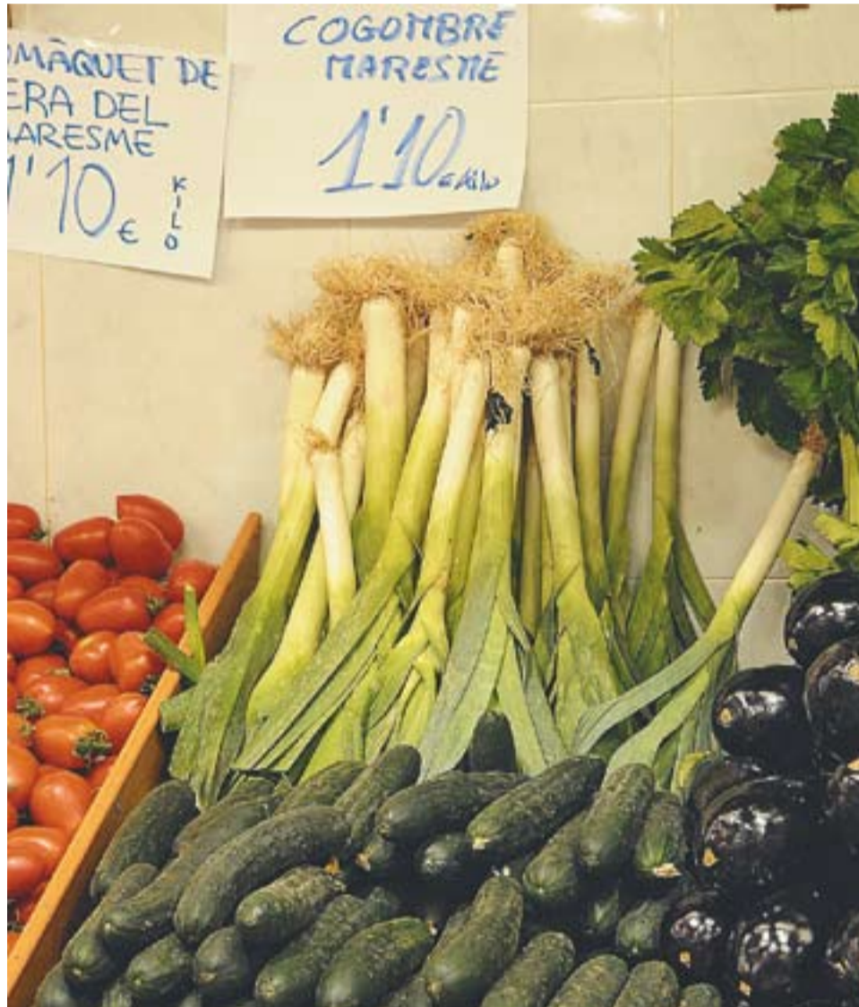
Punt de venda de cogombres a Castellà del Vallès.