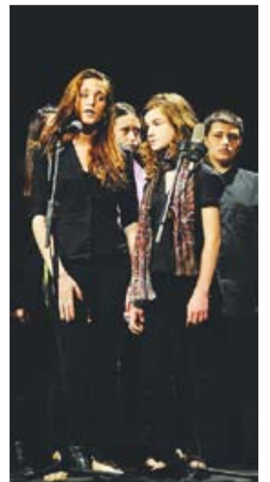
© Fi de curs 2010 del Cor St Esteve.

PUNT I FINAL AMB TEATRE || L'Arc de Sant Martí presentarà una obra de teatre a la Sala de Petit Format de l'Ateneu a partir de les 16 hores, aquest proper dimarts. La representació servirà per cloure el curs 2010-2011.