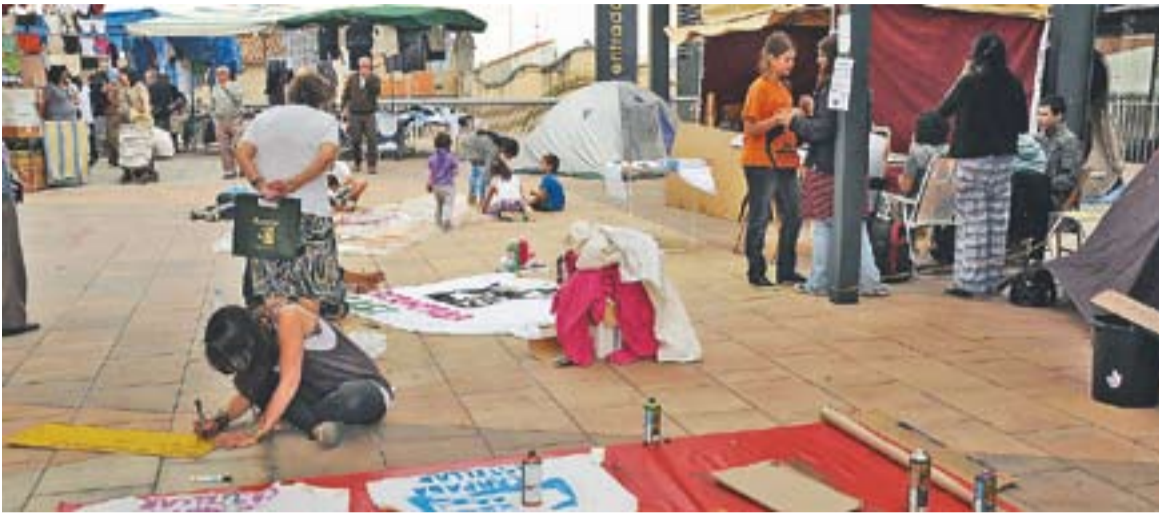
Campament base dels indignats de Castellar a la plaça d'El Mirador