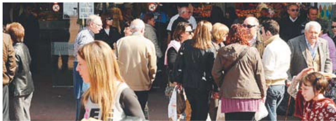
Diversos visitants de la Fira de Sant Josep davant del Mercat municipal.

pers anys és que “el nostre municipi es mantindrà per sobre de la mitjana catalana” , assegura el regidor d'Hisenda.