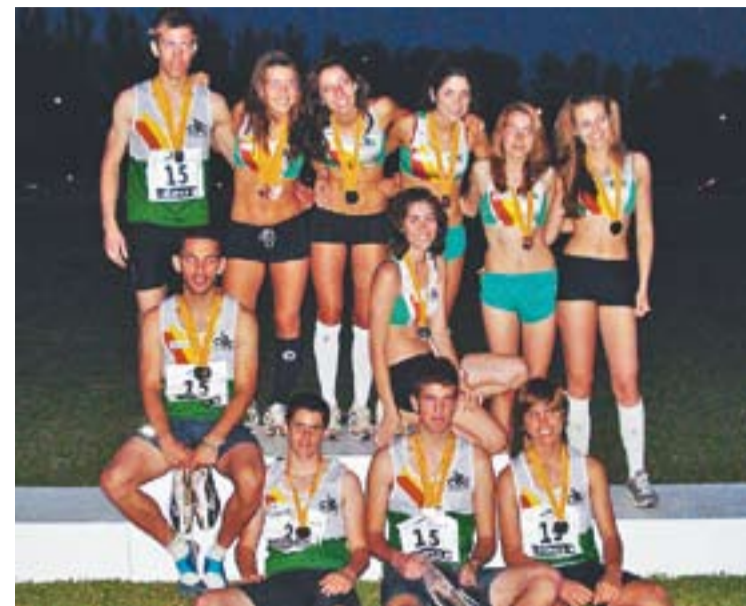
© Els juvenils del CAC en acabar els campionats d'Amposta. || CEDIDA

sert va ser el tres vegades campió de la Vuelta a España Roberto Heras amb un temps de 21 hores i 40 segons. A la cursa també hi participaven exciclistes professionals com Óscar Pereiro o Manolo Beltran.