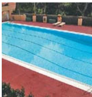
Casino del Racó