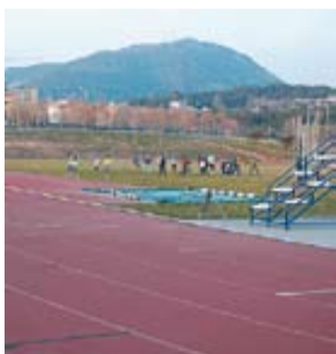
Club Atlètic Castellar