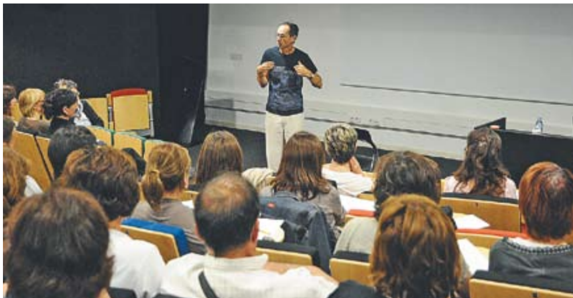
© El pedagog Ramon Casals, durant la conferència sobre com prevenir el fracàs escolar de l'Escola de Pares i Mares || J.G.

CLOENDA A LES TRES MORERES || Unes 80 persones van assistir el passat dissabte, dia 4 de juny, a la festa de