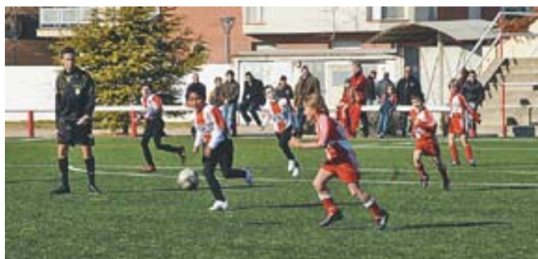
Un partit de la base de la Unió Esportiva Castellar.

Equips centenaris se citen el cap de setmana al Pepín Valls en un torneig especial del futbol base