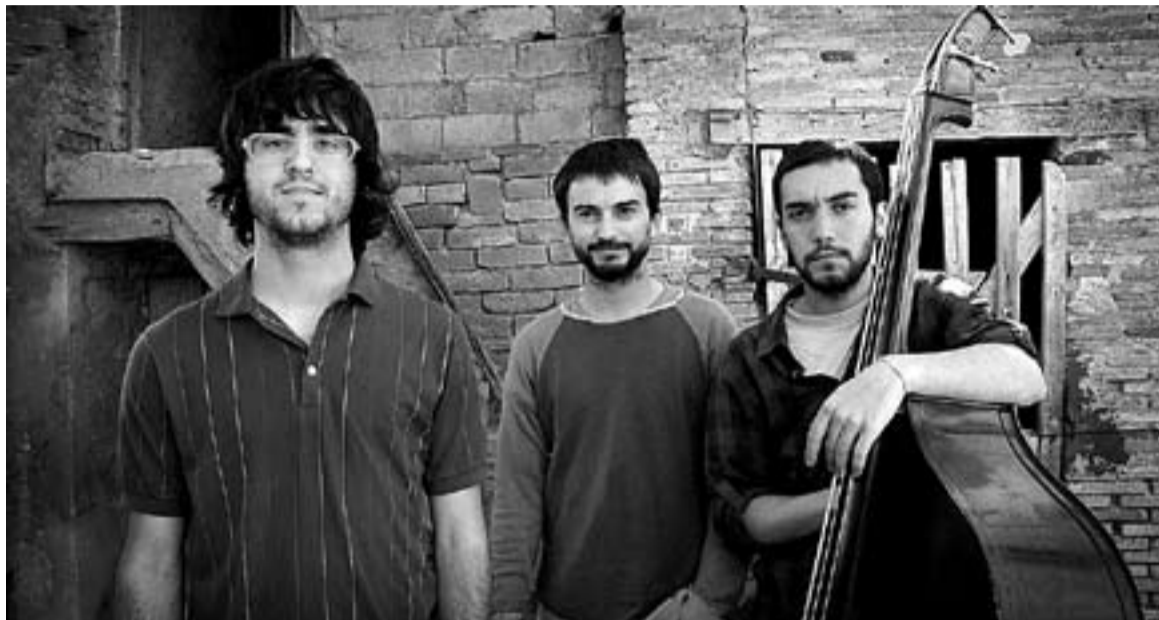
La iaia és el grup que obre el 2 de juliol els concerts als Jardins del Palau Tolrà de les Nits d'Estiu.