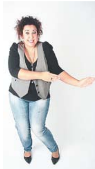
© Eva Cabezas, monologuista. || CEDIDA

Cabezas s'expressa amb un humor clar, directe i àcid, diu les coses pel seu nom i ens porta de passeig per una realitat que critica amb bon humor. +