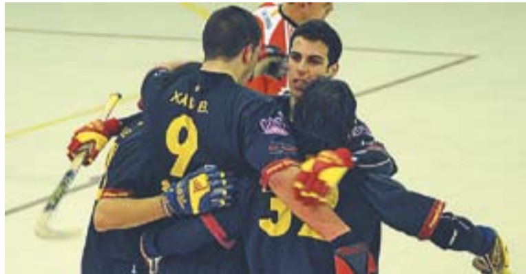
Els jugadors sènior del Castellar celebren un gol a casa.

El sènior del Castellar, quart a la primera volta, ha sumat només tres victòries a la segona part del campionat després de catorze partits. Els castellarencs han perdut nou partits i n'han empatat dos. A partir d'ara, amb la temporada ja finalitzada, començaran a planificar la propera temporada 2011-2012.