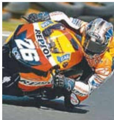
Club de Fans Dani Pedrosa

+ INFO: Tels. 662 467 247 (Toni) 937 144 435 (Regidoria de Cultura)