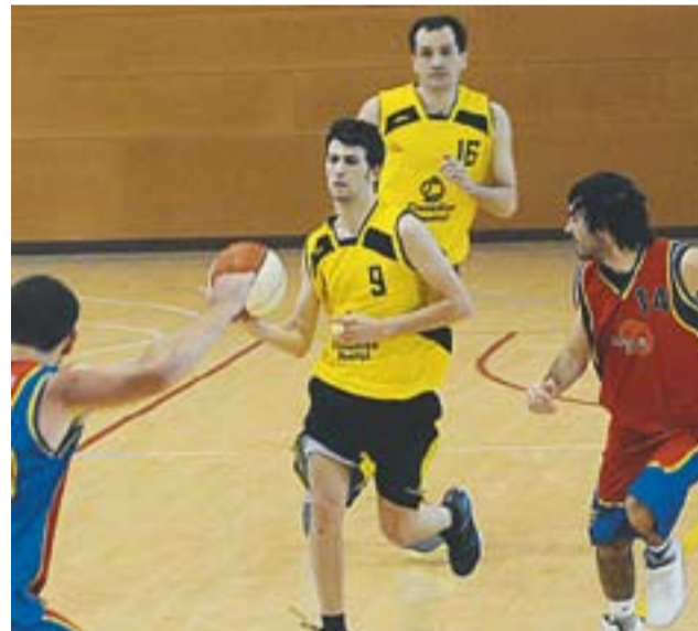
Figueres - CB Castellar 55 - 59 7 de maig de 2011 Permanència a Copa Catalunya