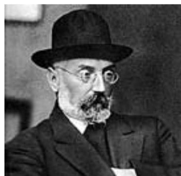
© Miguel de Unamuno.