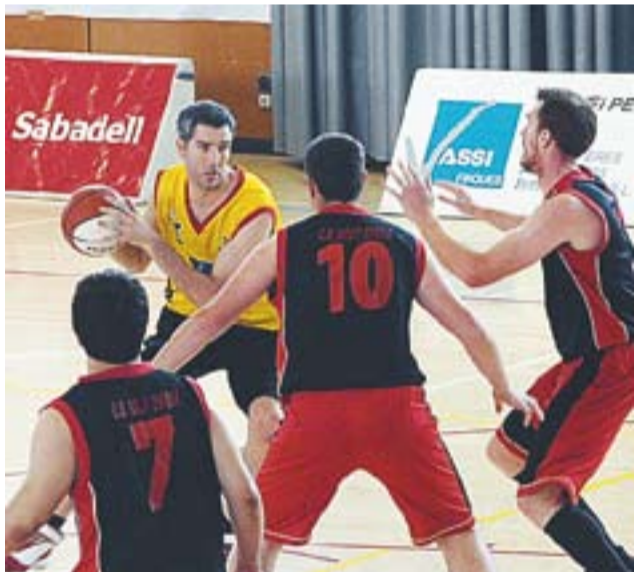
Grup Barna - CB Castellar 76 - 73 30 de maig de 2009 Descens a Primera Catalana