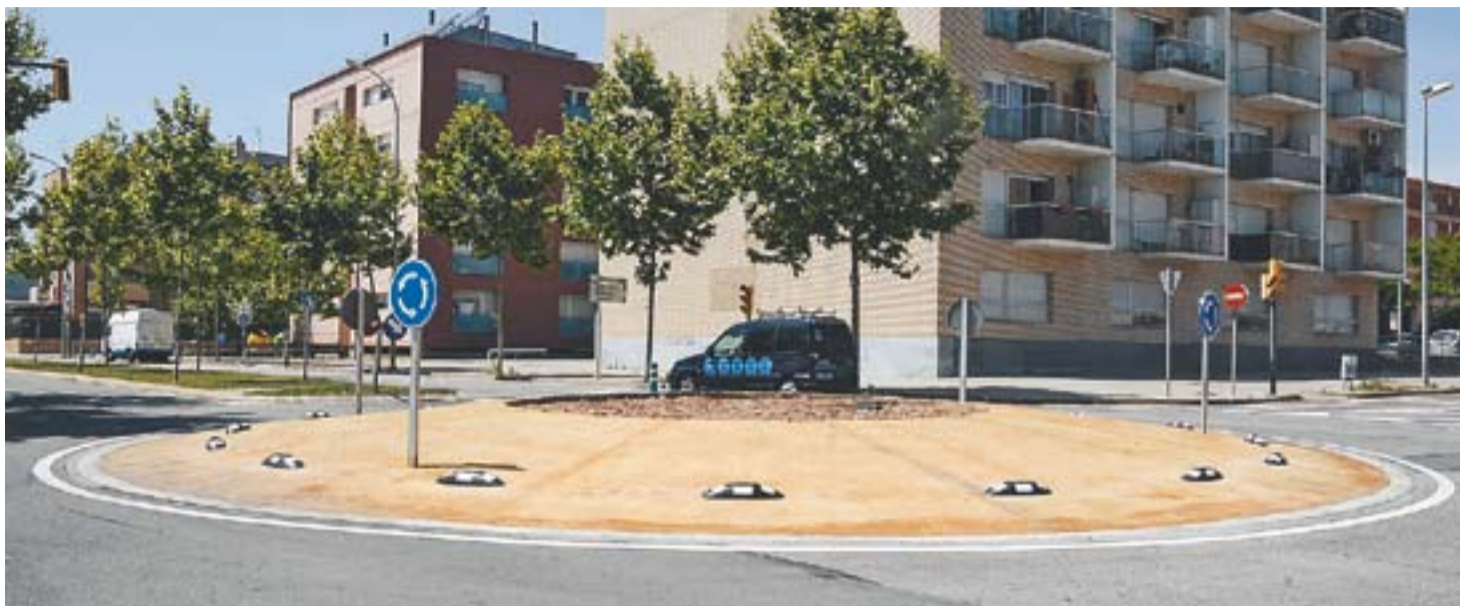
La rotonda ubicada als carrers Barcelona-Solsonès facilita l'accés als carrers del polígon industrial del Pla de la Bruguera