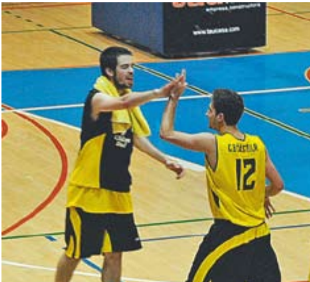
Prat - CB Castellar 64 - 84 8 de maig de 2010 Ascens a Copa Catalunya