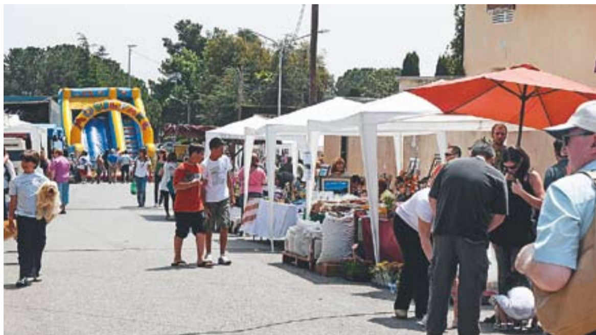
© Instant del Mercat de Primavera d'una edició anterior. || JOSEP GRAELLS