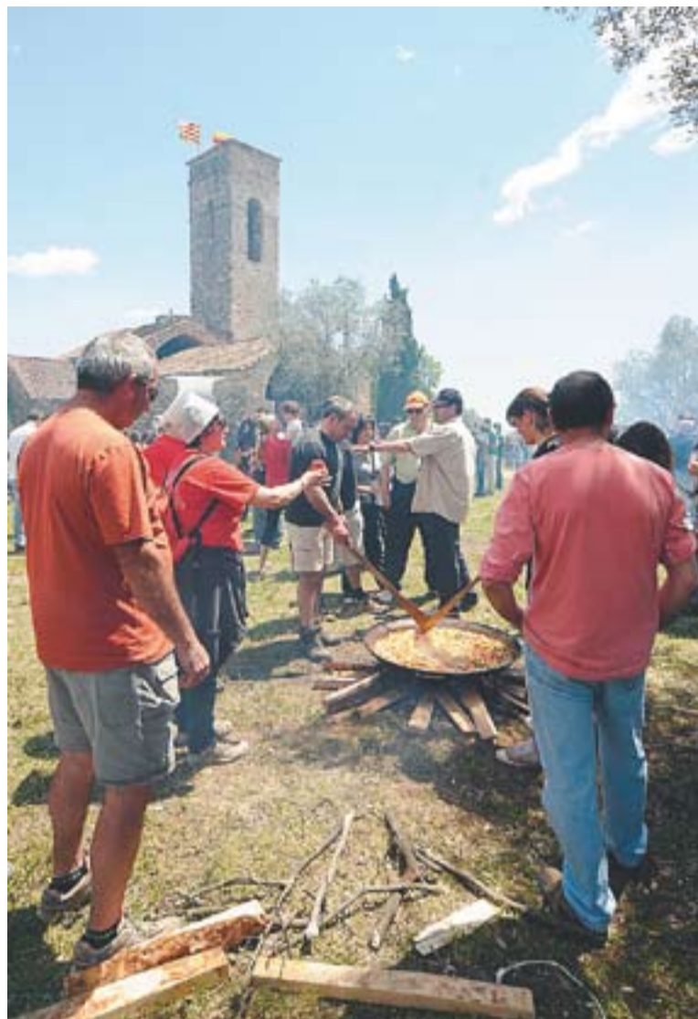
Preparació dels arrossos a l'Aplec de Castellar de l'any 2010.

En cas que s'opti per venir amb cotxe, s'haurà de deixar a l'aparcament situat als afores. ✦