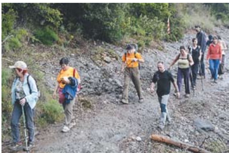
© Participants de la 24a edició de la Caminada Popular || J. GRAELLS

Les obres -que han anat a càrrec de l'empresa Pasquina SA i han tingut un cost de 120.000 euros- han afectat poc al trànsit i s'han executat ràpid. “L'obra ja està acabada ara falta la part d'ornamentació. Posarem properament dins de les rotondes vegetació autòctona perquè no s'hagi de regar en excés” . +