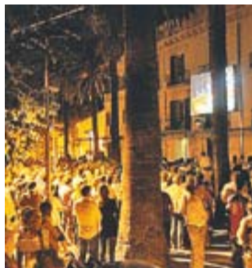
Festa Major 2011