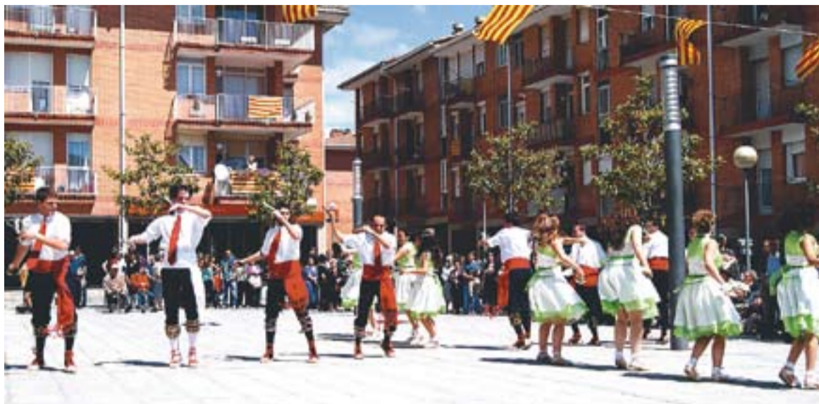
Una de les darreres actuacions del Ball de Gitanes.

La propera activitat de les Gitanes serà diumenge amb l'Aplec de Castellar Vell. Hi participaran les colles de Petits i Infantils. ✦