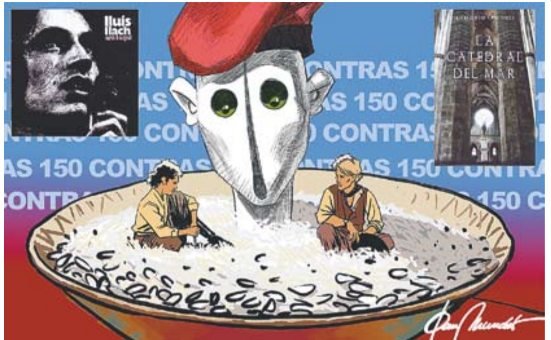
© Arròs contra. || JOAN MUNDET

Diuen que la persona que s'identifica amb un gos li agrada compartir amb els seus éssers estimats. Té una ànima tolerant i comprensiva i uns gustos sòlids. El gos és l'animal amb què s'identifica la majoria dels castellarencs que han passat per L'entrevista de L'Actual, que avui arriba a l'edició 150. Repassem què han contestat els 150 personatges a la secció de les '11 respostes' sobre els seus menjars, llibres, músiques i pel·lícules preferides. També sobre paraules i colors fetitxes.