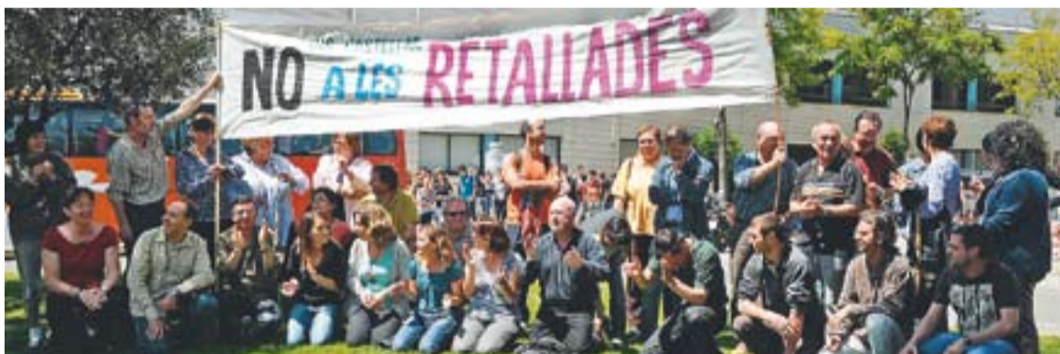
© Els mestres manifestant-se a la rotonda que hi ha davant de l'Institut Castellar. || JOSEP GRAELLS

Una altra de les màximes de la cuinera és que "renyar als nostres fills no farà que mengin bledes, és més, acabant odiant-les" . La solució és segons Parellada, "redissenyar amb imaginació i senzillesa els plats més odiats" . "Qui pot dir que no a uns bunyols de cigrons? No passa el mateix amb els cigrons bullits" , comentala cuinera. "Hem d'aconseguir que els nens tinguin la voluntat de tenir una dieta sana" , conclou Parellada. †