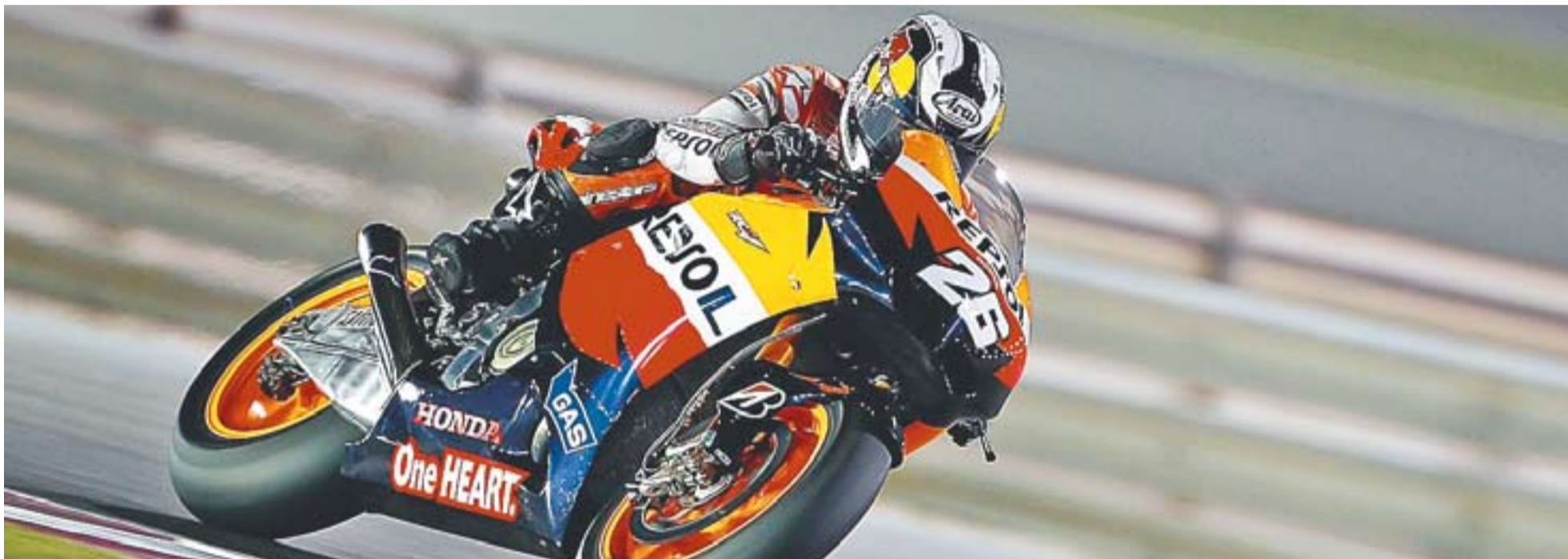
© El pilot castellarenc Dani Pedrosa està preparat per començar el Mundial de Motociclisme després d'oferir un bon rendiment en els testos de Qatar. || MOTOGP

va guanyar el primer set per 4/6 al jove castellarenc, però Núñez va adjudicar-se el segon set per 6/3. El definitiu set va donar la copa de campió a Torra, que es va imposar per 6/1 al tennista del Club Tennis Castellar.