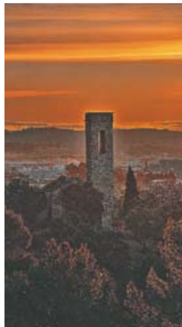
© 'Majestuós', segon premi JAUME CALSINA

Els premis han estat de 150, 120 i 90 euros. Aquest va ser l'acte amb què es va inaugurar la 15a Setmana Verda a Castellar. +