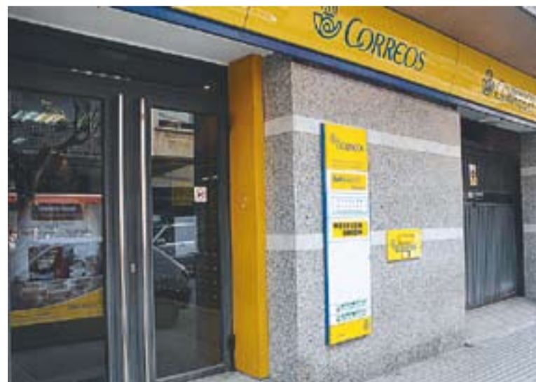
L'oficina de Correus de Castellar, al carrer Sala Boadella.

POSSIBLES MOBILITZACIONS || La Direcció Territorial de Catalunya ha confirmat que la decisió si s'ha d'incorporar un nou carter es prendrà al juny una vegada s'apliqui l'estudi de dimensionament de les 13 sec-