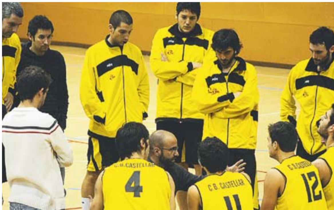
Els jugadors estan molt mentalitzats de la importància d'aquest enfrontament a la pista del Vic.

Partit clau aquest dissabte (16 h) entre dos equips que lluiten per allunyar-se de la zona de promoció de permanència a Copa Catalunya