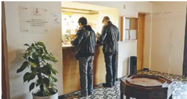
© Dos ciutadans a la recepció del Jutjat de Pau de Castellar del Vallès || J.G.