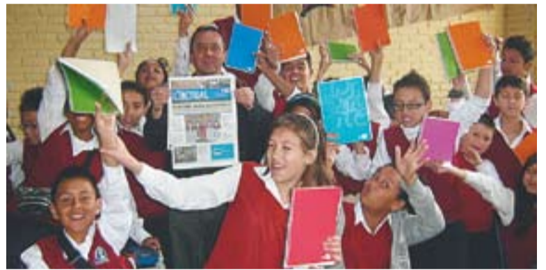
Els alumnes de l'escola El Libertador amb el nou material escolar

Els alumnes d'El Libertador han enviat als infants castellarencs cartes d'agraïment. "Les primeres cartes dels nens colombians ja han arribat al Mestre Pla i les començarem a repartir durant aquesta setmana", afegeix Colmenares. +