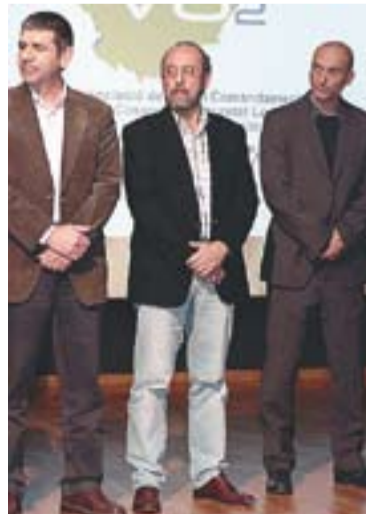
© Joan Alonso, al mig, a la presentació de VO2 a Sabadell || J. PELÁEZ

L'objectiu de l'associació és unificar criteris operatius i de coordinació entre els cossos de seguretat local a més de perfilar el paper que han de tenir els futurs cossos locals de seguretat. +