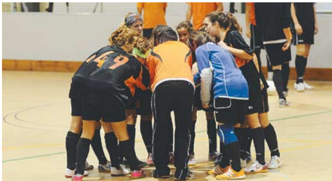
© Les fèmines a l'acabament d'un partit d'aquesta temporada | JOSEP GRAELLS