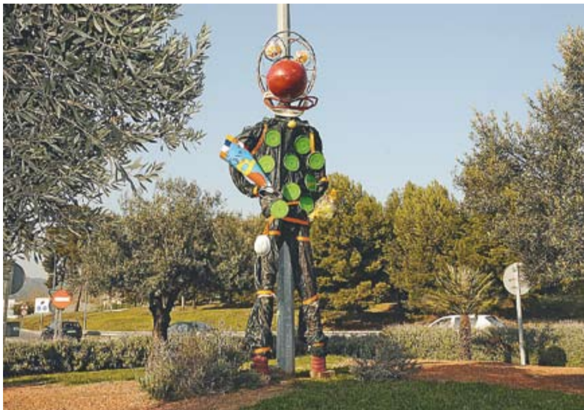
Una de les escultures fetes amb materials reciclats, ubicada a la rotonda del Pla de la Bruguera.

Per aconseguir els materials que les conformen, l'artista es va posar en contacte amb els treballadors de la regidoria de Cultura