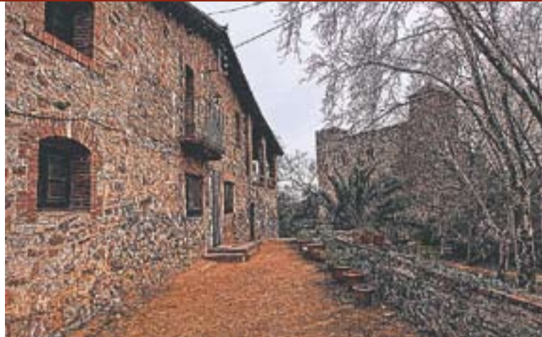
© 'Topaz', primer premi || DAVID GUITAR

El Castell de Clasquerí, Castellar Vell i Can Pèlacs, protagonistes de les imatges guanyadores del concurs fotogràfic de la Setmana Verda