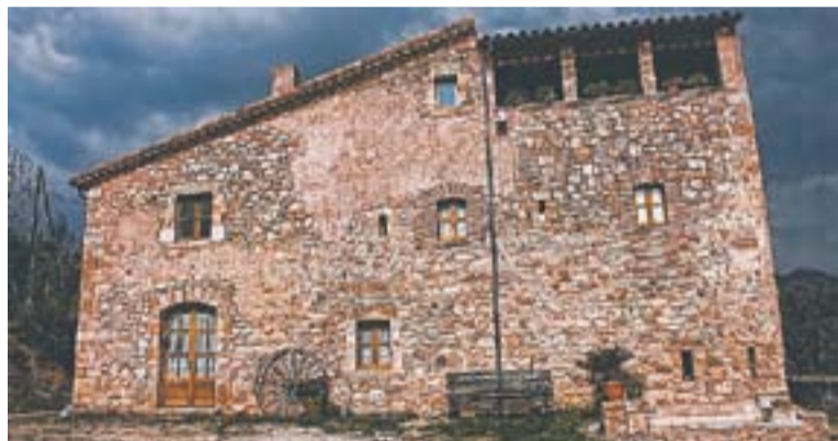
© Can Pèlacs', tercer premi