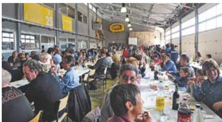
A dalt, preparant la paella. A baix, durant el dinar.