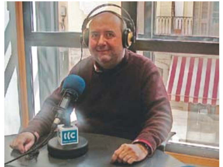
© Jordi Garrigós als estudis de Ràdio de Castellar || CEDIDA

El darrer programa de Renaixença que es va emetre el 12 de març a la 90.1 es pot escoltar al portal www.lactual.cat . +