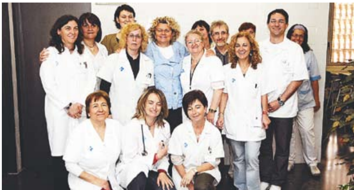
© L'exconsellera de Salut, Marina Geli, va visitar el CAP de Castellar el maig passat. A la foto, amb el personal del centre. | J. G.

El termini per presentar les ofertes comença a partir de la publicació del plec de clàusules en el Butlletí Oficial de la Província, el BOP. Una vegada publicat, les empreses tenen 13 dies naturals per a presentar-s'hi. Està previst que les obres s'iniciïn pel maig-juny, ja que el plec de clàusules recull que, com a màxim, l'acte de replanteig s'ha de fer el 30 d'abril. "Hi ha un procés obert en aquest moment on es poden presentar les empreses interessades per construir i habilitar aquests nous metres