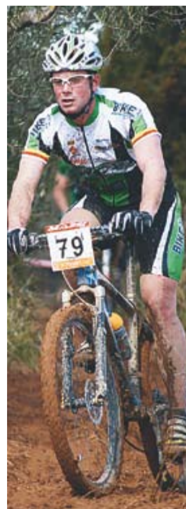
© Castellarencs a Banyoles. || CEDIDA

La propera cursa amb participació del Bike Tolrà