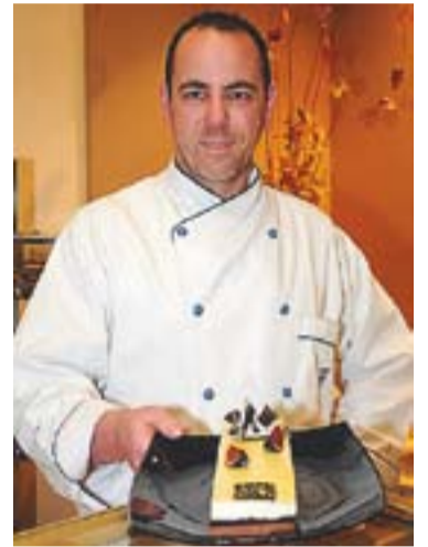
© Joan Muntada, pastisser. || ARXIU

La tasca que ha de dur a terme Muntada en tant que jurat és fer cinc degustacions, repartides en dos dies: “de bombons,