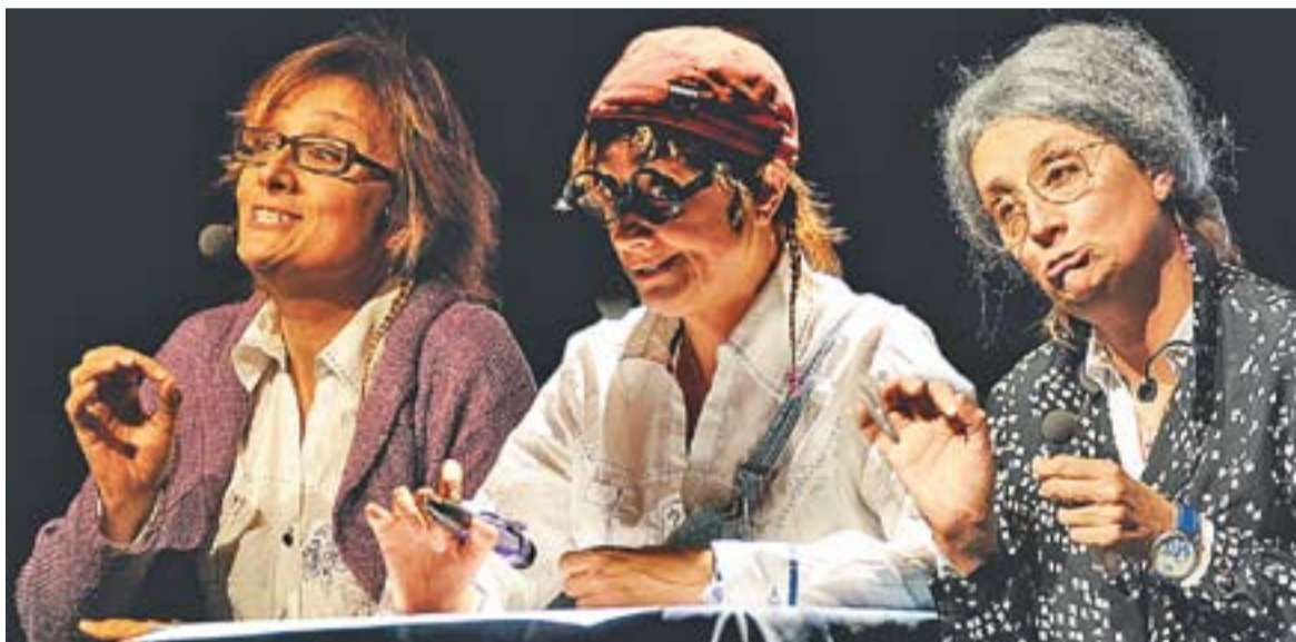
Algunes de les carecteritzacions de Rosa Fité durant la representació d'SPA MOCIONS de divendres passat.

L'obra SPA MOCIONS es va repetir dissabte 12, també amb èxit de públic. →