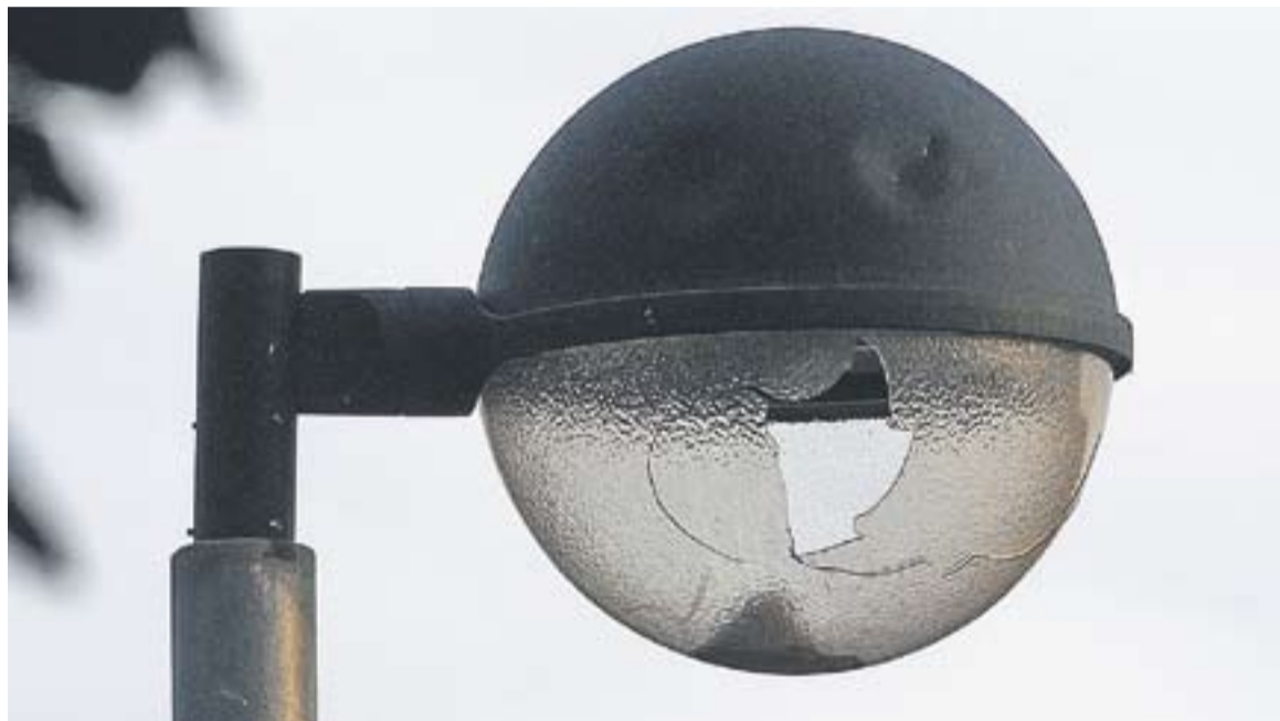
Fanal trencat per un acte vandàlic.

L'any 2010 es van produir 35 col·lisions de vehicles contra punts