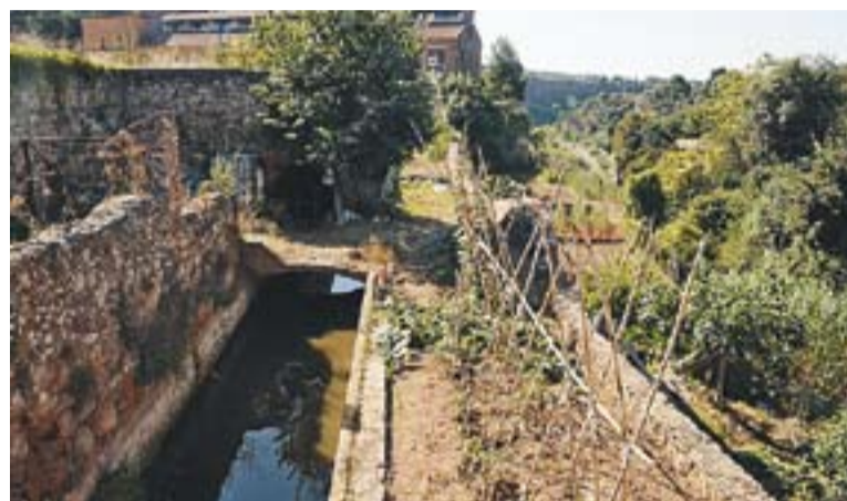
© La sèquia monar és un exemple d'arquitectura enmig de la natura || ARXIU

Com sempre, es faran diverses activitats, però una de les que més participants acull és el concurs de fotografia. Els interessats ja poden presentar les seves propostes, ja que el proper dilluns dia 7 de març es tancarà el termini d'admissió d'imatges relacionades amb el patrimoni arquitectònic.