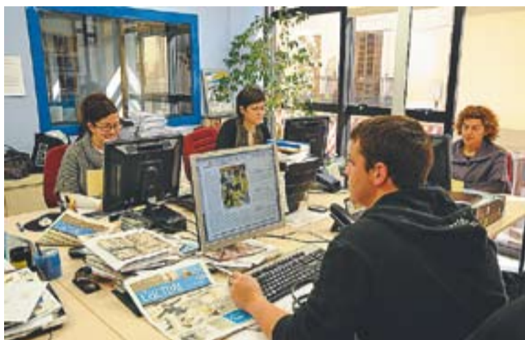
La redacció de L'ACTUAL i Ràdio Castellar dimecres passat al migdia.