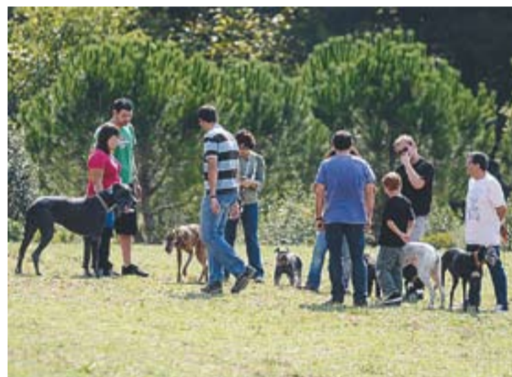
Propietaris passejant les seves mascotes al parc de Colobrers.

Segons el regidor de Via Pública, les ordenances municipals "no tenen una voluntat recaptatòria". "Com a societat ens hem de dotar d'elements i regles que ens permetin la convivència amb els altres ciutadans. Les ordenances volen garantir que allò que és de tothom és conservi", afegeix Canalís. +