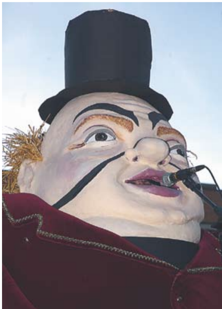
© En Toltes Papallongues ja prepara el seu discurs inaugural. || ARXIU

A la tarda, hi haurà tast de botifarra d'ou a càrrec de diversos comerços de la vila i xocolatada per a tothom en honor a Toltes Papallongues. A les 17 h s'iniciaran les danses tradicionals, de nou amb el grup Bufanúvols, i amb l'arribada oficial del Rei del Carnestoltes, a partir de les 18 hores. Dissabte 5, a les 17 h, es farà la tradicional concentració de carrosses, comparses i xarangués al carrer de Portugal. La cercavila s'iniciarà allí i continuarà pels carrers Lleida, Sant Esteve, Sant Pere d'Ullastre, Passeig Tolrà, General Boadella, carrer Major, plaça de Cal Calissó, Passeig, Pedrissos i, finalment, al carrer de Portugal.