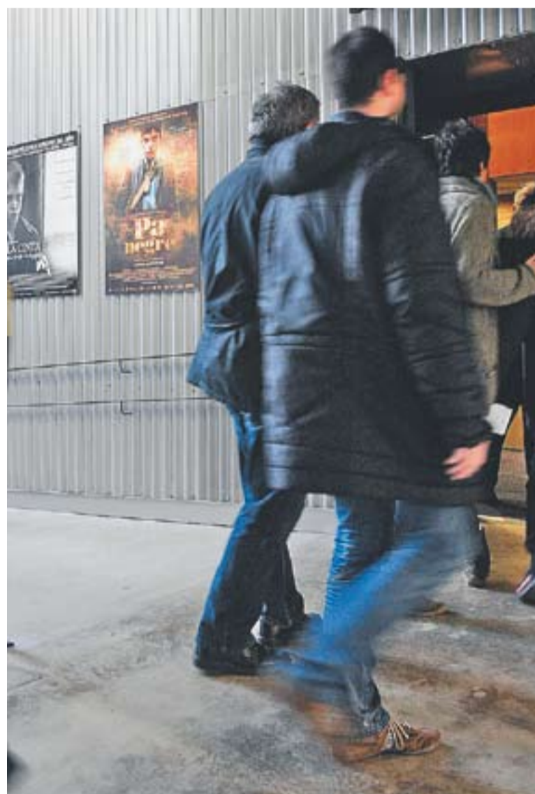
© El públic entrant dimecres passat a l'Auditori per veure 'La cinta blanca'. || J.G.

Totes aquestes pel·lícules entren a competició. El públic podrà votar aquelles que més els hagin agradat. El darrer dia del BRAM! es donarà a conèixer la pel·lícula més ben valorada. +