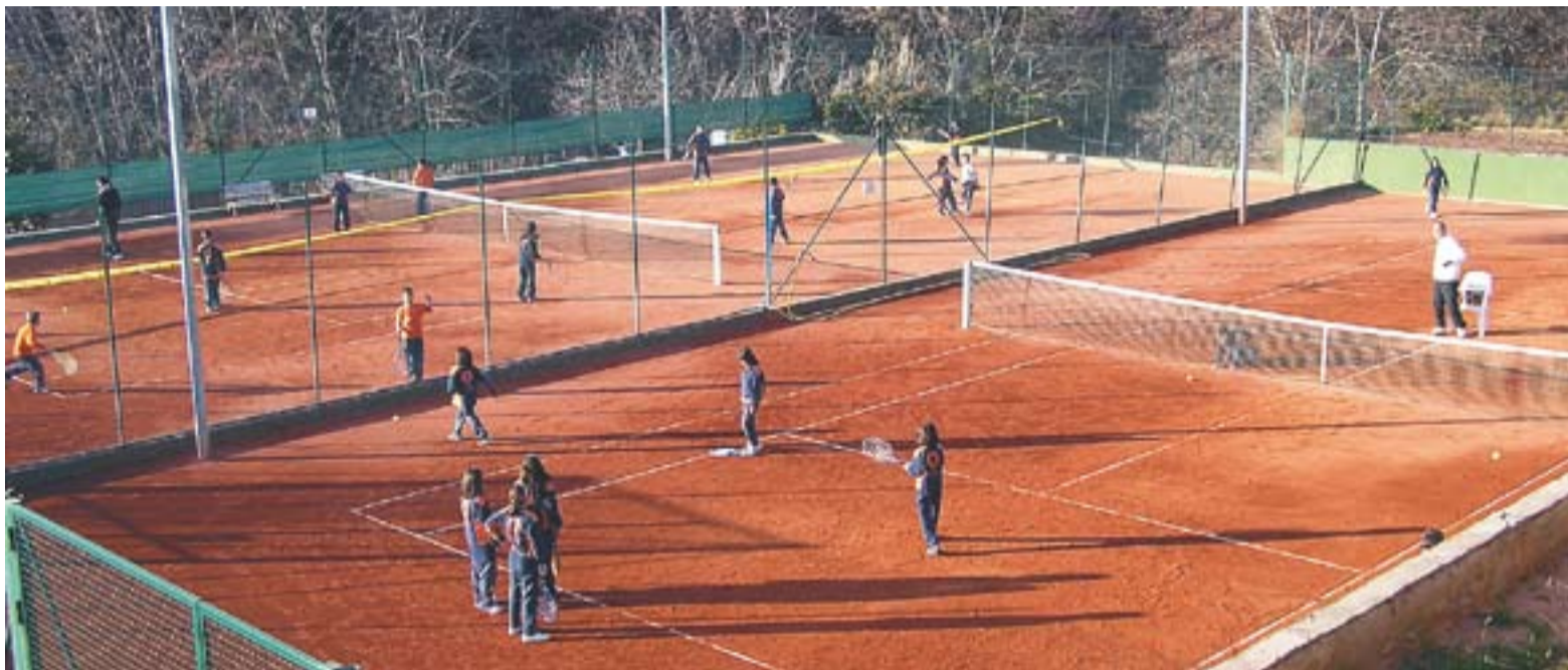
© Les instal·lacions del Club Tennis Castellar estaran més vinculades a les de la Penya Arlequinada a partir dels propers dies. || CEDIDA

benjamí de primer any, es va imposar a la resta de rivals. La prova constava de dues voltes a un circuit tancat de dos quilòmetres. Dissabte, Alcaraz va participar a unes proves d'alt rendiment amb l'Escola de Ca n'Anglada de Terrassa.