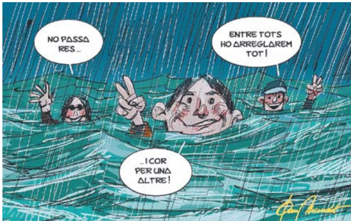
© Sense títol. || JOAN MUNDET

com si es tractés d'alguna d'aquestes situacions domèstiques. “Mengem-nos l'elefant a trossets”. Primer de tot hauríem de tenir la serenitat per aturar-nos, recapitular, analitzar i buscar causes, intentar canviar-ho i, si no es pot, minimitzar i acceptar-ho. Busquem