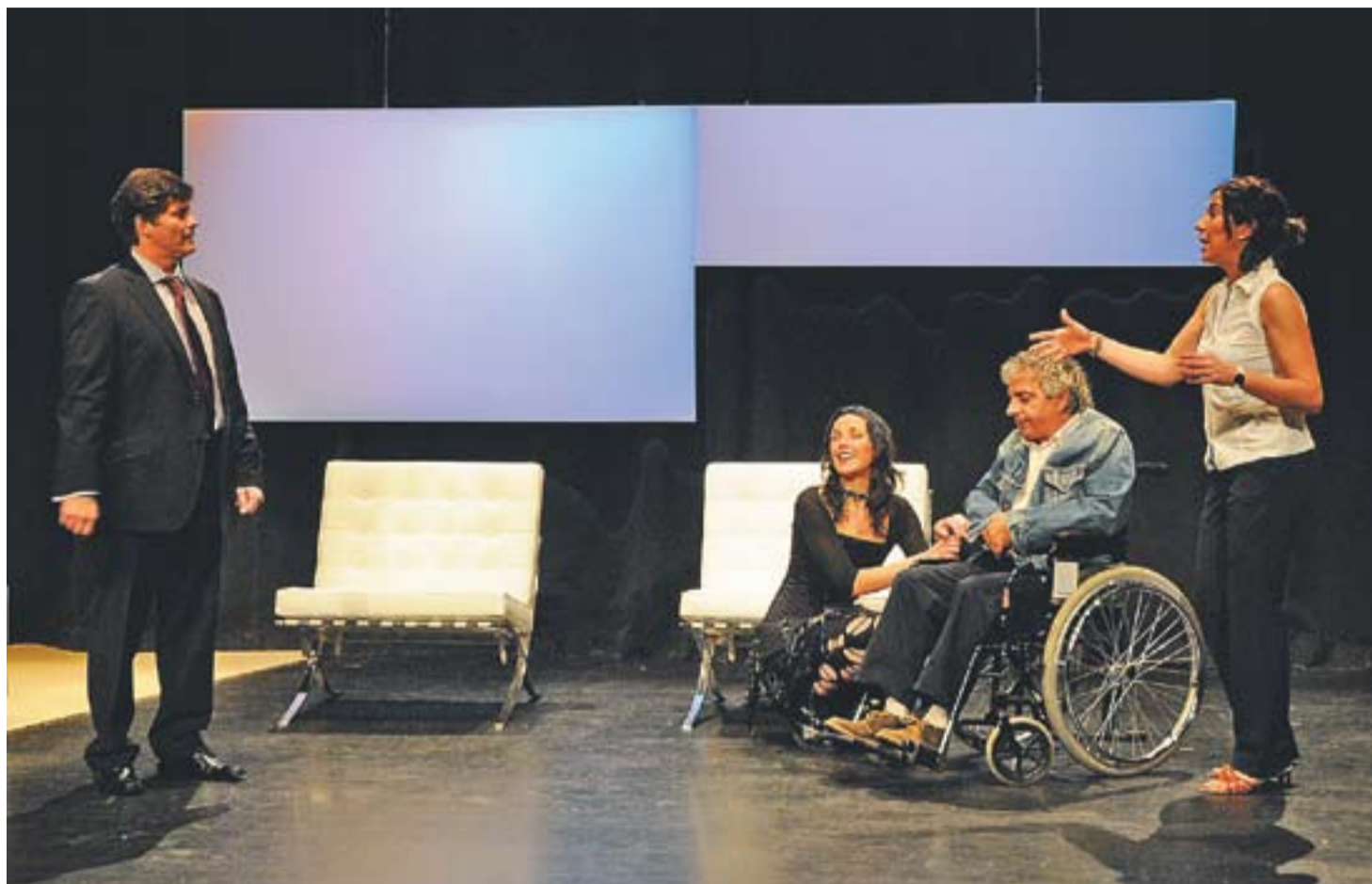
© Els actors d'Entre Cametes a l'assaig que van fer dimecres. || JOSEP GRAELLS