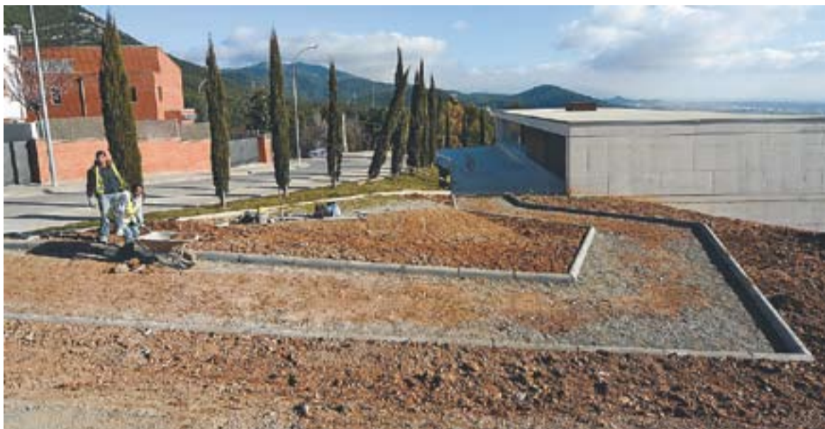
Obres de remodelació de l'accés al tanatori de Castellar del Vallès

L'actuació s'emmarca en els treballs d'eliminació de barreres arquitectòniques que també significaran l'eixamplament del carrer Sant Sebastià