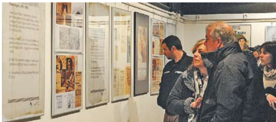
© Dia de la inauguració de l'exposició 'Dies de cine', a la Sala Polivalent, que es podrà visitar fins al 25. || JOSEP GRAELLS

⌚ La mostra, a la Sala Polivalent d'El Mirador, compta amb 50 plafons il·lustratius