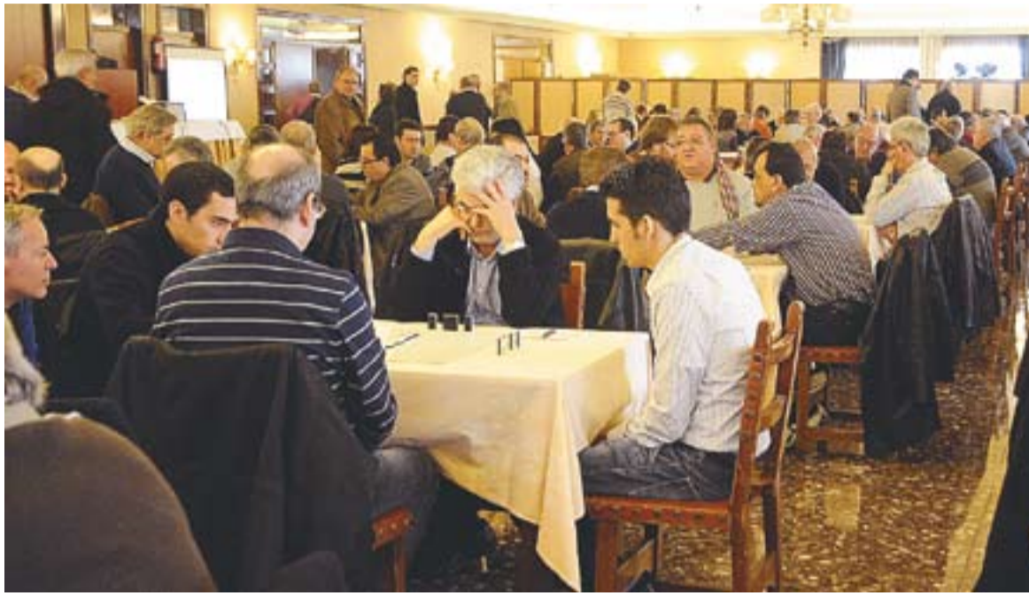
La sala del restaurant Can Font on es va fer la present edició del torneig de dòmino per parelles.