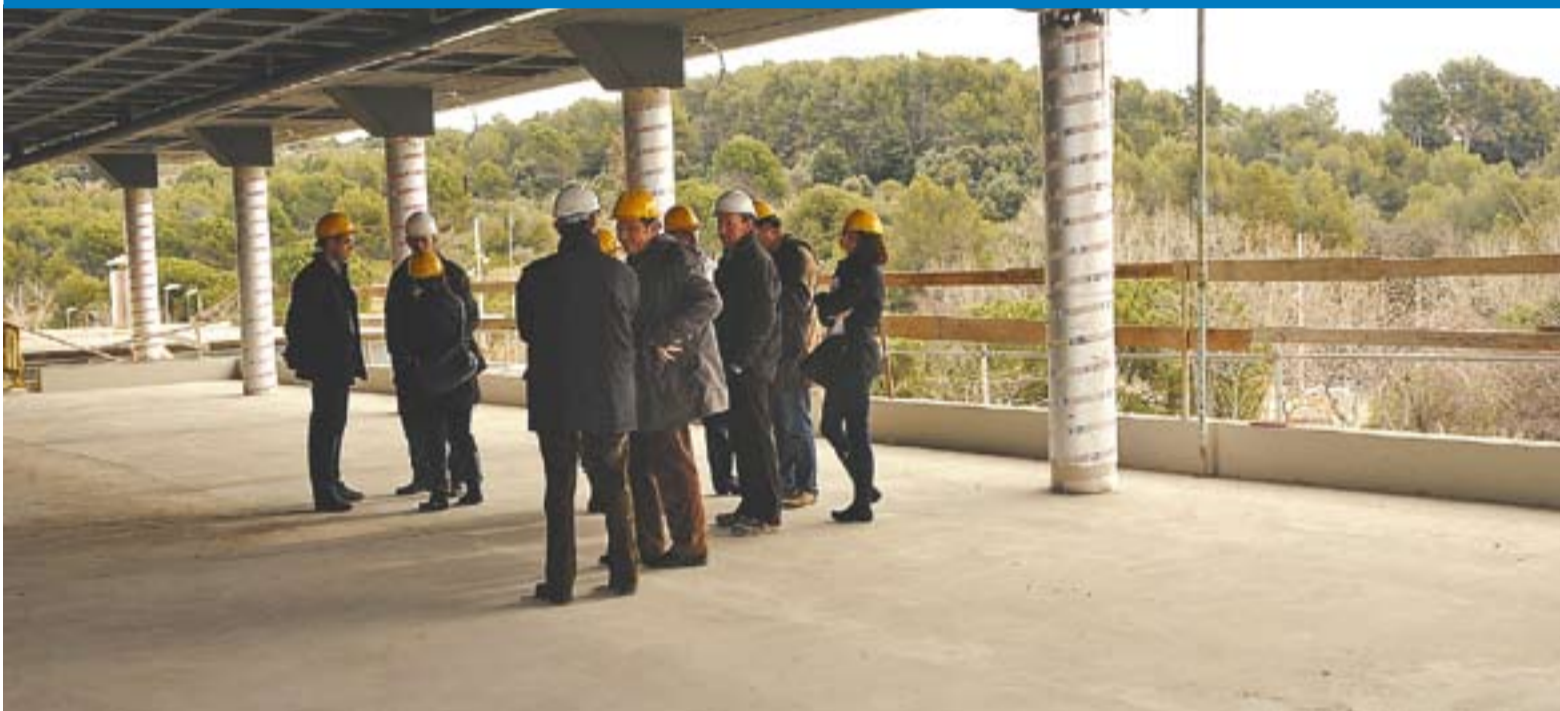
Polítics i tècnics visitant la que serà la nova sala de fitness, de 700 m2, des d'on es podrà fer esport i gaudir de la natura.