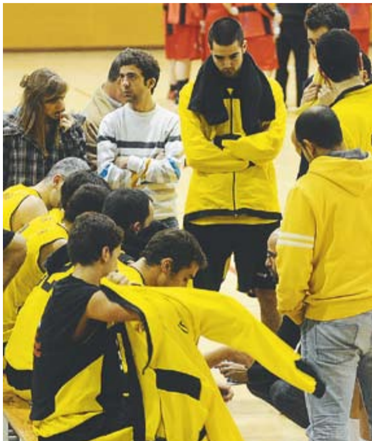
Els jugadors del CB Castellar en un descans d'un partit.

El Santa Coloma, acostumat a anotar amb facilitat i amb un balanç de deu victòries i set derrotes, no va poder contrarrestar el joc castellarenc. “Vam jugar molt bé i la diferència final de set punts la va marcar l'encert des de la línia de tirs lliures” , comenta el tècnic, Juste.