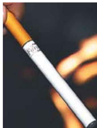
© Els cigarrets electrònics -sobre d'aquestes línies- són un dels recursos més emprats per deixar de fumar

els pegats o els xiclets, de tota manera, si no hi ha força de voluntat per part de la persona fumadora serà molt difícil que aconseguixi deixar aquest hàbit.