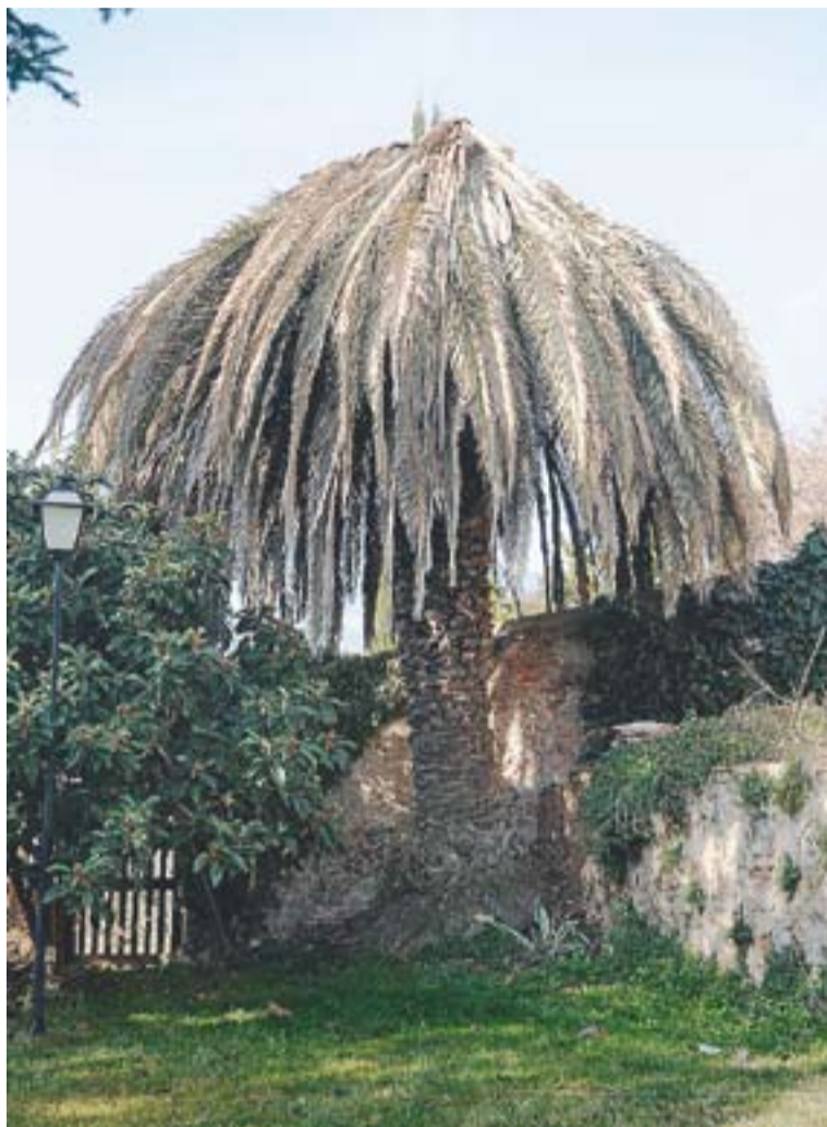
Una de les palmeres afectades pel morrut roig.

La poda de fulles verdes i les neteges o altres activitats que puguin causar ferides a la part viva de les palmeres es podrà fer únicament fins el febrer. Per a més informació, podeu trucar al telèfon 934 092 090. +