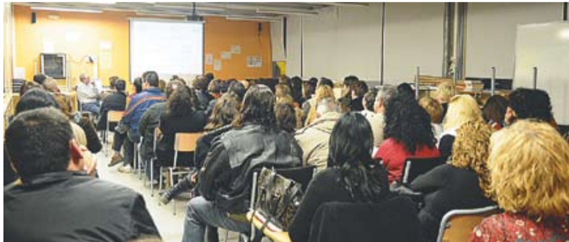
La convocatòria que fa l'institut Puig de la Creu per mostrar el centre sol comptar amb un centenar d'assistents.