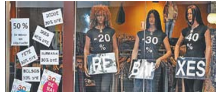
Aparador de la campanya de rebaixes de Marel·la.

talussos...) perquè aquesta retingui més humitat. A més, aporta nutrients, millora l'estructura del sòl i impedeix que creixin males herbes. Per tant, els arbres de Nadal tindran una nova i necessària funció després d'haver guarnit casa nostra durant el Nadal: nodrir la terra on potser en creixeran de nous.