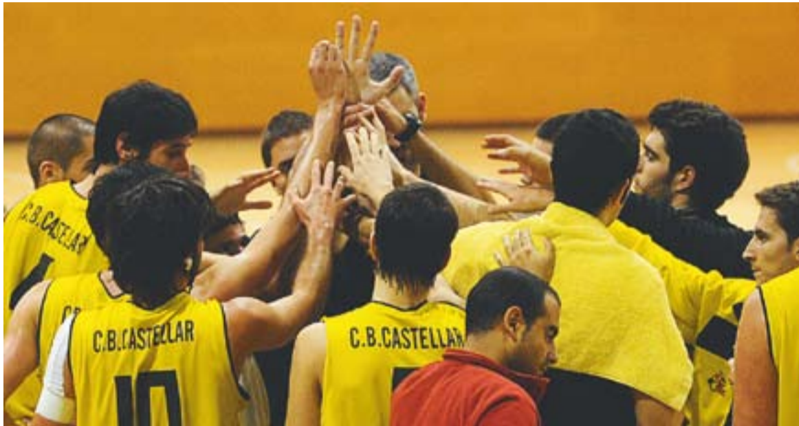
Els castellarencs fan pinya en acabar un temps mort al pavelló Puigverd.

Acaba la primera volta amb igualtat màxima: el Castellar és onzè a només quatre victòries del líder, que ja ha perdut cinc partits