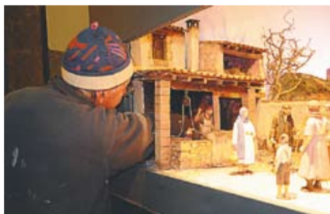
A dalt, Pessebre popular i Nous llenguatges del pessebre. A sota, fotògraf de la TV italiana i elaboració de pessebre.