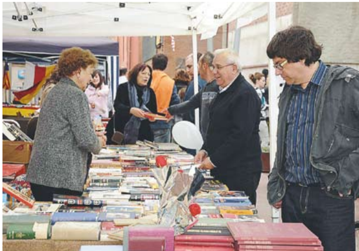
Fira de llibres de Castellar de la diada de Sant Jordi del 2010