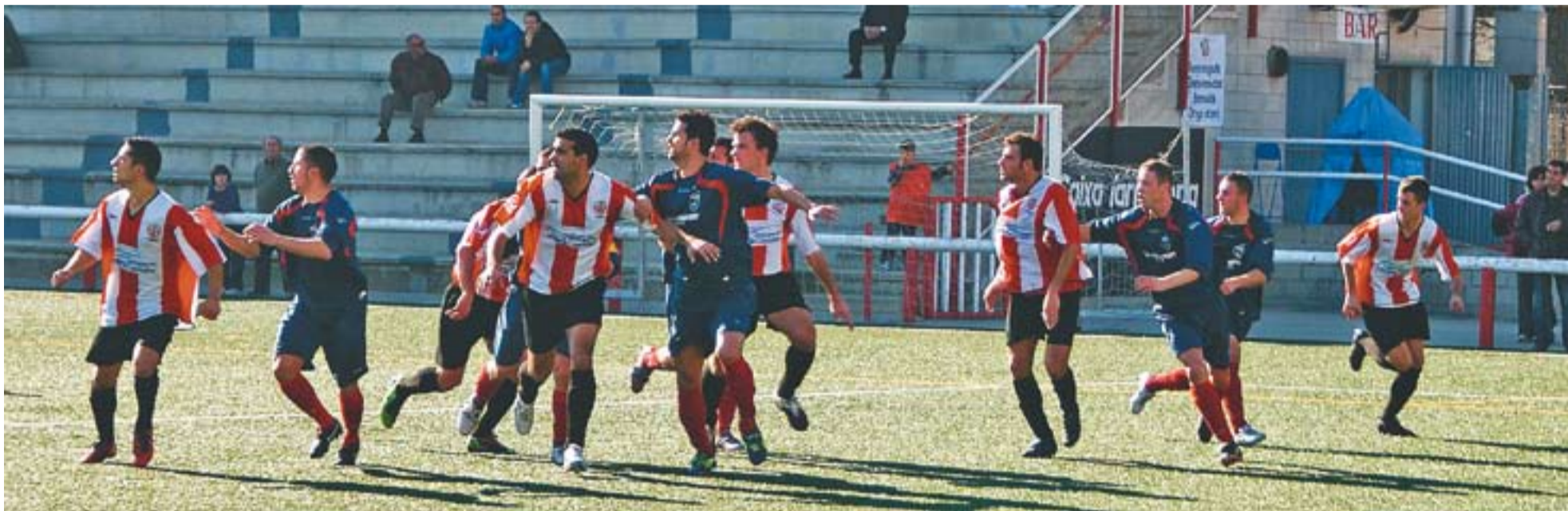
Una jugada d'atac del conjunt castellarenc en el partit de diumenge contra el San Lorenzo al Pepín Valls.

frontar-se al Futbol Sala Castellar B. Els castellarencs són quarts de la taula amb 23 punts i es troben a només cinc punts del Pallejà, que és líder tot i haver guanyat set dels nou partits per un màxim de dos gols de diferència.