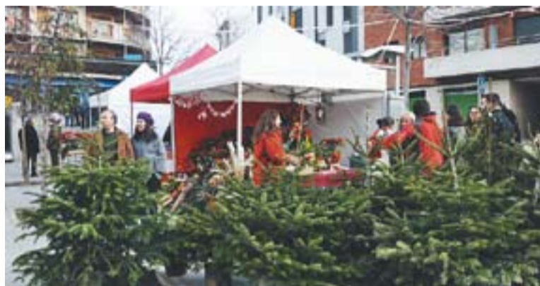
© Arbres naturals a la Fira de Santa Llúcia de la Plaça Calissó. || JOSEP GRAELLS

Segons informen des del servei, aquest any només un veí de Castellar, del carrer Sala Boadella, ha sol·licitat que li retirin l'arbre nadalenc. Però l'arbre estava sec i no s'ha pogut reciclar, se li ha fet el mateix tractament que a les restes de poda. Altres anys, diuen des del servei, havien de recollir més exemplars, fins i tot trams de carrer perquè, per exemple, els comerciants decoraven les entrades de les botigues amb avets naturals. +