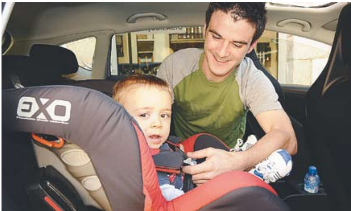
Els controls incidiran especialment en l'ús dels dispositius de retenció infantil, a la sortida i entrada de les escoles.