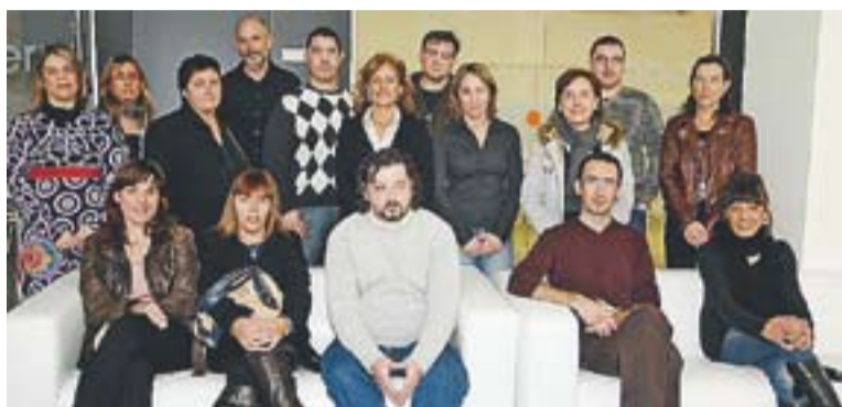
Castellarencs contractats als plans d'ocupació del 2011

Els plans d'ocupació tenen com a objectiu revaloritzar el currículum dels seus beneficiaris. “Tornar