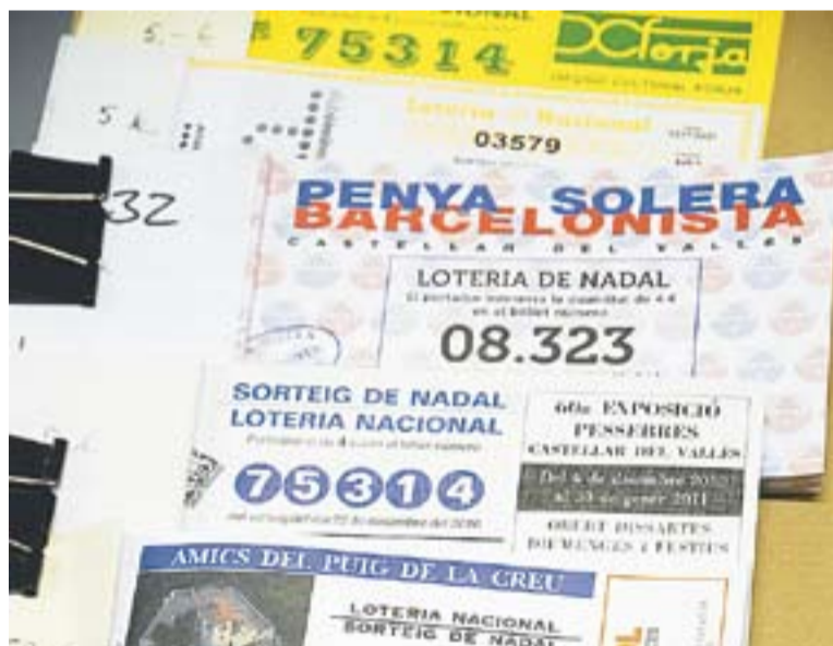
© Algunes de les butlletes de les entitats castellanques || JOSEP GRAELLS

Les entitats castellanques juguen molt fort i han incrementat el pressupost destinat a la compra de butlletes per la Grossa de Nadal. Per exemple, la Unió Esportiva Castellà ha encarregat 30.000 euros de loteria, 5.000 euros més respecte el 2009. El club de futbol celebrarà el seu centenari el 2011. Segons Joan Homet, president de