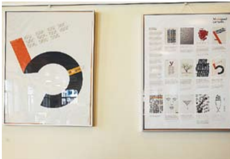
© L'exposició es pot visitar ara a la Biblioteca Antoni Tort.

La col·lecció del poeta s'amplia amb un llibre i un film, però a més, la mateixa biblioteca ha afegit llibres i documents que parlen sobre Miguel Hernández i que poden servir per repassar la seva curta però intensa vida. +