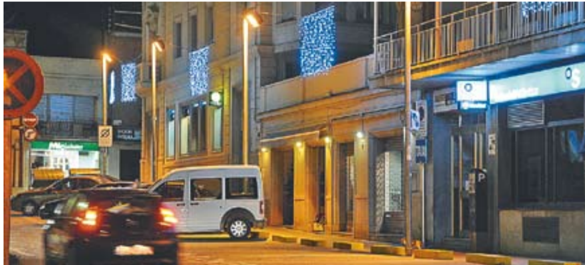
L'aspecte dels llums de Nadal a la plaça Calissó.

La campanya persegueix un doble objectiu: augmentar la sensació de seguretat entre els