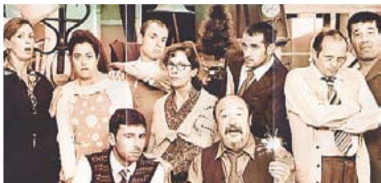
Actors i actrius de l'obra 'Natale in Casa Cuppiello'.