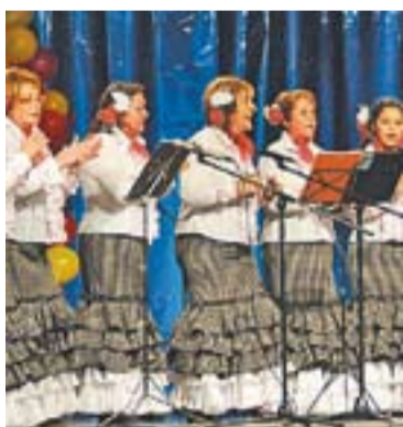
Aires Rocieros Castellarencs