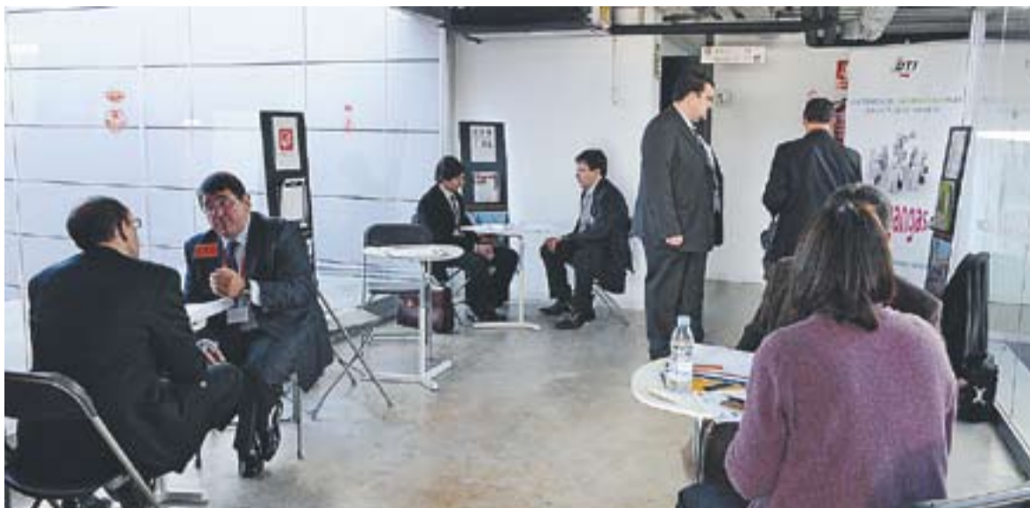
Una tercera part de les empreses assistents a la jornada de contactes empresarials són de Castellar