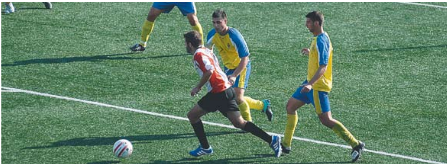
La UE Castellar en una jugada d'atac.