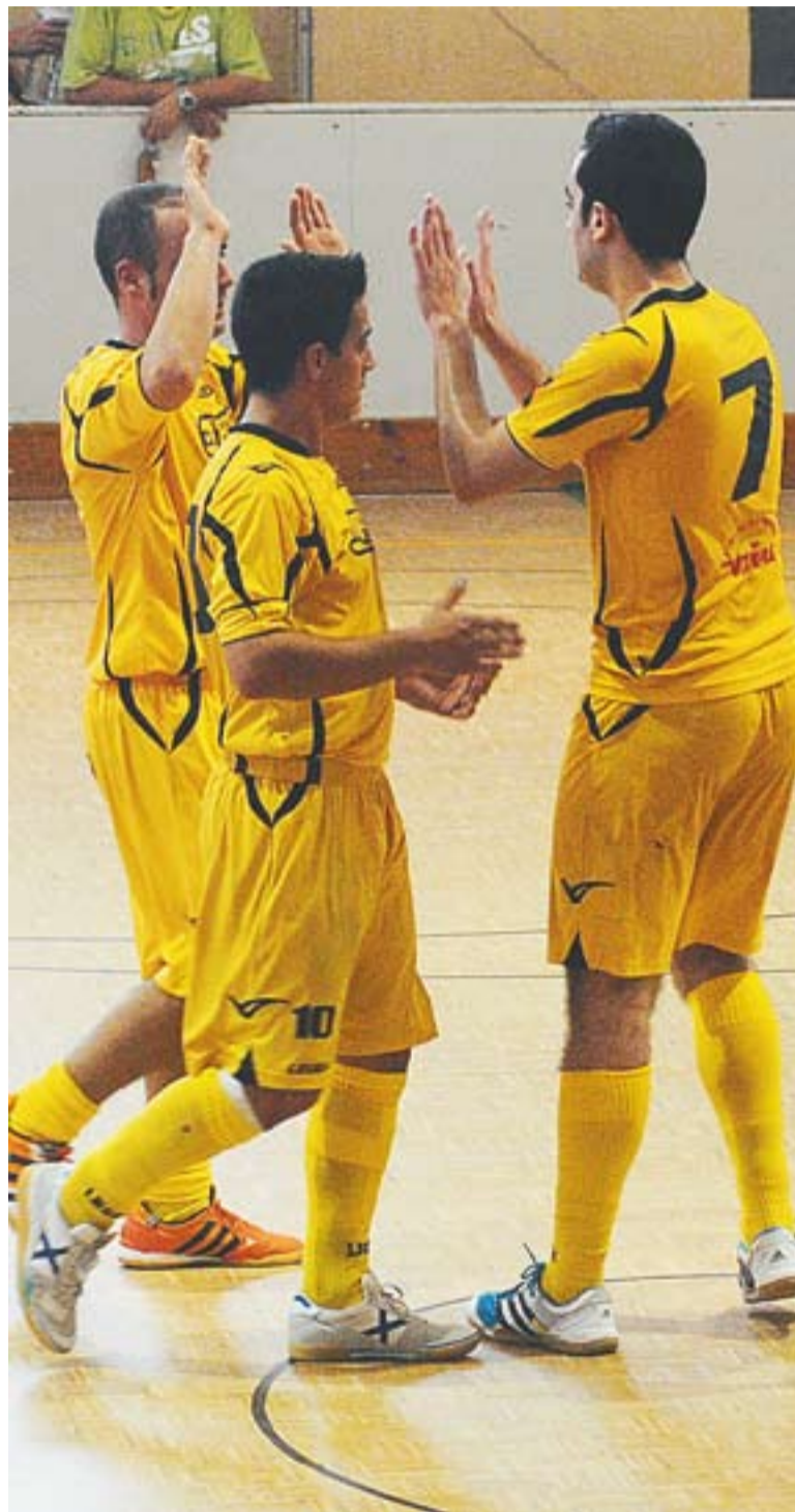
Els jugadors de l'Athlètic 04 celebren un gol al Joaquim Blume.

Malgrat que serà difícil l'ascens, el bon moment de l'Athlètic 04 fa pensar en una bona temporada. Només puja un equip a Territorial, però tots els conjunts hauran d'estar atents a la reestructuració de Nacional A, que podria beneficiar els ascensos de les categories inferiors. +