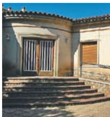
Fundació Obra Social Benèfica