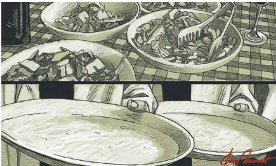
© Declaració universal dels drets humans. Felix aniversari? || JOAN MUNDET

Tot i la existència de pactes internacionals, convencions, declaracions complementàries, és preocupant la manca de voluntat política dels governants - condicionats implacablement