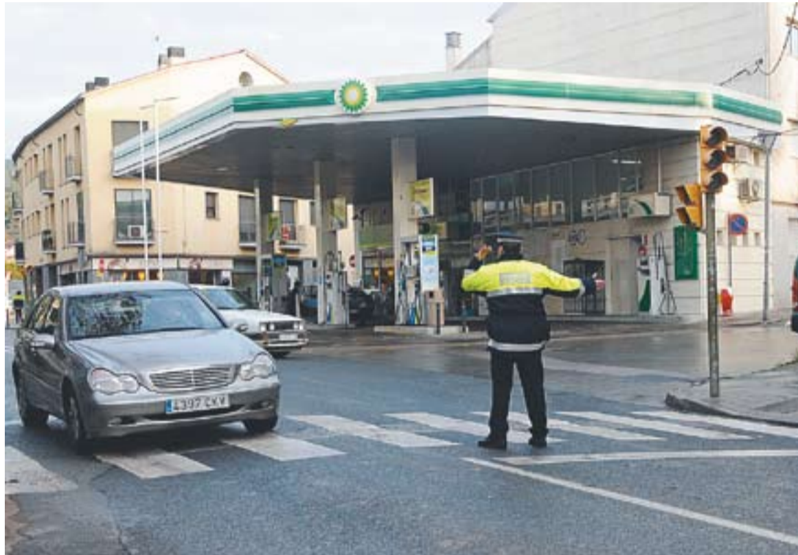
La carretera té davant de la benzinera BP un dels punts més problemàtics del trànsit, com mostra una imatge d'ahir

Quan es parla de la mobilitat a peu es posen de manifest aspectes