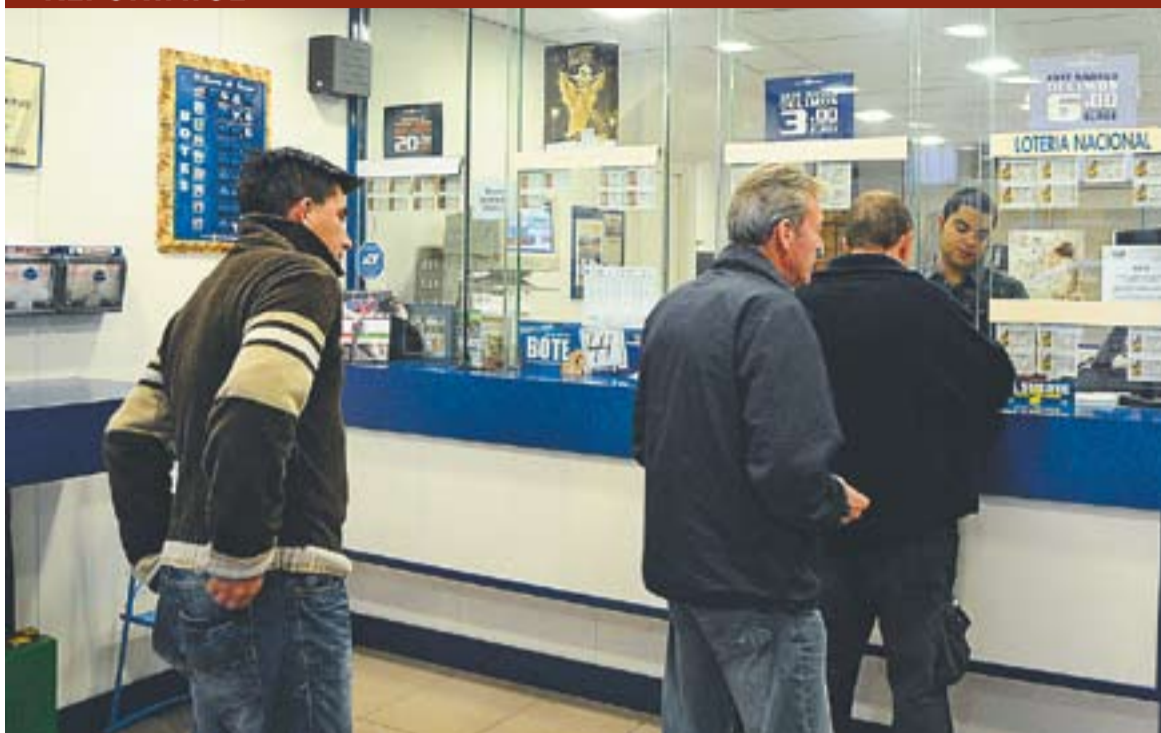
© L'administració de loteria número 1 de Castellà del Vallès || JOSEP GRAELLS