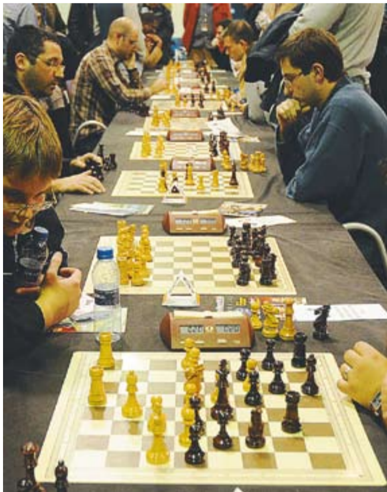
© Una imatge d'arxiu del Memorial Joaquim Marzà. || JOSEP GRAELLS

MEMORIAL MARZÀ || Una setmana més tard, el 18 de desembre, es disputarà la tercera edició del Memorial Joaquim Marzà a la Sala Blava de l'Espai Tolrà. És un torneig on