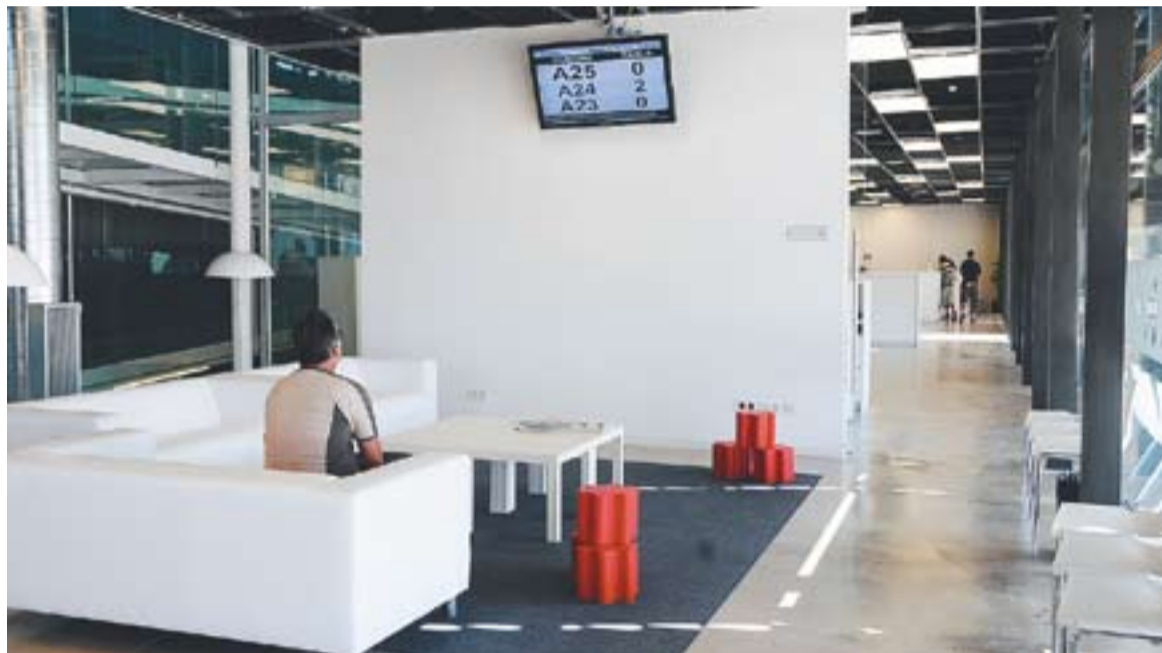
La composició digital decorarà aquesta paret del Servei d'Atenció Ciutadana, ubicat a la primera planta d'El Mirador.