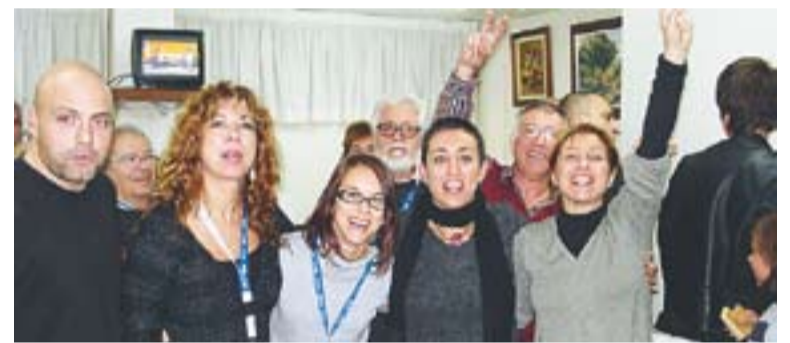
© La seu local de Convergència va esclatar d'alegria diumenge. || C.D.

FONT: DEPARTAMENT DE GOVERNACIÓ I ADMINISTRACIONS PÚBLIQUES