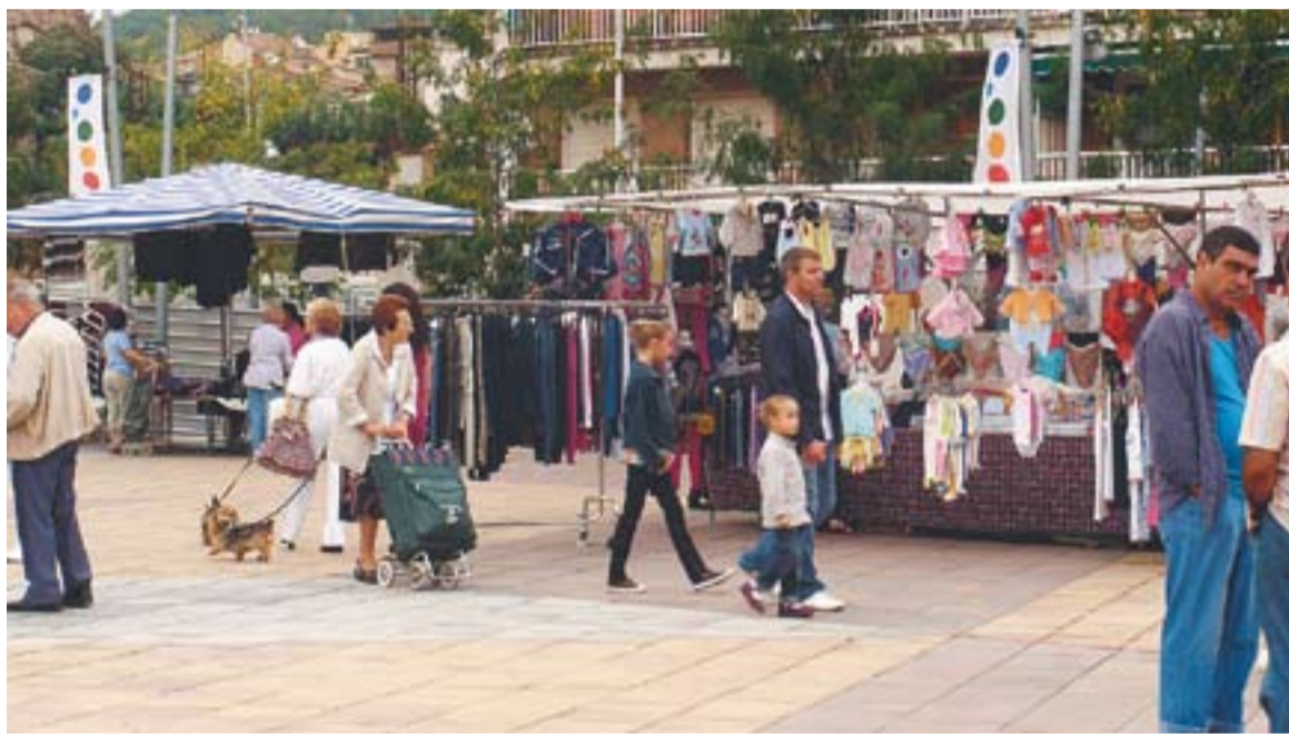
Imatge del mercat el setembre passat, mes en què es va obrir el concurs públic per ampliar el nombre de parades.