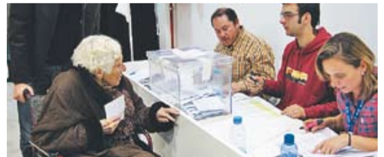
© Remei Company, amb 107 anys, la castellarenca més gran que va votar. || CEDIDA