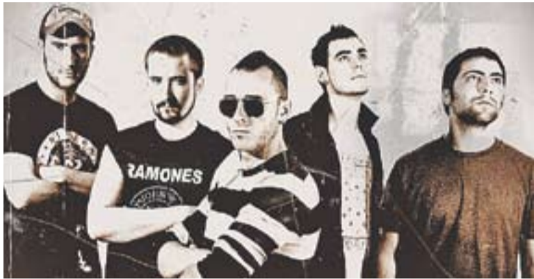
© Mucca Failate és un dels grups que col·labora al concert solidari. || CEDIDA

L'entitat Castellar amb el Poble Saharai organitza una festa-concert per recaptar fons, demà dissabte a l'Espai Tolrà