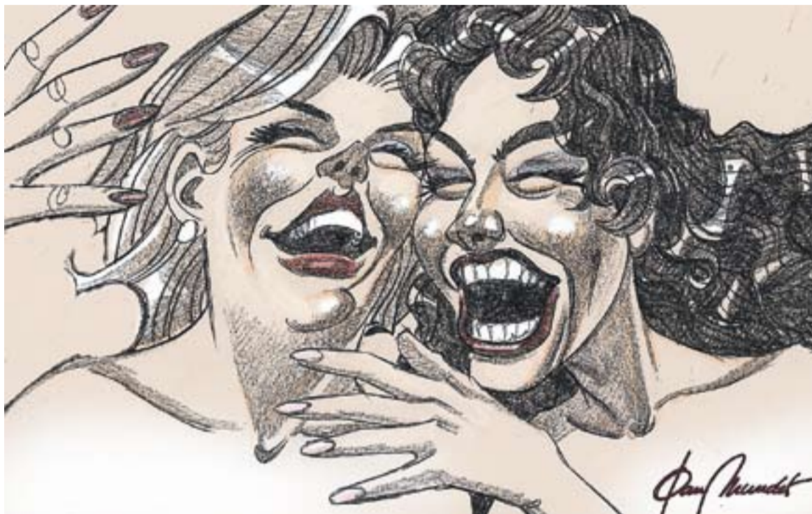
© No fotis! || JOAN MUNDET

Però explicar-vos aquesta experiència viscuda em va molt be per dir el