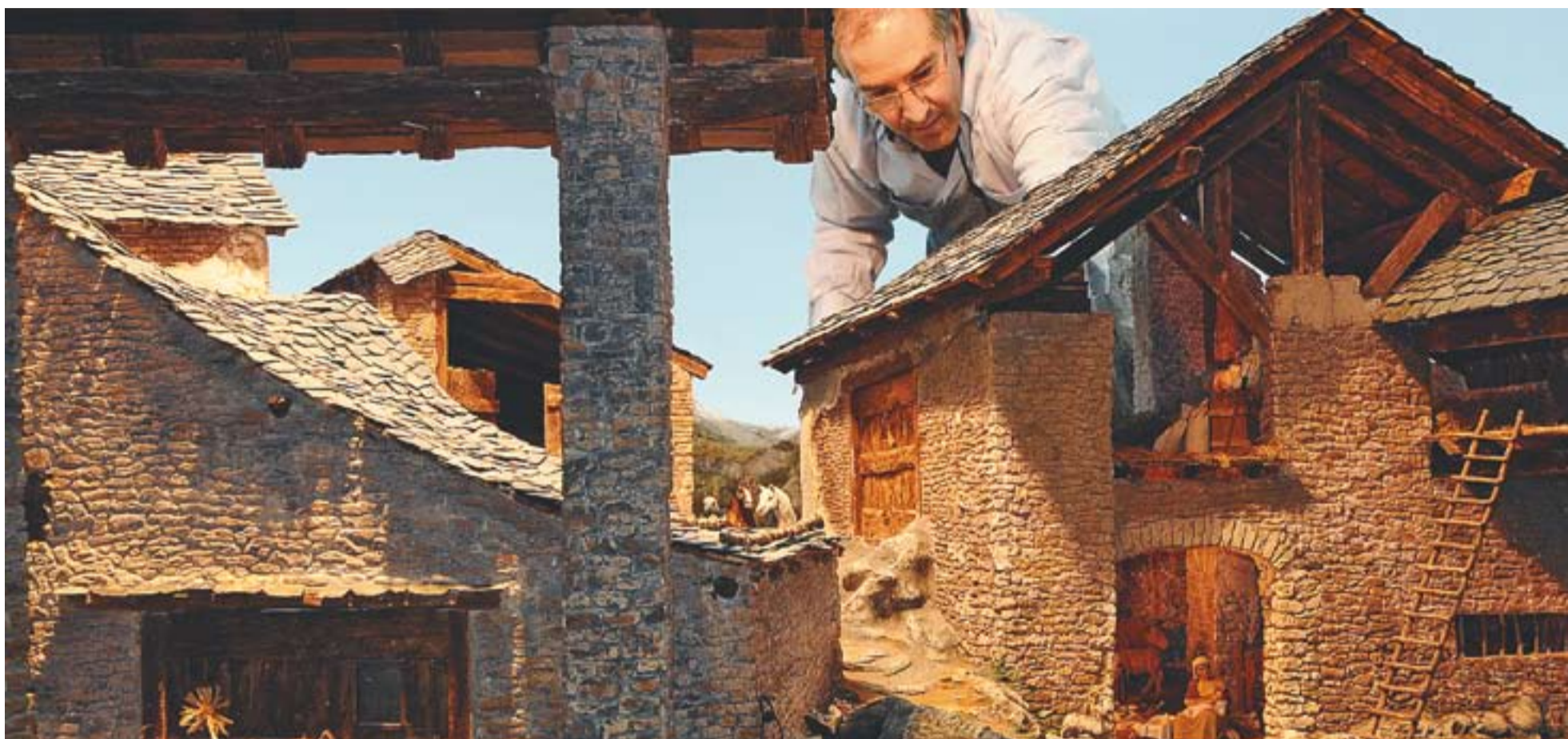
© Darrers detalls del pessebre gegant que reproduceix l'art arquitectònic de les masies històriques de Castellà del Vallès. || JOSEP GRAELLS