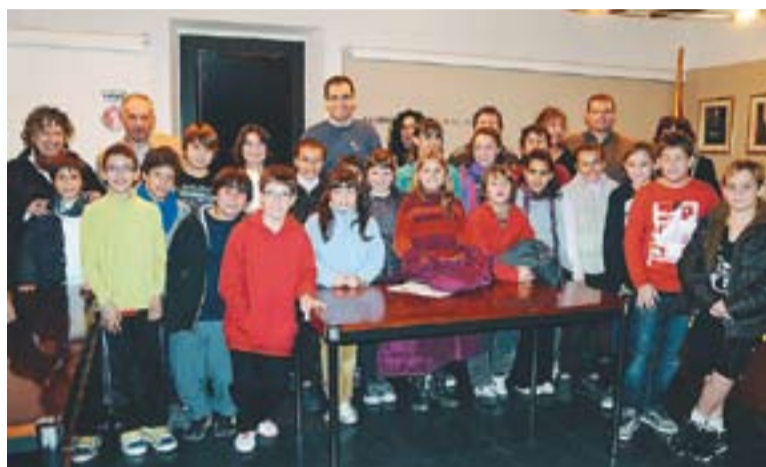
Primera sessió del Consell Municipal d'Infants, dimecres passat

L'objectiu d'aquesta iniciativa és fer arribar al consistori la visió que els infants castellarencs tenen sobre la vila així com també les seves propostes per millorar-la. "El municipi és una suma de totes les visions sobre la vila. És una petita construcció que fem entre tots", assegura Ignasi Giménez, l'alcalde de la vila. "A banda de fomentar que