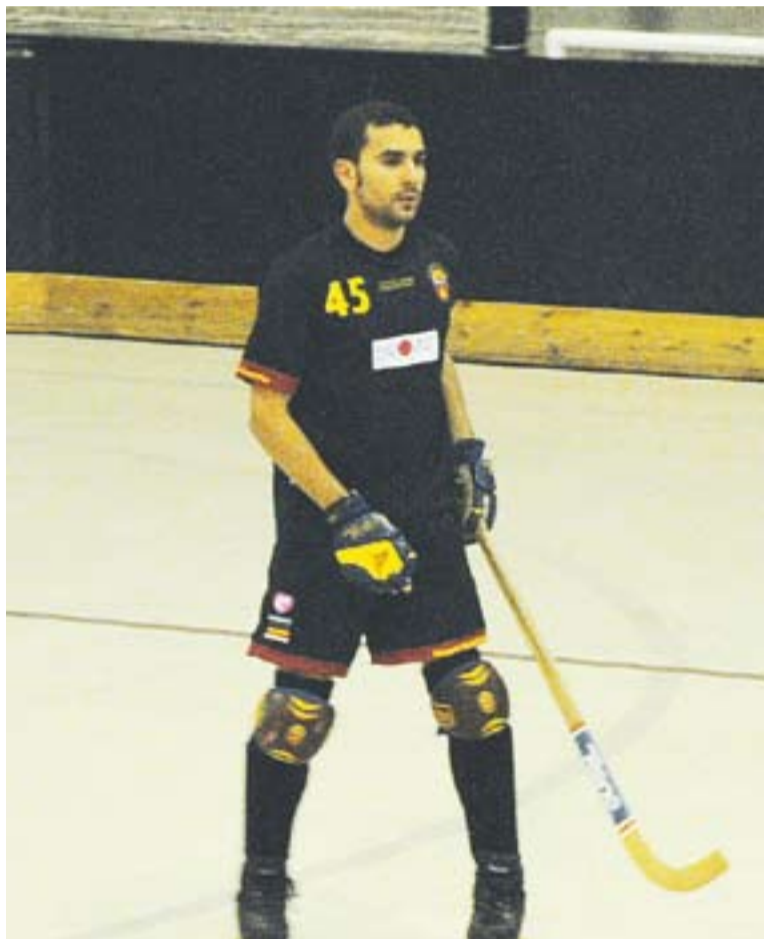
© Un enfrontament a casa de l'Hoquei Club Castellar. || JOSEP GRAELLS

Els castellarencs han sortit beneficiats aquesta jornada ja que la victòria va provocar l'allunyament respecte l'Arenys de Mar i el Canet, immediats perseguidors dels castellarencs a la taula. Actualment els de Ruglio se situen quarts a la classificació amb 19 punts en una zona molt tranquil·la. Cinc punts els avantatgen del seus perseguidors mentre que la part alta de la taula és troba a 6 punts. “Hem perdut alguns partits que no havíem de perdre però a dia