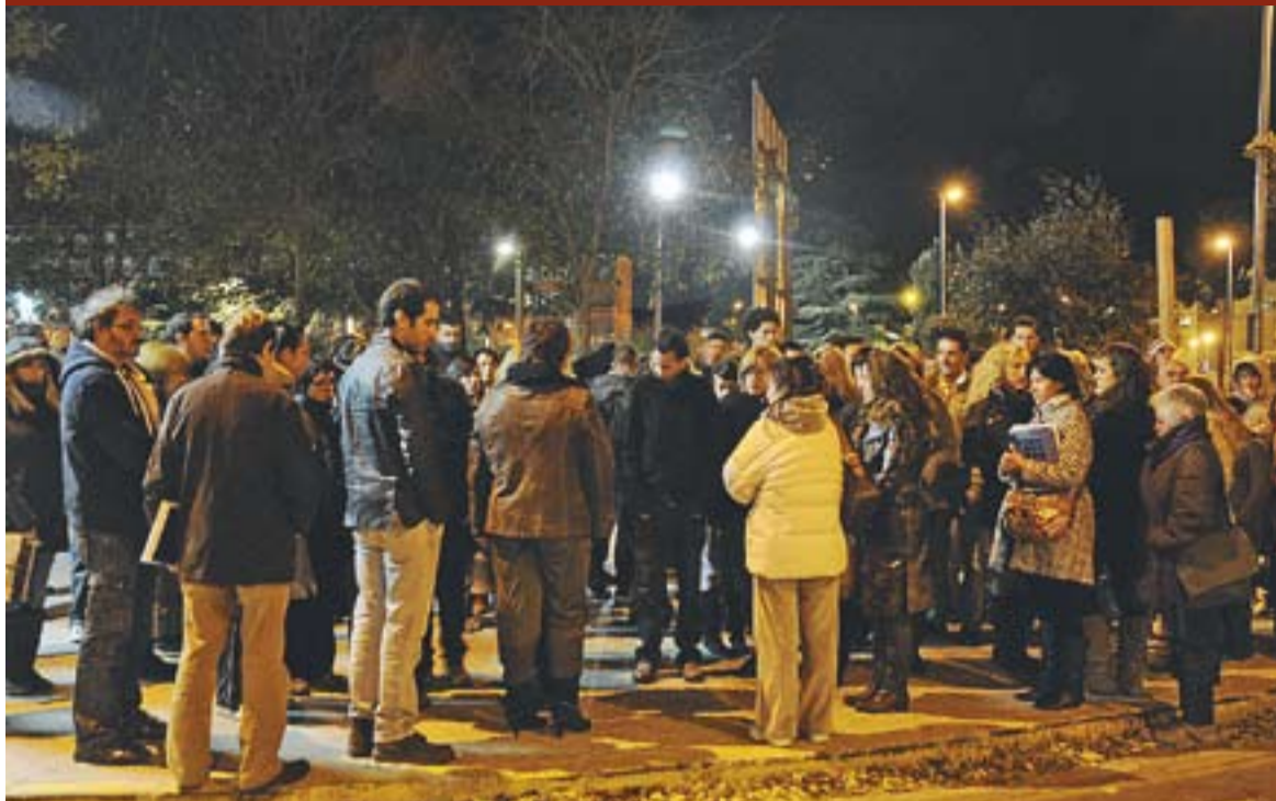
Lectura del manifest contra la violència masclista de l'Escola d'Adults de Castellar de Vallès