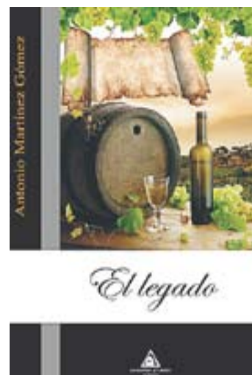
© Llibre d'Antonio Martínez. || CEDIDA

nistes i també contemporanis", explica Martínez. No hi falten ni les històries d'amor ni les venjances, ni els bons i els dolents, i posa un interès especial en la cultura del vi. "He intentat ser fidel a la terra d'on vinc, el món rural de Granada". Afegeix que "Sempre m'ha interessat el món vitivinícola i per això en parlo".