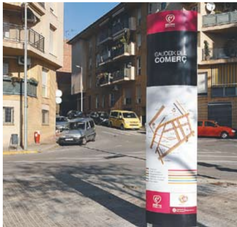
Un dels tòtems està ubicat a l'entrada del poble, al carrer Pedrissos.

TÒTEMS INFORMATIUS || D'altra banda, els 4 tòtems que han d'informar sobre qüestions relacionades amb el comerç ja estan instal·lats. En aquests punts d'informació estaran senyalitzats els carrers del centre comercial del municipi (ubicats al rectangle que formen els carrers avinguda Sant Esteve, carrer Major, Sant Pere d'Ullastre i carrer de les Fàbregues) i el tipus d'establiments que trobarem a cada carrer. Els tòtems s'han ubicat al carrer Pedrissos, plaça Calissó, Sant Esteve i Carretera de Sentmenat. +