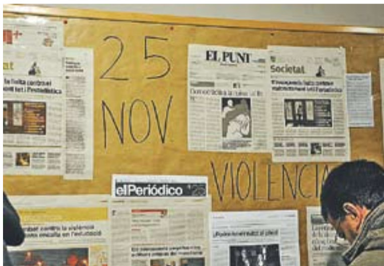
Homenatge a les 64 víctimes de la violència masclista de l'Escola d'Adults