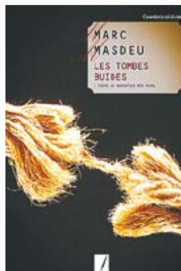
© Llibre de Marc Masdéu. || CEDIDA

La novel·la s'emmarca en un entorn bucòlic, "amb tocs moder-