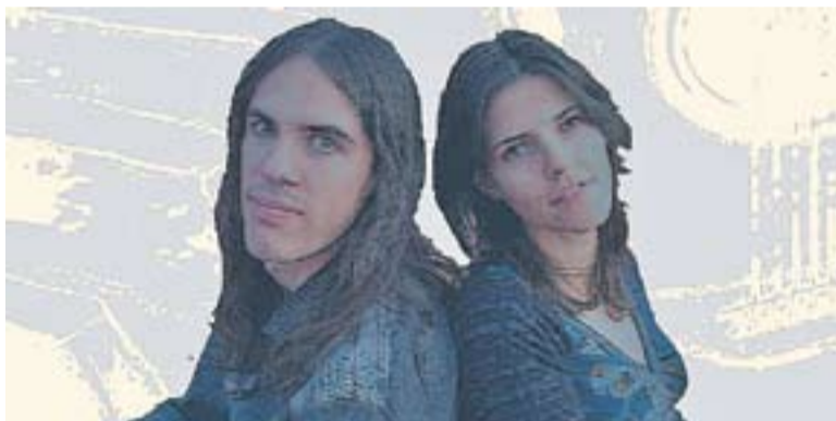
© Moments actuarà primer. || CEDIDA