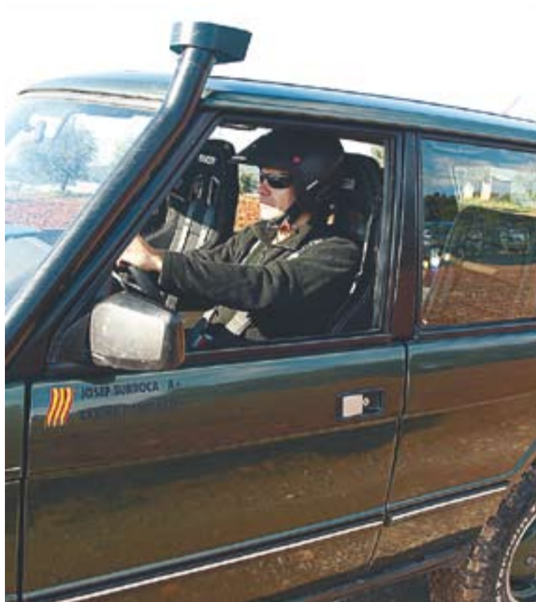
© Josep Surroca amb el vehicle que utilitzarà a la prova. || CEDIDA

El pilot castellarenc va poder finalitzar la prova passada i ja està preparat per afrontar la d'aquest any. El traçat transcorre per superfícies molt diferents: des de de-