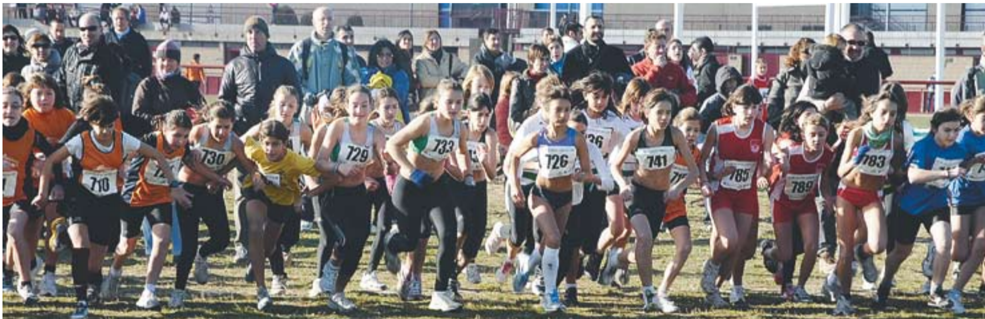
El moment de la sortida d'una de les proves que es van disputar durant el matí de diumenge als voltants de les pistes d'atletisme del Parc de Colobrers.

cap de setmana van encaixar la segona derrota al pavelló Joaquim Blume al caure contra el Grup Ar-rhona per 2 a 6. Els castellarencs són segons de la classificació amb 13 punts, sis menys que el líder, el Pallejà.