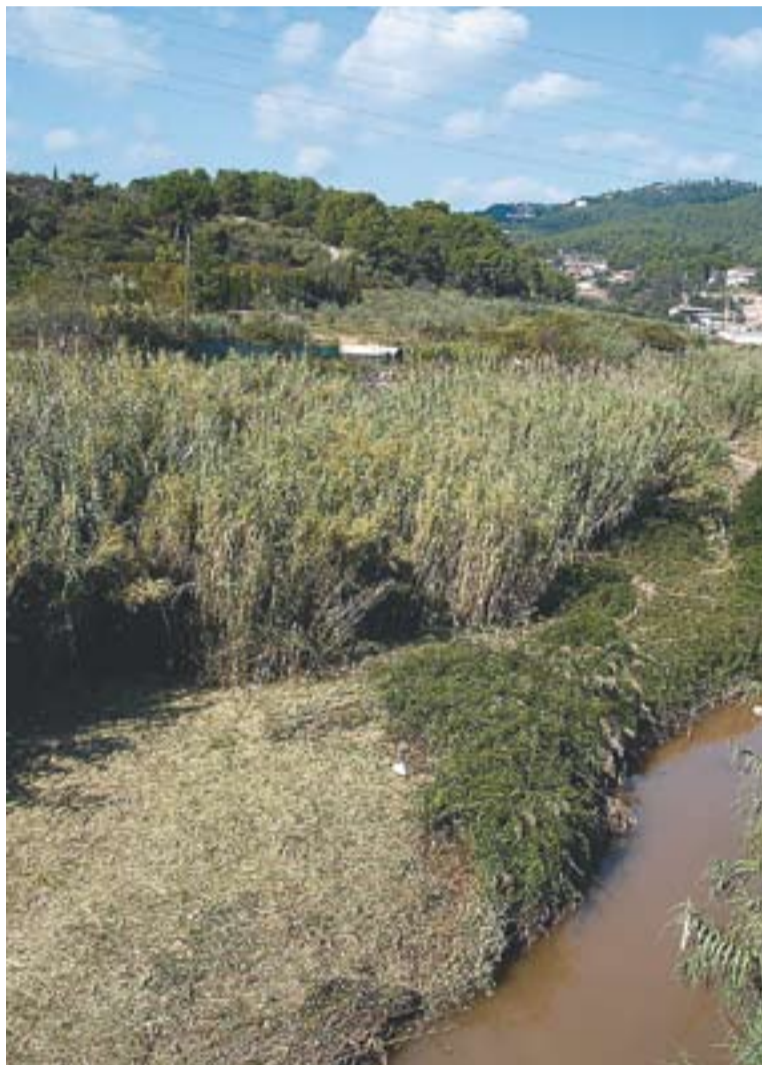
© La vegetació pròpia de la zona, el canyissar, en un tram del riu Ripoll. || OFICINA 21

La Regidoria de Medi Ambient convocarà properament una jornada de plantació. La intenció és poder reproduir l'hàbitat fluvial propi d'aquests ambients, amb vegetació que inclourà canyissar, salzedra i albareda, espècies que s'adaptin de manera més òptima a les condicions biogeogràfiques de la zona. En els darrers anys, l'Ajuntament ha efectuat diverses intervencions en espais fluvials del riu