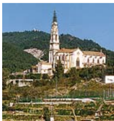
Colònies i Esplai Xiribec