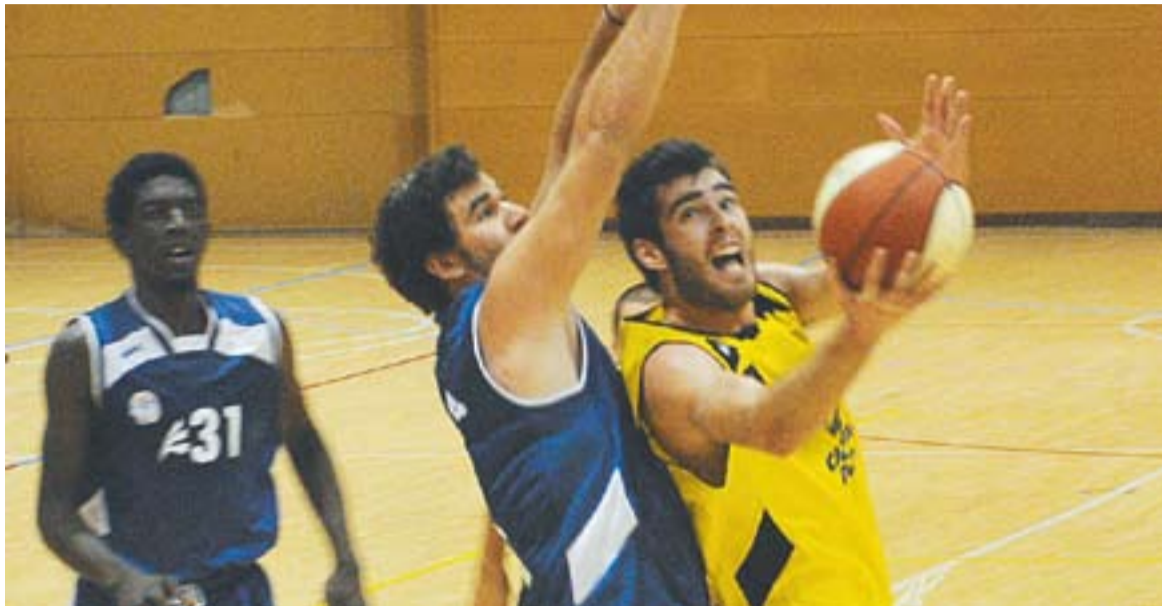
© La defensa del Castellar es va veure clarament superada pel tir exterior del Girona. || JOSEP GRAELLS