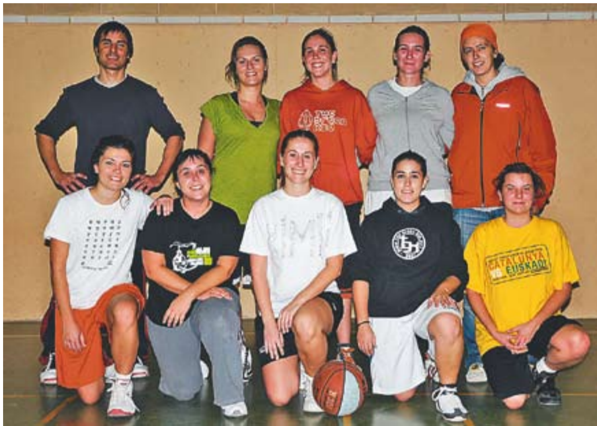
Les jugadores del Casal en un entrenament d'aquesta setmana al col·legi.

El Som-hi ja porta anys de trajectòria a la Lliga Balles. L'equip està format per 16 jugadores, un planter ampli que permet més marge de maniobra a totes les components. "No podem competir federades perquè moltes de nosaltres tenim compromisos i no ens podem permetre dedicar tres o quatre dies a la setmana al bàsquet. També és una manera d'alliberar-nos els caps de setmana", comenta Bas-