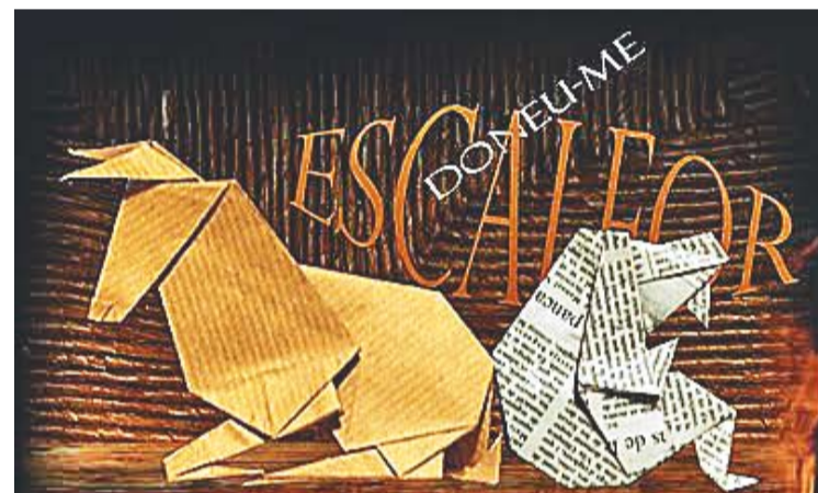
Pessebre il·lustratiu dels "Nous llenguatges per al pessebre".

És la tercera vegada que el Grup rep un premi cultural. "La Fundació Caixa Sabadell també havia valorat positivament el projecte Tallers d'art del Grup Pessebrista", explica Benavent, dedicat a la formació artística en pintura i modelatge. El lliurament del Premi tindrà lloc el 4 de novembre a les 19 hores a l'Espai Cultura Unnim, a Sabadell. +