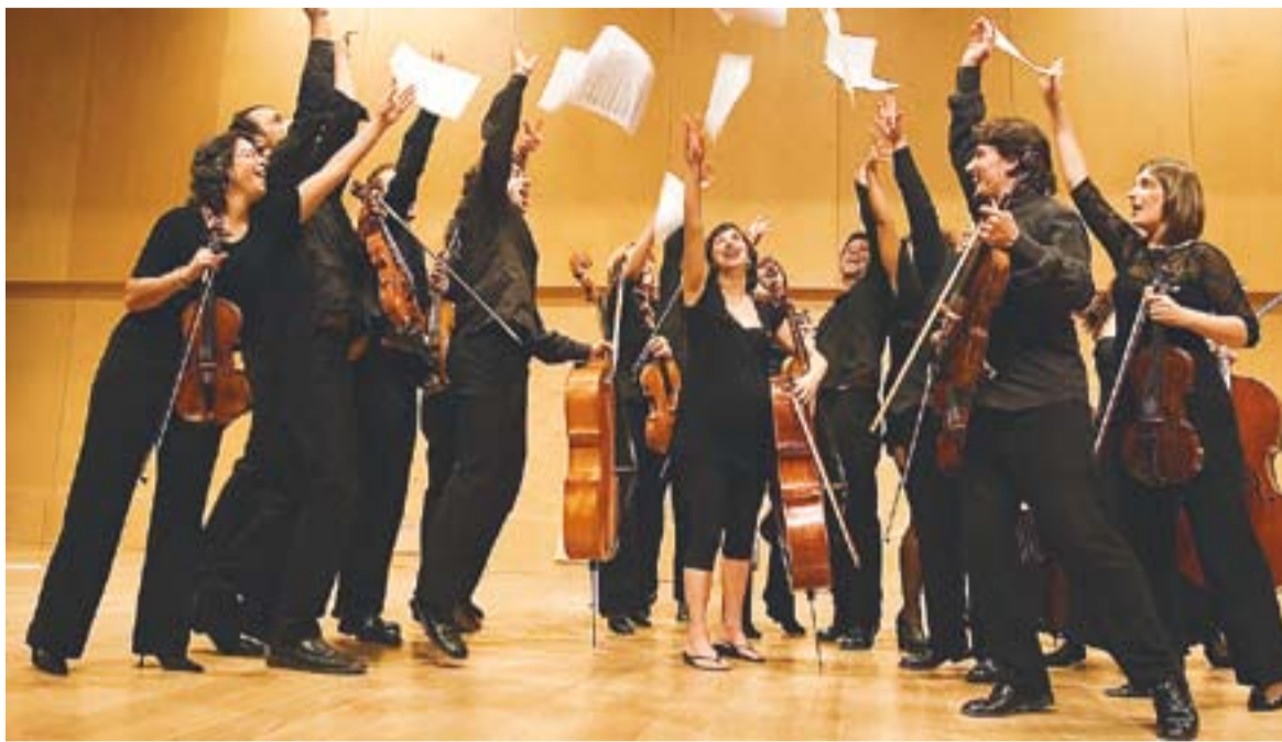
L'Orquestra de Cambra de Terrassa 48 presenta el repertori titulat 'Efecte Mozart'.