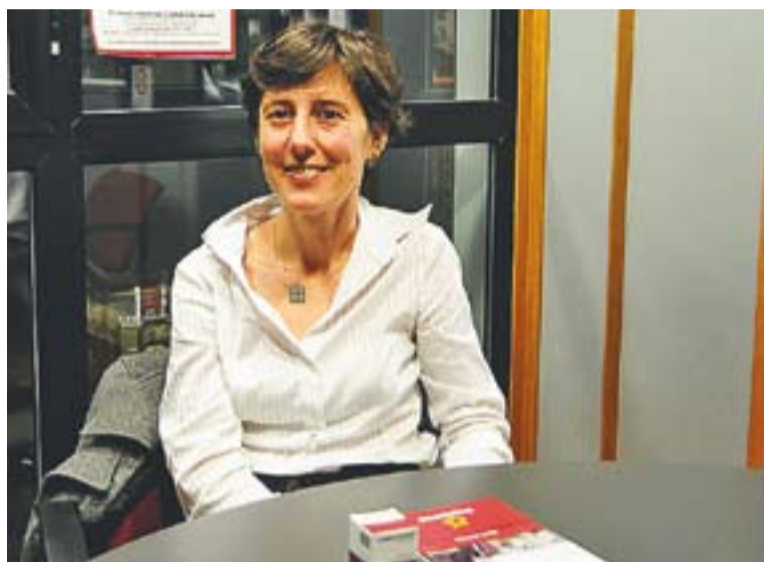
© Aina Hidalgo amb elements promocionals de Reagrupament. || J.G.

A Castellar, "fins i tot ens han ofert un local cèntric que