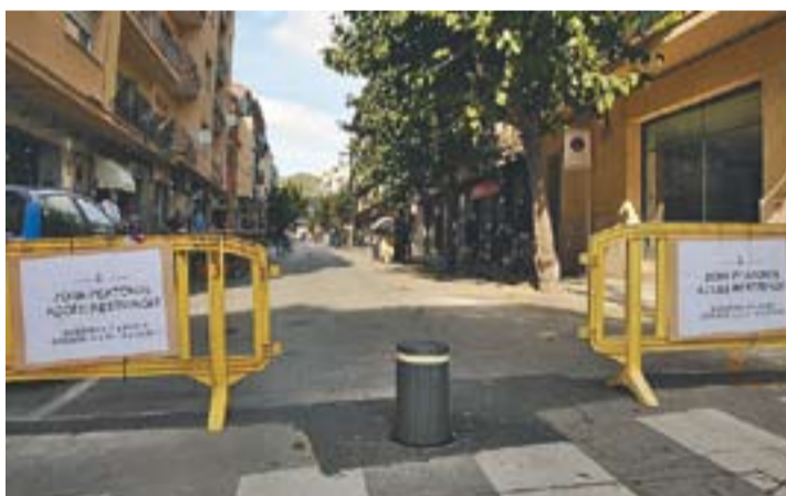
© El tall va començar una hora més tard per problemes amb la pilona || J.G.

⊕ Alguns vianants estan contents, altres es queixen de la falta d'aparcament