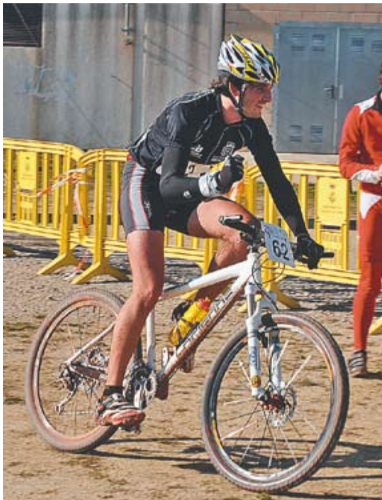
© És la segona edició de la cronoescalada al Puig de la Creu. || JOSEP GRAELLS

El Club Ciclista Castellar - Bike Tolrà donarà els resultats finals per categories però no hi haurà una classificació final, ja que