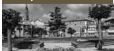
© Josep Maria Morcillo i López

l'Home d'Orce, un fragment de crani d'homínid a Orce (Andalusia) datat amb 1,3 milions d'anys d'antiguitat, segons la major part de la comunitat científica internacional. Josep Gibert, havia trobat les restes del primer poblador d'Europa Occidental al jaciment de Venta Micena. Posteriors troballes, com la de començaments d'aquell mateix any a Tarragona, on es va trobar l'esquelet d'una nena de fa 2.000 anys, van constituir la prova de què es tractava d'un humà i que era, per tant, el primer poblador d'Europa Occidental.