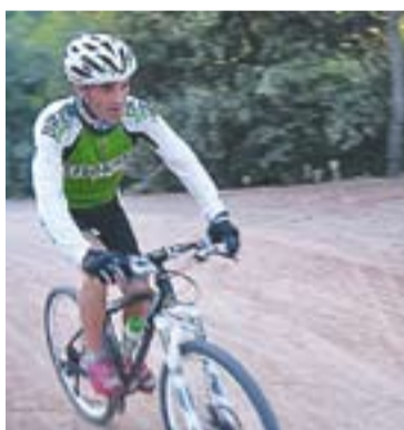
Club Ciclista Bike Tolrà