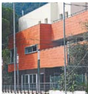
Casino del Racó