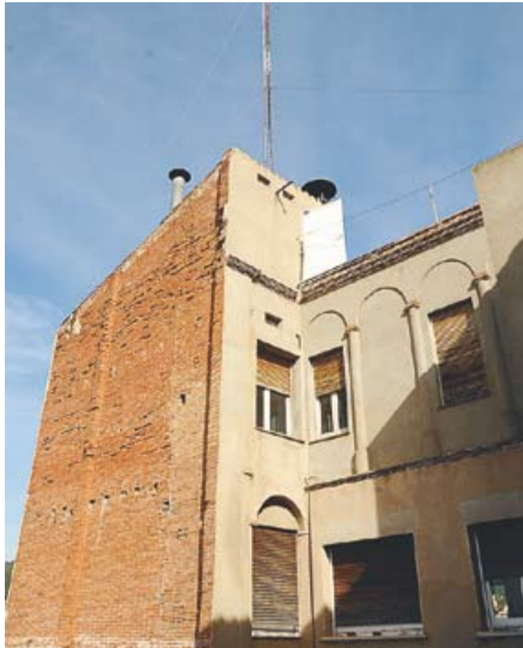
Façana posterior de l'antic Ajuntament, edifici en rehabilitació.

Les obres d'enderrocament, que obligaran també a desplaçar lleu-