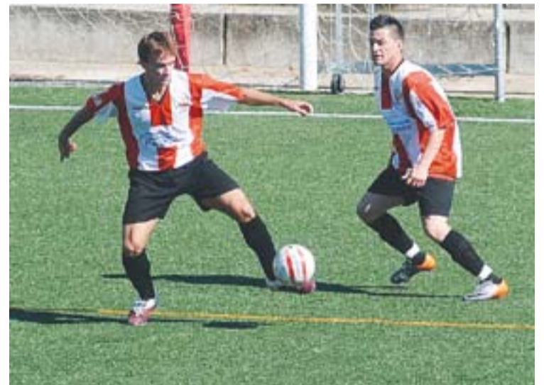
Enric Raya i William, golejadors al camp del Lliçà.

Amb 7 gols en els últims 2 partits, reben diumenge el Can Trias, el segon conjunt més golejat