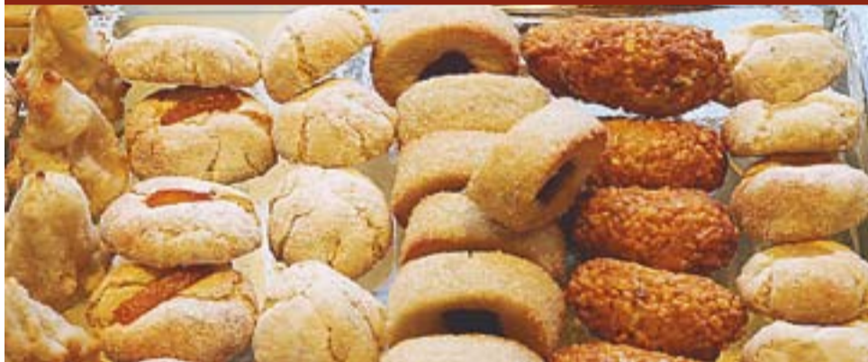
Assortiment de panellets de la Pastisseria Muntada.

Ens criden l'atenció quan els veiem a l'aparador. Els de pinyons tan rodons, els de café amb aquest punt negre, l'ambre del codony... Però a més de la bona presència, els panellets de pastisseria són considerats artesans, per tenir només com a ingredients el sucre, l'ametlla i l'ou.