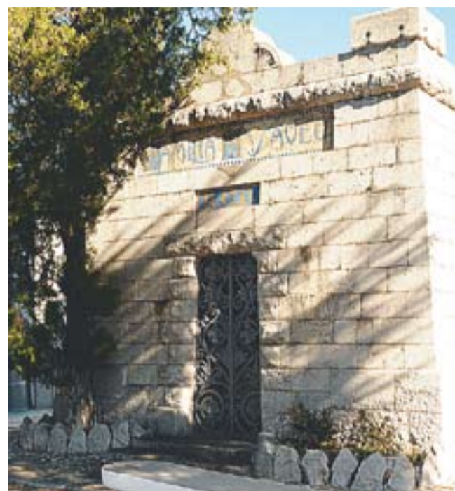
D'esquerra a dreta, el panteó de la família Comas, els nínxols de la família Rabassa i el panteó de la família Massaveu. || JOSEP GRAELLS