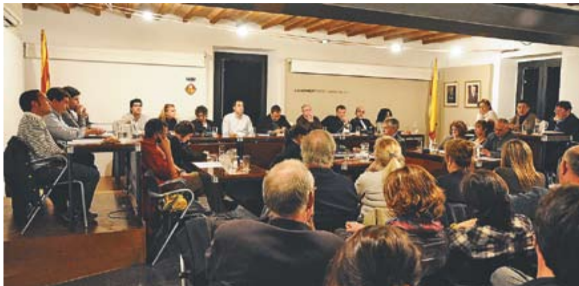
⊙ Assistens i regidors municipals en el ple celebrat dimarts passat, os es van retirar dos punts de l'ordre del dia. || J.G.

La sessió plenària de dimarts va destacar pel protagonisme que va adquirir l'apartat de suggeriments i preguntes. A banda dels punts habituals d'aprovació de l'acta de la sessió anterior i donar compte dels decrets de l'Alcaldia, només s'havien de debatre altres dos punts, però a la junta de portaveus van decidir retirar-los. La primera qüestió que es va retirar estava relacionada amb la subhasta d'una casa ubicada al carrer Canyelles, propietat de l'Ajuntament. Encara que el punt es va anul·lar, es va segregar un apartat d'aquest tema