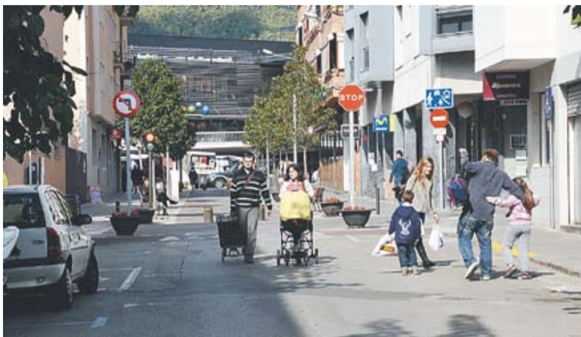
Dissabte al matí ja es podia veure vilatans passejant pel tram del carrer Sala Boadella tallat al trànsit.

⊕ L'Ajuntament valora positivament el primer cap de setmana de tall del carrer Sala Boadella