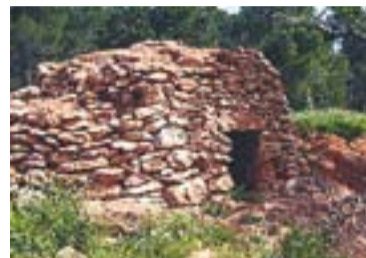
© A l'esquerra, part del grup que ha recuperat les barraques com Can Borrell o del Roure, a la dreta.

l'abandonament de bona part d'aquests terrenys “i que el bosc es tornés més salvatge” . La fil·loxera va arribar a Castellar l'any 1892 i, a partir d'aquell moment, els arrendataris van retornar les terres als propietaris. “Sabem que el Puig de la Creu, el Pla de la Bruguera i d'altres zones eren tot vinyes i oliveres. Hi havia 1.682 quarteres” , diu Roure. “La vida girava al voltant del camp, i gràcies al cultiu i el bestiar es podria viure” .