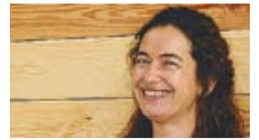
© María Sánchez Directora d'El Mirador