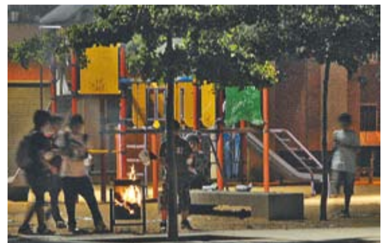
Uns joves prenen foc a una paperera de la plaça Europa.

Ⓣ Els 22 contenidors cremats suposaran a l'Ajuntament un cost de 22.000 €