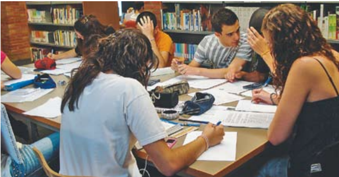
© Alumnes dels instituts Castellar i Puig de la Creu repassen els apunts un dies abans de les proves. || JOSEP GRAELLS