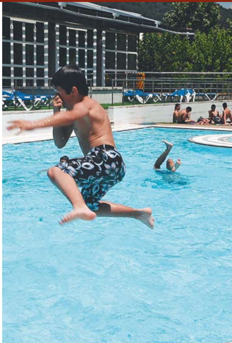
© Els més joves són els principals usuaris de la piscina durant els dies feiners. || JOSEP GRAELLS