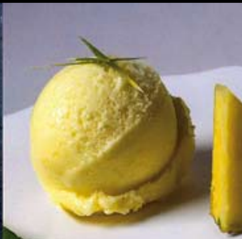
**Cremosos Sandro Desii