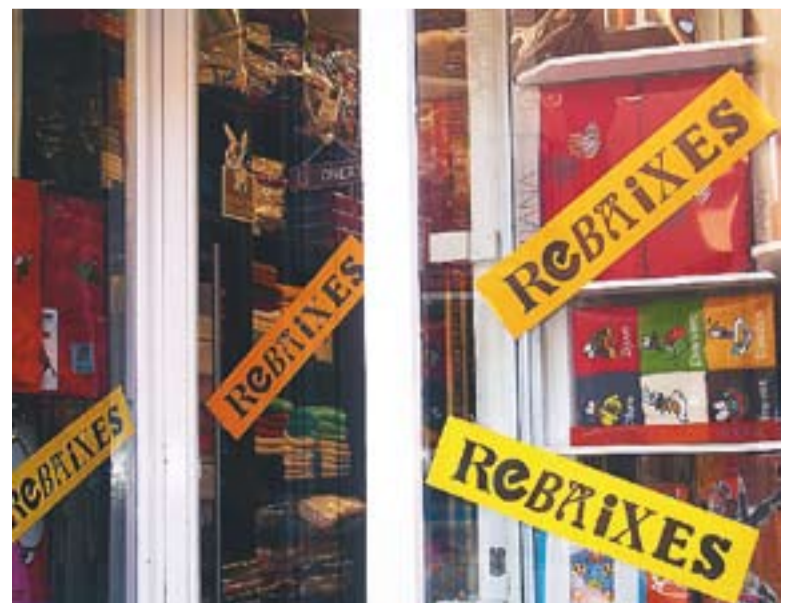
Un aparador de rebaixes a la passada campanya d'hivern.

Els comerços han d'acomplir una sèrie de requisits com etiquetar els productes amb el preu original i amb el preu en rebaixa. +