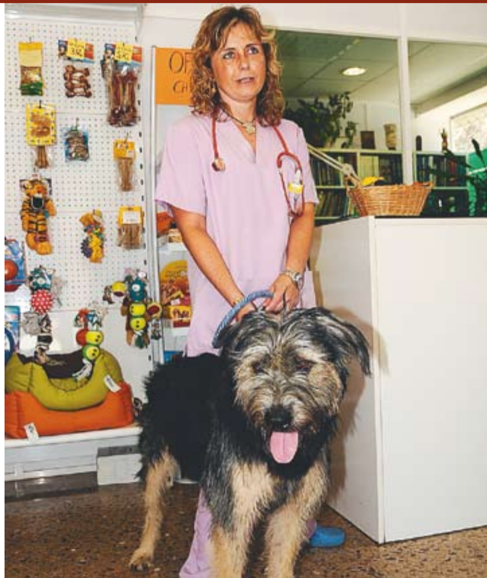
La responsable d'Esther Veterinària amb una mascota d'un client.

Si aneu a l'estranger amb el vostre gos, haureu de preparar amb molta antelació el viatge. Querol ha concretat que "al Regne Unit és obligatòria la vacuna de la ràbia. Fins i tot demanen una prova homologada per assegurar-se que el gos no té cap problema" . De la seva banda, Moix ha deixat clar que hi ha països on el focus de ràbia és perillós; De fet, "a l'Àfrica seria millor no anar amb l'animal" . Moix ha explicat que si els cadells els deixem a una residència "poden agafar qualsevol malaltia, perquè estan més desprotegits" , però tampoc és recomanable portar molta estona l'animal amb un transportí a l'avió. A més, moltes companyies us cobraran per quilos de gos, així que el bitllet de la vostra us pot sortir més car del que pensàveu. +