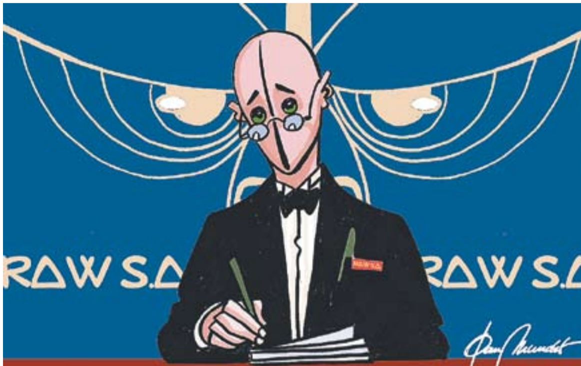
© Raw S.A. || JOAN MUNDET

podem reduir les situacions estressants ni evitar l'activació simpàtica, però sí que podem crear un activador del sistema parasimpàtic, una mena d'antídot: l'optimisme. La literatura científica ha demostrat que una ràtio de 5 pensaments positius per cada un de negatiu suposen una disminució dels efectes de l'estrès mentre que una ràtio inferior suposa un manteniment o empitjorament dels símptomes. Un altre element estudiat, motiu d'aquest article, és l'esport i l'activitat física, ja que s'ha demostrat que si es realitza una activitat que ens agrada de forma continuada, ràpida-