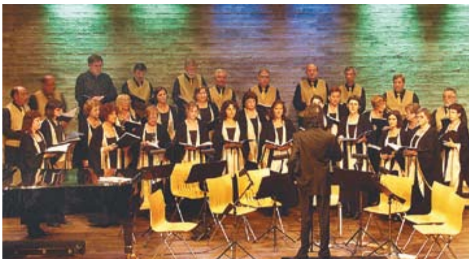
La Coral Xiribec durant un concert a Oslo. Avui celebra a Castellar els seus 20 anys.