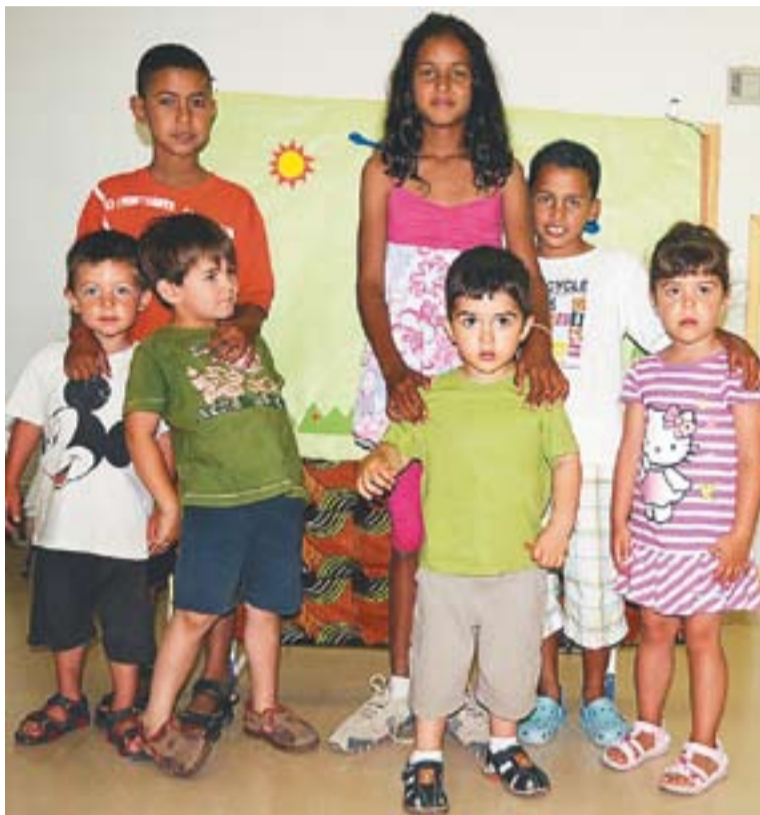
Tres nens sahrauís, que ja són a Castellar amb infants de la vila.

El dia 2 s'ha preparat una tómbola al pavelló de Sentmenat. "La intenció és recaptar fons, sensibilitzar la població i donar a conèixer l'associació i les seves activitats" , explica Olivares. La tómbola és oberta a tothom i con-