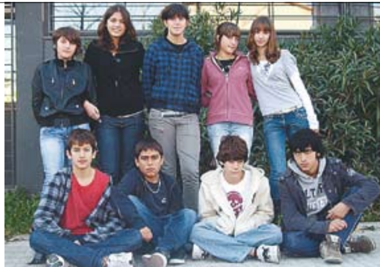
© Alumnes de l'Institut Puig de la Creu autors del 'Retaule del flautista'.

l'aprenentatge propi d'aquests mitjans. Segons expliquen des d'aquest centre d'ensenyament, és una adaptació cinematogràfica del Retaule del flautista d'en Jordi Teixidor, una farsa que parteix del conte clàssic del Flautista d'Hamelín , on una plaga de rates s'estén en un petit poble de Catalunya, Castellar del Vallès, i els vilatans exigeixen al seu alcalde que intervingui per resoldre-ho. Com un dels 12 seleccionats en el sector vídeo d'aquests guardons es pot veure a http://www.youtube.com/watch?v=jvpIUpryCI . +