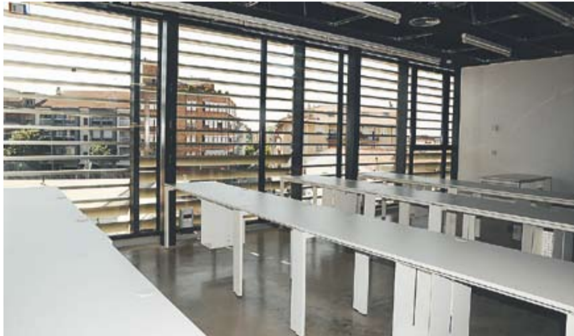
Una de les sales del Mirador Centre de Coneixement amb les vistes a la carretera de Sentmenat.

Convergència i Unió es va abstenir en aquesta proposta, malgrat afirmar que estan contents que es posi en marxa el servei i que s'acabi l'edifici. "Tenim discrepància en determinats