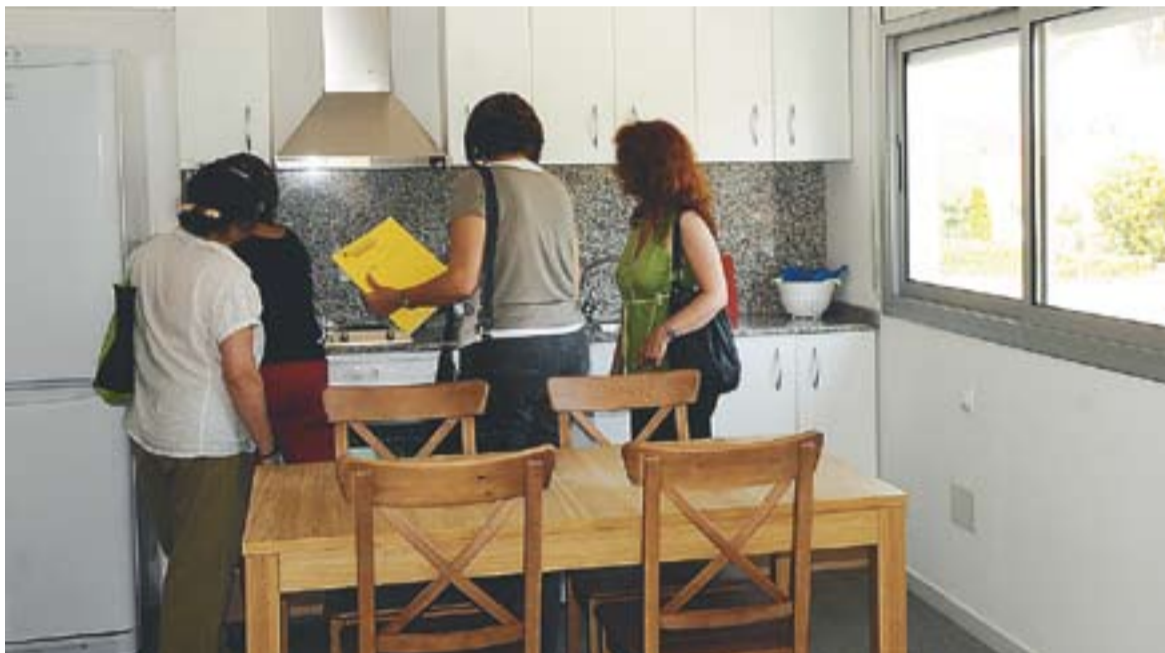
La cuina del pis de protecció oficial en règim de lloguer destinat a ADIPS que està ubicat al carrer Tarragona.

Quatre malalts mentals de les dues entitats compartiran dos pisos de protecció oficial ubicats al carrer Tarragona i Finlàndia