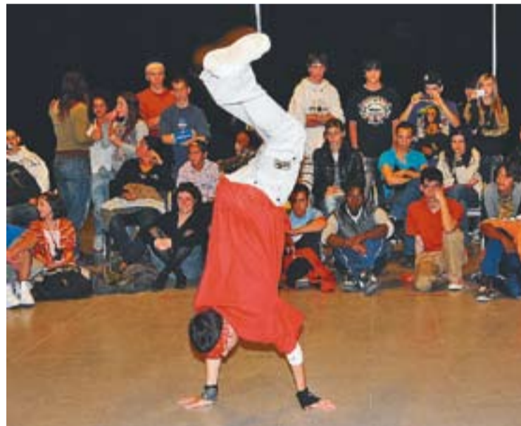
Moment d'una activitat de Breakdance a l'Espai Jove.

Per a realitzar les activitats es poden fer les inscripcions fins el mateix dia de l'activitat escollida. Per consultar més informació també es pot enviar un correu a espaijove@castellarvalles.cat . +