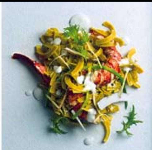
**Pasta Sandro Desii