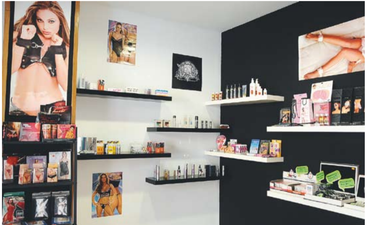
© Lauburo, situat al Passeig, 38, és un espai que concentra una botiga eròtica i un centre d'Estètica, l'únic sex shop de la vila || JOSEP GRAELLS

Respecte a les tendències de les castellarencs, Clara afirma que són molt semblants a les de la resta: "Sobretot compren produc-