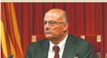
Lluís Maria Corominas, Vice-president segon del Parlament:

"És el moment de superar aquest marc legal i a través d'un referèndum decidir si el poble de Catalunya volem continuar vinculats a l'Estat espanyol o no."