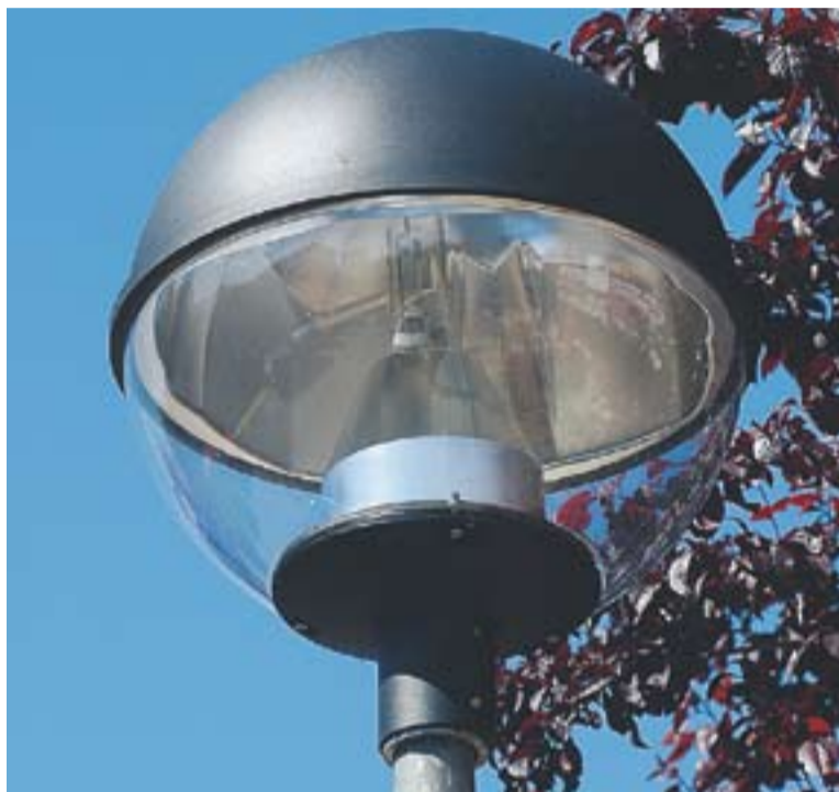
Fanal del carrer Josep Maria Valls.

MÉS QÜESTIONS ECONÒMIQUES || El ple va aprovar la desaparició d'una plaça d'auxiliari administrativa en l'àmbit de la gestió dels tributs. Una