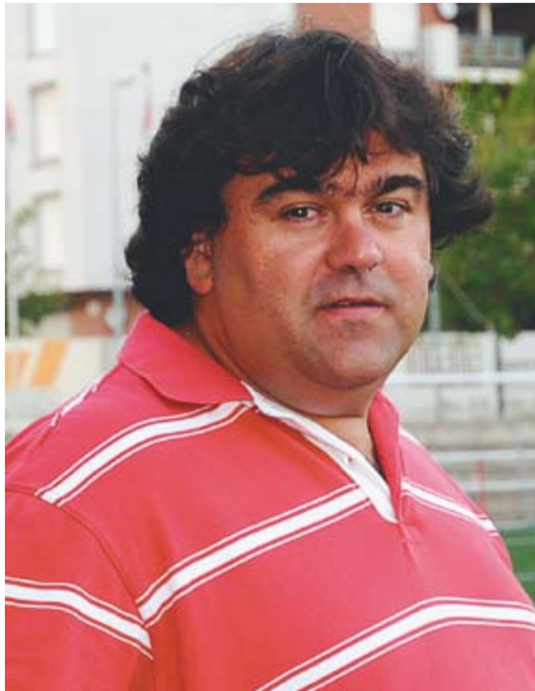
© Quico Díaz aquest dimecres al camp de futbol Pepín Valls. || JOSEP GRAELLS

Quant als objectius per a la propera temporada, Quico Díaz no dona pistes: "La qüestió és mun-