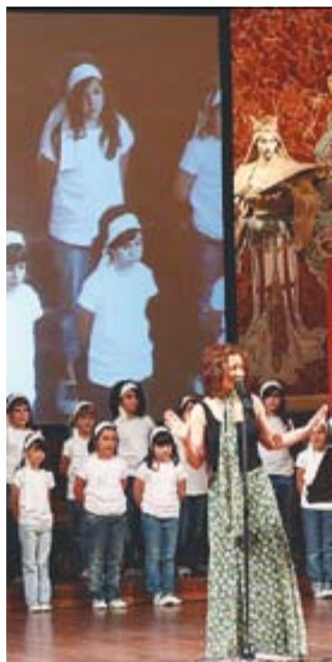
Moment del concert.

Aquest portal "substituirà la quota de pantalla que no tenim a la televisió pública", explica el líder de Macedònia. "És molt difícil aconseguir que els mitjans audiovisuals et segueixin a tot arreu". +