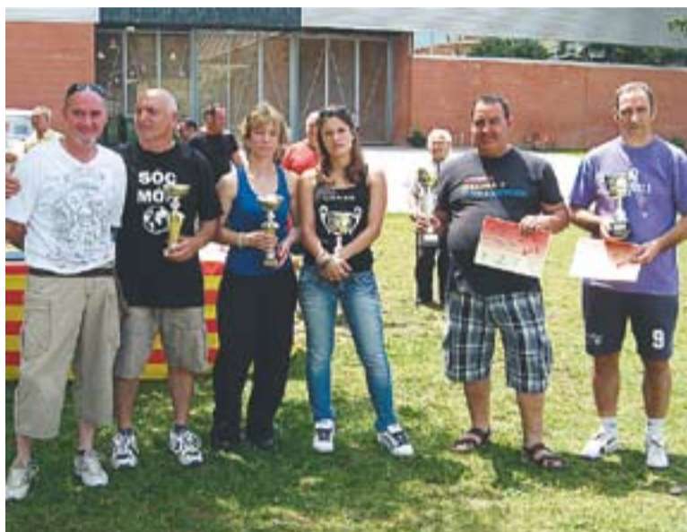
© Els guanyadors de la lliga social a l'entrega de premis. || CEDIDA

La lliga social de bitlles catalanes ha tingut una participació de 58 persones en el total de les vuit jornades disputades aquest primer any.