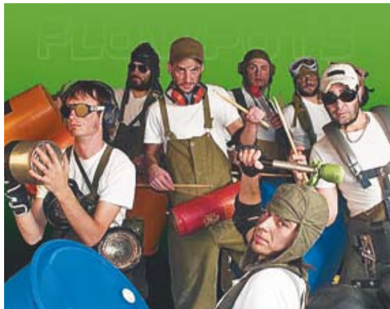
Els Flowpots actuaran a les 13 hores al Calissó Espai Plural.