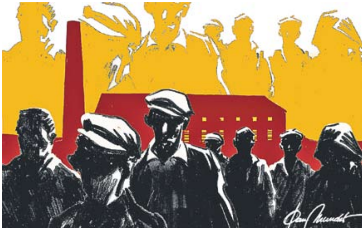
© Treballadors d'arreu. || JOAN MUNDET

externa, procedents de Getafe i de Reus, amb llurs famílies va suposar un notable trasbals per a la societat local i per a les autoritats del municipi davant la dificultat de procurar allotjament i recursos per a la manutenció d'aquestes persones nouvingudes. Tot i l'obligatorietat d'estatjar en