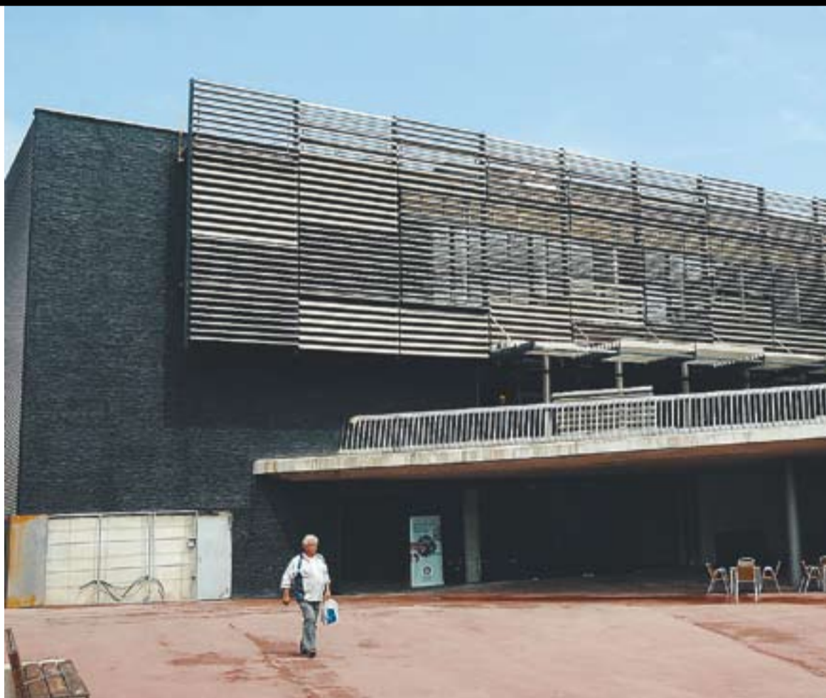
© El Mirador, al costat del Mercat Municipal. En aquests moments s'està instal·lant la part externa de la façana. || J. GRAELLS