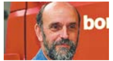
© Pepe Casajuana Cap del Parc de Bombers de Castellar