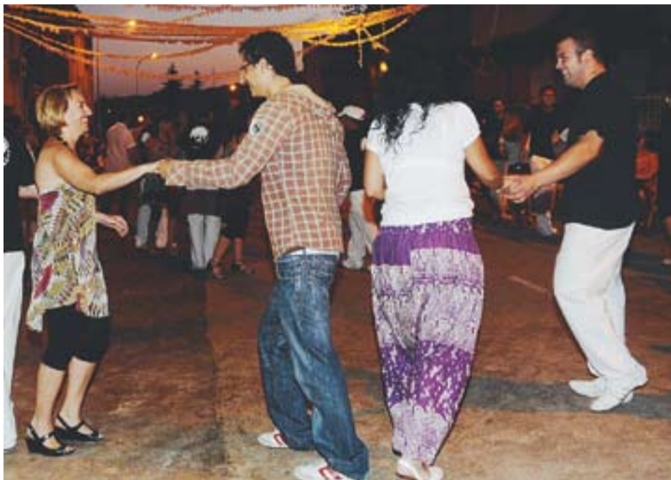
© La revetlla de Sant Joan és una de les festes més esperades de l'any. || ARXIU

A CAN CARNER || El primer dels actes de Can Carner serà la VII edició de les 12 hores de futbol. Dimecres 23, a les 24 hores, se celebrarà la Gran Revetlla amb l'orquestra Clan Tijuana. Dijous 24, a partir de les 17 hores, s'iniciarà un concurs de pastissos, un altre de dibuix infantil i el ball de gitanes. A les 22 hores es podrà veure una exhibició de ball i roda cubana amb el grup de ball Lluna Plena. Divendres 25, a les 22 hores, s'ha preparat un correfocs amb els diables de Castellar. A les 23 h, sessió de cinema a la fresca a la plaça de Sant Joan. Dissabte, a partir de les 9 h, s'inicia una trobada de xapes de cava, un campionat de petanca, futbol infantil i vermut popular. A la tarda, el grup d'animació Bufanúvols amenitzarà la vetllada. També es farà una acampada, que finalitzarà amb ball popular a càrrec del duet Fama. Diumenge finalitza la Festa de Can Carner. A partir de les 10 hores es faran les següents activitats: bitlles catalanes, xocolatada popular, concurs infantil de fang, festa de l'es-