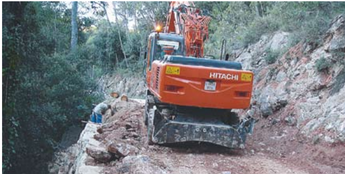
© Una de les maneres de prevenir del foc ha estat arranjar part dels camins forestals del municipi. || OFICINA 21

CAMINS FORESTALS || Una de les tasques lligades a la prevenció és l'arranjament dels camins forestals, una millora que aquest any s'ha fet grà-