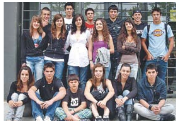
© Alumnes de l'Institut Puig de la Creu, autors dels dos curts. || CEDIDA

El segon curt es titula Pensa en qui confies . També té una durada de 10 minuts i explica la història de diversos alumnes d'un grup de segon d'ESO que es queden tancats al seu intitut. S'organitzen per trobar una sortida i, misteriosament, van desapareixent l'un darrere l'altre. La protagonitzen 15 alumnes que han participat en el crèdit variable de vídeo que el centre ofereix als alumnes de segon cada trimestre escolar. +