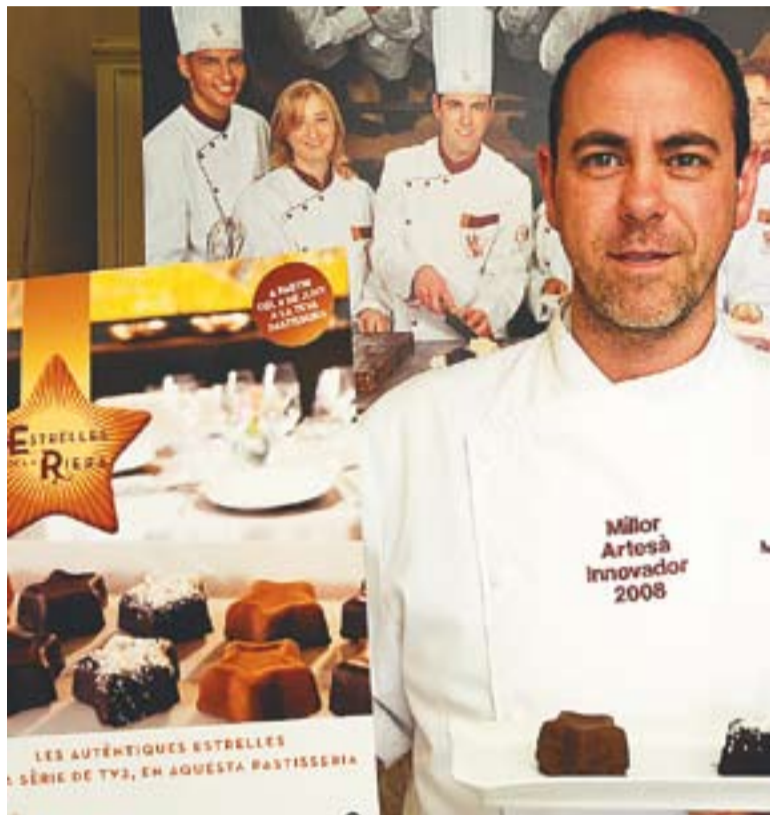
Joan Muntada mostrant les estrelletes de Sant Climent de la sèrie 'La Riera'.

Les populars estrelletes de Sant Climent de la sèrie de TV3 'La Riera' ja es poden trobar a la pastisseria Muntada de Castellar