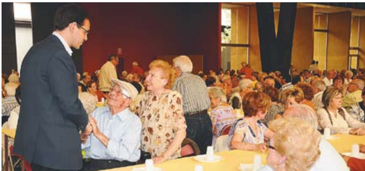
L'alcalde saludant algunes persones presents a la festa de fi de curs.