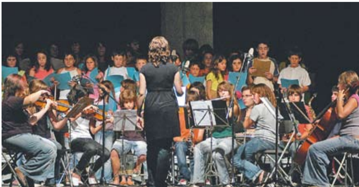
© Concert de fi de curs de l'escola municipal de música Torre Balada. || ARXIU

Els avis i àvies de la coral del Casal Catalunya celebren el fi de curs demà dissabte, a partir de les 17 hores.