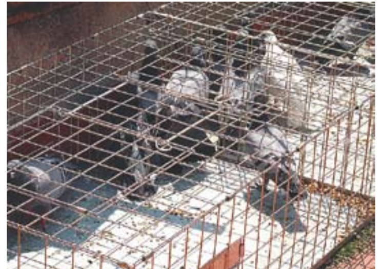
© A l'esquerra, un colom covant al campanar. A la dreta, coloms capturats en dos dies durant la campanya de control a Castellar. || OFICINA 21

L'any passat es va fer un cens de coloms i a la vila es comptaven uns 415 exemplars. A la campanya feta entre els mesos de maig i setembre es van capturar 306 coloms. Però si la captura és important per controlar la població, igual o més important és no donar de menjar a les aus. Segons l'estudi re-