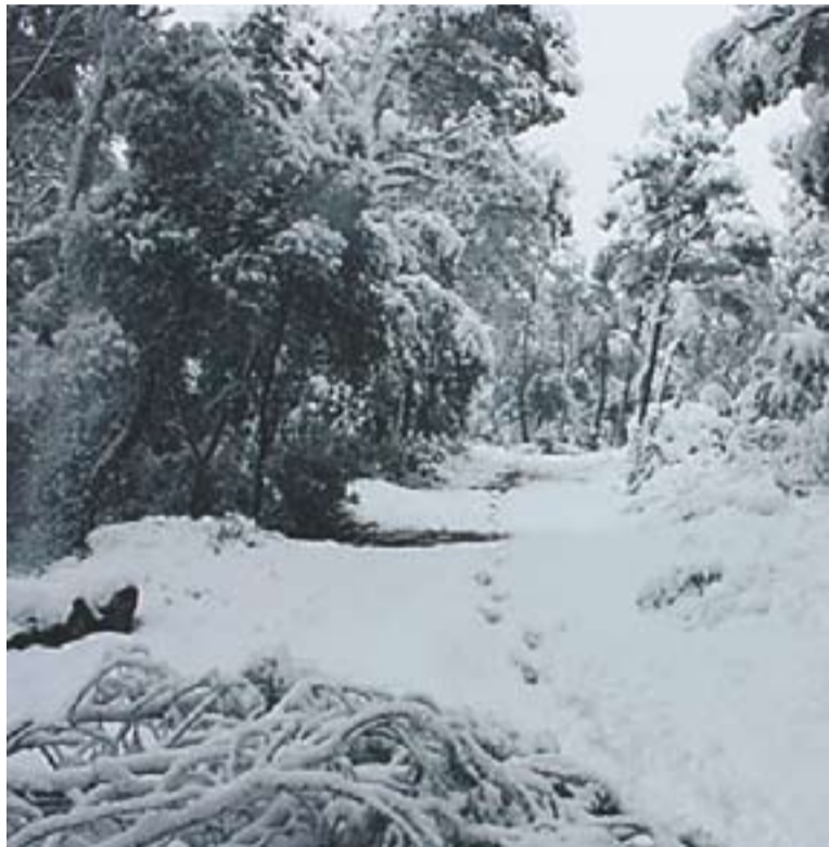
El camí del Puig de la Creu el 9 de març, el dia després de la nevada.

Les tasques es faran a llocs on es van produir caigudes d'arbres, principalment els camins transitats. La feina que es farà consistirà, en concret, en separar els trons i trossejar les capçades