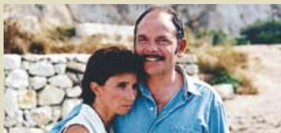
© Marie-Jo y sus dos amores