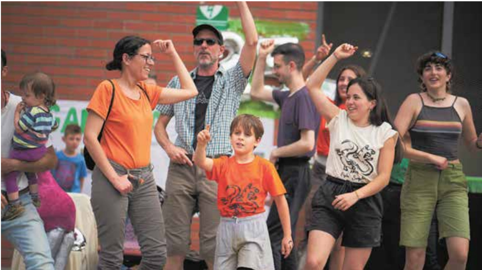
Infants, monitors, exmonitors i famílies van participar en diferents jocs durant la celebració a la plaça de la Fàbrica Nova.