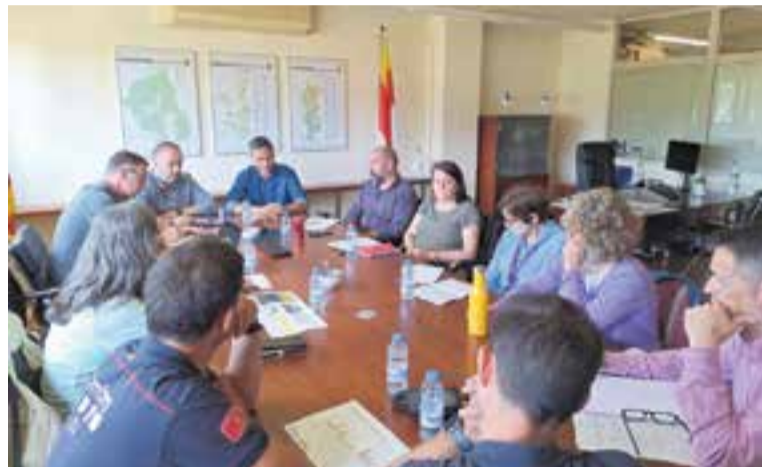
Reunió del Centre de Coordinació Municipal la setmana passada. || AJ. CASTELLAR

També es va posar en comú la nova mesura del Departament d'Interior de crear un nou nivell del Pla d'Alfa del Cos d'Agents Rurals, que determina el perill d'incendi diari. Així, quan s'activi el nivell 4 per perill ex-