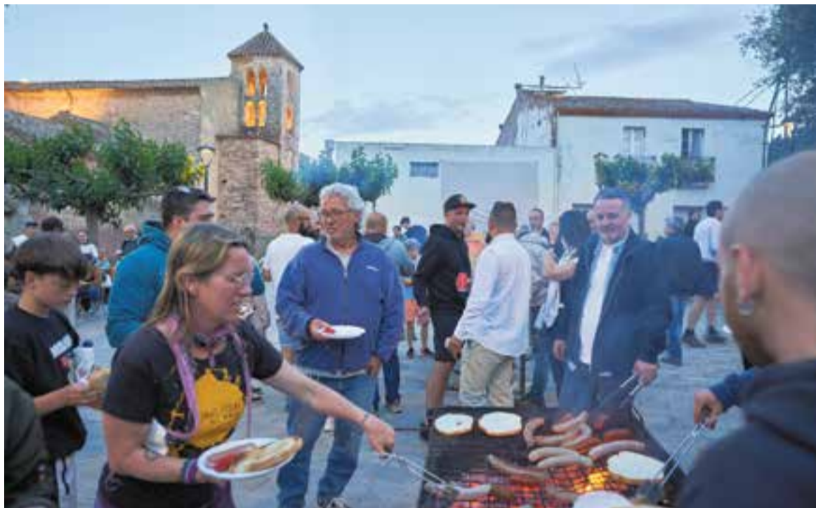
Unes 200 persones es van aplegar a la plaça del Doctor Puig per gaudir de la botifarrada popular. || Q. PASCUAL

Dissabte es van fer activitats a la plaça del Doctor Puig i diumenge al matí es va cloure amb la tradicional benedicció del pa