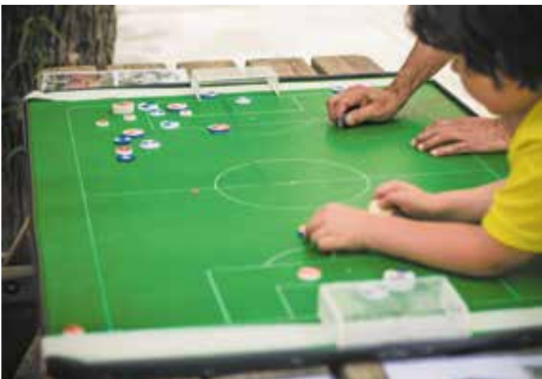
Salavert va ensenyar a jugar a futbol de botons dissabte a la Ludoteca. || M. PÉREZ

La Ludoteca Les 3 Moreres va celebrar el Dia Internacional del Joc amb una demostració