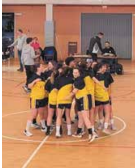
El CB Castellar no va poder amb el Xamba.

A Vilafranca, el primer quart (16-8) va marcar el desenvolupament del partit, en què tot i mantenir-se a prop en els parcials, no van poder capgirar en cap moment, amb un 35-25 al descans i 52-40 al terme del tercer període. L'últim quart va ser per a les castellarenques, amb un 10-15 insuficient, que va retallar la diferència final, per acabar només set punts per sota. † || A. SAN ANDRÉS