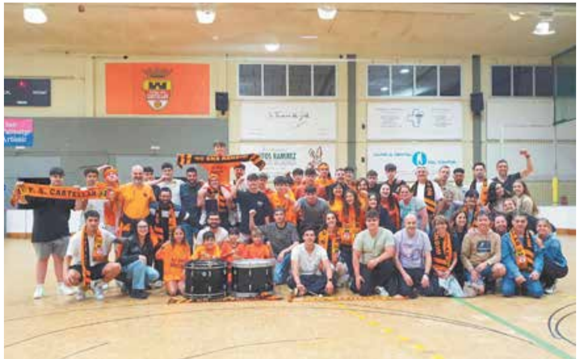
La foto commemorativa de la salvació, després d'arribar al Joaquim Blume des de Barcelona. L'afició, com sempre, de 10.

Pel que fa a la Lliga, l'FS Ripolllet, favorit principal des de l'inici per a l'ascens, ha estat el campió de Lliga i serà equip de Segona B, seguit per l'Arenys de Munt, que jugarà a la promoció. A la part baixa, el CN Caldes, el Mataró B i el Gràcia perden la categoria, mentre que Sant Joan de Vilassar disputarà la promoció de descens, si finalment cal. +