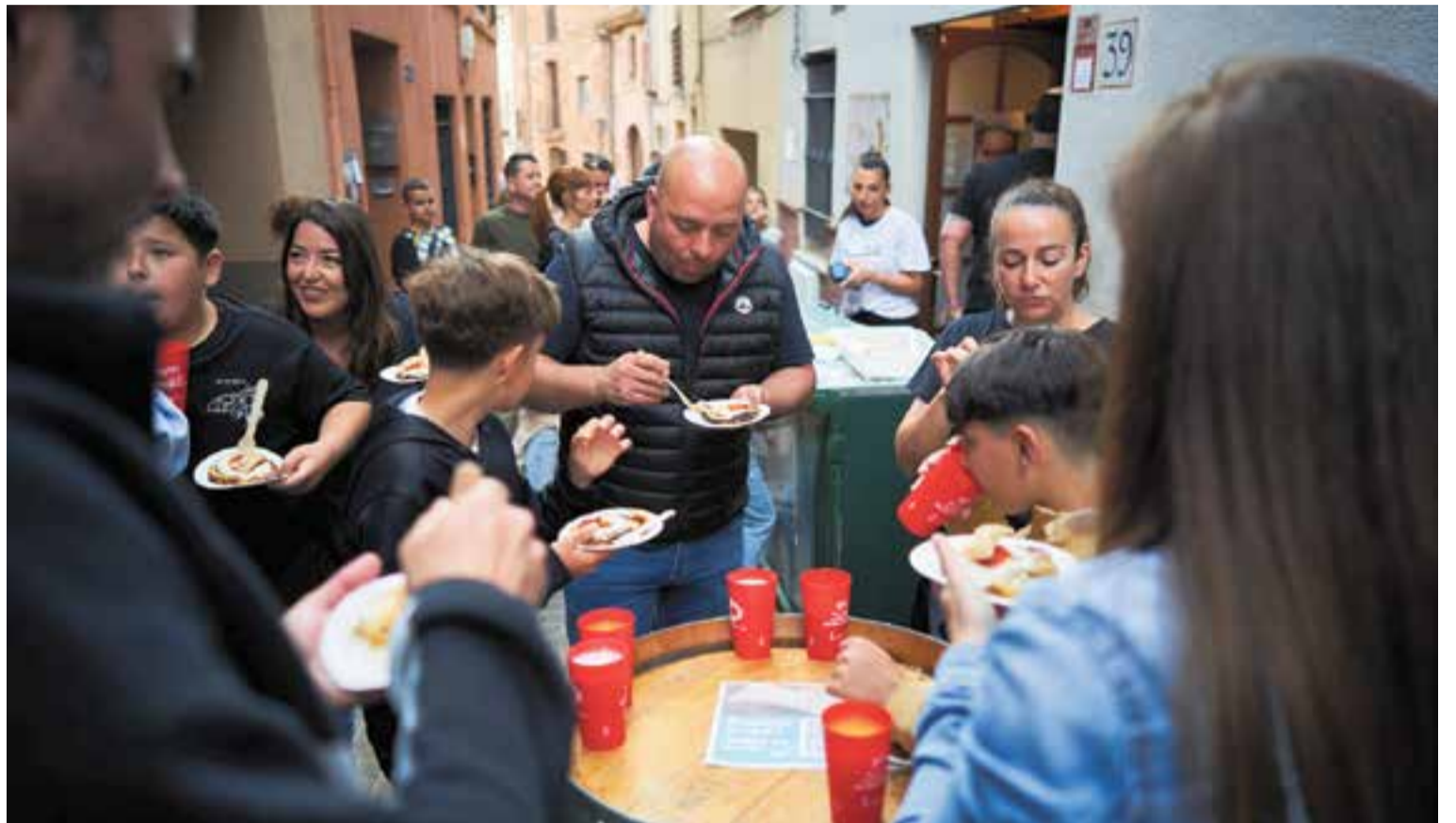
El públic a l'espai de degustació de la truita que va muntar La Taverna del Gall i la Gallina a l'exterior de l'establiment al carrer del Centre.