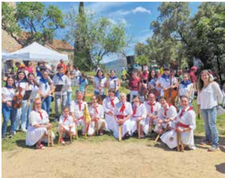
A Castellar Vell, el Ball de Bastons de Castellar i els músics d'Acció Musical Castellar.