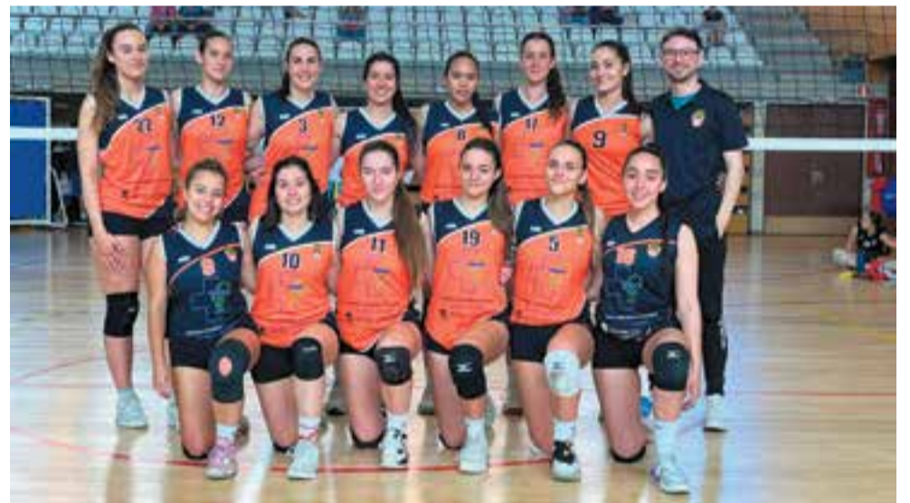
El sènior femení es manté un any més a Segona Catalana, després d'un final de Lliga d'infant.