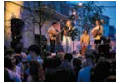
Lòxias a la festa de l'any passat.

A les 17 hores s'iniciarà una cercavila amb els Gegants i de l'ETC, el Ball de Bastons, el Ball de Gitanes i els Cagpirats de Castellar, que sortirà del carrer Major, seguirà pel General Boadella, Sant Llorenç, Maria Escal-