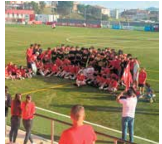
L'equip celebrant l'ascens sobre la gespa a Rubí.