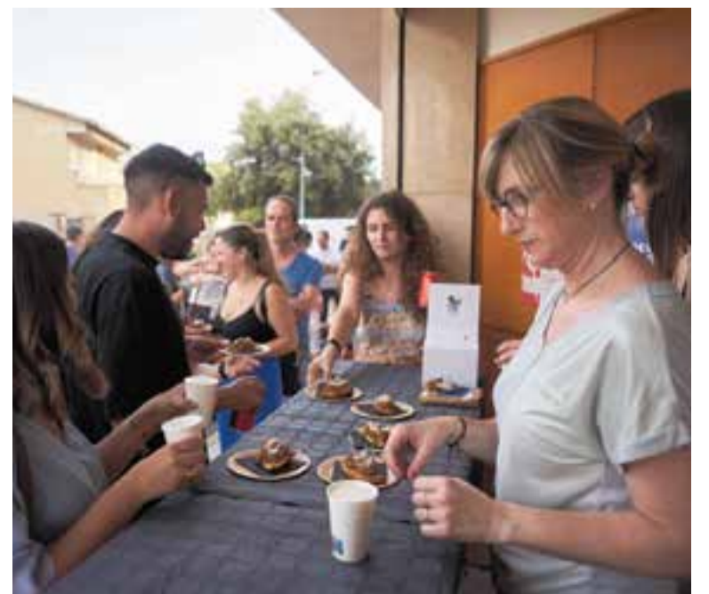
Una imatge del CorreTapa de l'any passat.

El Premi Popular resultarà de la mitjana de tots els vots emesos pels clients que tastin les tapes, a través de les butlletes dipositades a les urnes. El CorreTapa 2024 celebrarà una festa de cloenda un cop finalitzada l'edició, el dimecres 19 de juny, a les 19 hores, a la terrassa d'El Mirador. ➔