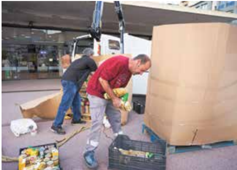
Operaris municipals carregant el material recaptat en un dels súpers.

Càritas Castellar ha recaptat farina, llegums cuits, pasta, sucre i arròs