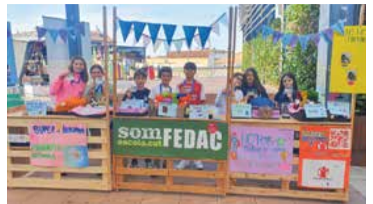
Els diversos alumnes que van participar en la venda al mercat ambulant.

Dissabte, el projecte va acabar amb una jornada de venda al mercat ambulant, on els nens i nenes van tenir l'oportunitat de posar en pràctica tot el que han après al llarg del curs. Des de la concepció de les idees fins a la fabricació dels productes, passant per la gestió de la cooperativa i la promoció de la venda, els alumnes han demostrat gran habilitat i compromís. Entre els productes venuts hi havia manualitats, decoracions fetes a mà, productes reciclats i altres creacions originals elaborades pels mateixos estudiants. Les famílies, amics i veïns del poble han mostrat un gran suport i han contribuït generosament a la causa. || REDACCIÓ