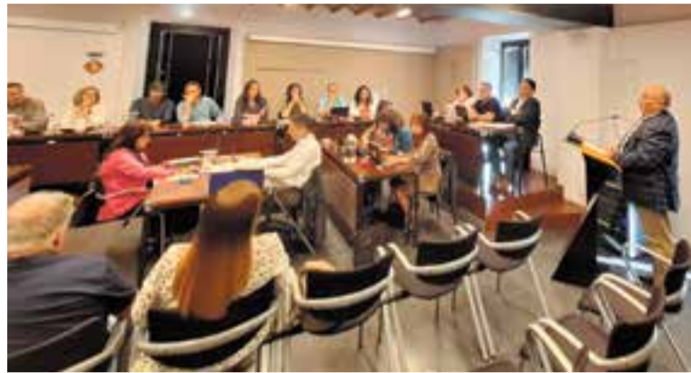
El president de l'Agrupació Sardanista Amics de Castellar al ple.

L'altra gran qüestió a dirimir en el ple de maig va aparèixer en