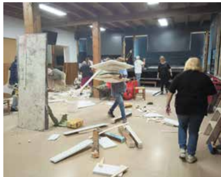
El Grup Pessebrista el dia de l'enderroc de diorames, dissabte passat.

Diumenge, la nova temporada es va obrir amb un bon arròs, també cuinat al local per ells mateixos, hi van assistir 25 dels pessebristes. + || M. A.