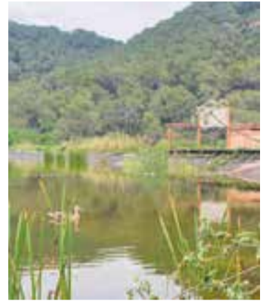
Zona del Viver Tres Turons.

Enguany hi haurà participació castellanenca, la del Tres Turons, un viver dedicat a la producció de plantes autòctones que es podrà visitar. També es podrà visitar l'obrador i fer un petit tast a l'explotació de la Formatgeria La Fradera (Vacarisses). Als restaurants La Taverna del Ciri (Terrassa), al Restaurant Capiqua (Cerdanyola del Vallès), Cal Taïet Restaurant (Ullastrell) i a Cal Miguelon (Vacarisses) es podran degustar plats elaborats