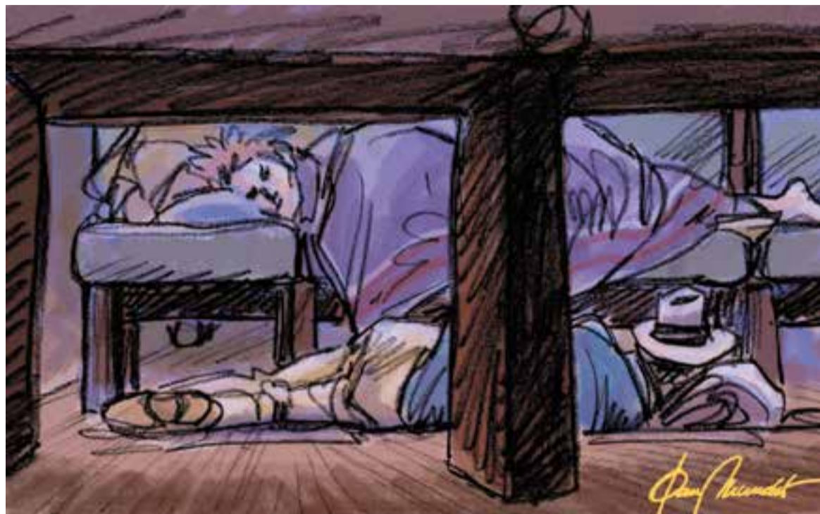
© Abans viatgers o turistes, ara clients o consumidors. || JOAN MUNDET

“El trajecte d'anada es fa de nit, i té una durada aproximada de nou hores”