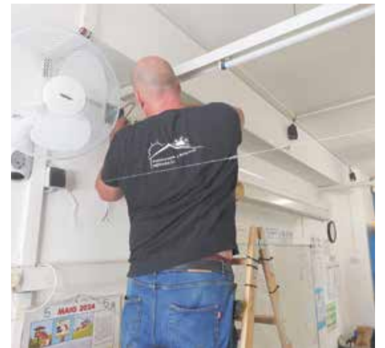
Instal·lació de ventiladors a les aules del Joan Blanquer.

La iniciativa s'emmarca dins el pla municipal que el consistori està duent a terme als equipaments educatius per fer front al canvi climàtic i garantir el confort d'alumnes i professorat. Aquest pla també inclou la generació d'espais d'ombra als patis de les escoles. Amb aquesta actuació la major part d'aules podran disposar d'un o dos ventiladors de paret. El conjunt de l'actuació està valorat en uns 15.000 euros. ➔ || REDACCIÓ