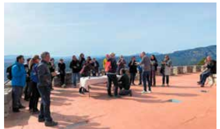
Moment del tast de cava al terrat de l'ermita del Puig de la Creu.