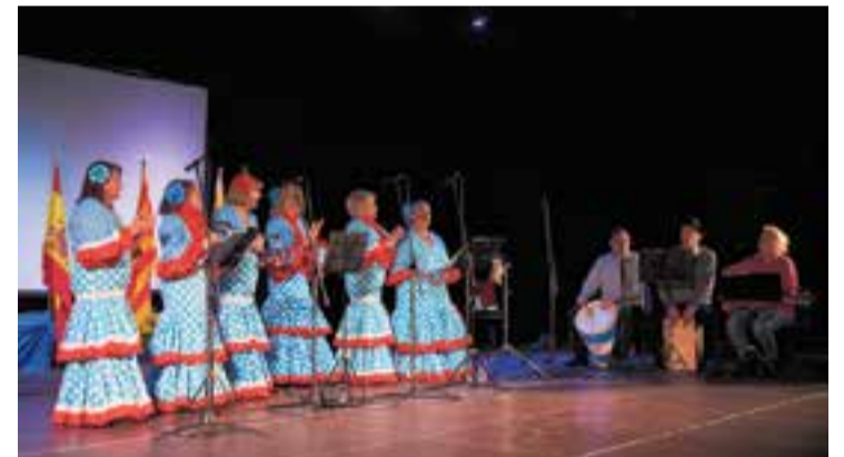
Un moment de la celebració de l'any passat, amb el Coro Aires Rocieros.