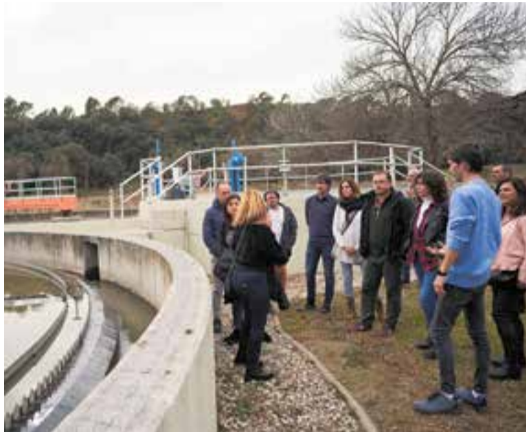
Visita de membres dels grups municipals a l'estació depuradora de Castellar.