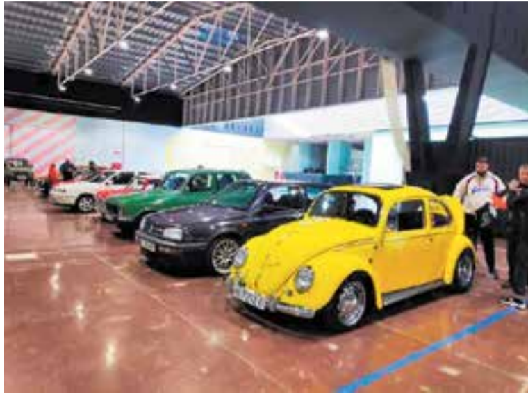
Una mostra de cotxes antics organitzada a l'Espai Tolrà fa uns anys.