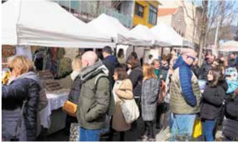
Una imatge de la fira Fora Estocs de l'any passat.

Els comerciants de Castellar celebren una nova edició del Fora Estocs