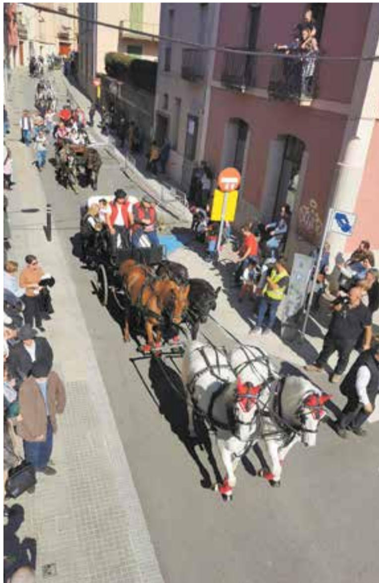
Passada de Sant Antoni, a l'altura del carrer Major, l'any 2022.

Als Tres Tombs de la vila col·laboren diversos comerços i associacions que, un any més, se sumen a fer possible aquesta tradició. ✦