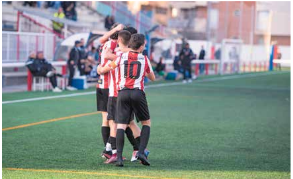
El Joan Cortiella s'ha convertit en un fortí, on només han volat cinc punts des que va començar Lliga. || A. SAN ANDRÉS

Després d'un mes seguit jugant a casa, en què s'han sumat tres victòries contra el Sant Cugat, l'Alguaire i l'Artesa i un empat contra el Turó de la Peira, l'equip enceta dues jornades fora, i aquesta setmana viatja a Badalona per mesurar forces amb l'Unificació de Llefia (diumenge, 12.00 h) i el Joanenc (2 de març, 16.00 h). Dos camps poc assequibles, amb dos conjunts que a hores d'ara mantenen una lluita aferrissada per no perdre la categoria. +