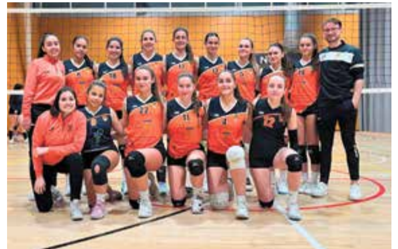
L'equip femení arrenca amb força la segona fase, en què ha d'evitar el descens. || CEDIDA

Aquesta és la cinquena jornada consecutiva amb derrota per als de Martínez i la novena sense sumar una victòria, cosa que els deixa en 15 i penúltima posició amb un triple empat a 16 punts amb el Prosperitat i el Mataró B, els altres equips en zona de descens. + || A. S. A.