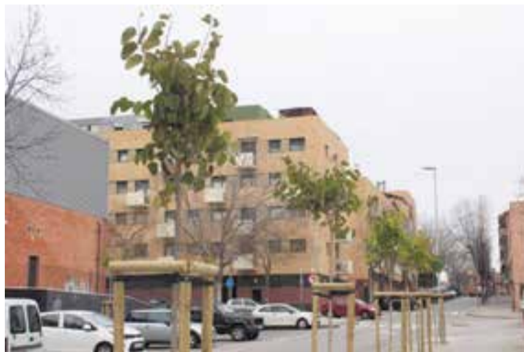
Reposició d'arbrat al carrer Suïssa, en una imatge d'aquest dimecres.

Així, tenint en compte les previsions climàtiques, els nous arbres formen part d'espècies més adaptades a la calor i més resistents a la sequera, com ara l'auró argentat, l'arbre d'orquídies, l'auró tridentat, l'arbre de ferro o la prunera de fulla vermella, entre d'altres, que es regaran amb aigua regenerada. En total, seran 78 els arbres que es plantaran als carrers d'Alemanya, del Doctor Josep Portabella, d'Espanya, del Forn del Raig, de la Gran Bretanya, d'Osona, de Portugal, de Puigvert, de Sant Miquel,