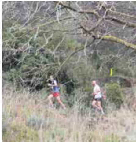
La Corriols 2024 ja està en marxa.

Una de les curses de muntanya del Vallès per antonomàsia és la Corriols del Vallès, que aquest 2024 celebrarà la 10a edició amb un total de quatre recorreguts diferents.