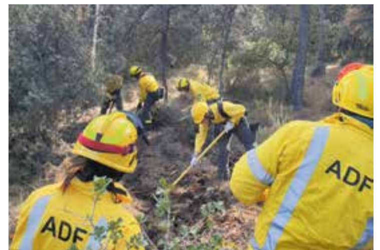
ADF de Castellar en plena pràctica al bosc. || ADF CASTELLAR