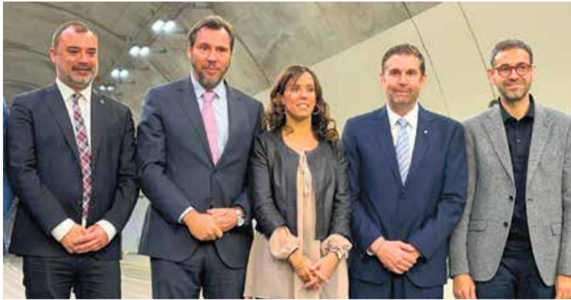
El ministre Puente amb els alcaldes de Terrassa i Castellar, i l'alcalde de Sabadell a la inauguració del tram de la B-40.