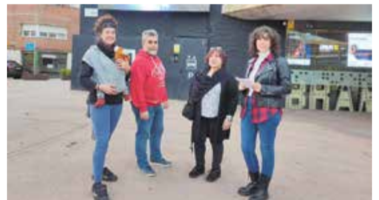
Els quatre regidors actuals d'ERC durant la roda de premsa a la pl. del Mercat.