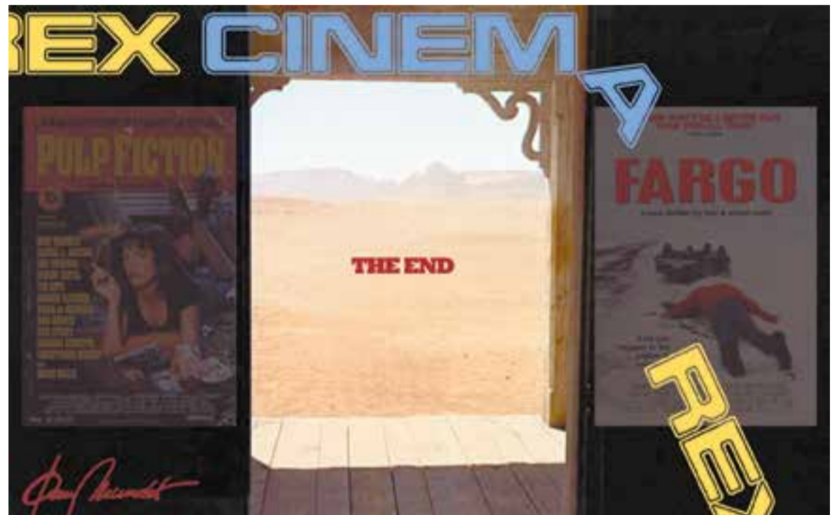
© Cinema Rex. | JOAN MUNDET

"Vull creure que el cine en pantalla gran, a les fosques i en silenci, mai morirà"