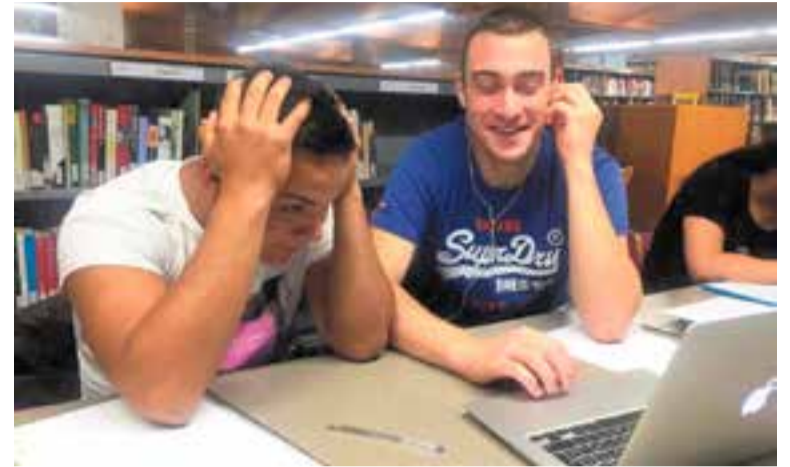
Dos joves repassant els apunts per a les PAU a la biblioteca Antoni Tort.