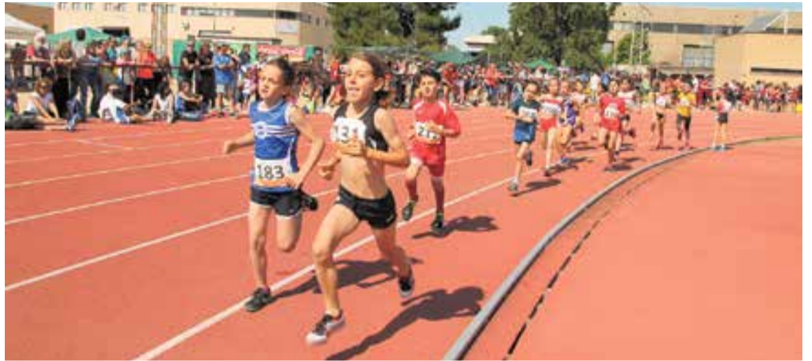
Moment d'una de les proves de la jornada disputada a les pistes de Colobriers.

El dissabte 8 de juny, les pistes d'atletisme de Colobriers van ser la seu de la jornada prèvia a les finals dels campionats de Catalunya d'atletisme en sub-10, s-12 i sub-14, organitzades pel Club Atlètic Castellar. La jornada va tenir una participació de més de 1.500 inscrits, pertanyents als 80 clubs participants. 13 atletes del CAC van aconseguir la classificació per la fase final que es disputarà a Lleida.