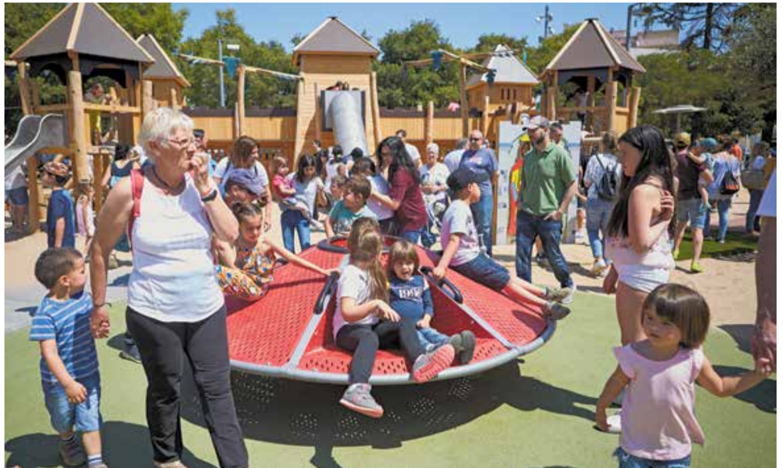
A la inauguració, que va tenir lloc dissabte passat, centenars d'infants van inundar el parc infantil.

La nova zona infantil de l'Espai Tolrà, de temàtica medieval, reproduceix la llegenda del drac de Sant Llorenç del Munt. Explicada per un panell informatiu situat a un dels laterals del parc, la història entre el comte de Barcelona Guifré el Pilós i la Brívia, un monstre que devorava tot allò que es trobava al seu pas, podria formar part d'una seqüela de Joc de Trons . Seguint l'analogia, diversos nens volen a lloms del drac, d'altres