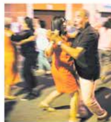
AV de Can Carner

+ INFO: http://arxiuhistoriacastellarvalles.blogspot.com/