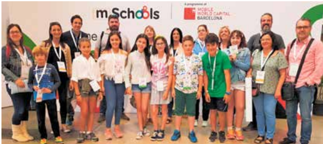
Alumnes i familiars d'El Sol i la Lluna durant els mSchool Awards.