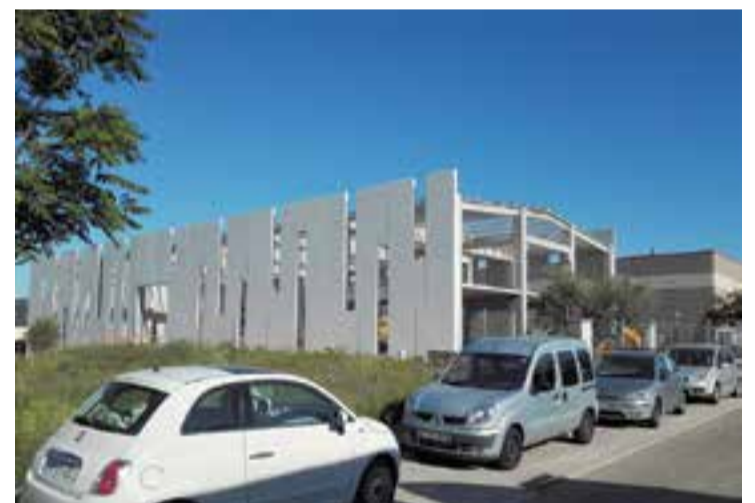
La nau que s'està reconstruint al carrer Conca de Barberà. || J.R.

A finals de juliol de 2017, el foc va calcinar els prop de 1.200 m 2 de la nau que ocupava l'empresa Dispopak, que distribueix productes per a l'envasat d'aliments i monoús per a l'hosteleria, catering i fast-food. Fins al punt calent es van desplaçar una vintena de dotacions de Bombers de la Generalitat que, després de controlar i extingir el foc, van mantenir algun dels efectius de guàrdia durant les setmanes posteriors per vigilar que no revifés cap brasa. La nau, una estructura de formigó d'uns 1.000 m 2 i amb un soterrani de 500 m 2 , es va veure totalment afectada pel foc, i diverses parets van caure la mateixa tarda de l'incendi. + || J. RIUS