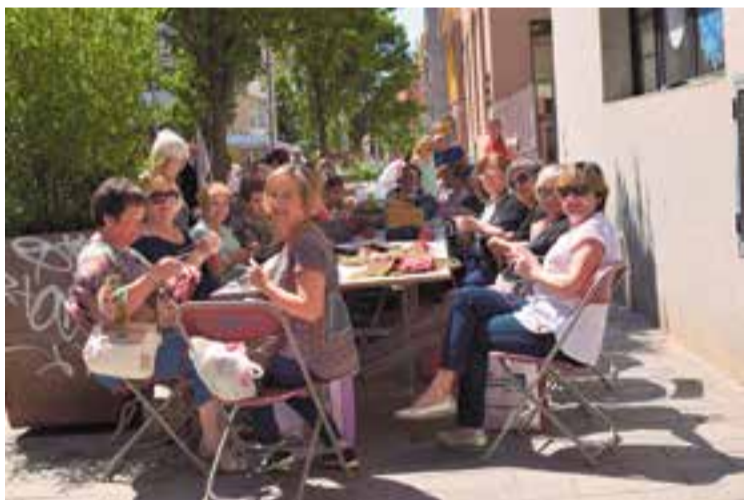
Un grup de dones teixint una manta conjuntament. || G.P.