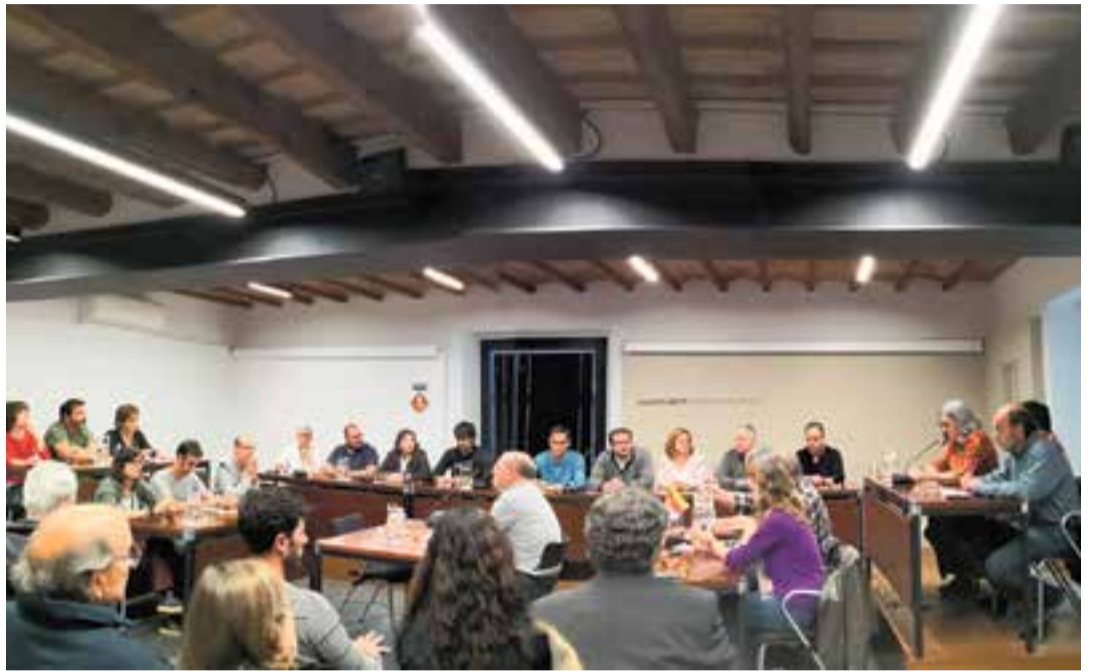
Imatge del ple de comiat celebrat el 28 de maig a la sala de plens de Ca l'Alberola.

El consistori renovarà en total 11 dels 21 càrrecs electes. Del total de regidors i