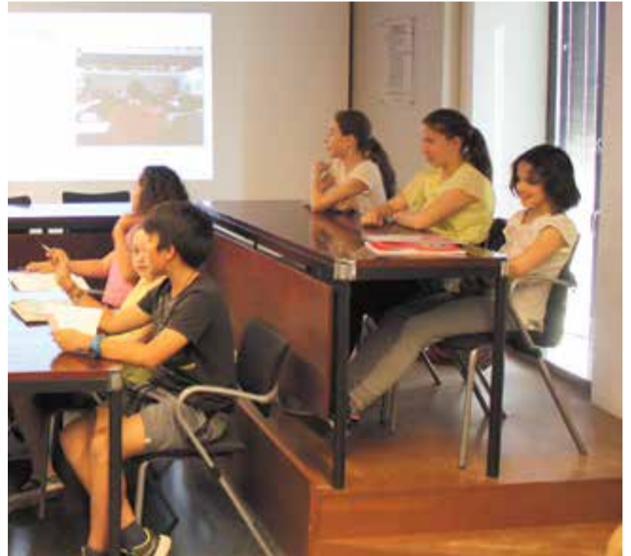
Representants del Consell d'Infants en la sessió de cloenda a Ca l'Alberola. || A.P.