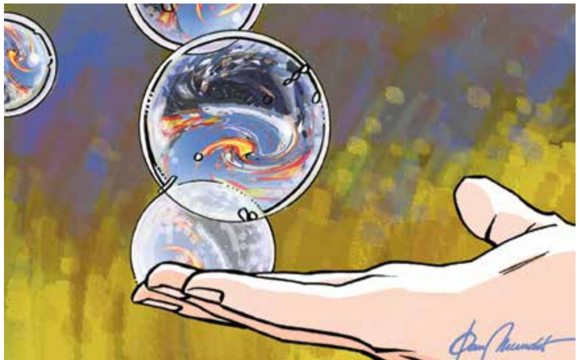
© Bombolles de sabó. || JOAN MUNDET

“Sense adonar-nos teníem un potencial armamentístic capaç de fer enrere tot un escamot antidisturbis”