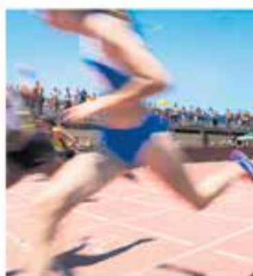
Club Atlètic Castellar

+ INFO: www.castellarvalles.cat , www.clubcinemacastellar.com