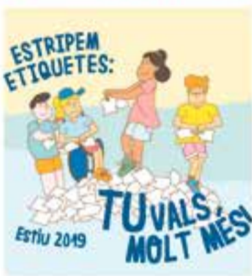
Colònies, campament i casal

+ INFO: www.castellarvalles.cat , http://clubatleticcastellar.cat/