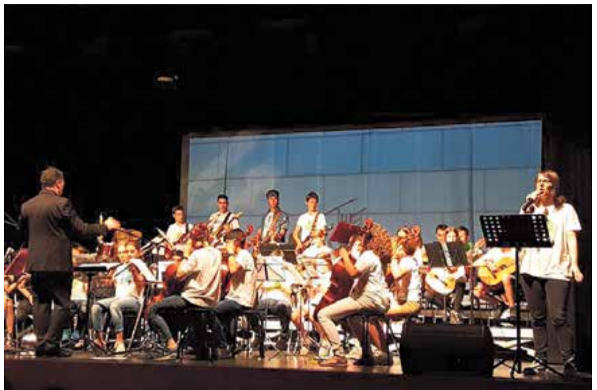
Moment del concert de final de curs de l'Arctàdia a l'Auditori Municipal Miquel Pont.

El públic, molt entregat, va vibrar i aplaudir la proposta i va demanar un bis, i de la mateixa manera que al matí una rumba catalana va tancar el concert, aquest cop va ser la popularitzada per Peret, 'El muerto vivo'. ✦