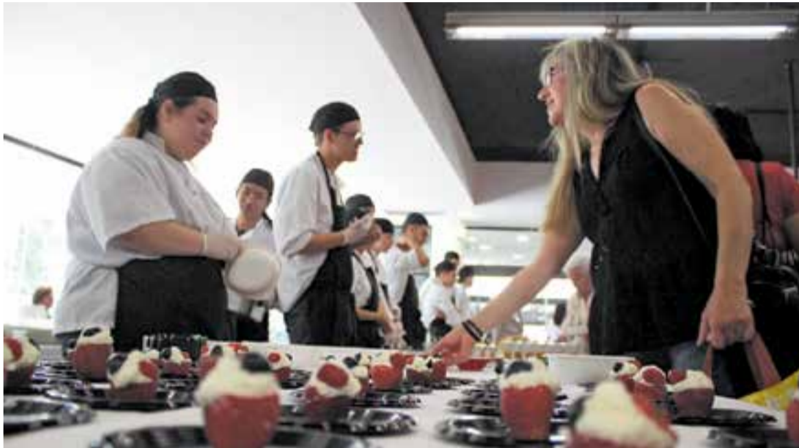
Els alumnes han preparat diferents tapes i les han ofert al Mercat Municipal.

Els alumnes del PFI d'Auxiliar d'Hoteleria ofereixen tapes gratuïtes