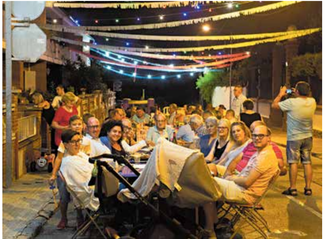
Moment de la Revetlla de Sant Jaume, l'any passat. A sota, Sound de Secà actuarà al Tast d'Estiu.

Sant Feliu del Racó celebrarà la Festa Major els dies 4, 5, 6 i 7 de juliol. Can Font i Ca n'Avellaneda la celebraran els dies 12, 13 i 14 de juliol. L'Agrupació de Veïns del Pla celebrarà la 36a Revetlla de Sant Jaume del 19 al 21 de juliol. +