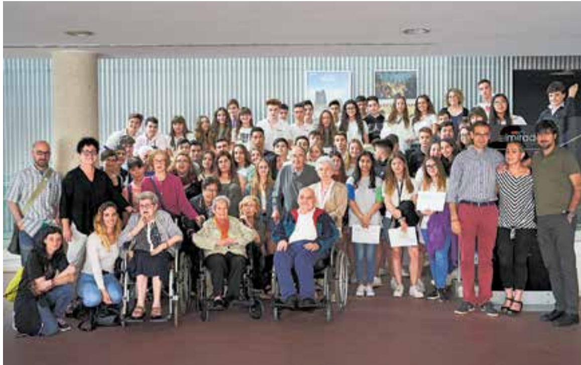
Foto de família dels participants en la darrera edició del Servei Comunitari desenvolupat per les escoles El Casal i FEDAC.

Els alumnes de 3r d'ESO del col·legi El Casal han desenvolupat la seva activitat a les entitats Suport Castellar i a Càritas Castellar. "Ens van plantejar fer el servei amb persones amb malaltia mental. Estàvem nerviosos, perquè mai ho havíem experimentat, i amb ganes de