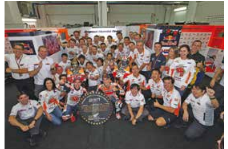
L'equip Honda va aconseguir la triple corona.

Dani Pedrosa va aconseguir la segona victòria de la temporada, després d'imposar-se a l'última cursa de la temporada al circuit Ricardo Tormo de Xest. El seu equip, el Repsol-Honda, va aconseguir la triple corona: campionat de pilots amb Marc Márquez, d'escuderries i de marques.