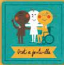
Dret a justícia

a estar amb la família i amb les persones que ens estimen per créixer en un entorn de comprensió i afecte.