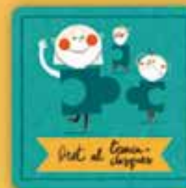
Dret a jugar

a tenir un nom i una identitat, és a dir, a saber qui som, d'on som i que ens diguin pel nostre nom.