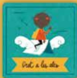
Dret a les lletres

a ser cuidats pels nostres pares i mares, que vetllin pel nostre benestar i ens orientin perquè poguem exercir els nostres drets.