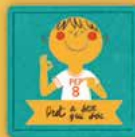
Dret a dir qui som

a la salut, a anar al metge quan estem malalts. Si ens hem d'estar a l'hospital, a rebre informació sobre la malaltia i el tractament i estar amb la família.