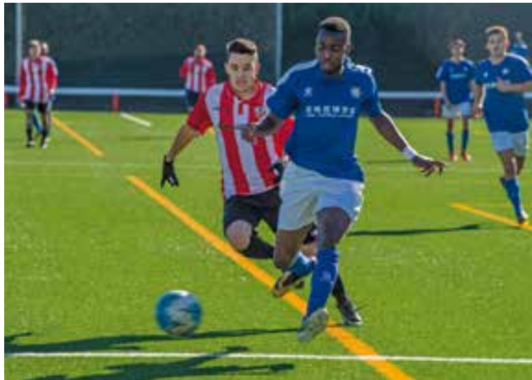
La UE Castellar va anar a remolc des de l'inici del partit. || A. SAN ANDRÉS

Els errors individuals sentencien el partit a la primera part