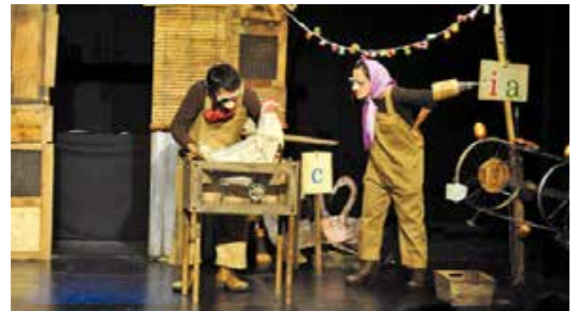
Zum Zum Teatre va presentar 'La gallina dels ous d'or' a l'Auditori. || CEDIDA

La història ens ensenya que la riquesa no fa la felicitat. Dos grangers, dedicats a dur una vida austera, i disposats a acollir tota mena d'ocells d'altres continents, es troben una gallina de grans plomes blanques a la granja i l'acullen. Aquella nit, la gallina pon un ou d'or i... sorpresa! Cada dia pondrà en un. Els grangers es faran rics i viuran una vida plena d'excessos. I apareixerà l'avarícia. Per voler més ous que els que la gallina pon, decideixen obrir-la en canal per treure'ls-hi de l'estómac. I, desesperats, s'adonen del tràgic final, quedant-se sense gallina ni ous d'or. ➔ || M. ANTÚNEZ