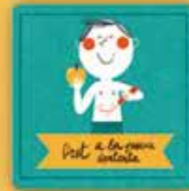
Dret a la vida

a estar informats, a expressar lliurement les nostres opinions i que les escoltin i tinguin en compte quan es decideixin temes que ens toquen de prop.