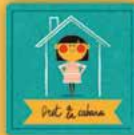
Dret a casa

a una educació de qualitat que ens permeti desenvolupar les nostres capacitats i habilitats i ser autònoms per volar.