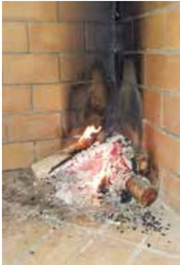
Llar de foc.

En especial, s'alerta de la necessitat de tenir les llars de foc en bon estat, i de fer-ne un manteniment correcte, com a accions pre-