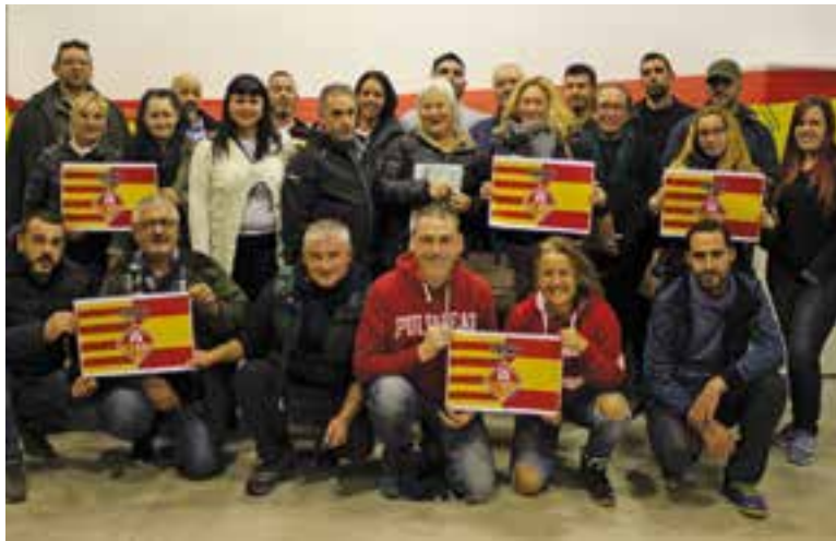
Diversos membres de la nova Plataforma ciutadana Castellar Unida.

Castellar Unida encara no ha concretat quines accions faran aviat tot i que ja estan pensant a posar carpes informatives i fer “una botifarrada o paella per donar-nos a conèixer”. +