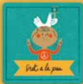
Dret a la pau

a estar protegits de tota mena de violència i maltractaments a l'escola, a casa o al carrer. A no patir cap agressió i que ningú abusi o s'aprofitei de nosaltres.