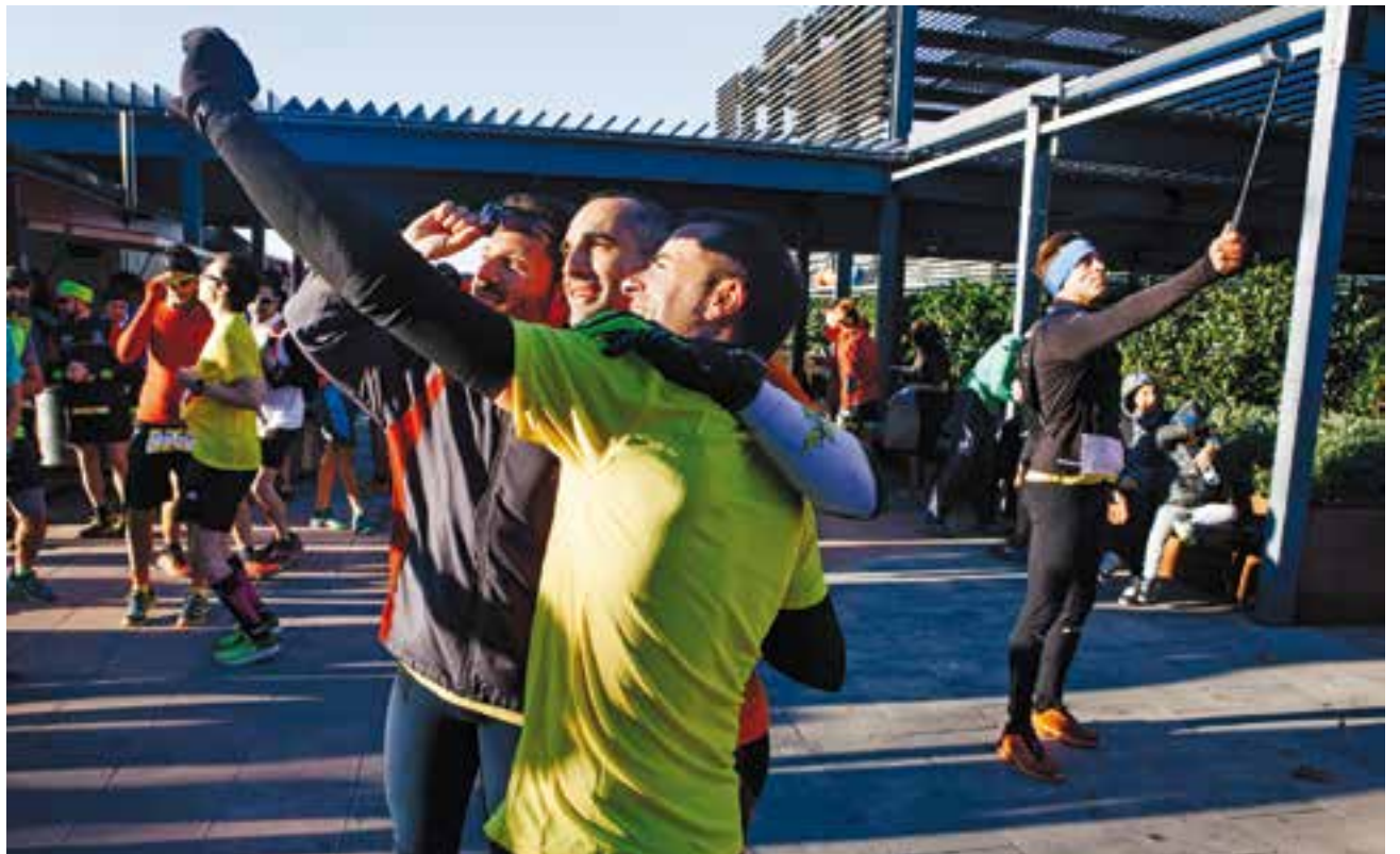
Diferents participants de la cursa fent-se unes 'selfies' a la plaça d'El Mirador.