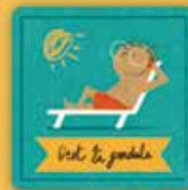
Dret a jugar

a tenir un lloc que sigui casa nostra i on puguem tenir una vida digna.