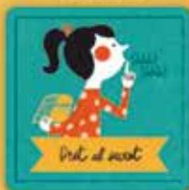
Dret al secret

a rebre totes les atencions per part de la família i dels governs per tal de viure i desenvolupar-nos al màxim i de manera saludable.