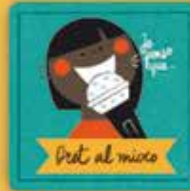
Dret al micrò

a no ser discriminats per raó d'edat, sexe, origen, creença, llengua, situació econòmica o discapacitat. Som diferents, però tenim els mateixos drets.