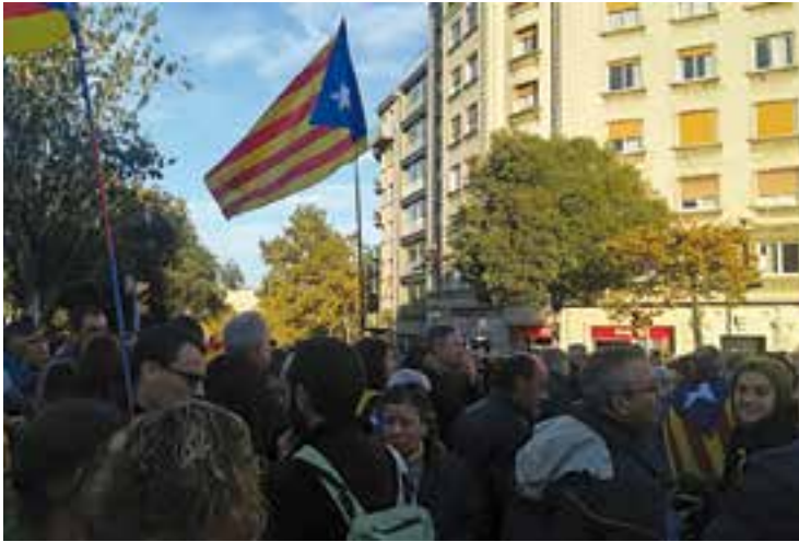
Manifestació 11N a la cruïlla carrer d'Aragó - Carrer de Marina, Barcelona. || M. A.