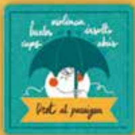
Dret al paraigua

a satisfer les necessitats físiques i mentals per a un nivell de vida digna, en especial l'alimentació, la roba i l'habitatge.