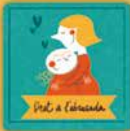
Dret a l'abrçada

Trobareu el text complet de la Convenció sobre els Drets de l'Infant a: www.unicef.es/cat