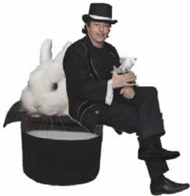
El Mag Pep oferirà un espectacle de màgia a Cal Gorina, diumenge.