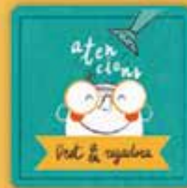
Dret a veure

al joc i a estar amb els amics, a gaudir d'activitats culturals, esportives i de lleure.