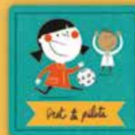
Dret a jugar

a viure en pau, a estar protegits de les guerres i a no ser reclutats com a soldats ni participar en els conflictes armats.