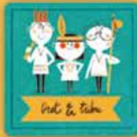
Dret a tenir

a descansar, a no treballar fins que no siguem grans i a tenir temps per a l'esbarjo.