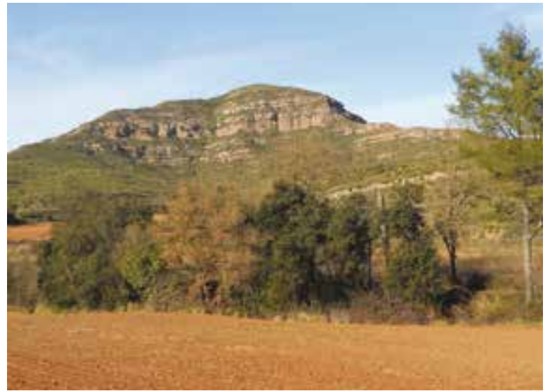
Una imatge d'arxiu del Parc de Sant Llorenç del Munt i l'Obac