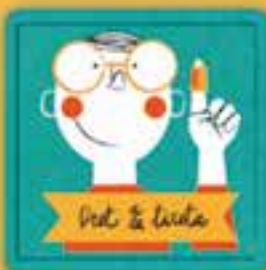
Dret a la salut

a tenir intimitat i que tothom respecti la nostra vida privada, que no ens obrin la correspondència, que no mirin el nostre diari, que no expliquin els nostres secrets.