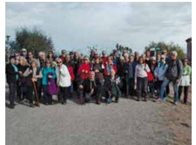
Els participants a la sortida.

La darrera sortida de cicle d'itineraris de natura per a gent gran Vine i Camina +60 va ser el 9 de novembre a Manresa. Els participants es van desplaçar en autobús i van fer un recorregut a peu pel Parc de l'Agulla, un estany artificial que va entrar en funcionament l'any 1974. L'espai compta amb una gran varietat d'arbres, un total de 20 espècies diferents, així com ànecs i d'altres aus aquàtiques. Des d'allà els visitants van poder contemplar unes bones vistes de Montserrat. Amb aquesta sortida, de vuit quilòmetres de recorregut, es tanca les sortides d'aquest any, que han inclòs una sortida a Collserola i a Les Arenes, que es va haver d'anular. Totes les sortides tenen per objectiu promoure l'excursionisme, els hàbits saludables i les relacions amb els altres i la natura. Per participar, cal dur, com a equipament personal, roba i calçat còmode, esmorzar i beguda i impermeable. La sortida té un preu de 2 euros en concepte d'assegurança (exemptes les persones amb carnet de federat). Cal inscripció prèvia a la Regidoria de Programes Socials. † REDACCIÓ