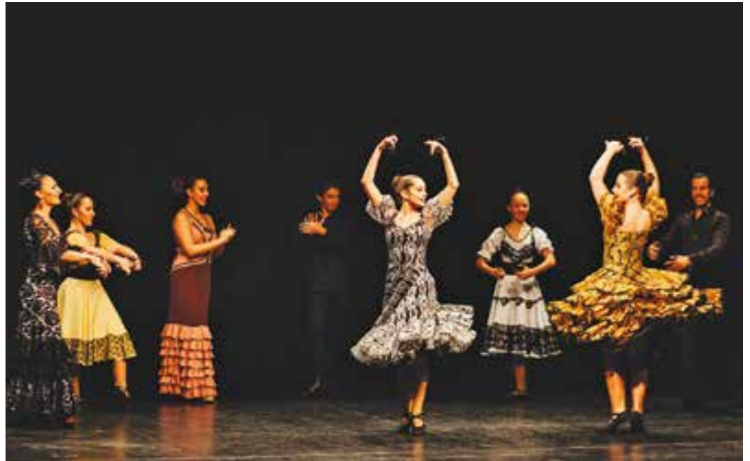
Els integrants de la companyia de dansa Somnis de Retahila d'alt de l'escenari de l'Auditori.