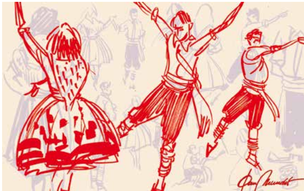
© Apunts in situ. || JOAN MUNDET

de "Ball de les Gitanes", es possiblement deguda, a que els balladors, sobretot les dones, duïen uns vestits estampats molt cridaners, (elaborats a partir dels retalls, del caps de peça, i de "les banderes", en l'argot tèxtil els trossos de teixit que servien per fer les mostres, que ensenyarien després els viatjants), i també perquè aquestes primeres colles, van introduir l'ús de castanyoles, tant per homes, com per dones, (encara avui, fan estremir els anomenats "balls muts", en que només s'acompanyen els balladors, amb les castanyoles, i la cobla resta callada), també es van introduir noves danses, la jota, la catxutxa, la contradansa, la polca, i avui encara, els mestres actuals, incorporen al Ball de Gitanes, noves formes de ball; les Gitanes doncs, són avui encara, alhora que una de les manifestacions més antigues del fol-