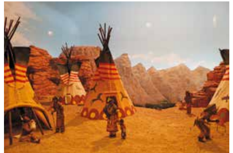
Diorama del naixement, ambientat a Amèrica del Nord. || J. SEGURA

Aquest diumenge, d'11.30 a 13.30 h i de 17 a 20 h, encara es poden visitar els pessebres del Grup Pessebrista de Castellar "Pessebres del món", al carrer Doctor Pujol, 26. Aquest és l'últim cap de setmana que es poden veure els 15 diorames i 3 calaixos exposats. L'exposició d'aquest Nadal ha estat, sense dubte, agosarada, ja que ha intentat mostrar el paisatge de diversos indrets del planeta. + || M. A.