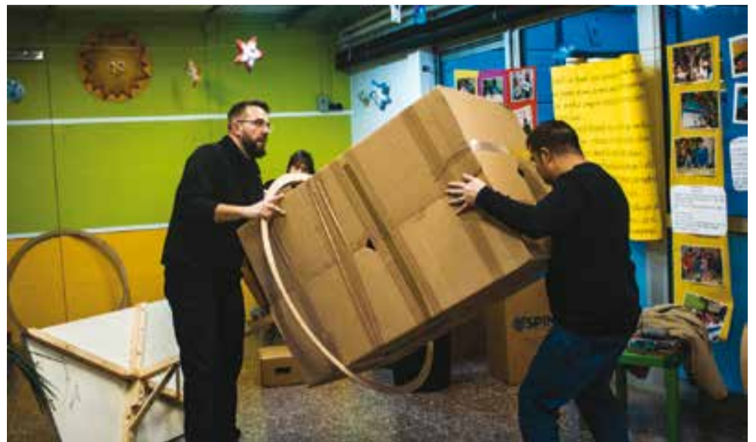
Preparatius de la comparsa de l'escola Sant Esteve durant el cap de setmana passat.

Dissabte 10 de febrer, al matí, una vintena de membres de l'esplai recullen ous de les cases. "També posem una parada de recollida a la plaça del Mercat i al carrer de Montcada", apunta Parera. Perquè siguin fàcilment identificables, els nois i noies de l'esplai porten una samarreta amb un ou dibuixat. "Tots els ous que es recullen al matí ja es porten a l'Espai Tolrà per tenir-los