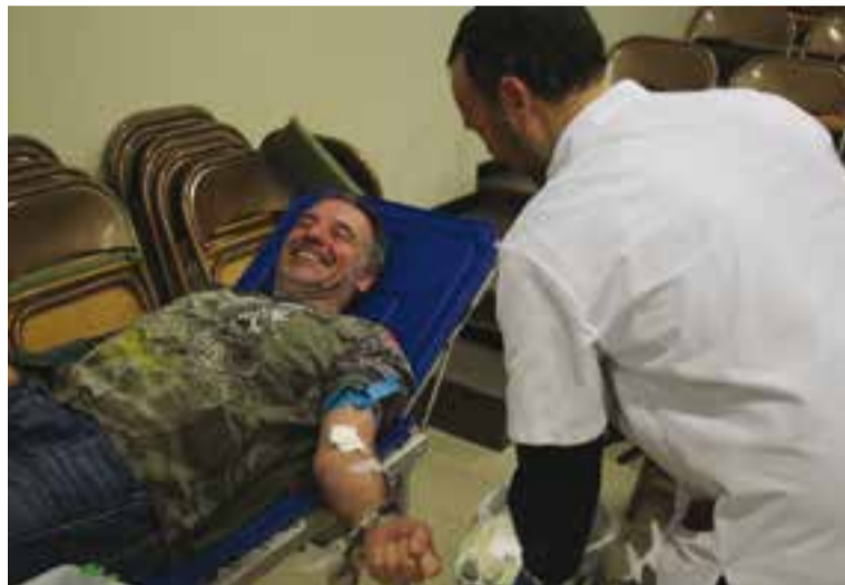
Darrera jornada de donació de sang al CEC de Castellar, dilluns passat

Quant a la reticència d'algunes persones a donar sang, Moix creu que no és tant “per la por a l'agulla” sinó pel desconeixement del procés. “Un cop en dones veus que no n'hi ha per tant, que no