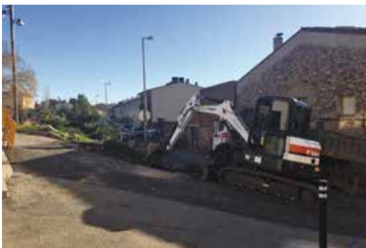
Una màquina treballant en el carrer dels Garrofers dimecres al matí.