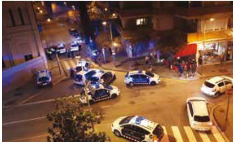
Desplegament policial davant del TBO després de l'incident.

La policia local va detenir un home per fer servir aquest tipus d'arma a l'interior del bar TBO