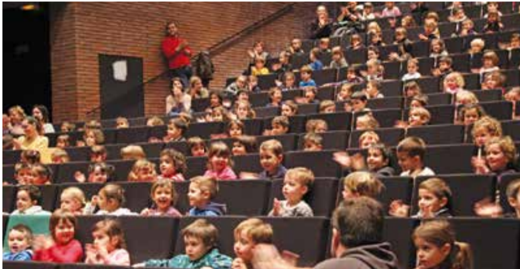
Alumnes de P3 de totes les escoles de Castellar van gaudir del BRAM! Escolar, dimarts passat.

3.179 alumnes participaran enguany a la proposta de projeccions del Club Cinema Castellar Vallès i la Guia Didàctica