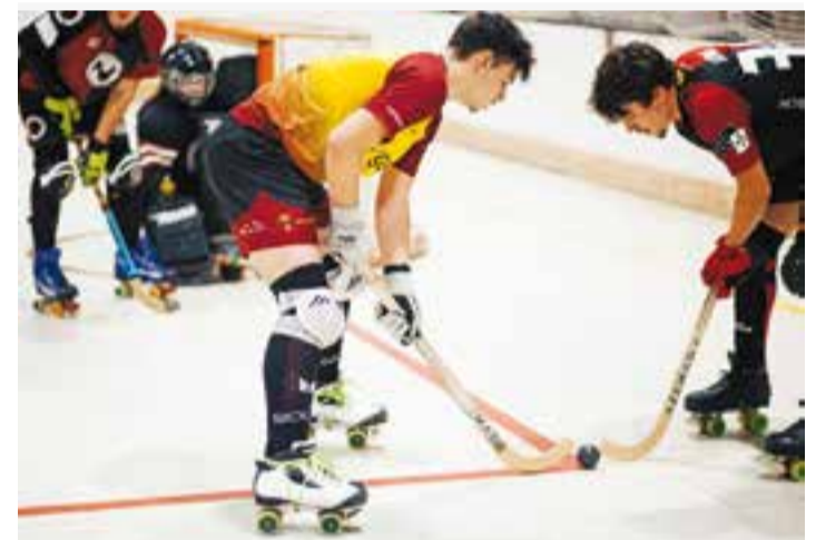
LHC Castellar va caure, tot i tenir ocasions fins al final.

Tot i la derrota, l'HC Castellar segueix fora de les posicions de descens directe, que ocupen el Caldes de Montbui i el Masquefa. +