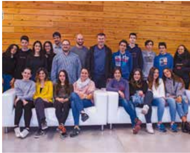
Els participants en el curs de Periodisme Jove a El Mirador.