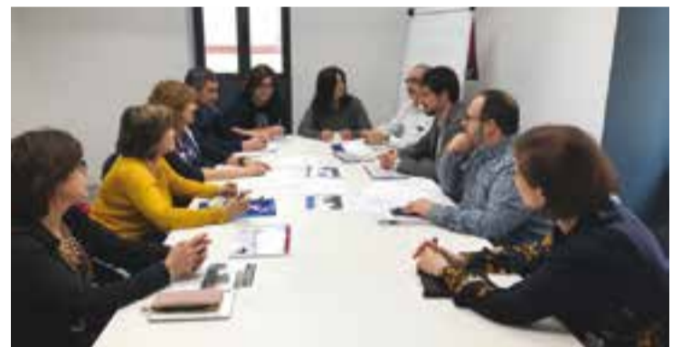
Els regidors de Joventut i Salut de Castellar reunits a Tarragona.

Després que Tarragona fos admesa a la xarxa de Youth in Europe, el primer pas que s'ha realitzat ha estat una enquesta als 2.058 estudiants dels tots els instituts de la ciutat amb la intenció de visualitzar les problemàtiques i dissenyar un seguit d'accions amb la intervenció de tots els agents. Els resultats es van enviar al Centre d'Investigacions i Anàlisis Socials (ICSRA) d'Islàndia que el que està coordinant tot el projecte a nivell europeu. Pérez ha apuntat que "tenim la idea de poder aplicar el projecte a Castellar i veure la manera de com es pot aplicar aquí" . Experiències reeixides de treball comunitari per a fomentar una vida saludable a Castellar com el de la preinscripció social "no és el mateix que un programa d'intervenció". De la trobada "vam sortir molt motivats i hem vist com des de Tarragona han apostat molt per fer un treball transversal molt bo" .