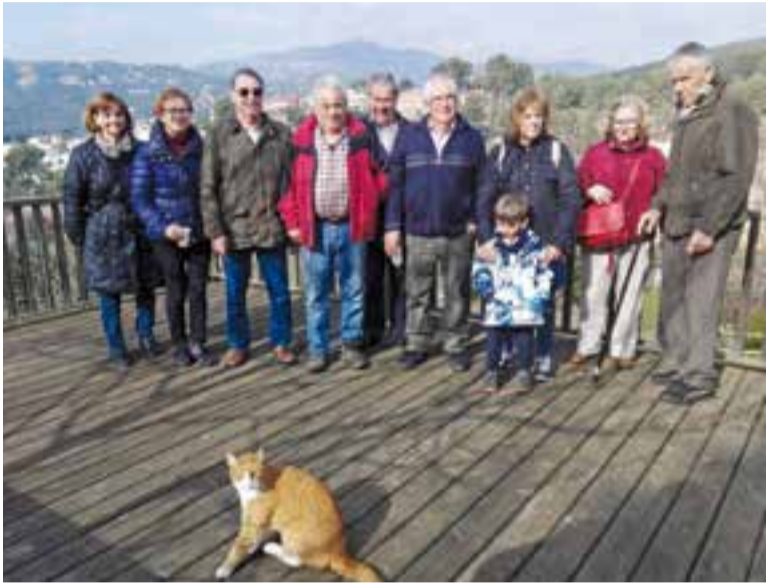
Alguns dels hortolans presents als actes de celebració del 10è aniversari.

Les parcel·les estan concebudes com una activitat d'oci i de lleure amb molta demanda