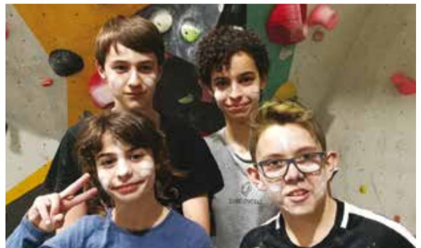
A dalt, una imatge de l'Open, a baix, quatre dels participants de la tecnificació.

van participar en el torneig d'aniversari del CanGlomerat