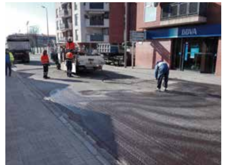
Treballs de reparació d'asfalt al carrer Barcelona, dijous al matí.