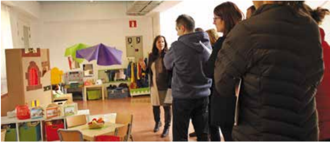
Jornada de portes obertes de l'any passat a l'escola El Sol i la Lluna.