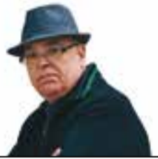
ANTONI MORA Blog Conèixer Catalunya

L'accés es fa des de la carretera de Castellar del Vallès a Sant Llorenç de Savall