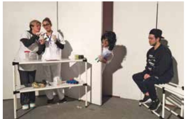
Assaig de l'obra 'Mama, loko! la tinc petita!', dels veïns i veïnes del Racó.

Les representacions tindran lloc els dies 24 i 25 de febrer i 3 i 4 de març a l'Ermita del Racó. L'entrada costa 5 euros. S'ha de reservar a teatre.el.raco@gmail.com . Els menors de 12 anys entren gratuïtament.