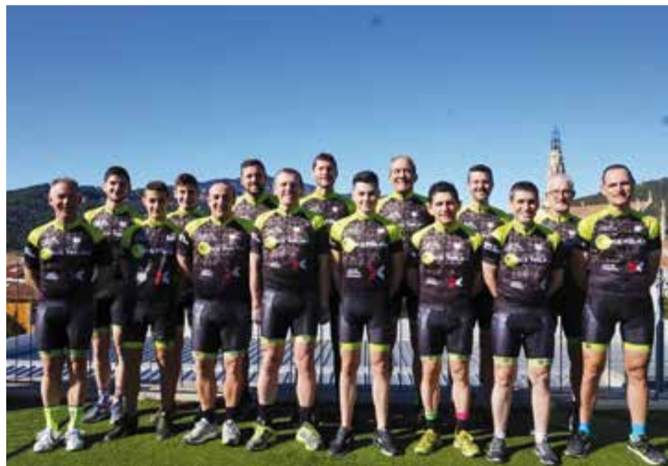
Les jugadores del sènior A del FS Castellar de vòlei en una imatge d'arxiu. || FS CASTELLAR

09:00 Arenys de M. - iniciació A 09:00 CP Tordera - aleví A