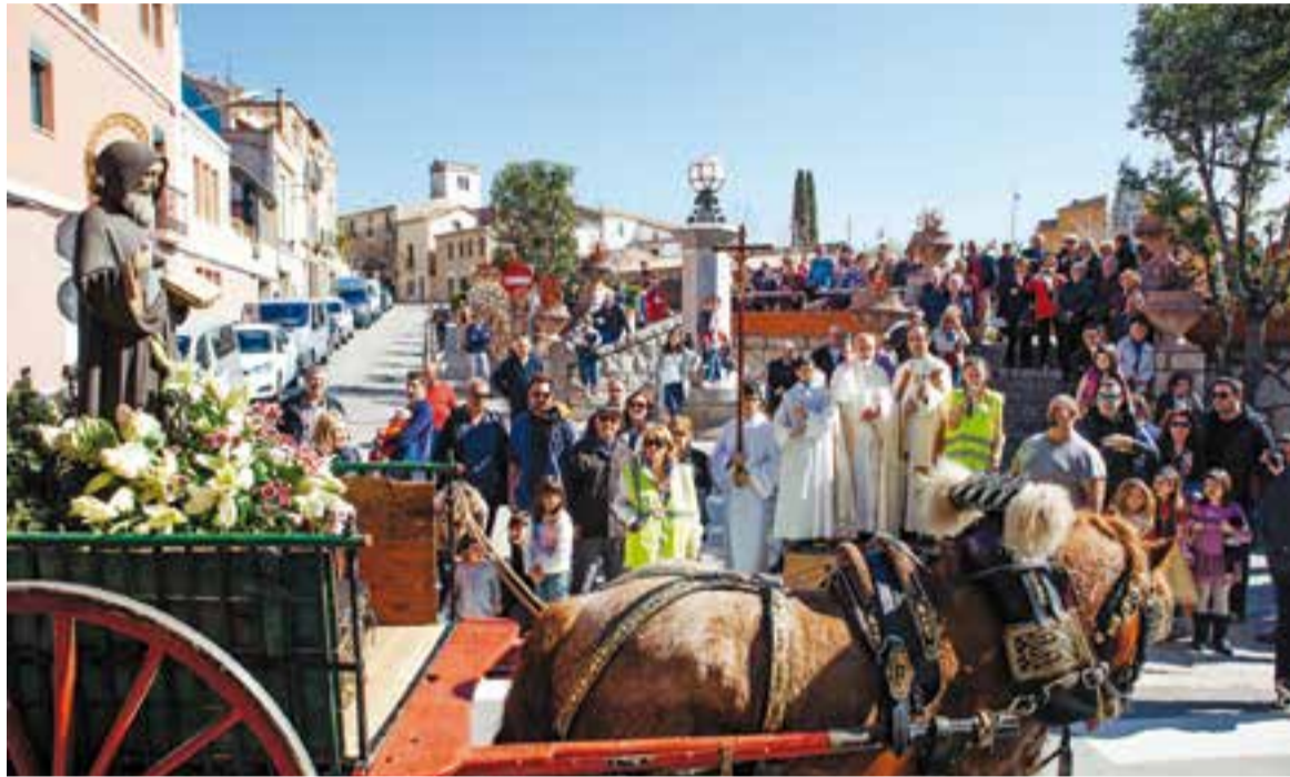
A la font de la plaça Major, el carruatge amb el Sant Antoni circula durant la cercavila, l'any 2017.

Aquest proper diumenge 25 de febrer, Castellar del Vallès acull la Passada de Sant Antoni Abat organitzada pels Amics de Sant Antoni Abat, que compten amb la col·laboració de la Federació Catalana dels Tres Tombs, l'Ajuntament de Castellar i els Castellans de Castellar.