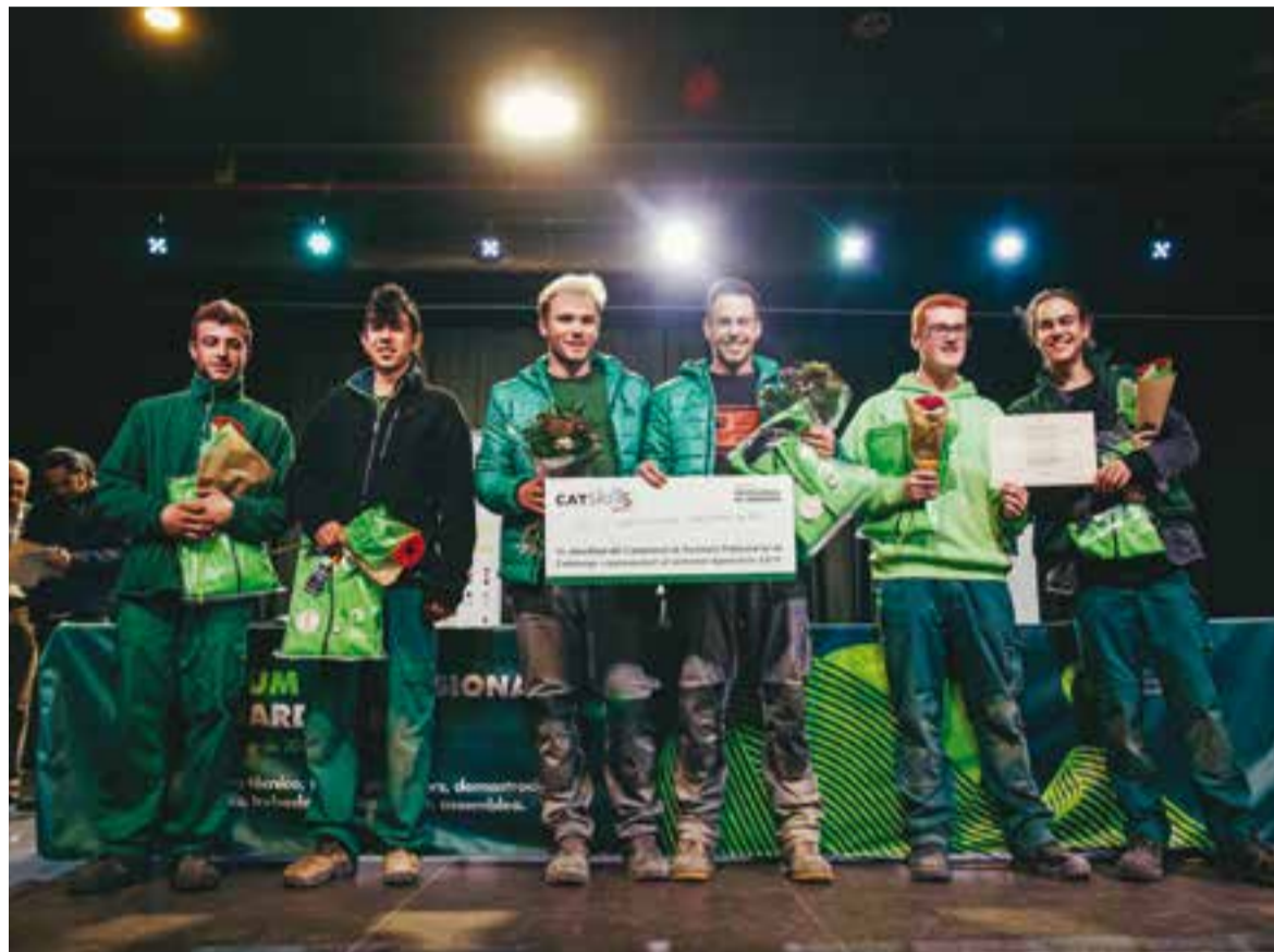
Els guanyadors del Catskills. D'esquerra a dreta: Institut Les Salines (3r), Institut d'Horticultura i Jardineria (1r) i Institut Castellar (2n).