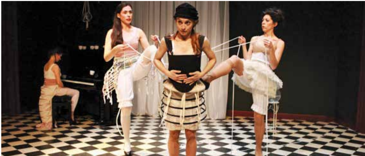
Repertiment de l'obra 'Barbes de balena' que es va poder veure dissabte passat a l'auditori.