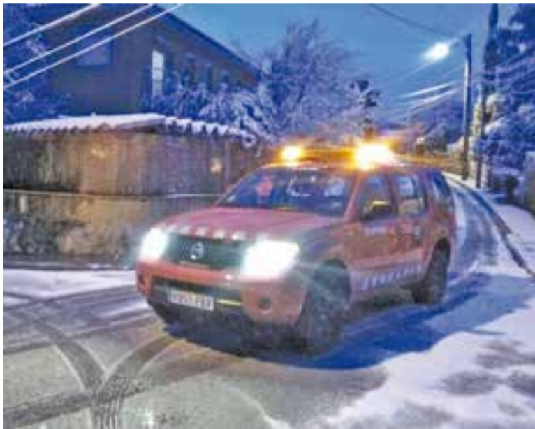
Un vehicle dels bombers circula durant la matinada de dimarts.

La tercera nevada d'aquest hivern a la comarca del Vallès Occidental va deixar emblanquinades les cotes més altes del terme municipal de Castellar. Segons informa l'Ajuntament, des de tres quart de set del matí va entrar en funcionament una pla llevaneu al Balcó i a Sant Feliu del Racó -les zones més afectades per la neu- i a les 9 del matí pràcticament es circulava amb normalitat a tot el municipi tret d'algun tram de carrer en els esmentats nuclis. De fet, en aquests punts alts la neu va aconseguir gruixos d'uns cinc centímetres. En activar-se dilluns el pla Neucat, tant policia local, com bombers i ADF estaven en alerta i havien reforçat les seves dotacions. + || REDACCIÓ