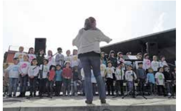
El grup de petits músics als 'Petits concerts de Sant Josep'. || M. A.

Dissabte, es va dur a terme la tercera edició dels Petits Concerts de Sant Josep, que enguany organitzava Acció Musical Castellar, amb la col·laboració d'Artcàdia, dels Gegantets El Sol i la Lluna de l'ETC i l'Ajuntament. Més de 200 persones van gaudir de la proposta musical. Els grups de violoncels, pianos i guitarres i el cor Petits músics, van marcar la primera part. Després d'una pausa amb xocolata i el ball dels gegantets, a la segona part, va actuar l'orquestra i la banda infantil Artcàdia i el grup de cambra Els Mussols, i dos grups joves de combo modern. + || M. ANTÚNEZ