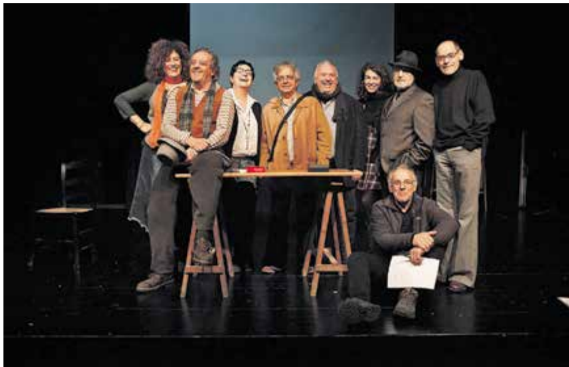
Actors i director del muntatge teatral 'Aquesta nit tanquem', l'adaptació d'una obra de Manuel de Pedrolo.