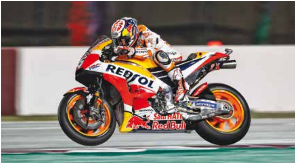
Dani Pedrosa al difícil asfalt del circuit de Losail (Qatar) amb la nova Honda d'aquesta temporada.