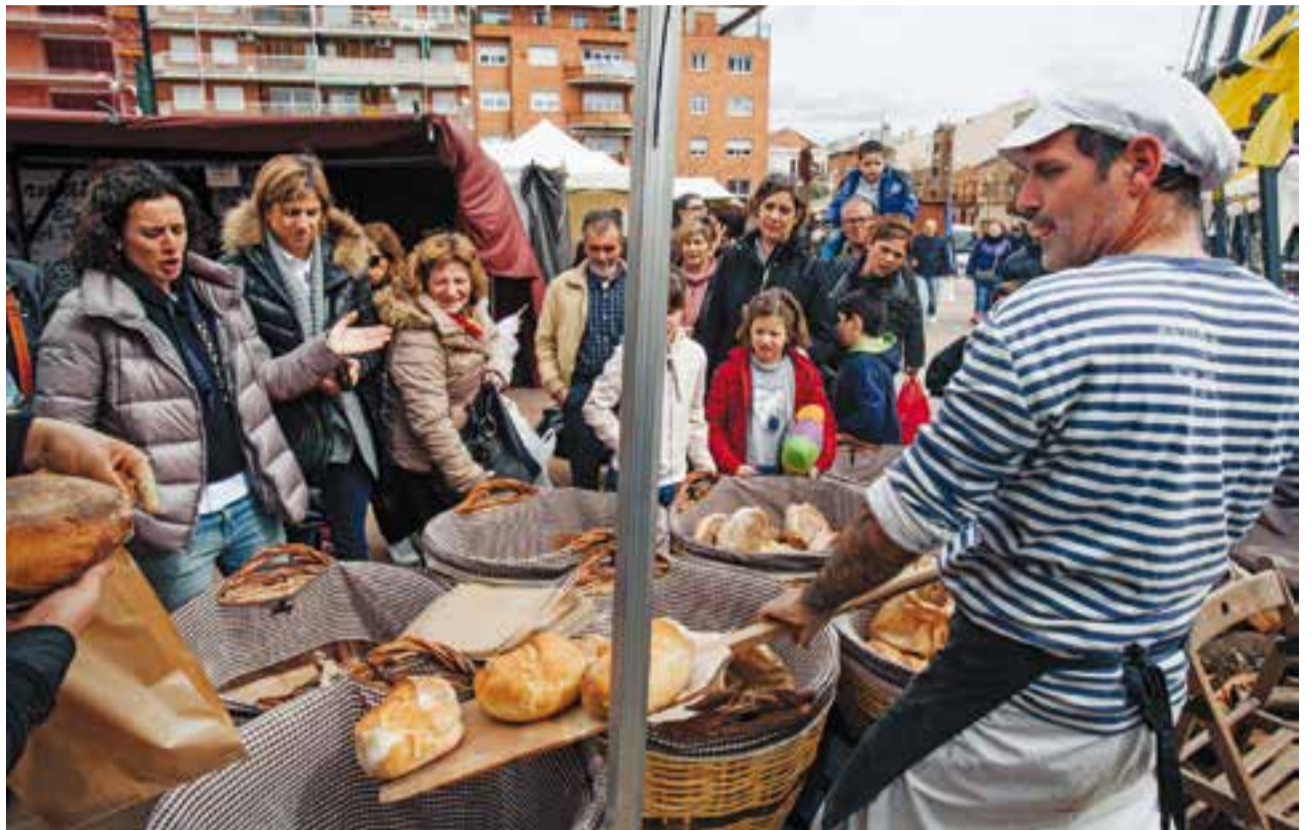
Un forner serveix pa acabat de fer a diverses visitants de la fira de Sant Josep dilluns al matí.

de crema de Sant Josep es van repartir dilluns. Una part es va distribuir a les residències de gent gran de Castellar