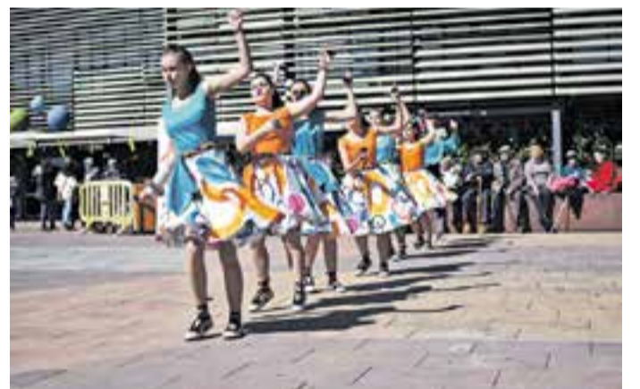
La colla de Mitjans de Lliça d'Amunt balla a la plaça del Mirador.