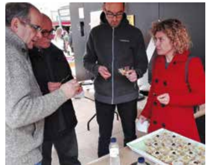
Tast del concurs de mongeta del ganxet organitzat per ERC.