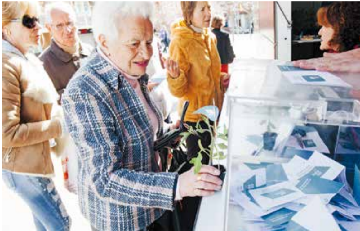
Una participant en les votacions de dilluns passat. L'Ajuntament regalava una tomaquera als votants.

Enguany, s'ha incorporat com a novetat una categoria destinada exclusivament a les demandes de les