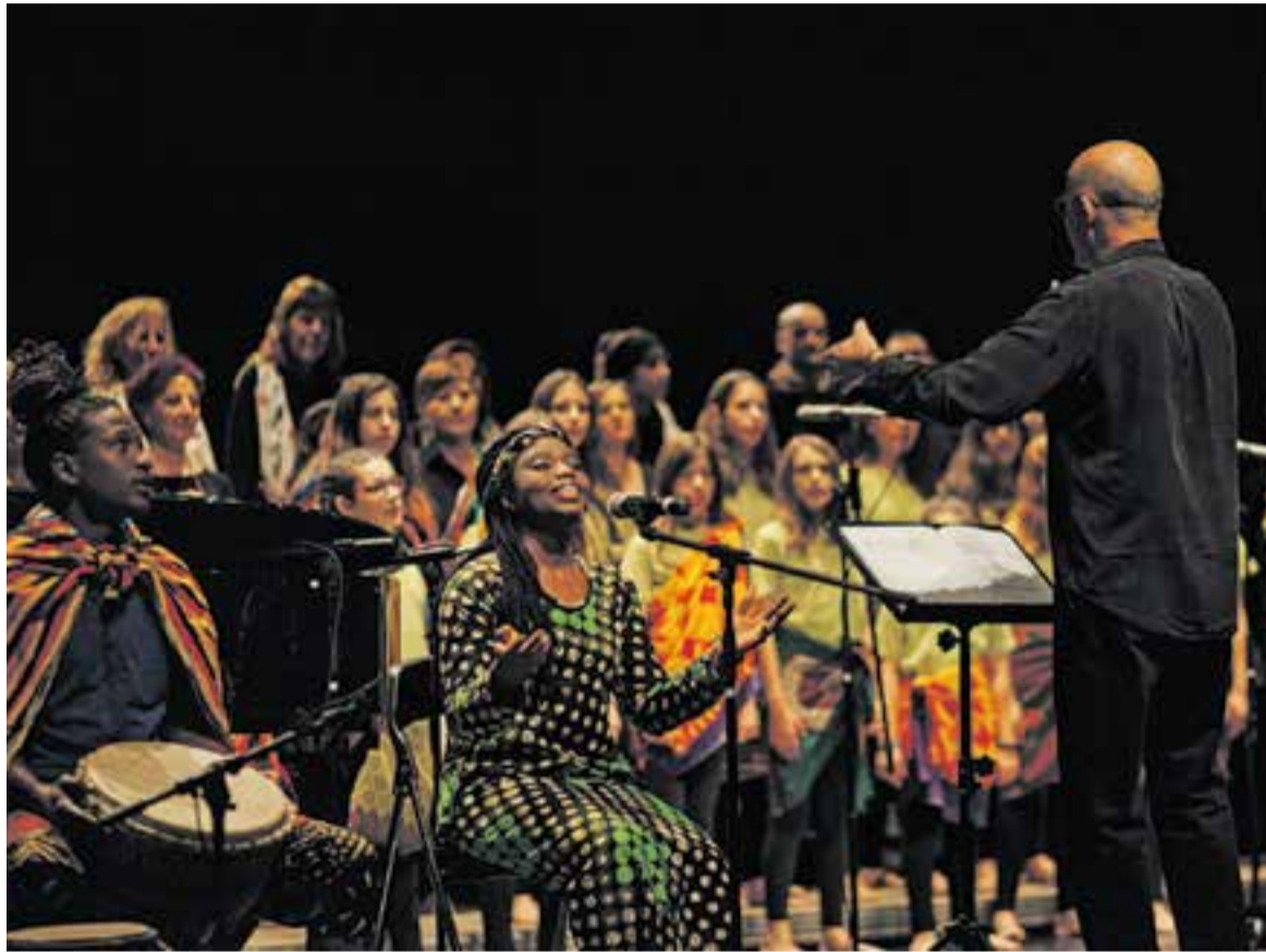
L'espectacle es va portar a l'Auditori de la mà de la Fundació Main i l'Associació Afrocatolana d'Acció Solidària.

El concert, que van oferir el Cor Sant Esteve i Di-versions, recrea un conte de Josep Lluís Badal