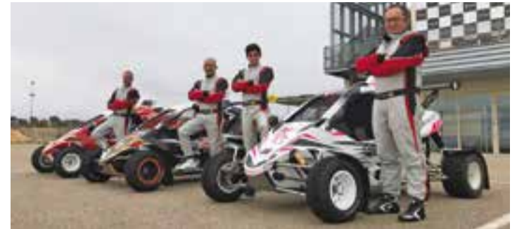
A la dreta, Jordi Pujol, amb el Pol Pujol al costat i la resta de l'equip. || CEDIDA