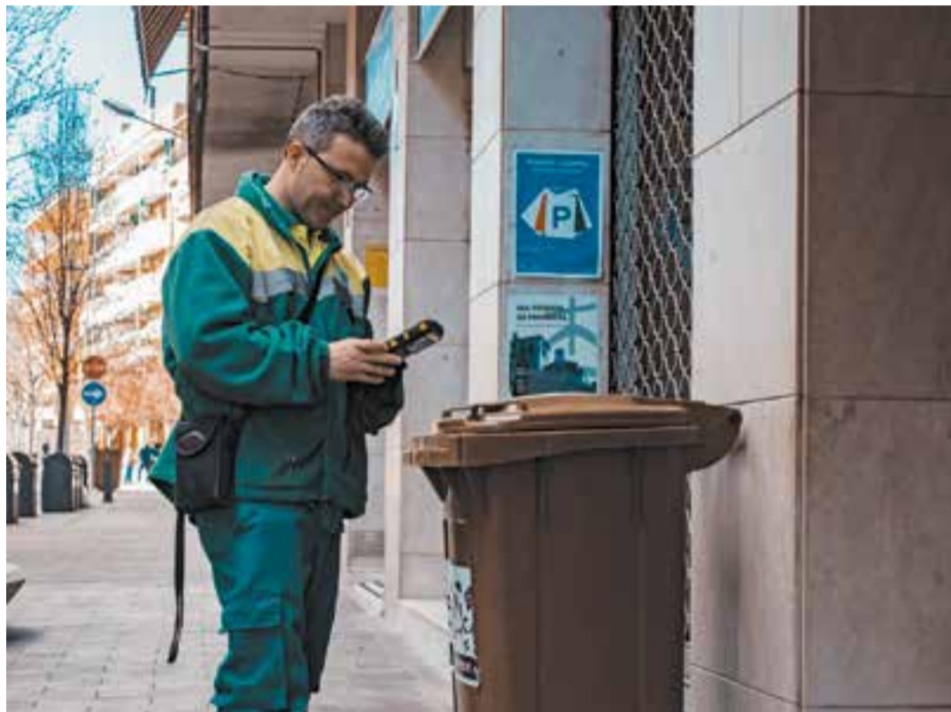
Un operari de FCC davant d'un contenidor de matèria orgànica dimecres a la tarda al carrer Montcada.