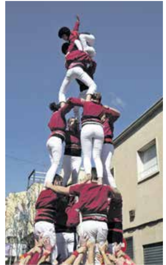
Els Capgirats, a Terrassa. || CEDIDA

"El pilar de 5 és la construcció més complicada que ha descarregat la colla en tota la seva història". El van aconseguir en l'última actuació de la temporada passada, però aquest diumenge va fer llenya poc després que l'enxaneta fes l'aleta. Malgrat tot, el plantejament de l'actuació, amb l'estrena inclosa al tronc del pilar de 5, demostra que, aquesta temporada, els de Castellar estan preparats i volen superar els seus millors resultats. † || M. A.