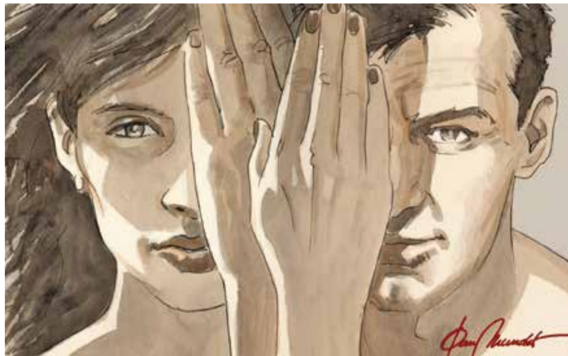
© 10 sentits. || JOAN MUNDET

portem ancestralment programada. L' OLFACTE . Fa olor l'aire pur?, oi que no?, doncs gaudim-ne del que ens envien generosament els de Sant Llorenç que ara per ara és gratuït! Però també és agradable ensumar l'olor de la terra mullada i de l'herba, pels camps i dins dels boscos, que veiem des de les alçades i pels que també hi podem passejar amb