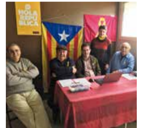
Votació a Castellar del Vallès.