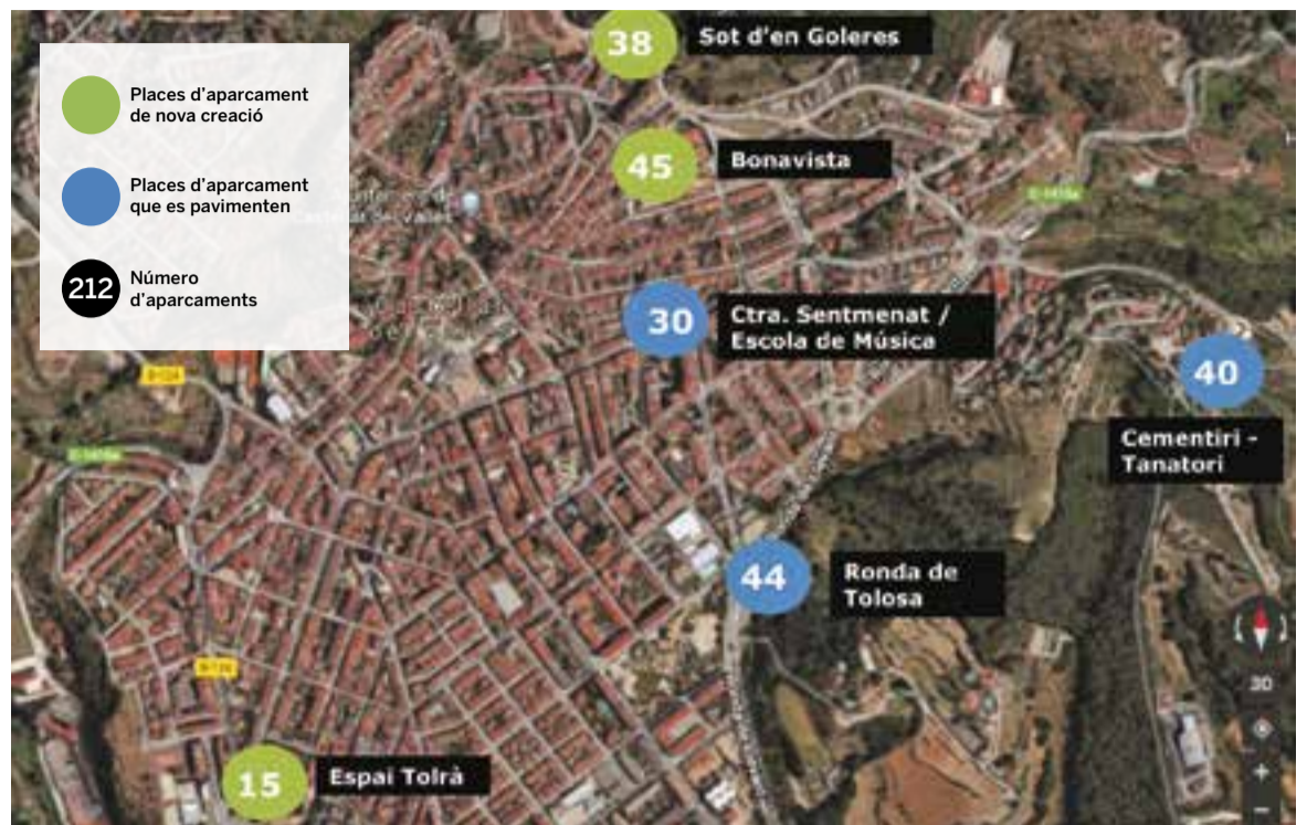
El pla d'aparcament inclou actuacions a sis zones diferents del municipi.

tuat al costat de l'Escola Municipal de Música. Les obres d'arranjament de les tres àrees d'estacionament lliure van a càrrec d'Asfaltats Riba, SA, tenen un pressupost d'adjudicació de 99.700 euros, IVA inclòs, i està previst que finalitzin a finals del mes d'abril. D'altra banda, es crearan dues noves àrees d'estacionament al nucli antic amb capacitat total per a 83 vehicles. D'aquestes, 38 sortiran de l'espai situat al carrer de Sot d'en Golerès, al costat d'un dipòsit d'ai-