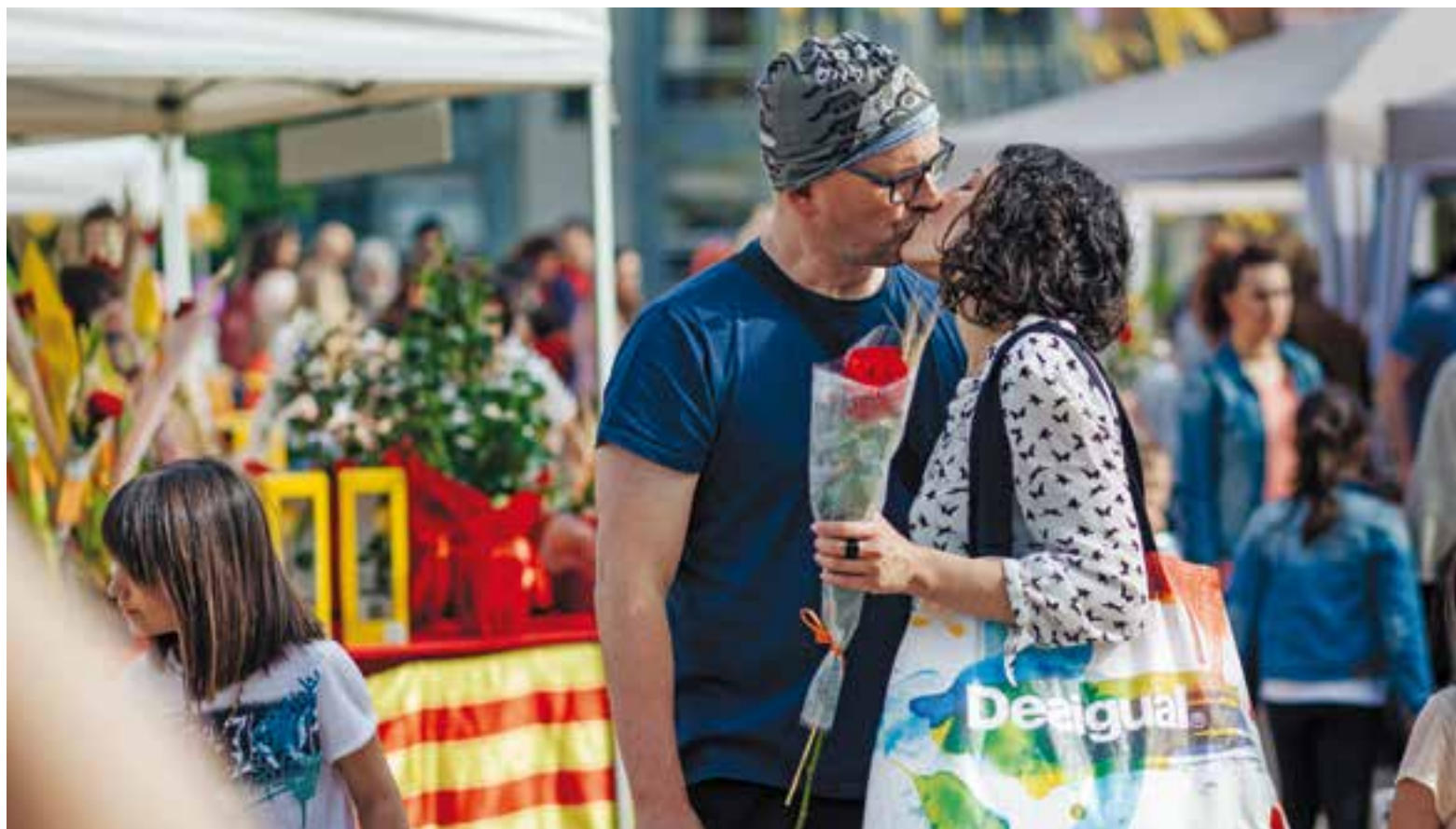
Una parella enmig de la plaça d'El Mirador davant de les parades de flors i llibres de Sant Jordi.