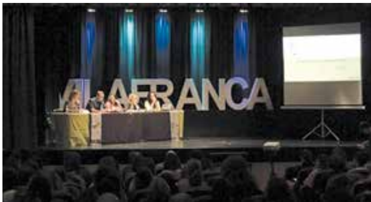
Intervenció conjunta de l'escola El Sol i La Lluna i l'institut Jaume I de Borriana.

La jornada es va completar a la tarda amb dues comunicacions si-