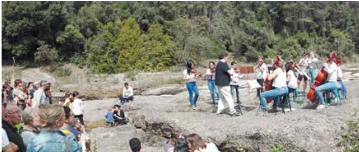
Panoràmica de l'actuació d'Acció Musical Castellar en un dels punts on els músics van fer parada, al costat del riu Ripoll.

Acció Musical Castellar va dur a terme la proposta, diumenge 22