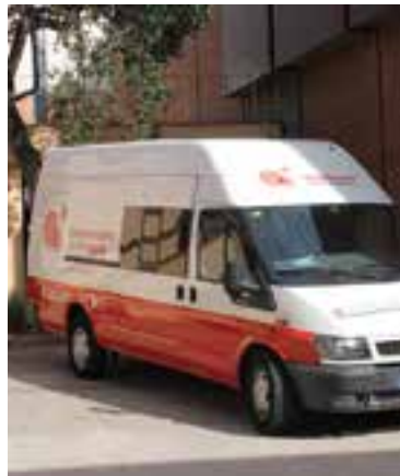
Banc de Sang i Teixits