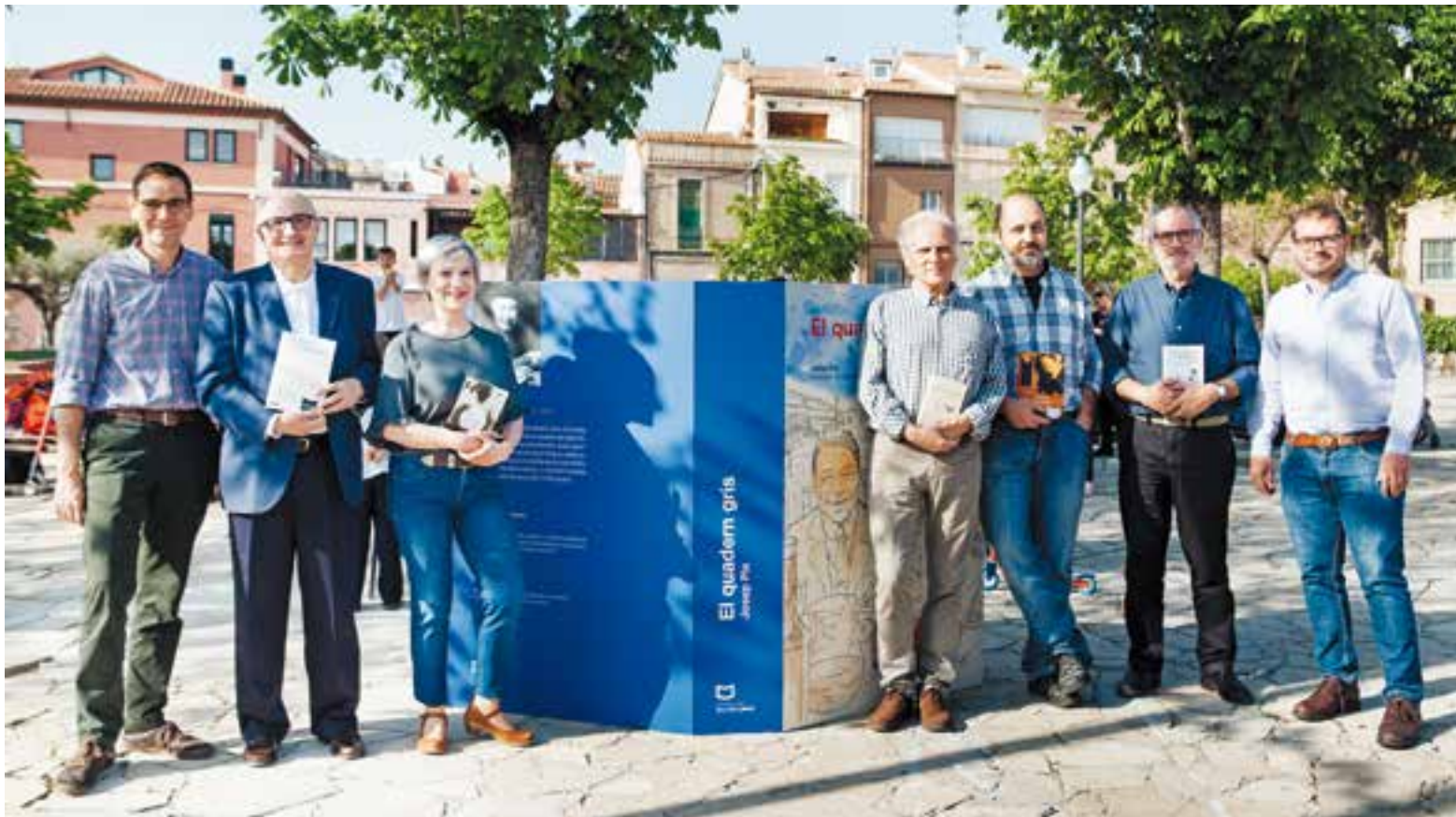
Els padrins dels bucs del Castellar vila de llibres amb l'alcalde i el regidor de Cultura al buc instal·lat a la plaça Major dedicat a 'El quadern gris'.