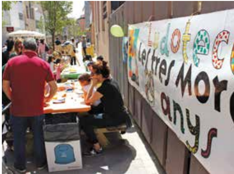
Tallers davant de Les 3 Moreres dissabte al matí.

Els mecanismes gegants de fusta que es van muntar al carrer a càrrec d'Els Amics d'en Crusó van tenir molt èxit, n'hi havia més d'una desena, alguns pensats per als més petits i, d'altres, pels més ganàpies. També va tenir molt bona acollida l'escalètric gegant instal·lat a l'interior de la Ludoteca, que durant tot el matí va funcionar sense parar; i on fins i tot, es van formar cues. "No farem pastís d'aniversari ni res gaire pompós, volem simplement