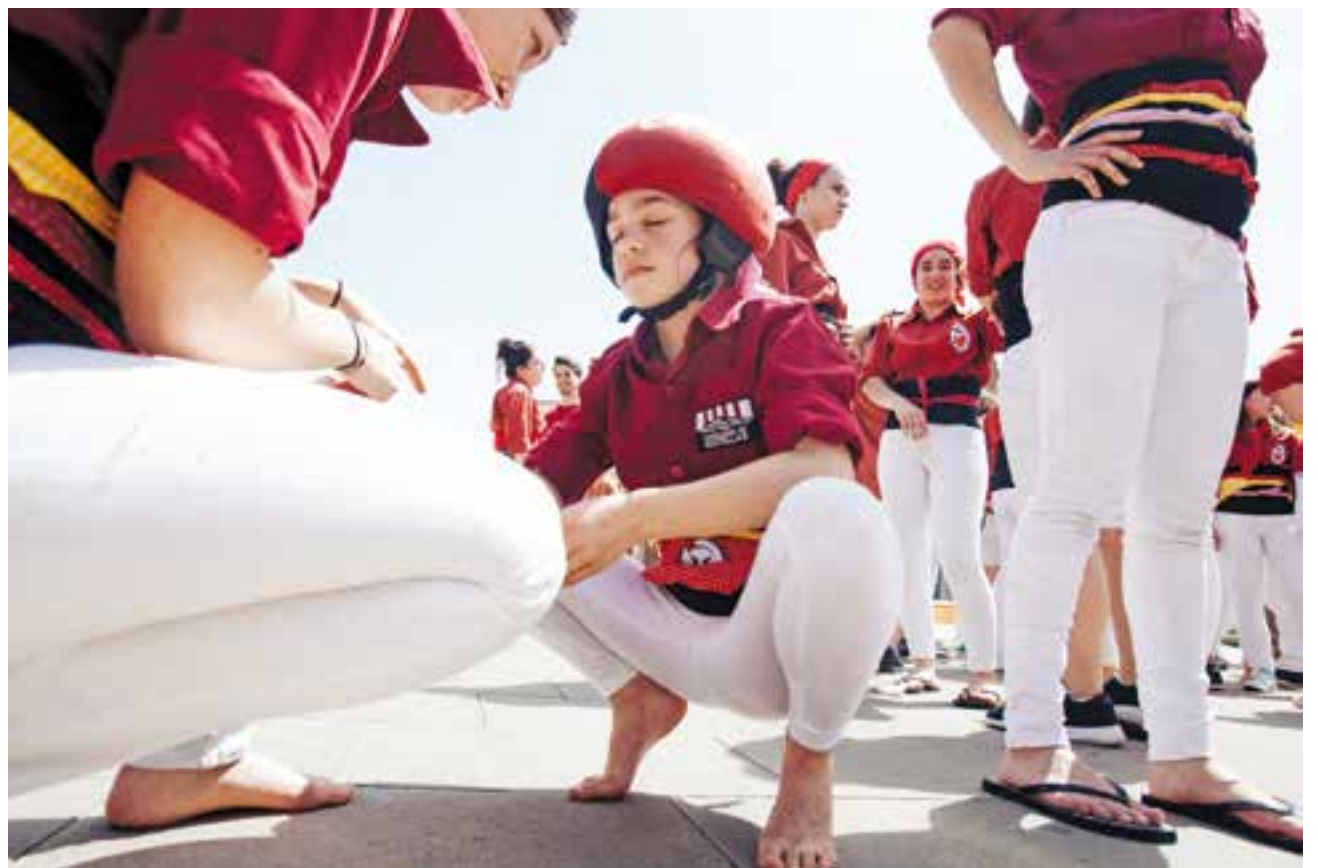
Un moment de concentració durant la celebració de la diada dels Capgirats, diumenge passat.

colatada popular. Després del berenar, els nens es van dividir en grups segons la seva edat i van fer les diferents activitats: un concurs de dibuix, jocs diversos i un taller de castells, que va acabar amb un pilar de canalla construït pels participants. La colla valora molt positivament l'experiència i no descarta organitzar més festes en futures ocasions. ➔