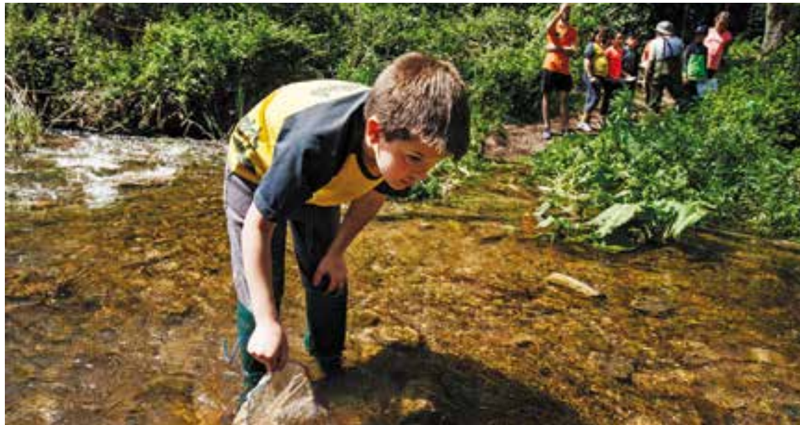
Un alumne fent el taller d'inspecció del riu en un tram proper a Can Juliana.

Els participants fan una sortida de tot un dia a la masia de Can Juliana per gaudir d'un dia d'aprenentatge, diversió i convivència que inclou diverses activitats distribuïdes en tres grups (amb els noms de bogues, llúdrigues i sabaters). Així, la festa, que es va celebrar divendres passat, inclou, d'una banda, un circuit d'aventura, amb un itinerari sobre