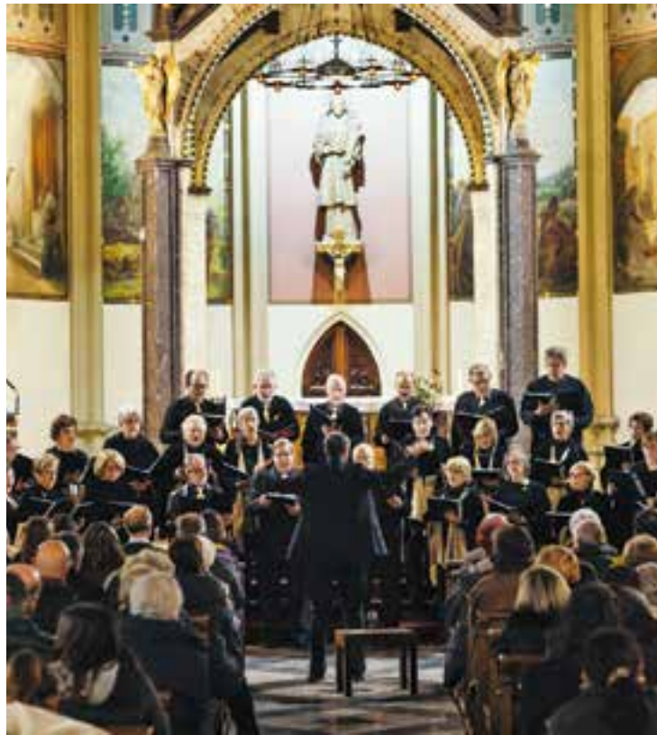
La Coral Xiribec cantant a la Capella de Montserrat, l'any 2017. || Q. PASCUAL

Actualment, la Coral Xiribec compta amb 35 cantaires. En aquesta ocasió, “cantaran “a capella” gairebé tots els temes” , excepte l'argentina, on també hi participaran dues guitarres. El concert que oferiran és un tastet del Musicoral, previst per al 2 de juny. La coral assaja cada dijous al vespre, a l'antic Ajuntament. + || M. A.