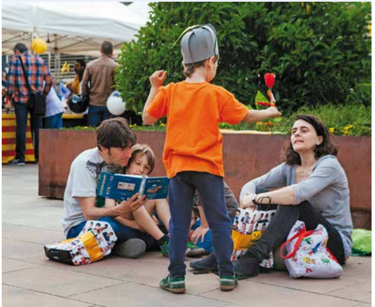
Llibres i roses van omplir dilluns passat la plaça d'El Mirador que va acollir la tradicional fira de Sant Jordi.

'La força d'un destí', de Martí Gironell i 'Las hijas del capitán', de María Dueñas, llibres més venuts