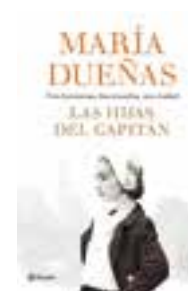
Las hijas del capitán María Dueñas