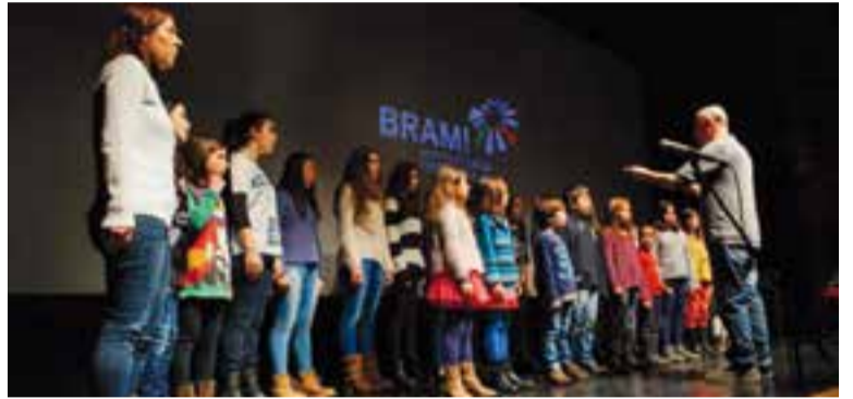
El Cor Sant Esteve actuarà al festival barceloní Bachcelona.

A diferència del cicle de cantates que interpreten BZM des de fa anys, en aquest concert l'orquestra tindrà un paper protagonista, amb músics que vindran arreu d'Europa. La Pedrera s'incorpora, aquest any, com a escenari i col·laborador del festival amb la programació d'un concert del Trio Fortuny. Hi haurà concerts a d'altres escenaris. +