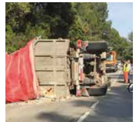
El camió bolcat dilluns passat.

Passades les 18 hores de dilluns passat un camió va bolcar al quilòmetre 25 de la carretera de Terrassa (c1415a) al seu pas per Castellar. El conductor del camió, l'únic vehicle implicat en l'accident, va patir ferides lleus tot i l'aparatositat de l'accident. Segons va informar la policia local, no es va d'haver de tallar el trànsit ja que agents d'aquest cos van poder donar pas alternatiu als vehicles que s'acostaven al punt de l'accident. + || REDACCIÓ