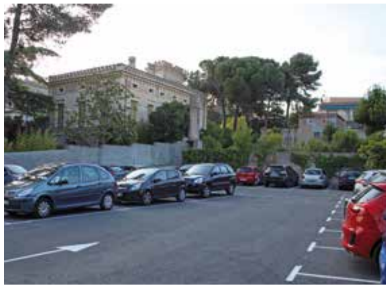
L'aparcament sota Torre Balada ha estat asfaltat recentment.

A més, l'Ajuntament crearà properament 100 noves places d'estacionament gratuït al nucli urbà. D'aquestes, 38 sortiran de l'espai situat al carrer de Sot d'en Golerès, al costat d'un dipòsit d'aigua. Una altra intervenció suposarà la creació de 45 places noves a la part superior de l'escola Bonavista i que es connectarà amb el carrer del Racó, per sobre de la plaça de Lluís Companys. Fora del nucli antic,