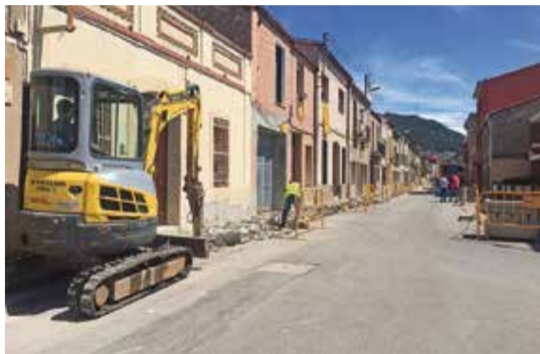
Obres d'ampliació de la vorera del carrer Sant Jaume, aquesta setmana.

aquest pla també inclourà l'ampliació de l'espai d'aparcament situat entre la plaça de la Fàbrica Nova, el carrer dels Pedrissos i la carretera de Sabadell. Aquesta àrea s'ampliarà amb 15 noves places.