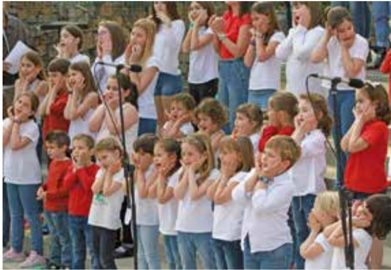
Alumnes canten 'El petit príncep' per Sant Jordi a la plaça d'El Mirador. || CEDIDA

L'escola d'interpretació, música i dansa Espaiart oferirà, com ja és habitual, unes representacions i audicions dels seus alumnes durant les properes setmanes. L'activitat està prevista a la Sala de Petit Format de l'Ateneu i l'Auditori Municipal. "Seguint amb el seu objectiu de difusió i producció cultural, Espaiart ha organitzat diverses trobades entre els alumnes i el públic" , diu la directora d'Espaiart, Sònia Gatell, en un format pensat per a tots els alumnes i cobrint les diferents disciplines que s'imparteixen a l'escola: teatre, dansa (moviment) i música, "amb temes musicals de tots els estils i amb totes les combinacions possibles" . En aquest sentit, hi tindran cabuda els instruments solistes, formacions de cambra, duets,