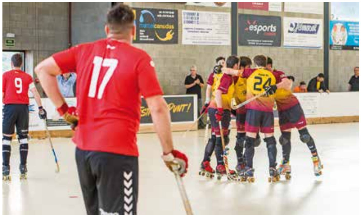
Els jugadors locals celebren un dels gols a la primera part, davant la mirada incrèdula d'un jugador del CE Vendrell.

Amb el partit a les acaballes, el Vendrell aconseguia dos gols més. El 10-6 permetia sumar tres valuosos punts als de Truyols, que servien per