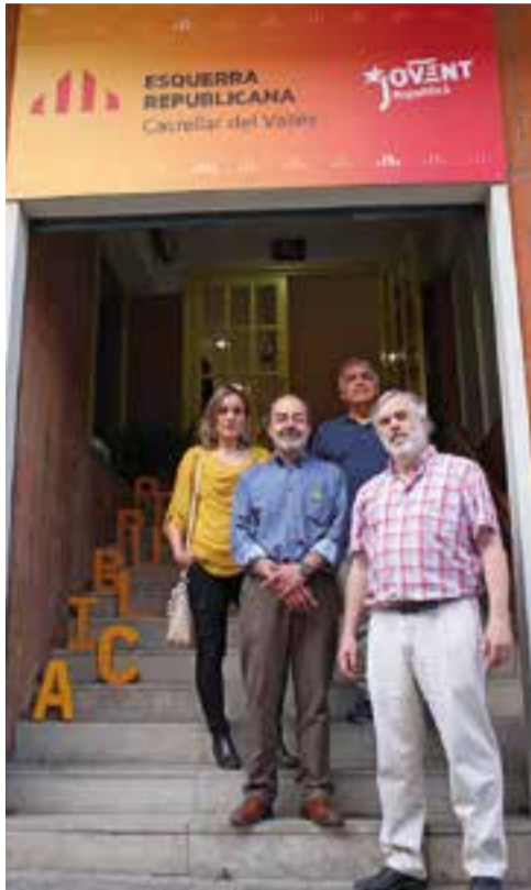
ERC acaba d'obrir un local al carrer Sala Boadella. || J. J.

El local es va inaugurar dijous passat amb l'assemblea de militants on tot apunta que Rafa Homet serà cap de llista per a les municipals de 2019