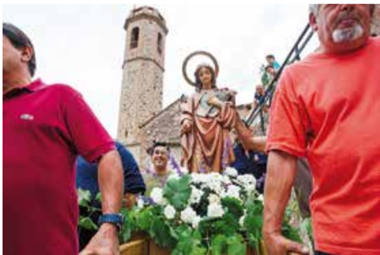
Festa de Santa Quitèria a Sant Feliu del Racó, l'any 2016.

Font participa per primera vegada com a jurat d'un festival d'aquestes característiques. Reconeix que "és molt interessant poder compartir sensacions que has tingut amb el documental, com ho veus, etc, aprens molt, reflexionant-hi conjuntament". Font és reporter i director de cinema científic i d'animació. Ha treballat a TVE Catalunya durant 30 anys, sobretot, en l'àmbit del reportatge i el documental. Al 1982 realitza el seu primer film científic en català: Espectroscòpia Mössbauer , que va obtenir diversos premis. Font també ha rebut el premi periodístic de l'aigua 2017. +