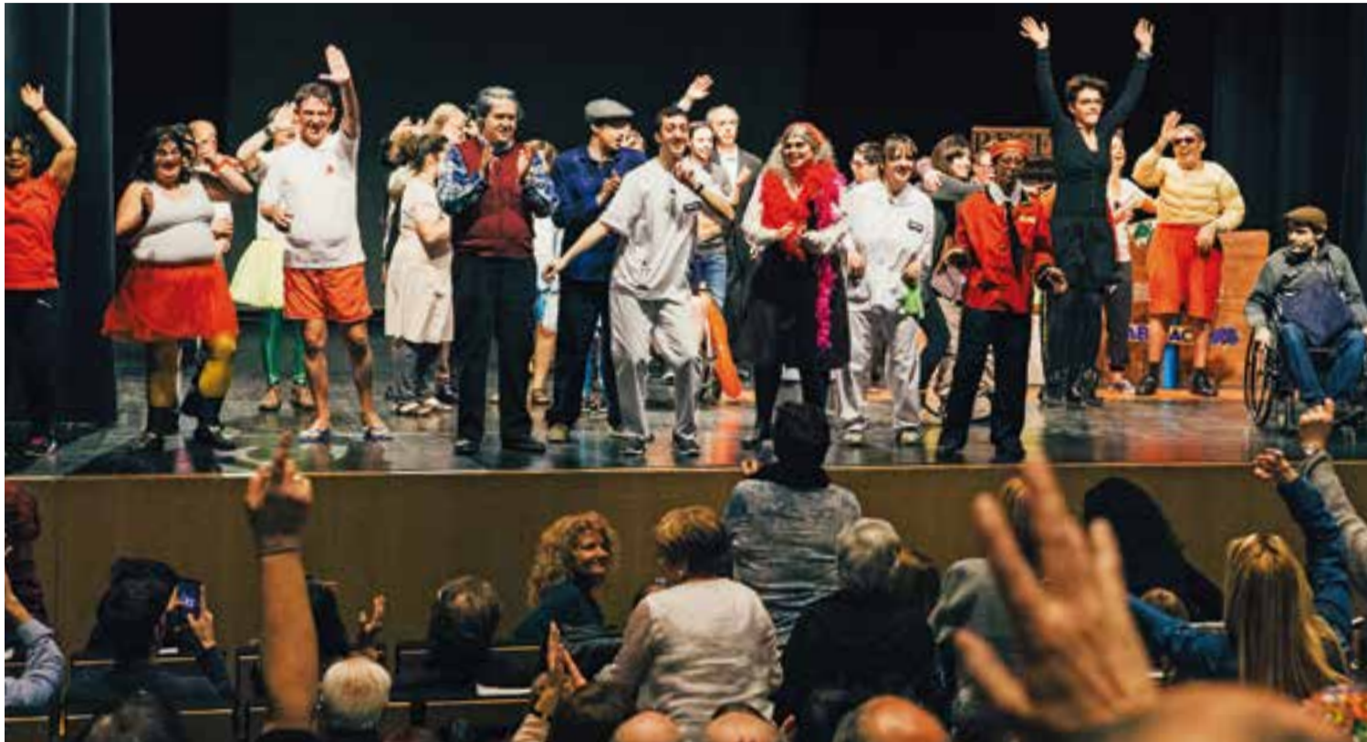
Diferents actors i actrius de l'equip del Centre Ocupacional de TEB Castellar al finalitzar la representació del muntatge 'Oh-tel' al gener de l'any passat.