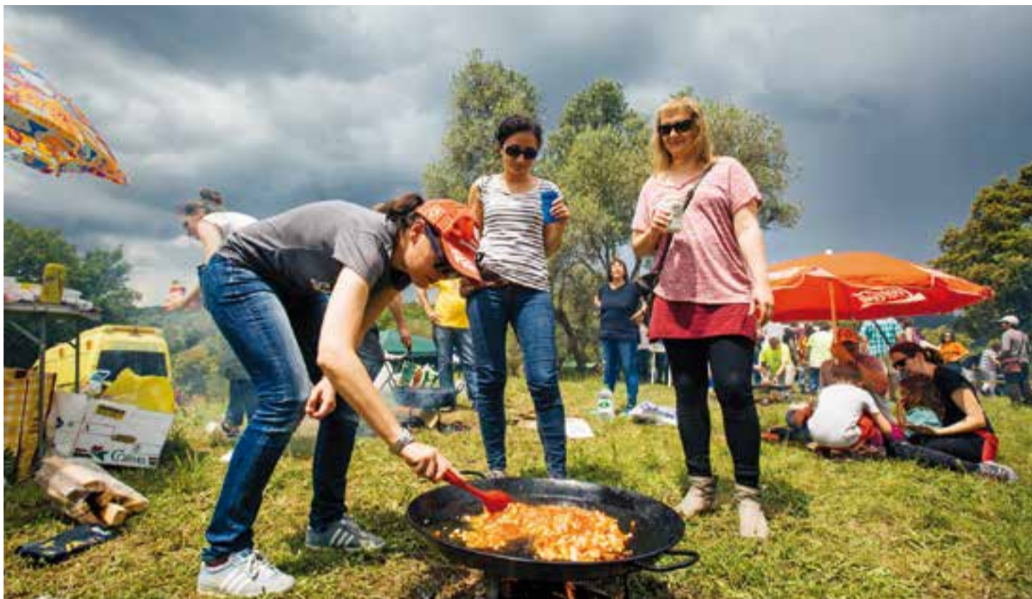
Un grup de participants novells preparen la seva paella a l'Aplec de Castellar Vell ja amb l'amenaça de pluja.