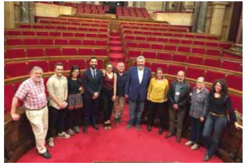
Els guanyadors de la beca Oriol Papell, i membres d'ERC, amb Roger Torrent