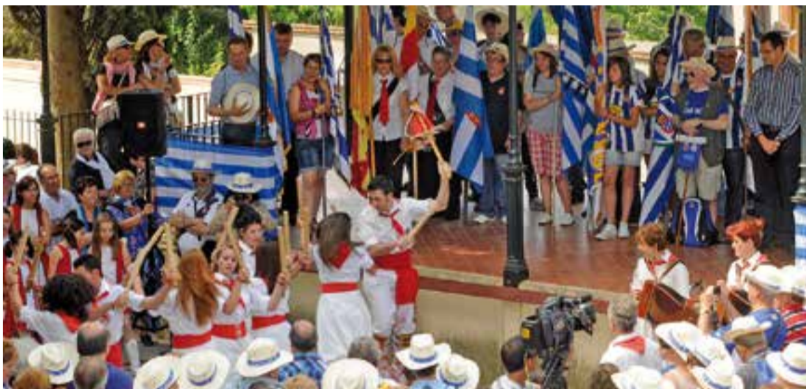
Un dels moments històrics de la Penya va ser l'organització del 21è Aplec de Penyes de l'Espanyol ara fa 7 anys.

socis de la penya i moltes vegades els convidem quan els trobem pel carrer, tot i que costa molt convencer-los".