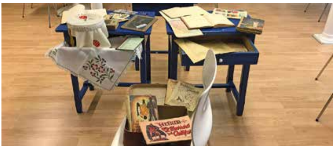
L'Arxiu Municipal va celebrar el Dia Internacional dels Arxius amb una exposició de material escolar.

Dijous 21, a partir de les 16.45 h, tastet d'instruments amb la guitarra, guitarra elèctrica, piano, violí, violoncel i bateria. També es farà un dansem i cantem en família, audicions individuals i de cambra, concurs de bandes sonores, assaig obert del Cor happy Rock i jam session amb el Benja, el Toni i el Joan. ➔ || M. A.