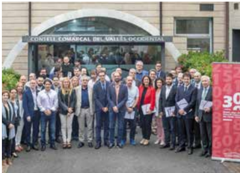
Foto de família dels representants del Pacte per la Reindustrialització.

Els municipis de la comarca i els agents socials pacten accions concretes