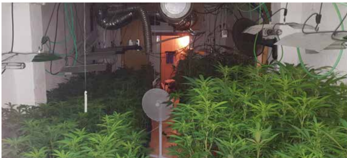
Plantes de marihuana intervingudes a Can Font per la policia local de Castellar.

L'operació es va fer gràcies a un avís anònim que va alertar que a una casa ocupada hi havia una plantació. Es tracta del segon gran comís en pocs mesos a Can font