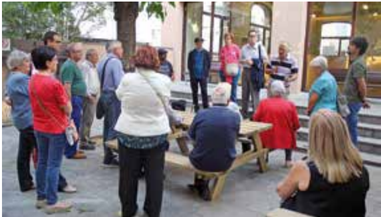
Concentració en defensa de les pensions públiques, dimarts passat || R.G.