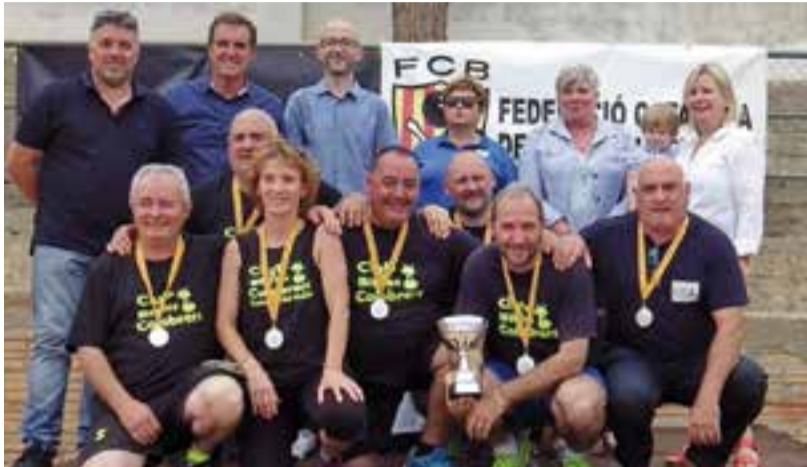
Els jugadors del CB Colobrers després de la disputa de les partides.

El Club Bitlles Castellar segueix d'enhonorabona una setmana més amb la consecució de la segona posició a la fase final de la Copa Catalunya de clubs, on debutava aquesta temporada. La Galera, a les terres de l'Ebre, va acollir als vuit equips finalistes, els primers classificats de cada grup. La igualtat va ser la tònica de la jornada, amb molt pocs punts de diferència a les primeres partides, destacant el José Cruz, del Colobrers, amb 90 punts a la segona partida.