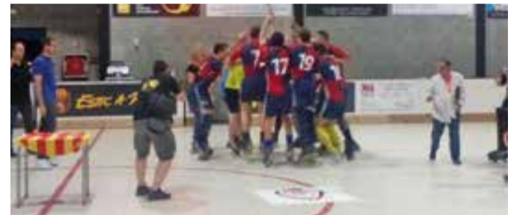
L'Igualada HC celebrant la victòria aconseguida al Dani Pedrosa.