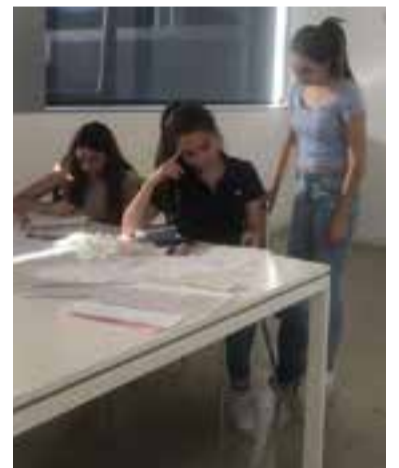
Joves estudiant a l'Open Surf.

Després de dies d'estudi i nervis ara toca esperar els resultats, que es publicaran el 27 de juny. †