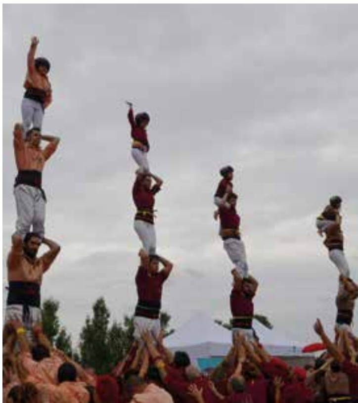
Actuació dels Castellers de Castellar - Capgirats al Papiol.

Cirera del Papiol juntament amb la Colla Castellerà Salats de Súria i la Colla Castellerà de Molins de Rei. Els de Castellar van començar l'actuació amb dos pilars de 4 simultanis. Quan la colla de Molins de Rei, els Matossers, havia descarregat el seu primer castell, la pluja va interrompre l'actuació i va fer que les colles s'haguessin de traslladar al pavelló municipal, on es va acabar l'actuació sota cobert. Els capgirats van fer un 3 de 6, un intent desmuntat de 4 de 6, un 3 de 6 amb agulla, un 4 de 6 i un pilar de 4 per sota. ➔