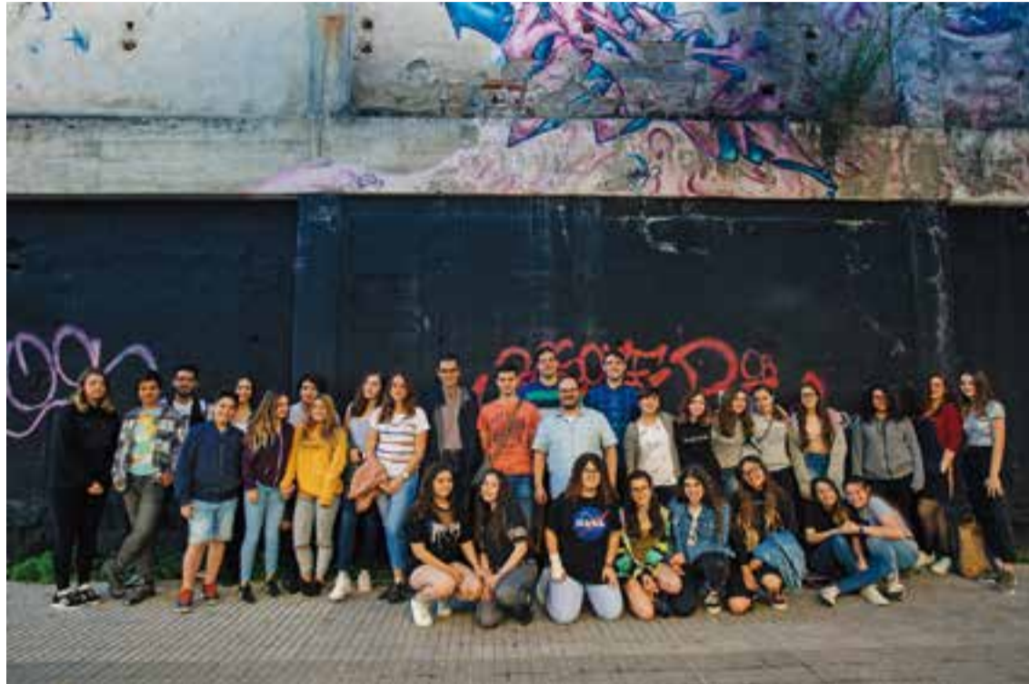
Un grup de joves a la zona de l'Espai Jove on es farà el casal amb l'alcalde i el regidor de Joventut, dijous passat.

Entre d'altres, Pérez va afirmar que aquest nou punt de referència per a la joventut podrà comptar amb espais de reunió per a les entitats juvenils i un punt d'informació i trobada que permeti la canalització i dinamització de les demandes dels joves i l'assessorament en temes d'educació i salut. També va explicar que disposarà d'espais d'estudi i per fer treballs en grup i sales per fer activitats i tallers. A més, s'aprofitarà la creació d'aquest espai per promoure la creació d'un grup que organitzi activitats cultu-