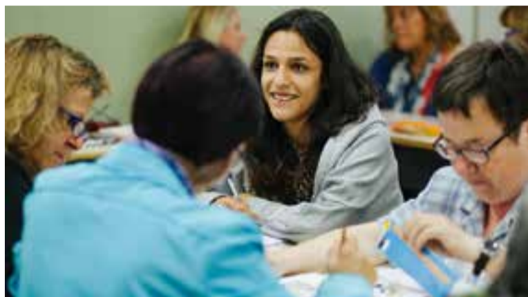
Alumnes en una de les classes de l'Escola Municipal d'Adults

A banda de l'ampliació amb classes d'informàtica, l'oferta per al curs 2018-2019 inclou moltes altres propostes, com la Formació instrumental de primer, segon i tercer nivell , que