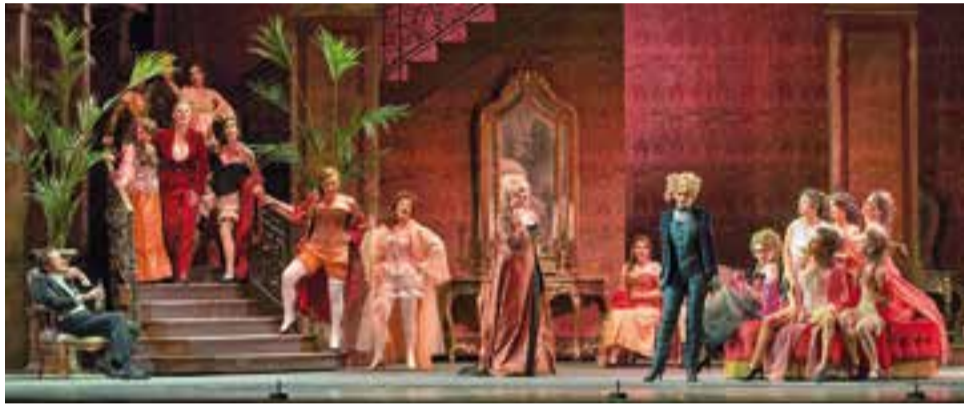
‘Manon Lescaut’, de Giacomo Puccini, es podrà veure per pantalla a Castellar del Vallès.

Dissabte 16, als Jardins del Palau Tolrà, es projectarà aquesta òpera de Giacomo Puccini en una pantalla gegant i en alta definició