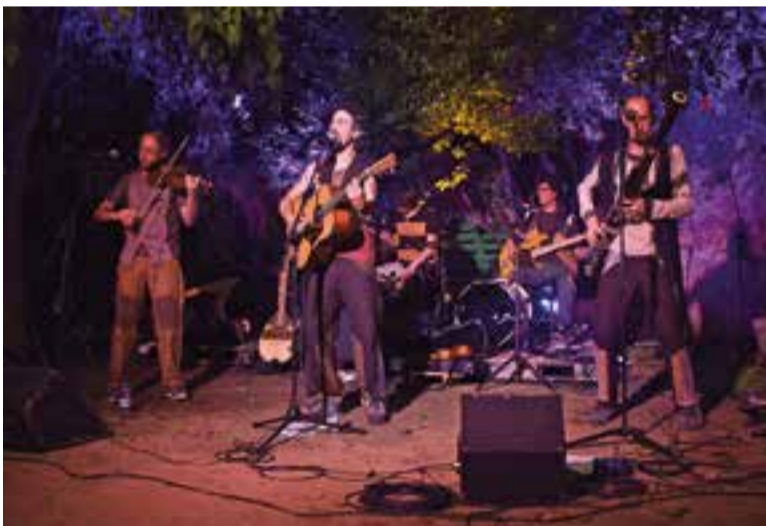
El grup Saurí al pati de Cal Gorina, divendres passat.

Rovira, que ha estat a orfenats i escoles de Nepal oferint espectacles, també ha viatjat per Àsia, Àfrica i el Sud d'Amèrica. El disc que va presentar a Cal Gorina n'és un fruit: "les olors i les cultures d'aquest món inspiren" . Però, tot i la diversitat que ha conegut el cantant rondant per arreu, segueix defensant el mateix que propugna a les lletres de les seves cançons: "el món és molt plural, però en el fons ens uneix a tots el mateix, i és que no deixem de ser tots persones" . +