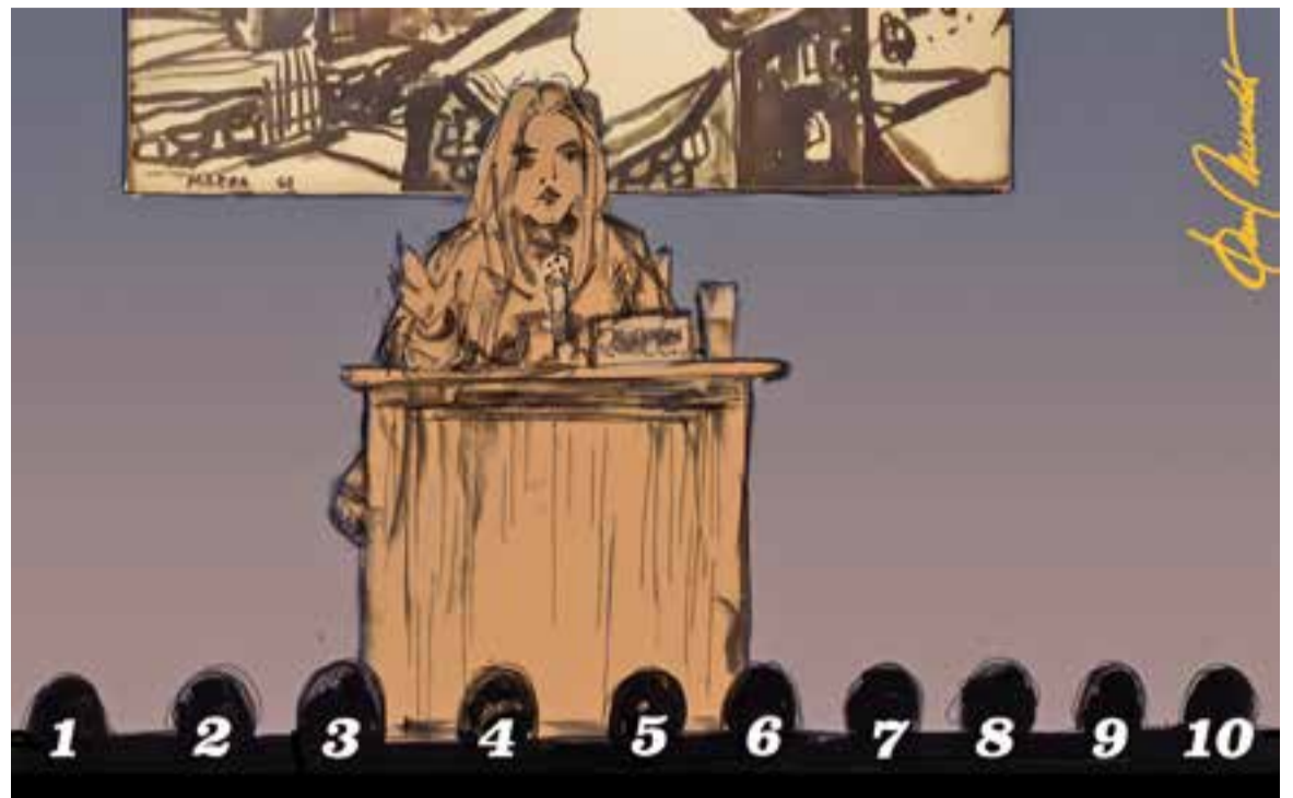
© Primera dècada. || JOAN MUNDET

Les activitats van augmentar: Sessió de cinefòrum, sortides culturals,