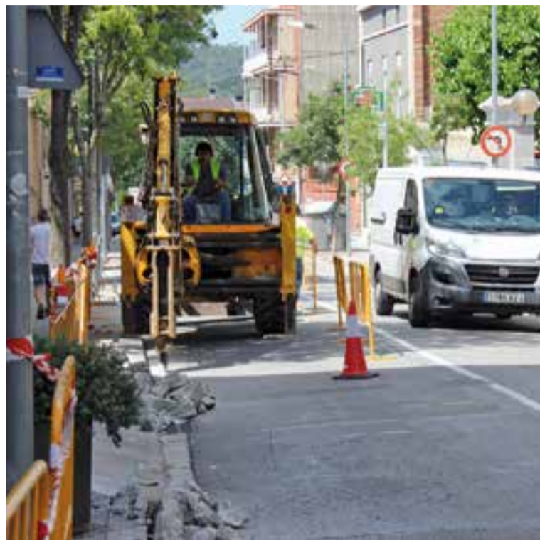
Aquesta setmana han començat les obres a la carretera de Sentmenat.

Amb motiu d'aquesta actuació, que tindrà una durada de tres setmanes, el trànsit a la carretera de Sentmenat quedarà afectat finalment en menor mesura del previst inicialment, ja que es donarà pas alternatiu als vehicles que circulin per aquest tram. Per tant, s'hi podrà circular en els dos sentits de la marxa. Segons les previsions, el trànsit només s'haurà de tallar entre un o dos dies quan es facin els treballs d'asfaltat. "Intentem compatibilitzar el funcionament normal dels carrers amb les obres. Els autobusos han de continuar passant i hem de garantir l'accés al pàrking.