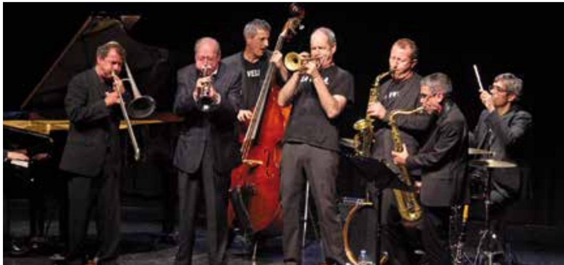
La Vella Dixieland, durant el concert de Cloenda de L'Aula, dimarts passat a l'Auditori