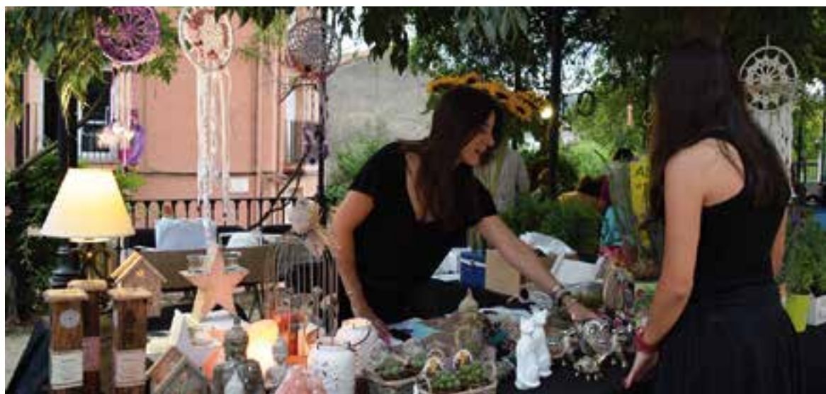
La I edició de la Nit embruixada es va fer als Jardins del Palau Tolrà

La proposta Tast d'estiu i la Nit embruixada, a la plaça de Catalunya