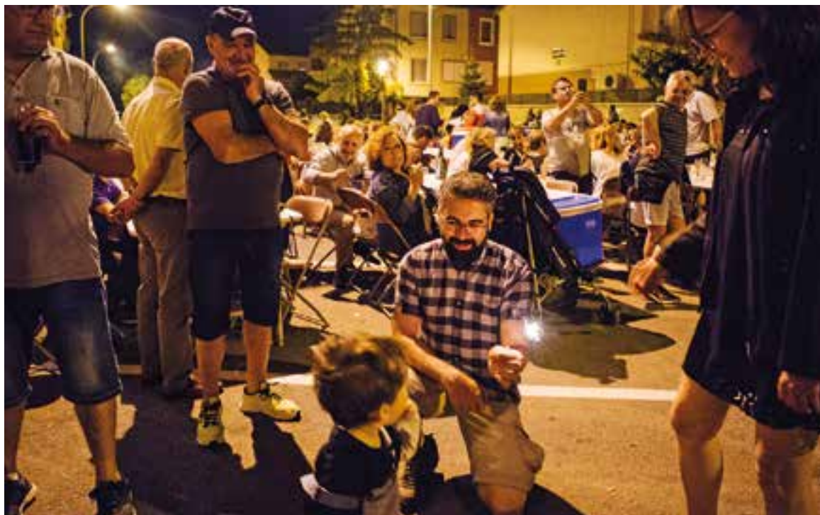
A dalt, encesa de la foguera de Sant Joan a la plaça d'El Mirador. A baix, ambient familiar a la festa major de Can Carner la nit de dissabte.