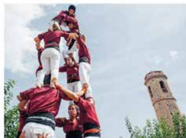
Del 5 al 8 de juliol Diferents horaris i espais Festa Major de Sant Feliu del Racó