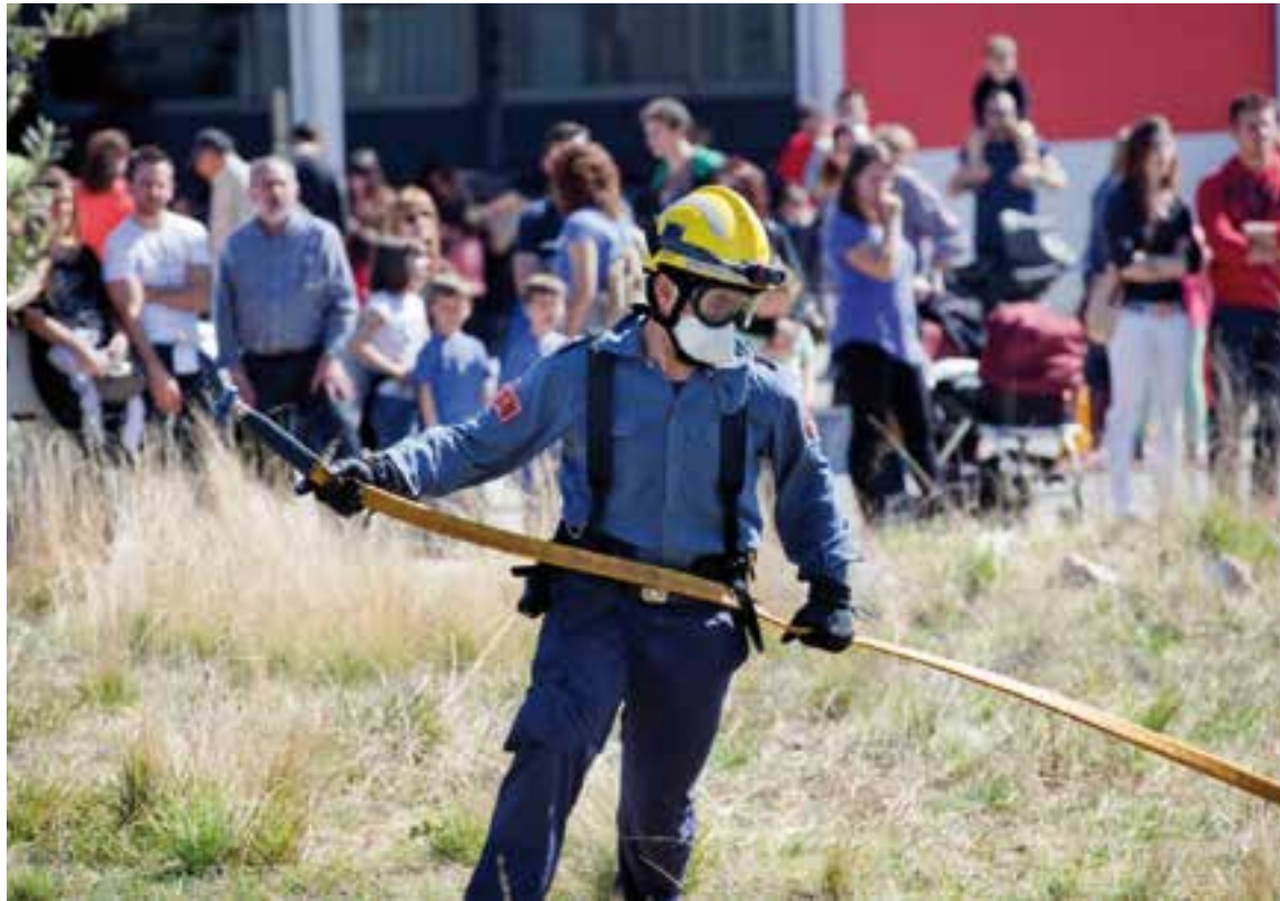
Imatge d'arxiu de la Festa del Patró dels Bombers al parc de Castellar del Vallès

Un dels principals condicionants quant a la planificació del protocol local de prevenció i extinció d'incendis és que prop del 80% de Castellar