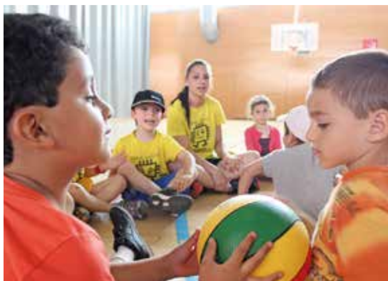
El Club Patí Castellar del Vallès ofereix el casal d'estiu Xispis || ARXIU