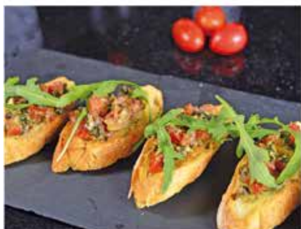
Dijous 5 de juliol 19 h - Safareigs de la Baixada de Palau Juliol Jove. Taller de tapes Inscripcions a l'a/e castellarjove@castellarvalles.cat