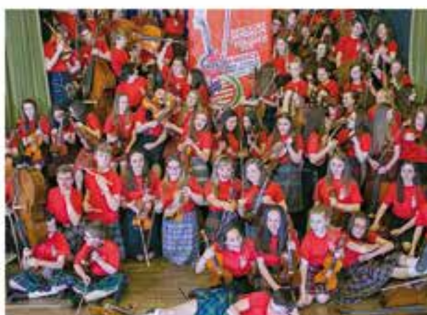
Divendres 6 de juliol 21.30 h - Jardins del Palau Toirà Concert de l'Ayrshire Fiddle Orchestra d'Escòcia