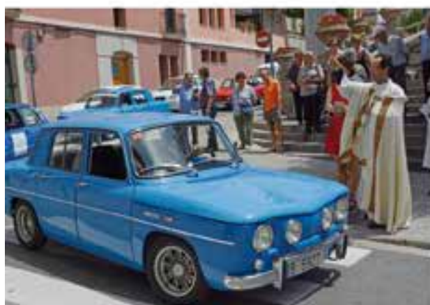
Diumenge 1 de juliol De 10 a 13 h - Pl. d'El Mirador Festa de Sant Cristòfol