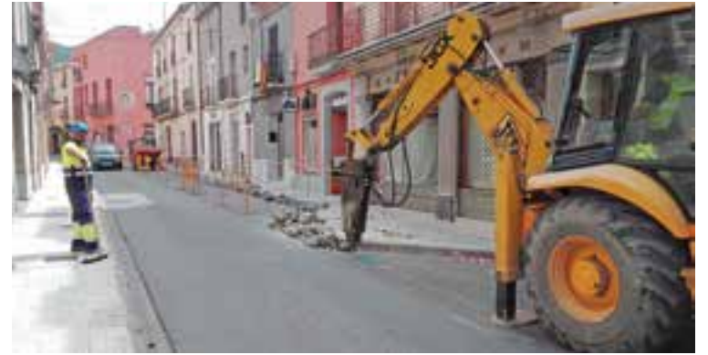
Uns operaris de Rogasa fent servir el martell hidràulic dimarts passat.