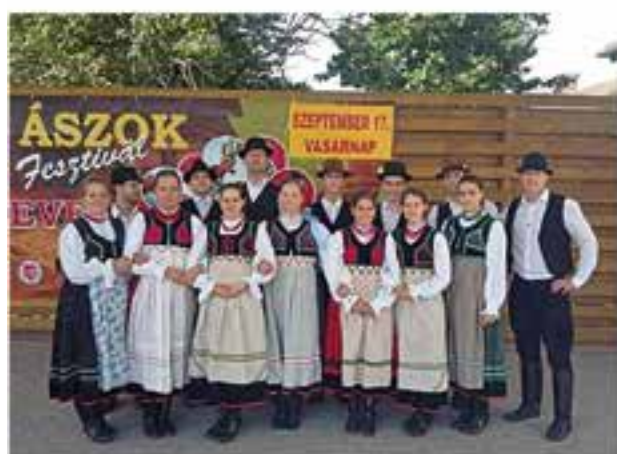
Divendres 6 de juliol 21.30 h - Pl. d'El Mirador Dansa folklòrica: Kéve de Ráckeve