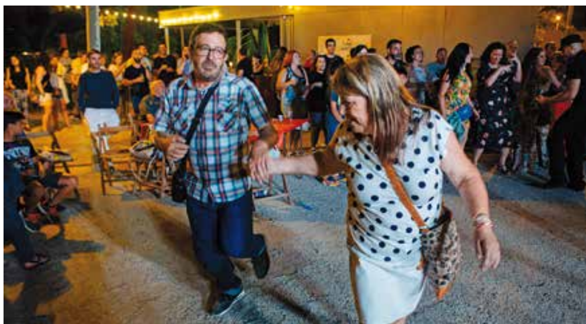
Ambient festiu a la Plaça de Catalunya durant el concert en directe.