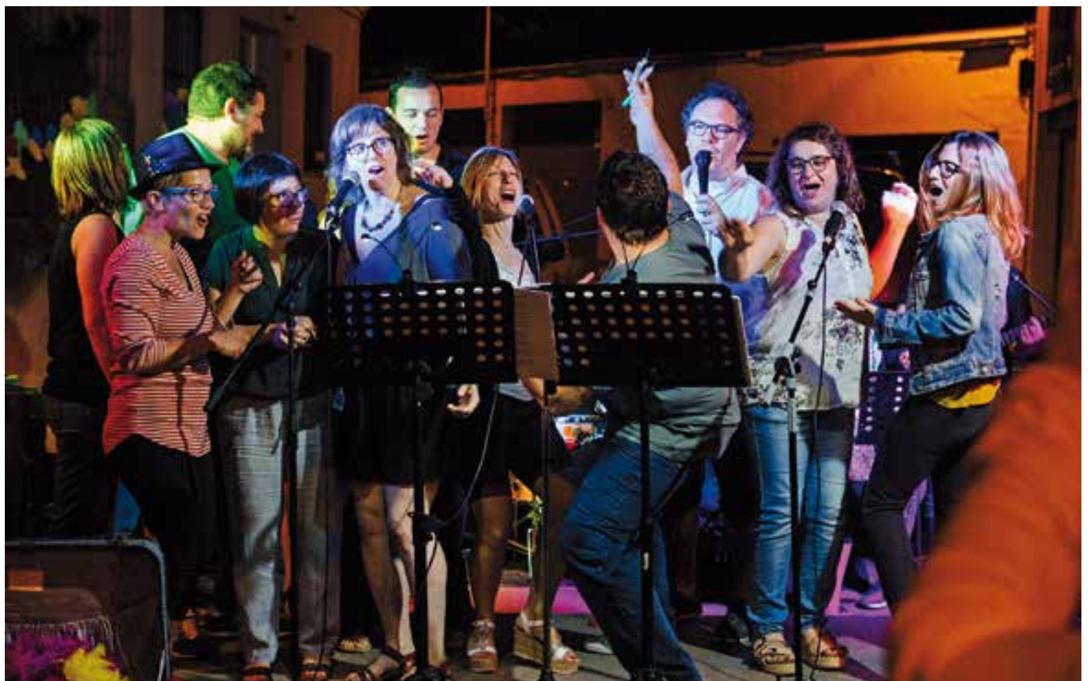
Veïns del carrer Retir a dalt de l'escenari cantant les versions del karaoke itinerant Toca-me-la.

Un centenar de veïns dels carrers Retir, Bassetes i Calvari tampoc van voler-se quedar sense festejar la revetlla. Per primera vegada, van organitzar-se per celebrar el Sant Joan, després d'un sopar popular.