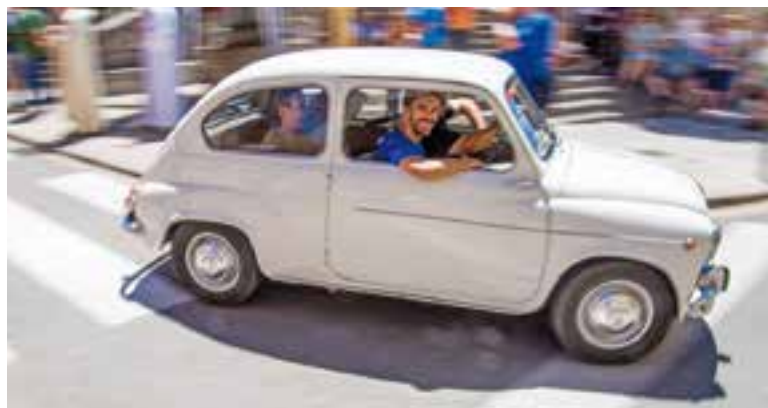
Un Seat 600 després de fer la benedicció a la festa de l'any passat. || A.S.A.