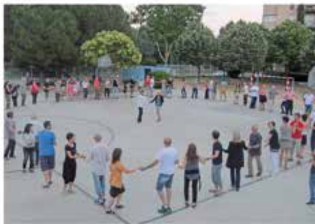
Dimarts 3 de juliol 20.30 h - Pl. de Catalunya Open curs de bachata i roda cubana