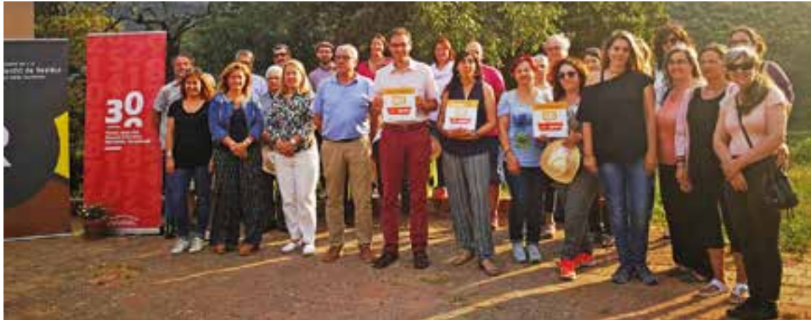
Acte d'agraïment a les persones voluntàries del Recooperem, dilluns passat a la Vall d'Horta, a Sant Llorenç.

Durant el curs, les escoles de Castellar del Vallès han repartit un total de 3.826 àpats