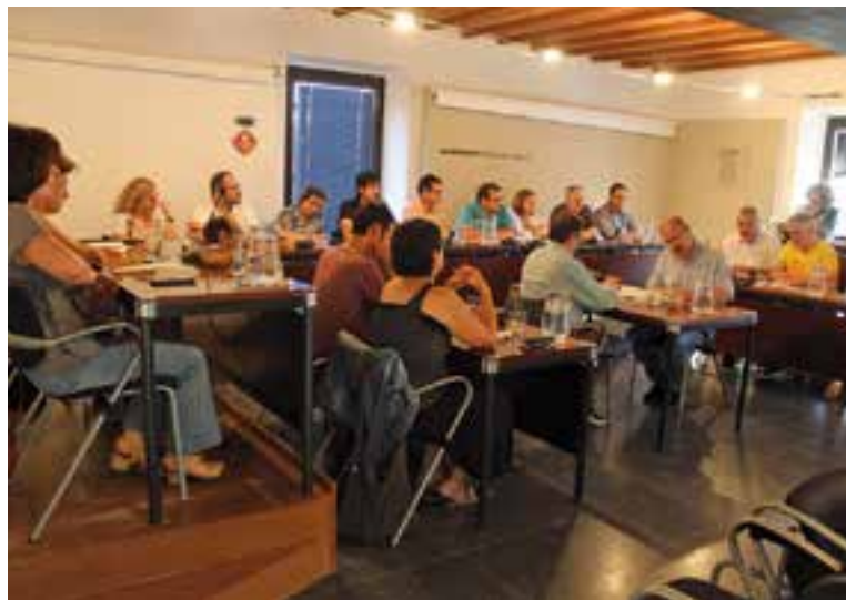
Imatge del ple de dimarts passat a Ca l'Alberola.