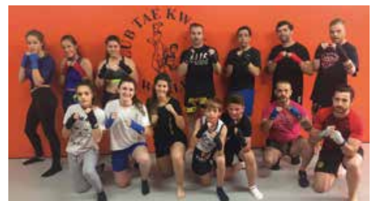
Els participants a la jornada interclubs organitzada pel Taekwondo World. || CEDIDA

L'entrenament amistós va tenir lloc a les instal·lacions del Gimnàs World, on una vintena d'alumnes dels dos clubs van gaudir de gairebé dues hores d'enriquiment personal. ➔ || A.S.A.