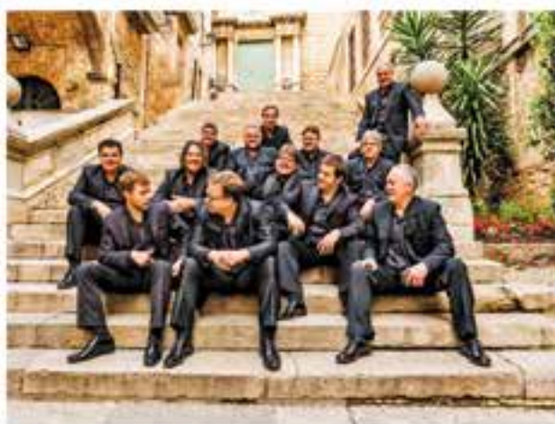
Dijous 5 de juliol 21.30 h - Pl. del Mercat Sardanes amb la Cobla La Principal de la Bisbal