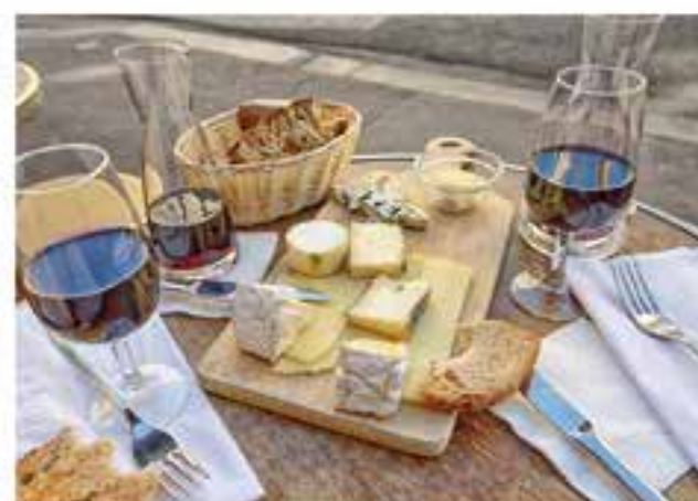
Divendres 6 de juliol 22 h - Safareigs de la Baixada de Palau Juliol Jove. Maridatge de vins i formatges Inscripcions a l'a/e castellarjove@castellarvalles.cat