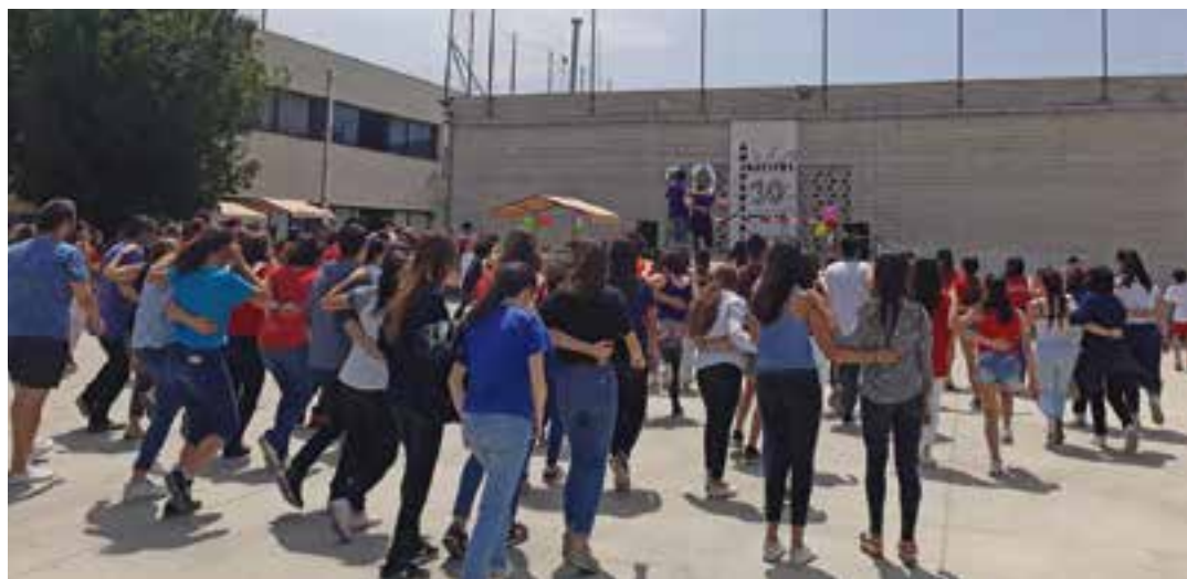
El passat 29 de maig, els joves de l'Institut Castellar van estrenar-se com a balladors de swing amb SonaSwing.

el de buscar la perfecció, sinó treballar la coordinació, l'expressió corporal "i coreografies assolibles per a ells" , diu la Sara. El swing no té un cost elevat i les ballades, normalment, són gratuïtes "i això el fa un lleure molt accessible per a tothom" , diu la Sara.