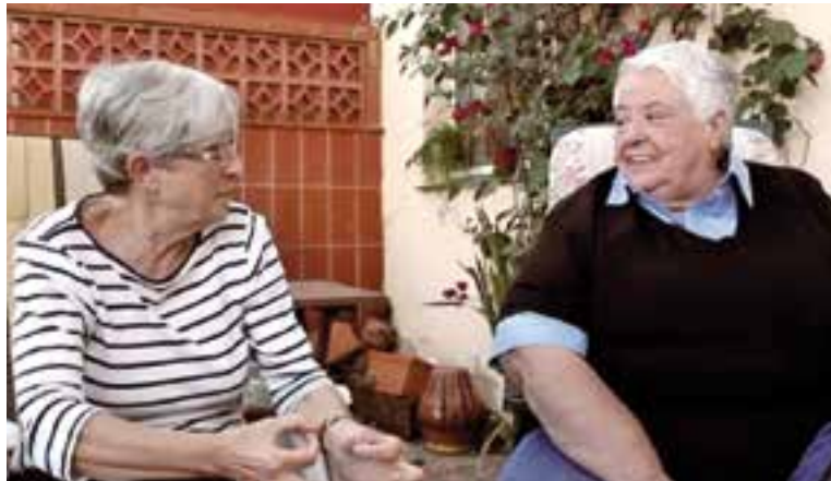
Imatge del documental 'Lluitadores', que es projectarà a la Biblioteca

Així, a partir de les 8 del vespre, tindrà lloc la lectura del manifest, que enguany posarà l'accent en la diversi-