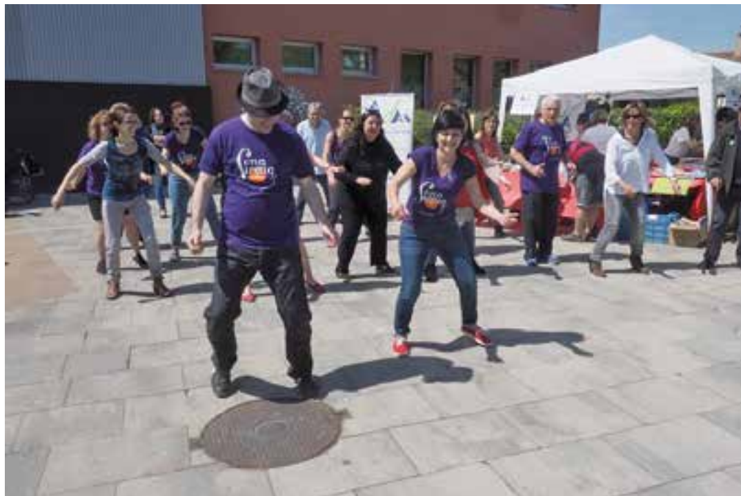
Diversos usuaris de Suport Castellar, ballant per Sant Jordi a la plaça d'El Mirador.

L'objectiu de les classes que SonaSwing fa amb Suport Castellar no és