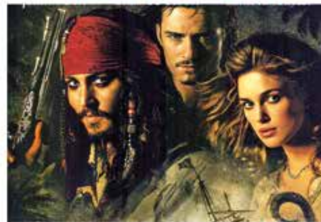
Dimecres 4 de juliol 19.30 h - Auditori Municipal Cinema: La maldición de la Perla Negra