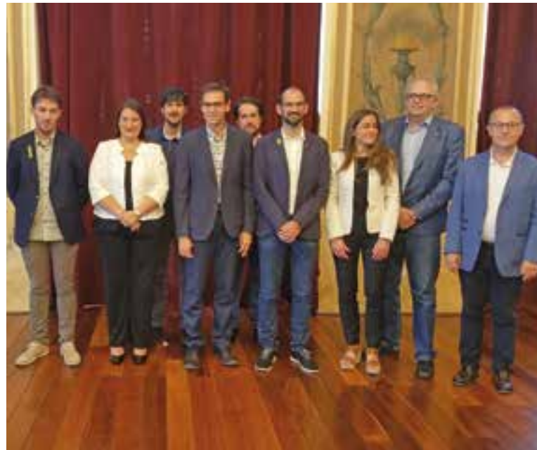
Alcaldes de Castellar, Sabadell i Barberà amb membres impulsors del projecte.

Entre altres coses, amb aquest projecte es vol fomentar el suport a la cultura emprenedora i la descoberta de noves tecnologies, nous productes i servei en l'àmbit de la innovació i el disseny aplicat a la indústria amb l'objectiu final d'aconseguir professionals qualificats i un territori amb competències reforçades en aquest àmbit. L'Ajuntament de Sabadell serà l'entitat coordinadora del Pla i vetllarà per enfortir i cohesionar tots els actius existents en aquesta especialització al mateix temps