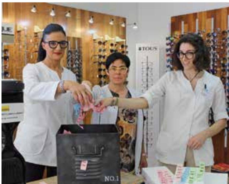
Sorteig a Optimón Òptics dilluns passat al matí.

L'òptica, que va néixer l'any 2000, és un centre de salut visual especialitzat en Optometria, Teràpia Visual, Baixa Visió, Retinoscopia, Higiene Visual, Contactologia, Audiologia i Control de pressió ocular. †