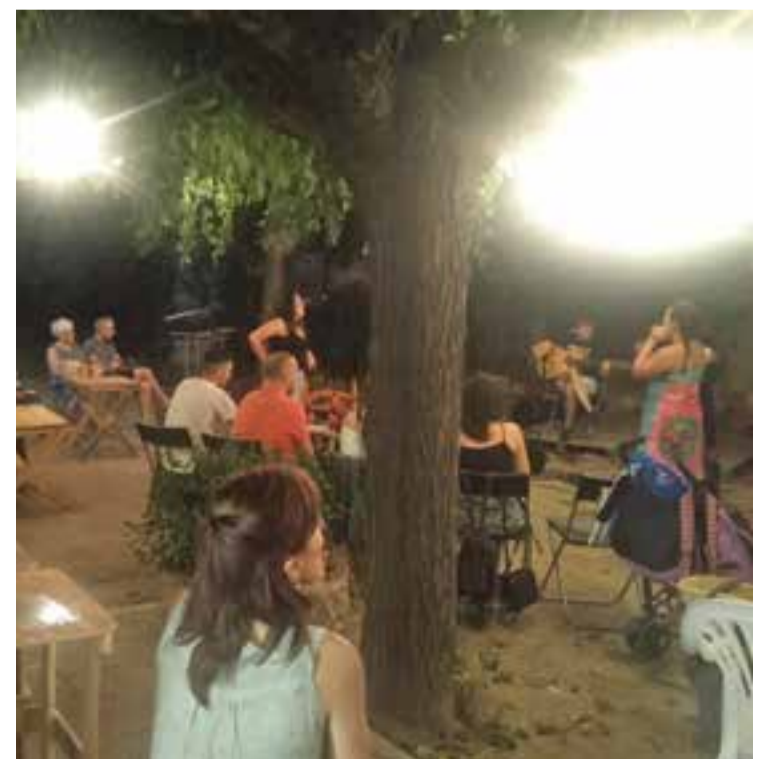
Concert de Dtumbaga divendres passat al pati de Cal Gorina

Per això, Cal Gorina reclama una coordinadora d'entitats a nivell de municipi per a generar xarxa i estratègies de col·laboració "entre totes les associacions que treballem per a fer de Castellar un poble actiu, viu i ric social i culturalment". ✦ || REDACCIÓ