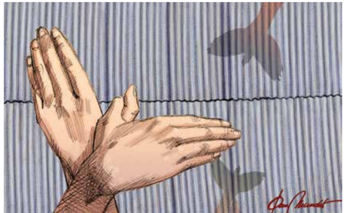
© Ocells a l'Uralita. || JOAN MUNDET

ventari exhaustiu de tots els sostres i teuladetes d'Uralita que encara queden repartides arreu del poble i que a vista d'ocell contrasten amb la seva grisor.