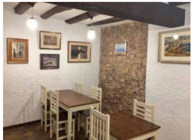
Una petita mostra dels quadres que acollirà el restaurant La Taberna del Gall.