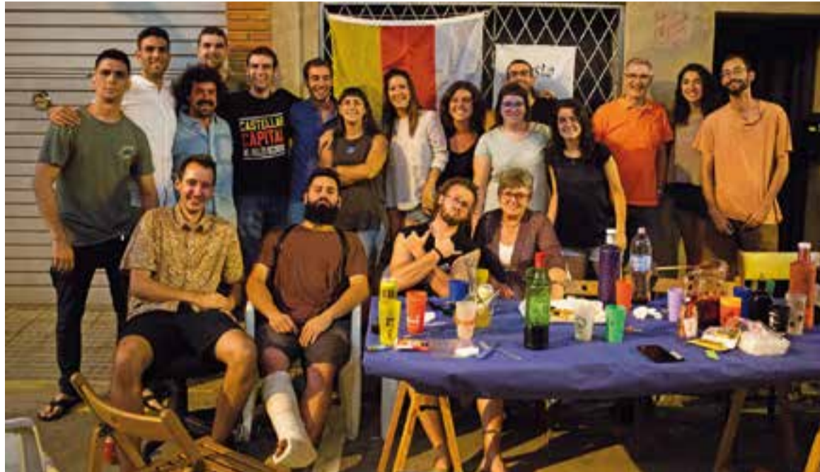
Veïns, amics i famílies es reuneixen al voltant del tradicional sopar de carrer de dissabte a la nit a la festa del Pla.

I tot i el pas del temps, l'esperit de germanor no es perd. Ni tampoc l'orgull de pertinença. "Jo hi he vingut cada any des que era petit" , comentava, cofoi, un castellanenc, el dissabte a la nit. El Toni hi va tornar a fer una copa, encara que ja no hi viu, tampoc: "Tinc molts records