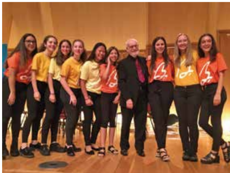
Ton Koopman, envoltada d'algunes cantaires del Cor Sant Esteve.

El Cor Sant Esteve acaba les activitats d'aquest curs amb aques-