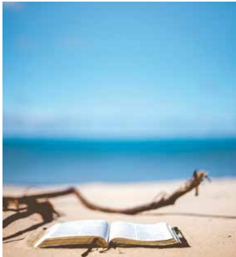
Llocs com la platja són ideals per encomanar-se a la lectura.