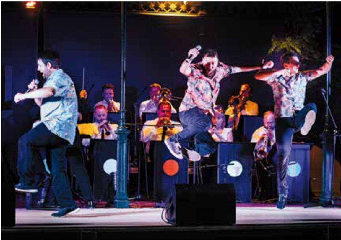
La Companyia Loropardos balla a l'escenari dels Jardins del Palau Tolrà en la seva actuació de divendres passat.

Es presenten a l'escenari un alcalde fanfarró que deixa a l'altura del betum Sentmenat, un Guàrdia Civil amb tics franquistes i un mossèn bonhomí i de tarannà babau. Tots tres actors, caracteritzats de forma distingible amb un barret. El policia amb un tricorni, és clar. El trio de la Companyia Loropardos, acompanyat per la catorzena de músics dels Lluïsos Coblà, augura un capvespre divertit als Jardins del Palau Tolrà, d'aquells que, a força d'esclafir a riure, posen de bon humor. És divendres i la injecció d'alegria que proposen pot durar tot el cap de setmana. L'espectacle, que combina teatre xiroi i música d'orquestra, ressuscita el disc de la Trinca 'Festa Major', i també l'entranyable ambient que es vivia fa més d'una cinquantena d'anys en aquesta celebració: "Tenim preparat un repertori de luxe que us farà reviure, sense moure-us de la cadira, les festes majors d'abans", explica un dels tres actors, que convida les gairebé tres-centes persones del públic a deixar-se portar "per la música i la màgia" de la representació.