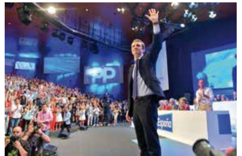
Pablo Casado saluda els assistents al congrés que el va nomenar president.

La renovació interna del PP a nivell espanyol arriba només dos mesos després que s'imposés la moció de censura de Pedro Sánchez contra Mariano Rajoy, fins aquell moment líder indiscutible del PP. Després de ser desallotjat de la Moncloa, Rajoy va presentar la dimissió com a president del PP i va mostrar-se neutral davant del procés que ha facilitat a Pablo Casado fer-se amb el comandament de la força política més votada a Espanya. + || REDACCIÓ