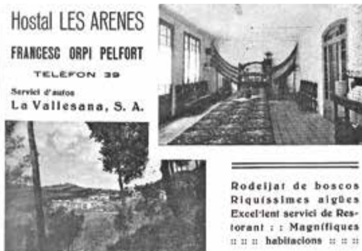
Anunci publicat a la guia de l'estiuejant Catalunya Il·lustrada (1933-1934)

Castellar del Vallès, com altres poblacions de la comarca, van esdevenir a principis del segle XX lloc d'estiueig. "La muntanya a les portes de la capital" i "prendre les aigües" eren un reclam per moltes famílies de Sabadell, Terrassa i Barcelona. La guia de l'estiuejant Catalunya Il·lustrada (1933-1934) –abans no érem turistes ni viatgers, sinó estiuejants- explicava que Castellar