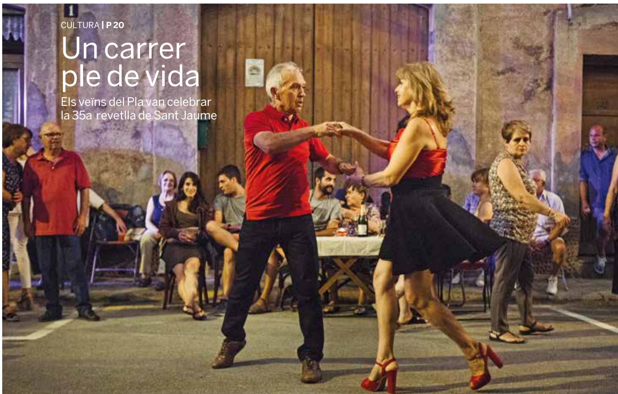
Una parella va exhibir el seu talent per als balls de saló durant la revetlla de Sant Jaume, que va tenir lloc dissabte passat i va reunir centenars de veïns.

Els veïns del Pla van celebrar la 35a revetlla de Sant Jaume