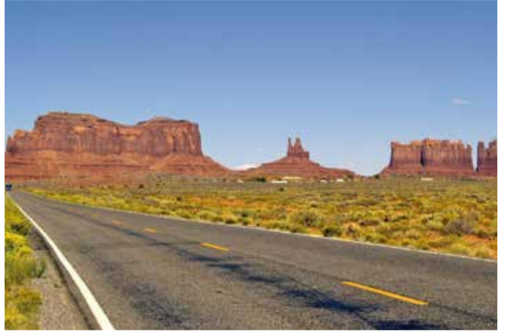
A dalt, imatge del Monument Valley, a Arizona (EUA). A baix, el llac Schluch, a la Selva Negra (Alemanya).

Els professionals d'aquest àmbit també tenen les seves preferències: "Còrsega i Sardenya són molt boniques. Còrsega té moltes platges salvatges, no té tants macro-hotels. Per mi les illes del mediterrani són les millors" , conclou Triviño. +